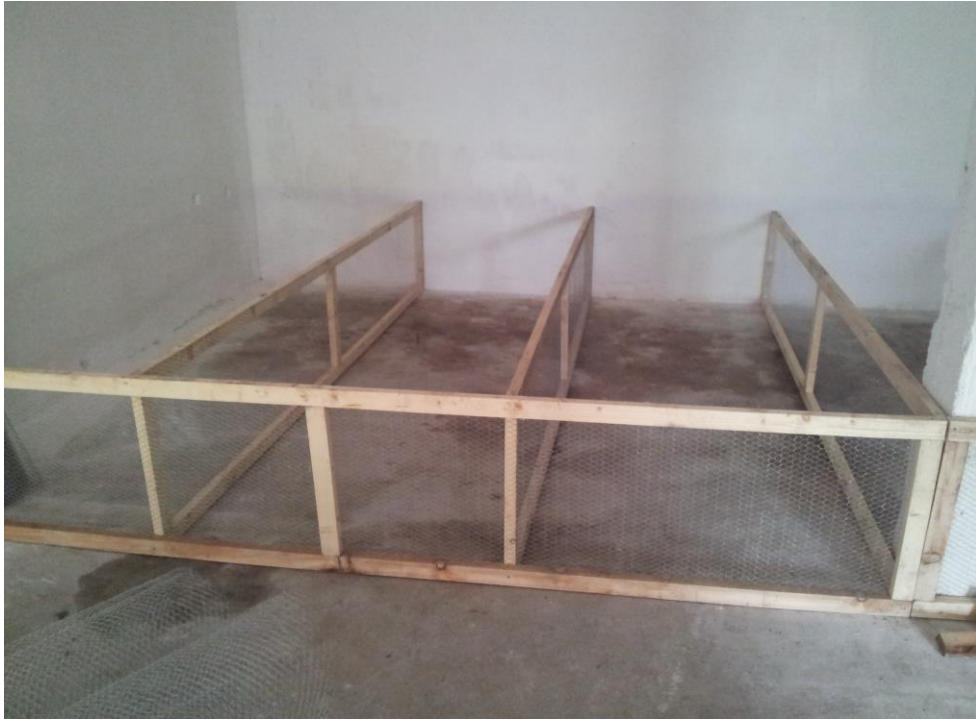
Slika 1. Priprema objekta za tov pačića