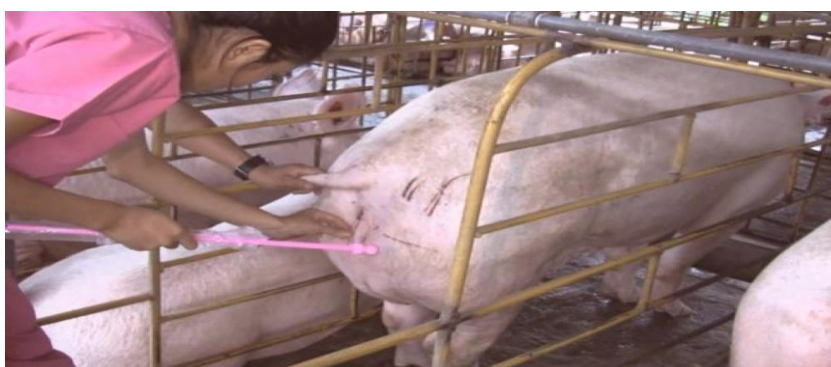
Slika 13. Umjetno osjemenjivanje