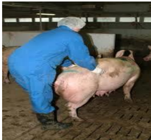
Slika 11. Lumbalni test

Najbolji i najtočniji način za određivanje optimalnog vremena pripusta krmača i nazimica su tzv. lumbalni test (slika 10.), te test jahanja (slika 11.). Plotkinju treba pripustiti pod nerasta čim se otkrije da mirno stoji. Preporuča se 8 - 12 sati nakon prvog pripusta ponoviti isti.