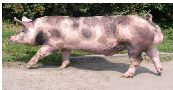
Slika 6. Nerast pasmine pietren

Krmača pietrena prasi 9 - 10 prasadi, ranozrela je pasmina, u Belgiji se tovi do mase 90 - 95 kg. Prosječni dnevni prirasti su oko 750 grama, a zahtjeva 2,9-3,3 kg hrane za kilogram prisrasta. Dugo vremena smatrana je pasminom s najvećim postotkom mesa u trupu (64 %), ali kasnije su je u tom svojstvu pretekli suvremeni hibridi svinja (Kralik i sur., 2007.).