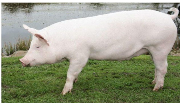
Slika 1. Veliki Jorkšir

Veliki jorkšir je pobudio ogromno zanimanje i divljenje tadašnjih uzgajivača. Zbog svojih vrlo dobrih svojstava, brzo se proširio u Engleskoj i u svijetu, tako da se danas uzgaja u mnogim zemljama u čistoj krvi ili služi za križanje. Veliki jorkšir je u dosta zemalja poslužio za oplemenjivanje domaćih pasmina te stvaranje domaćih bijelih oplemenjenih pasmina. Stalnim je odabirom veliki jorkšir neprestano usavršavan. U našu je zemlju ova pasmina uvožena dosta često, naročito nakon drugog svjetskog rata, ali zbog loših uzgojnih prilika je propadala (Senčić i sur., 1996.).