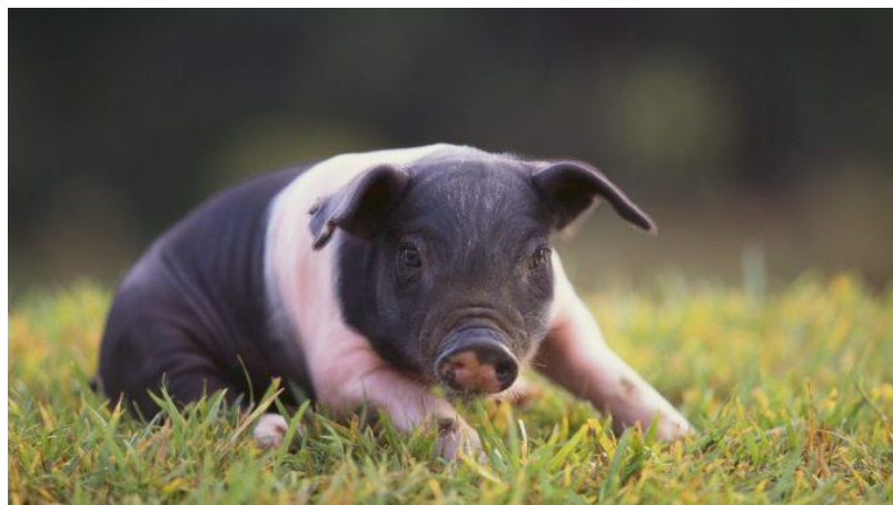
Slika 7. Prase hempšira