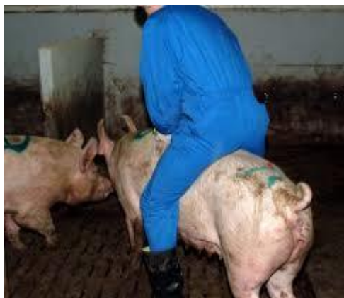
Slika 12. Test jahanja