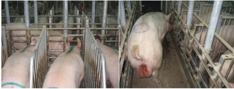
Slika 10. Puštanje nerasta probača između obora plotkinja