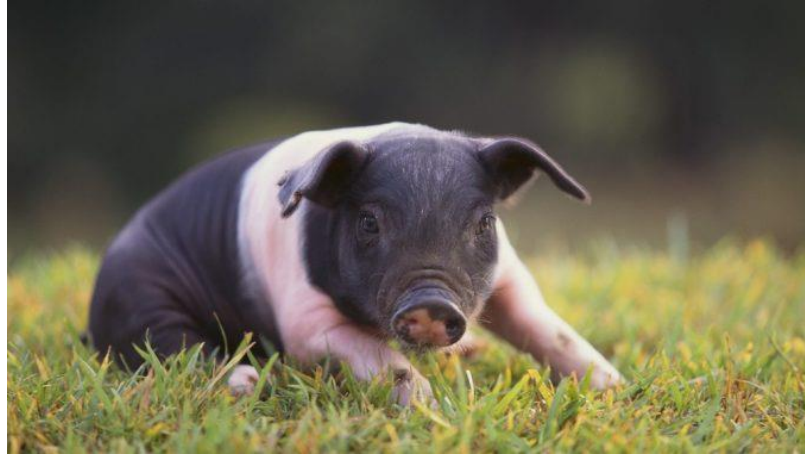
Slika 7. Prase hempšira