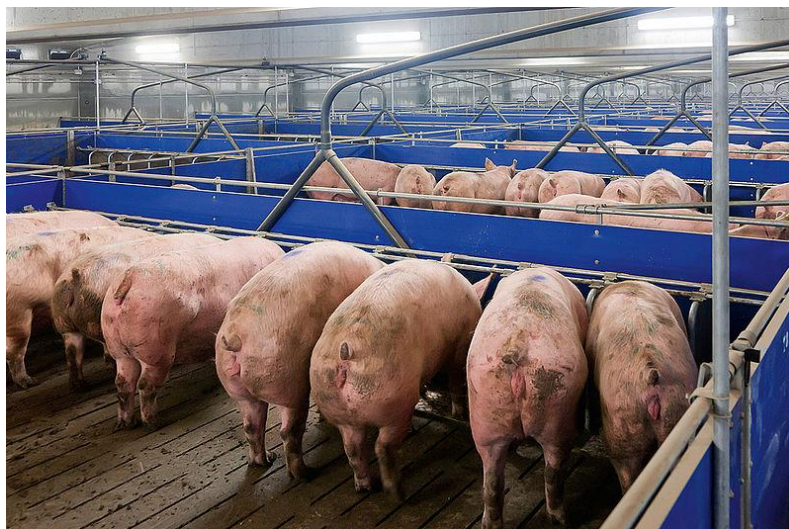
Slika 15. Hranidba bređih krmača u čekalištu

Za što bolji uspjeh proizvodnje stres treba smanjiti na najmanju moguću mjeru. Neki od mogućih načina za kontrolu stresa su: klimatiziranje, vlažna hrana, povećanje frekvencije hranjenja što dovodi do većeg unosa hrane, hranjenje rano ujutro i kasno navečer itd.