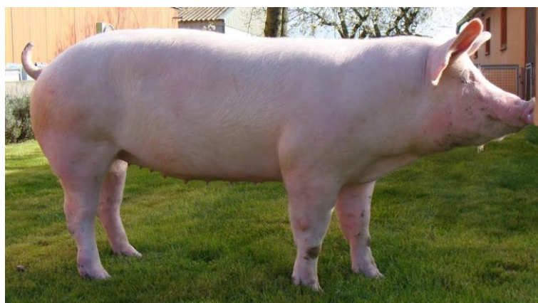
Slika 2. Nazimica velikog jorkšira

Svinje velikog jorkšira imaju srednje dugu glavu, široku na čelu, osobito između ušiju. Profil glave je blago ugnut, a njuška donekle kratka i široka. Uši su uspravne te dosta velike. Glava treba biti što lakša, a podbradak što manje izražen. Vrat je dugačak i širok te se dobro spaja s grudima. Trup je dugačak, širok i dubok. Grudi su duboke i široke, s dobro razvijenim rebrima. Leđa i slabine su duge i široke. Leđna linija je ravna. Sapi su gotovo vodoravne, duge i široke. Plečke su ravne i umjereno široke, a bedra puna i duboka te dopiru do skočnog zgloba. Trbuh je pravilno razvijen s ravnom donjom linijom s najmanje 12 pravilno raspoređenih sisa. Noge su srednje visoke, snažne, ali ne i debele. Stavovi nogu se pravilni, kičice kratke i dosta čvrste, a papci pigmentirani.