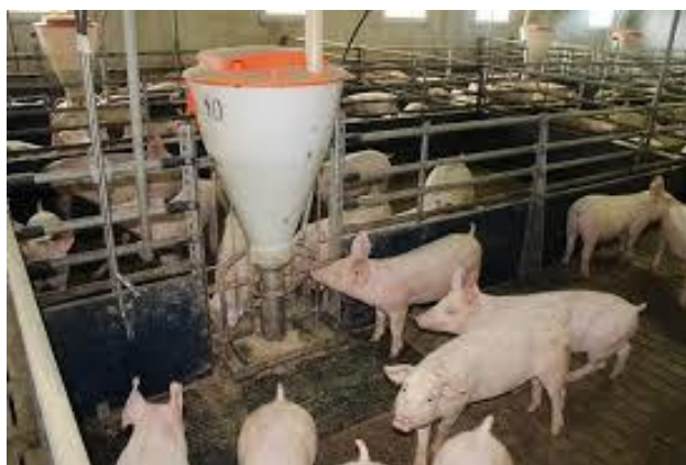
Slika 14. Hranidba nazimica do 70 kg tjelesne mase

Do dobi od četiri mjeseca, svinje namjenjene rasplodu treba hraniti kao i tovne svinje. Nakon toga, rasplodnu nazimad treba hraniti manje obilno, uz dnevni prirast od 600g, tako da u dobi od sedam i pol do osam mjeseci nazimad bude teška 110 -115 kg. Rasplodnom podmlatku najviše odgovara obročna hranidba. U dobi od tri mjeseca, odvajaju se muška od ženskih grla. U hranidbi nazimica poželjno je da se koristi zelena te sočna krmiva, čak do 40 % energetske vrijednosti obroka. Nazimice konzumiraju oko 0,5 kg zelene mase ili silaže na svakih 10 kg tjelesne mase. Krmne smjese za nazimice mogu imati veći udio brašna dehidrirane lucerne i posija. Sadržaj sirovih bjelančevina u obroku do 40 kg tjelesne mase treba biti 18 % , od 40 do 70 kg tjelesne mase 16 % , a nakon 70 kg tjelesne mase 14 % sirovih bjelančevina.