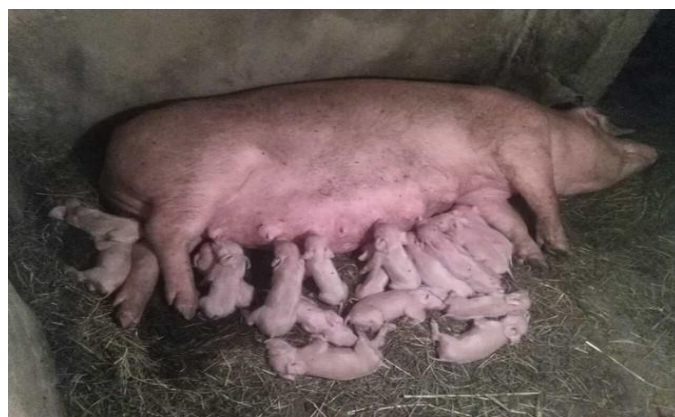
Slika 9. Krmača s prascima

Računa li se da je za pokriće troškova hranidbe krmače i njezinog legla potrebno 5 prasadi, a za pokriće ostalih troškova potrebno je 1 - 2 praseta, onda tek sedmo, odnosno osmo prase predstavlja izvjesnu dobit (Vukina, 1960.). Zanimljivo je da navedeni odnosi troškova hranidbe krmača i veličine legla vrijede i danas nakon 40-ak godina.