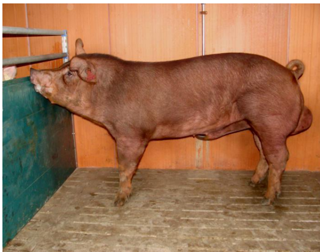
Slika 8. Karakteristična crvenkasta boja čekinja kod duroka