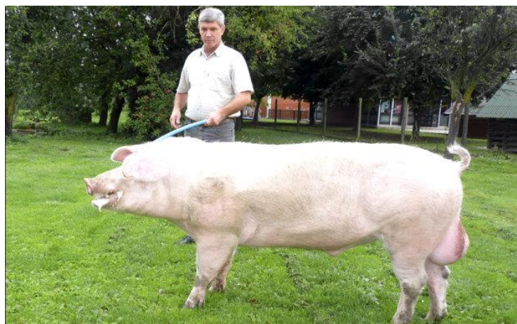
Slika 3. Nerast njemačkog landrasa

Najrasprostranjenija pasmina svinja u Njemačkoj. Njemački landras je nastao križanjem keltske svinje, njemačke plemenite svinje i velikog jorkšira. Željom za dužim trupom i boljom mesnatosti stvoren je tip svinje koji je 1983. godine priznat za pasminu. Njemački landras naročito se pokazao pogodnim za uzgoj na manjim poljoprivrednim gospodarstvima kakvih je u Njemačkoj bilo mnogo, što je pogodovalo brzom širenju ove pasmine. Ova pasmina svinja ima dugi trup s posebno izraženim plečkama i butovima.