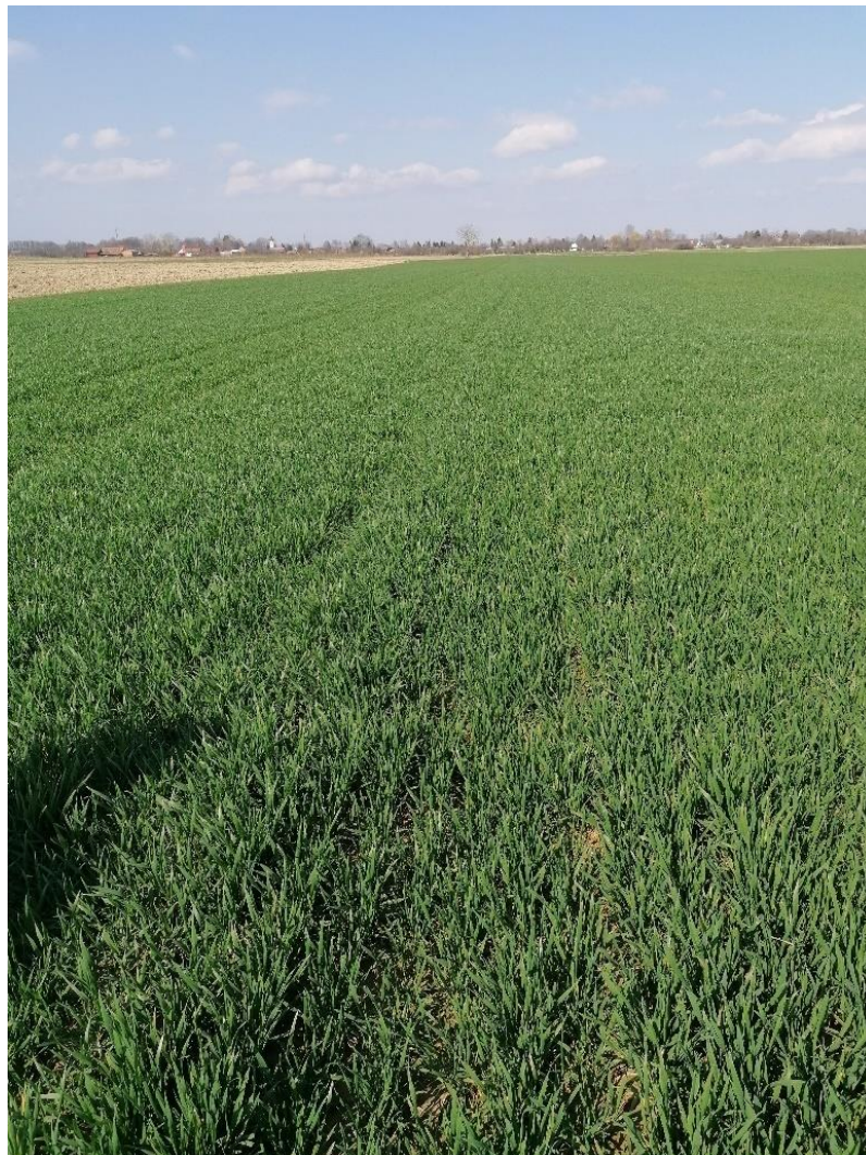
Slika 1. Pokusno polje pšenice, Zdenci, 2020.

Poljski pokus postavljen je na proizvodnim površinama obiteljskog poljoprivrednog gospodarstva „Hager“ u selu Zdenci koje se nalazi u Virovitičko–podravskoj županiji Republike Hrvatske (slika 1.). Pokus je postavljen prema slučajnom blok rasporedu u tri ponavljanja. Tijekom jednogodišnjeg istraživanja utvrđena je učinkovitost odabranih herbicida na uskolisne i širokolisne korove u pšenici. Veličina pokusne parcele iznosila je 1ha. Unutar svakog istraživanog tretmana postavljena je kontrolna parcela koja je netretirana. Pokusne parcelice su veličine 2,5 x 2,5 m.