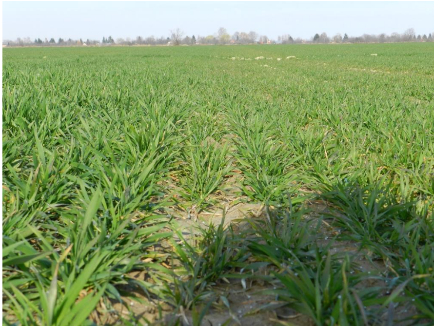
Slika 9. Varijanta pokusa beflubutamid