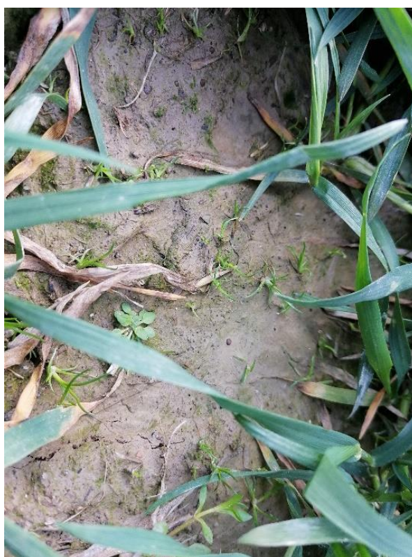
Slika 2. Apera spica-venti (L.) PB. – obična slakoperka

Apera spica-venti (L.) PB. – obična slakoperka (slika 2.) prema Knežević, 2006. je ozima jednogodišnja biljka, visine 30 do 100 cm. Korov je u ozimim žitaricama i na ruderalnim staništima. Vlati su glatke i uspravne ili se uzdižu. Listovi su goli, širine do 5 mm. Ogrljak je dug do 6 mm, metlica je rahla dužine oko 20 cm te nosi brojne klasiće koji su jednocvjetni zelene do ljubičaste boje. Sjemenke kličaju u jesen na dubini od 1 cm. Biljka je srednje krmne vrijednosti a pelud može uzrokovati alergije.