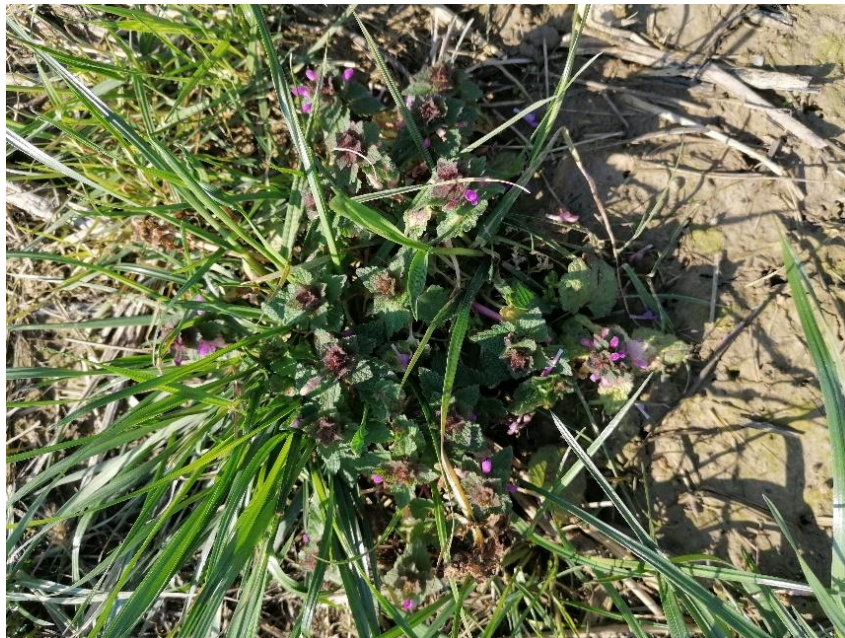
Slika 6. Lamium purpureum L. – grimizna mrtva kopriiva

Biljka proizvede od 400 do 1400 sjemenki. Korov je u ozimim žitaricama, okopavinama i na ruderalnim staništima. Ljekovita je i medonosna biljka (Knežević, 2006.).