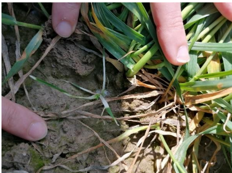
Slika 4. Poa annua L. – livadna vlasnjača

Poa annua L. – livadna vlasnjača (slika 4.) je jednogodišnja do dvogodišnja biljka busenasto razgranjena a naraste od 20 do 30 cm. Vlasi su gole, okrugle a plojke su bez sjaja, mekane s dvotračnom brazdom i čunjasto složenim vrhovima. Rukavci su goli i stisnuti, a ogrljak je dug do 4 mm i bijel. Metlica je piramidalna s malenim klasićima koji se sastoje od tri cvijeta. Pšeno je sa strane stisnuto s uskom leđnom brazdom. Sjemenke klijaju skoro cijele godine. Česta je vrsta na ruderalnim staništima, oranicama i u usjevima. Dobra je svježa krma, upotrebljava se u hortikulturi a pelud može izazvati alergije (Knežević, 2006.).