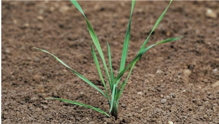
Slika 3. Alopecurus myosuroides Hunds. – poljski repak

( https://www.agro.basf.hr/hr/Novosti-i-dogadjaji/Pest-Guide/Poljski-repak.html )