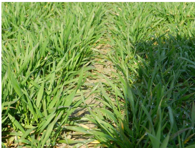
Slika 8. Varijanta pokusa flufenacet+diflufenikan i beflubutamid