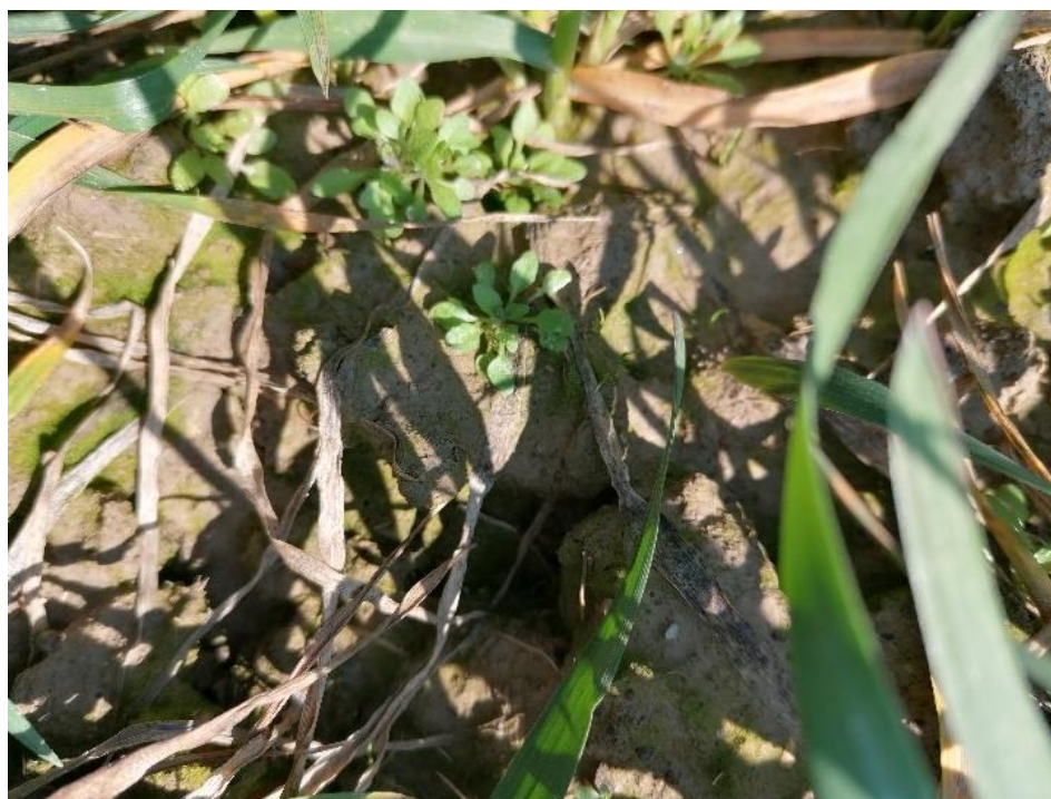
Slika 5. Capsela bursa-pastoris (L.) Med. – prava rusomača

Capsela bursa-pastoris (L.) Med. – prava rusomača (slika 5.) je jednogodišnja ozima biljka, visine do 50 cm. Korijen je vretenast, stabljika uspravna u gornjem dijelu slabo razgranjena. Listovi su različito krpasto nazubljeni ili perasto razdijeljeni i skupljeni u prizemnu rozetu. Listovi su na stabljici malobrojni, sjedeći i uhasto obuhvaćaju stabljiku. Cvjetovi su bijeli, sitni pri vrhu zbijeni u cvatove. Komuščice su naopako srcaste i otvaraju se s dva zaklopca. Biljka proizvede i do 40 000 sjemenki. Sjeme klija u jesen a klijavost zadržava u tlu do 35 godina. Korov je na oranicama (ozime žitarice, okopavine, lucerništa), u vrtovima i na ruderalnim staništima. Medonosna je biljka, ali loše krmne vrijednosti zbog sadržaja alkaloida i flavonoida (Knežević, 2006.).