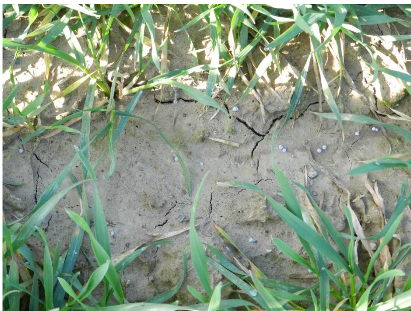
Slika 7. Varijanta pokusa flufenacet+diflufenikan

Učinkovitost herbicidnih varijanti najznačajnije je izražena u aplikaciji kombinacije herbicida djelatnih tvari flufenacet+diflufenikan (slika 7.) jednako kao i kod aplikacije herbicida djelatnih tvari u kombinaciji flufenacet+diflufenikan i beflubutamid (slika 8.). Najmanju učinkovitost iskazala je primjena herbicida s djelatnom tvari beflubutamid (slika 9.).