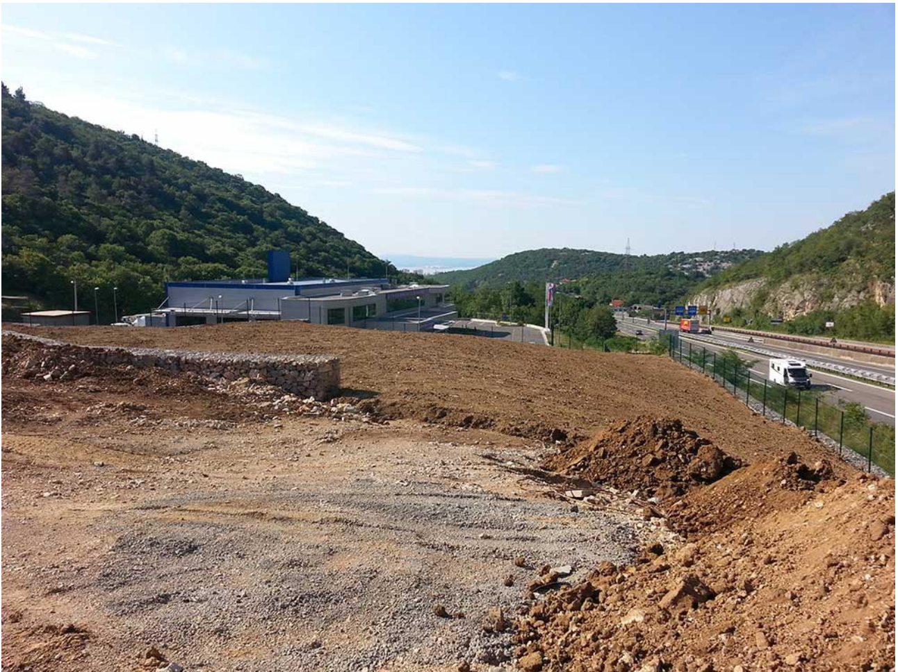
Slika 6: Građevinski radovi na lokaciji Jadran Galenskog Laboratorija, Rijeka