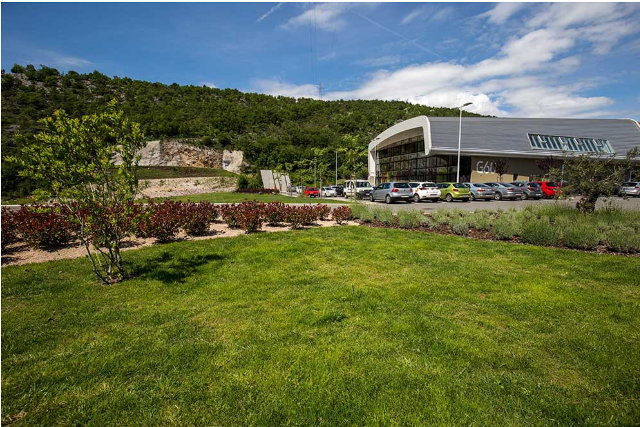
Slika 4: Izvedeni radovi na lokaciji Jadran Galenskog Laboratorija, Rijeka