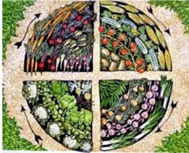
Slika 10. Rotacija usjeva