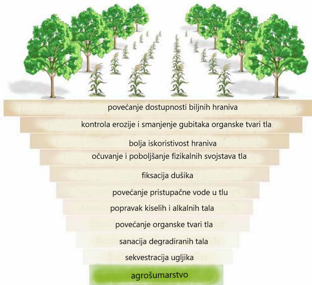
Slika 12. Održavanje zdravlja tla agrošumarstvom