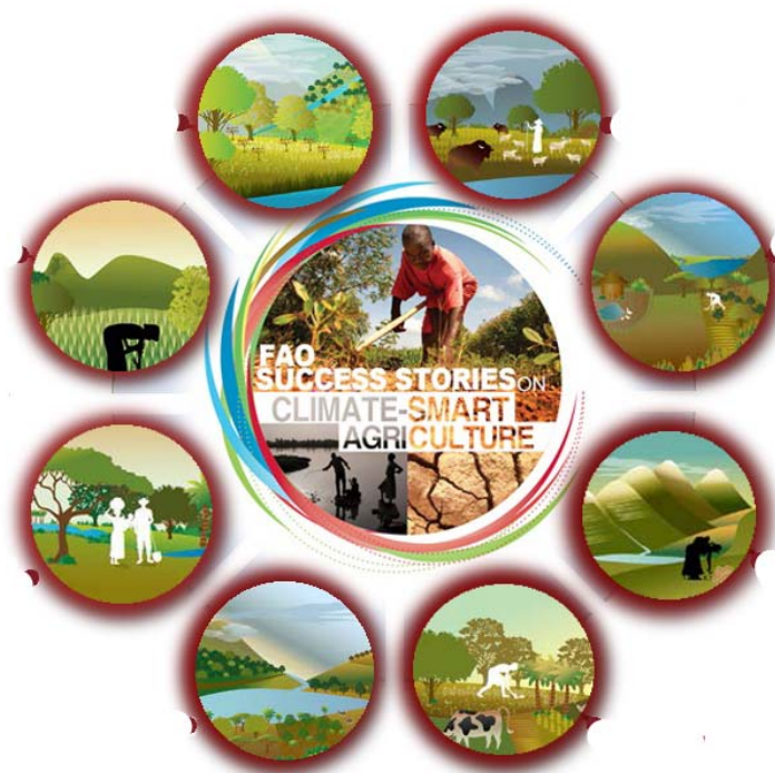
Slika 7. Pristupi i prakse klimatski pametne poljoprivrede

Postoje brojni pristupi i prakse (Slika 7.) koji mogu značajno pridonijeti povećanju proizvodnje, a da istovremeno ostanu usredotočene na održivost okoliša. Ne postoji univerzalni pristup koji je primjenjiv u svakom agroekosustavu već je potreban pristup koji uključuje različite elemente ugrađene u lokalni kontekst odnosno odlike svakog agroekološkog područja (Jug i sur., 2015.).