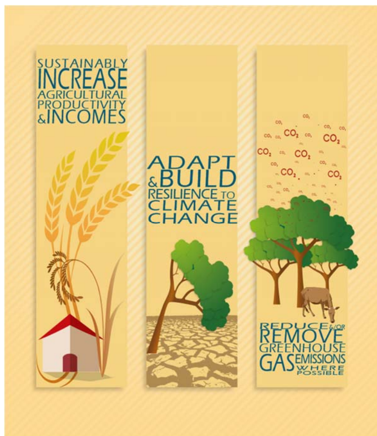
Slika 3. Principi klimatski pametne poljoprivrede

Ovaj pristup: se bavi složenim međusobno povezanim izazovima sigurnosti hrane, razvoja i klimatskih promjena i utvrđuje integrirane mogućnosti koje stvaraju sinergije i koristi i smanjuju kompromise. Ujedno procjenjuje interakcije između sektora i potrebe različitih uključenih dionika, utvrđuje prepreke koje se javljaju kod usvajanju ovih principa, posebno kod poljoprivrednika, i pruža odgovarajuća rješenja u smislu politike, strategije, djelovanja i poticaja.