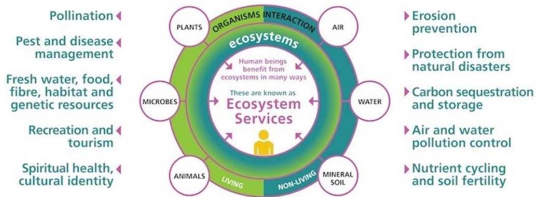
Slika 8. Usluge ekosustava

Prema Jug i sur. (2019.) cilj adaptacije poljoprivredne proizvodnje na klimatske promjene je smanjiti izloženost poljoprivrednika kratkoročnim rizicima, istovremeno jačajući njihovu otpornost tako što će izgraditi sposobnost za prilagodbu i napredak u slučaju dugoročnih stresova. Posebna se pažnja posvećuje zaštiti usluga ekosustava (Slika 8.). Ove su usluge ključne za održavanje produktivnosti i naše sposobnosti prilagođavanja klimatskim promjenama.