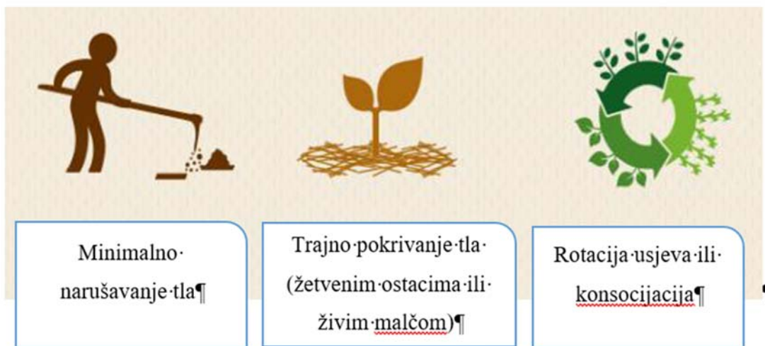
Slika 9. Principi konzervacijske poljoprivrede