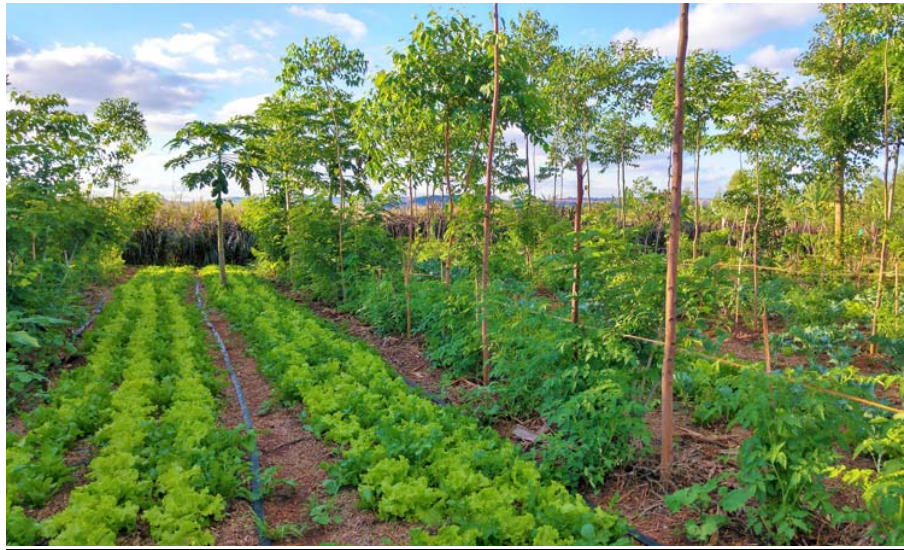
Slika 11. Agrošumarstvo

Razgradnjom lišća koje pada na tlo stvara se važan izvor prirodnog komposta i gnojiva okolnim kulturama. Drveće i živice na poljima povećavaju bioraznolikost, što pogoduje oprašivačima. Drveće ima važnu ulogu u apsorpciji CO 2 smanjujući tako učinak klimatskih promjena. Dnevne temperaturne aberacije mogu negativno utjecati na biljne vrste koje su blizu površine tla te prisustvo stabala u njihovoj blizini predstavlja dobar regulator temperaturnih promjena tijekom dana u mikroklimi usjeva.