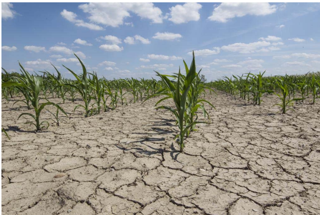
Slika 6. Degradacija tla

Pored toga, održavanje i poboljšavanje zdravlja tla doprinosi sigurnosti hrane na izravan način. Veliki dio globalne proizvodnje usjeva zauzima kukuruz, riža, pšenica i druge kulture, kao što su uljarice. Međutim, zdrava prehrana stanovništva temelji se na raznolikosti usjeva. Oni pružaju niz esencijalnih hranjivih sastojaka, vitamina i minerala te voća i povrća visoke prehrambene vrijednosti. Uzgoj mahunarki, kao usjeva koji fiksira dušik iz atmosfere pomoću kvržičnih bakterija na korijenu, predstavlja uštedu energije i resursa, jer fiksacijom dušika smanjuje potrebu za dušičnim gnojivima. Uzgoj mahunarki smanjuje i patogene u tlu (FAO, 2012.,a).