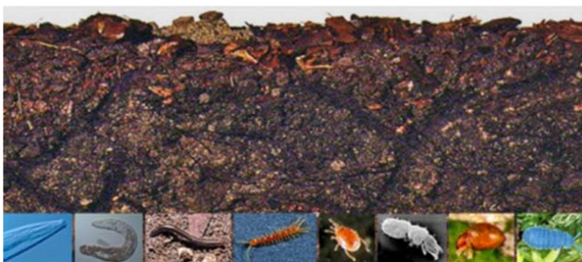
Slika 5. Biološka raznolikost tla

U poljoprivredi, oko 80% BNF- a postiže se simbiotskom povezanošću mahunarki i kvržičnih bakterija (protobakterija iz reda Rhizobiales , porodice Bradyrhizobiaceae i Rhizobiaceae ). Na BNF može se utjecati izborom mahunarki, udjelom mahunarki i sjemenki trave u krmnim smjesama, inokulacijom sjemeni, ishranom usjeva (posebno dušikom i fosforom), suzbijanjem korova, bolesti i štetočina, vrijeme sadnje, rotacijom usjeva, te učestalost defolijacije krmiva. Međutim, neki se čimbenici, uključujući nepovoljne temperature i suše, koji utječu na BNF, ne mogu kontrolirati. Također, neke leguminoze bolje fiksiraju dušik u odnosu na druge leguminoze. U višegodišnjim mahunarkama s umjerenom krmom, crvena djetelina i lucerna obično mogu fiksirati 200–400 kg dušika po hektaru (uključujući cijelu biomasu) (FAO, 2009.)