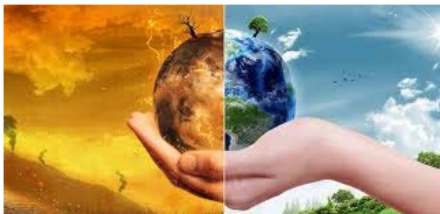
Slika 1. Klimatske promjene

Najizraženije promjene uzrokovane klimatskim uvjetima uočavamo u biljnoj proizvodnji. Iako bi neke kulture u nekim regijama svijeta mogle imati neke benefite od promjene klime, pretpostavlja se da će ukupni utjecaji klimatskih promjena na poljoprivredu biti negativan (IFPRI, 2009). Na primjer, klimatska varijabilnost i učestalost ekstremnih klimatskih događaja, poput suša i poplava, utjecat će na količinu i distribuciju oborina. Visoke temperature mogu negativno utjecati na prinose i pogodovati rastu korova i širenju štetočina i bolesti usjeva. U mnogim područjima porast razine mora također će ometati proizvodnju usjeva. Pri vrlo niskim temperaturama dolazi do pojave mraza, izmrzavanja zametnutih plodova, dok pri vrlo visokim temperaturama dolazi do skraćivanja vegetacijskog razdoblja, opadanja cvjetnih zametaka, vrijeme fotosinteze je kraće i smanjuju se prinosi. Sve navedeno dugoročno gledano dovodi do pada proizvodnje. Prema nekim predviđanjima, klimatske promjene će utjecati na dodatno povećanje cijena glavnih poljoprivrednih prehrambenih kultura poput riže, pšenice, kukuruza i soje (IFPRI, 2009.). Prema FAO (2013.) utjecaj klimatskih promjena najteže će pogoditi zemlje u razvoju, a upravo će sigurnost hrane biti najviše ugrožena.