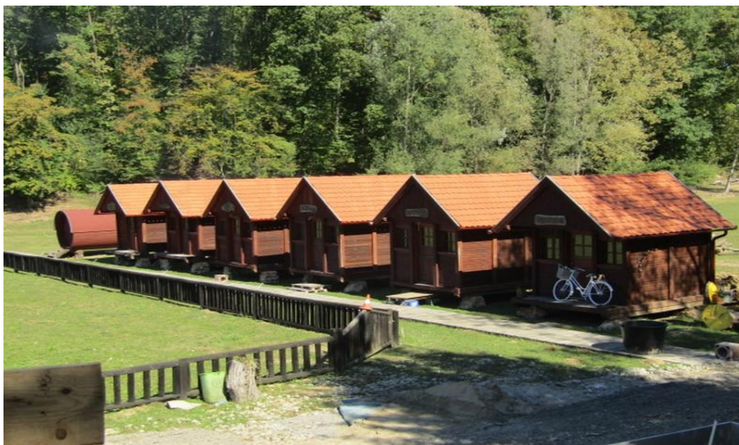
Slika 11. Drveni bungalovi na Ranču Čondić