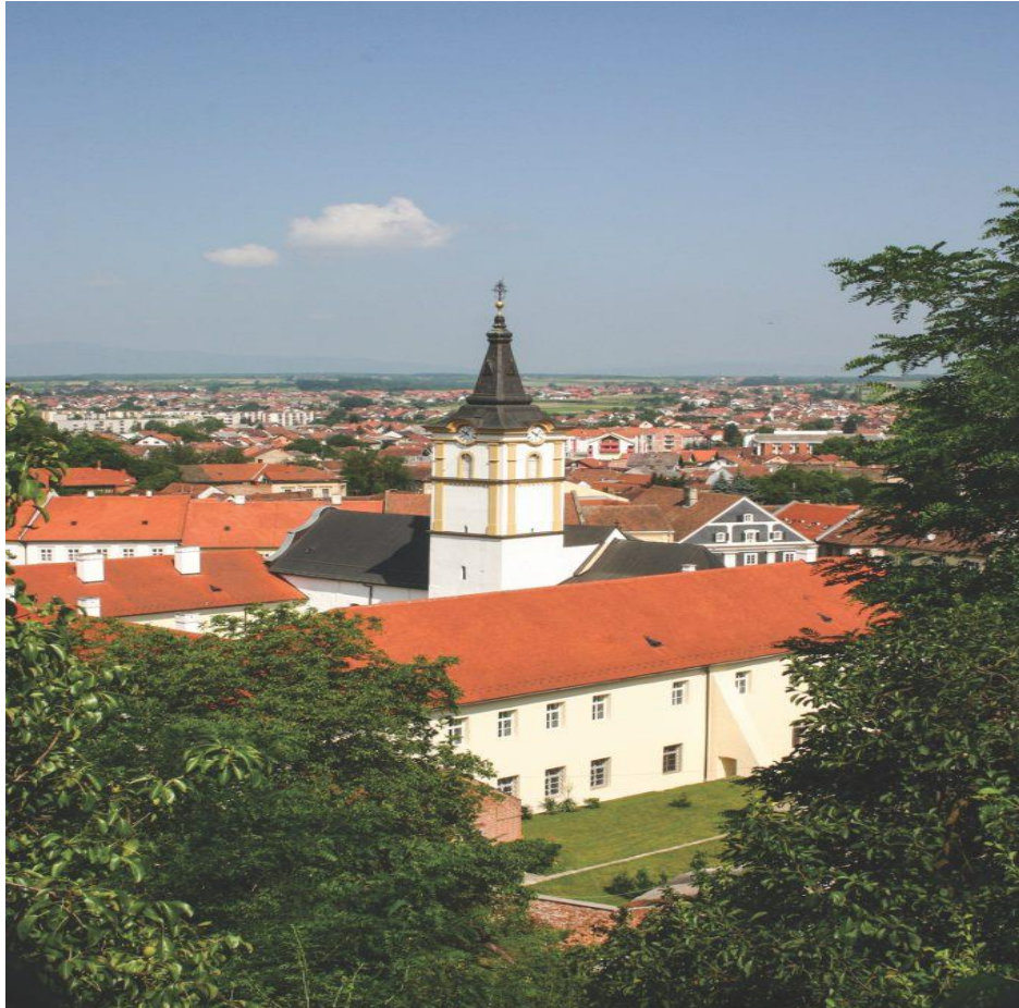
Slika 3. Požega