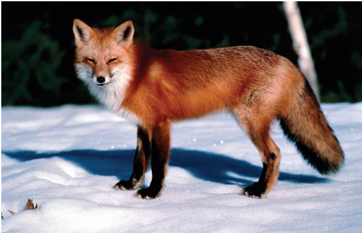
Slika 1. Crvena lisica u zimskom krznu

Lisica je veličine osrednjeg psa, visine 45-50 cm i duljine 120 cm. Od ukupne duljine tijela 40 cm otpada na kitnjasti rep. Tjelesna masa joj je 6 do 8 kg premda može težiti i 10-ak kilograma. Tijekom zime su, iako lakše, lisice naizgled vrlo krupne. Razlog tome je bujno zimsko krzno. Tjelesne proporcije i boja dlačnog pokrivača ovise o geografskoj širini i nadmorskoj visini.