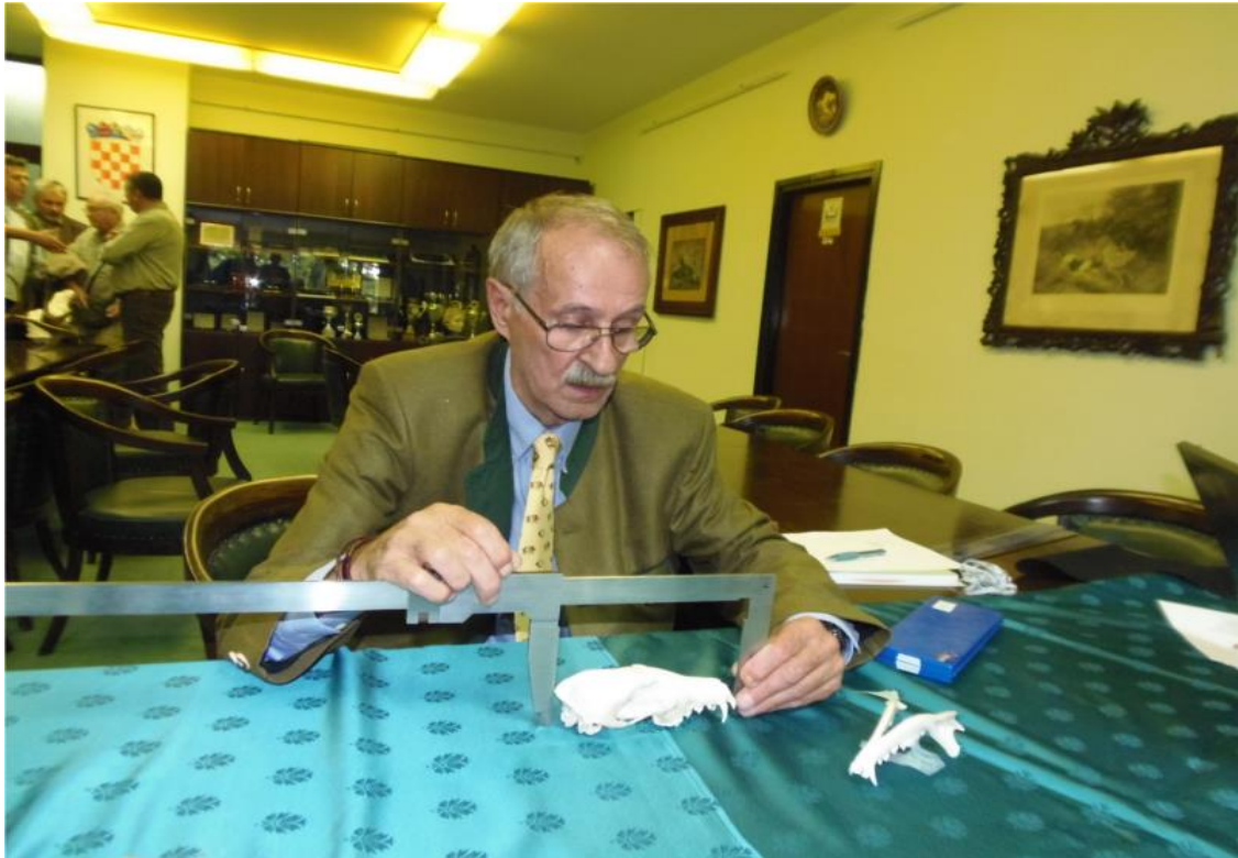
Slika 4. Ocjenjivanje lubanje lisice