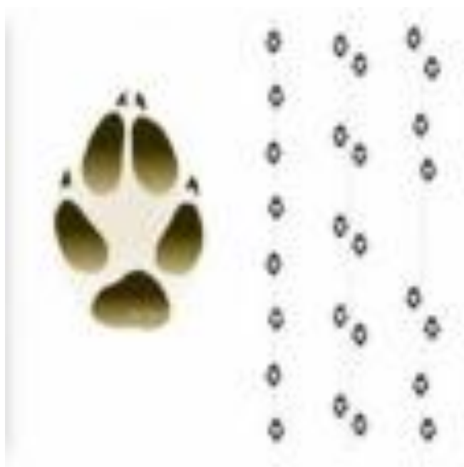
Slika 2. Izgled šape i tragovi lisice u hodu, kasu i u trku

Ima potpuno zubalo škarastog zagriža s 42 zuba, pri čemu zubna formula glasi I 3/3; C 1/1; P 4/4; M 2/3. Hoda na način da stražnjim nogama staje u trag prednjih nogu, uslijed čega se trag niže u pravilan neprekinut niz. Na nogama ima po četiri prsta s pandžama koje ne može uvući pa su uvijek prisutne u tragu.