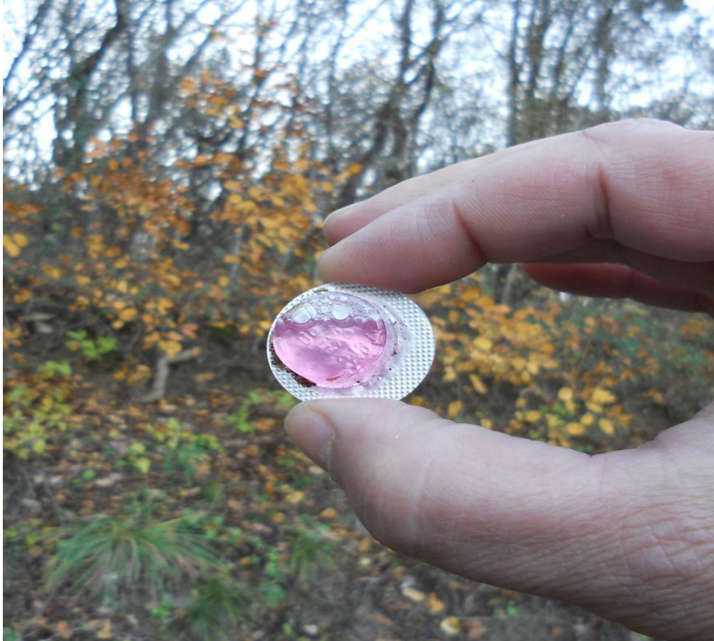
Slika 3. Unutrašnji dio mamca s cjepivom