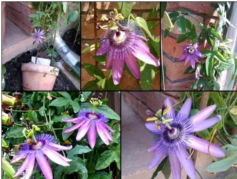
Slika 16. Passiflora amethyst

Passiflora amethyst – zimzelena penjačica koja naraste i do 4 m (Slika 16). Latice su svjetlo ljubičaste boje, a krunica tamno ljubičaste boje sa bijelim centrom. Promjer cvijeta je 10 cm. List je prstastog oblika s tri duboka režnja. Plod je narančaste boje (The Royal Horticultural Society- Passiflora 'Amethyst', 2014).