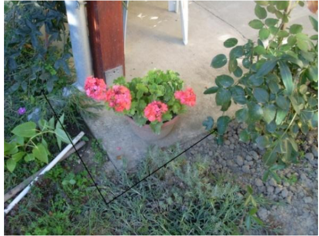
Slika 13. Širenje Passiflore caeruleae korijenom daleko od centra 2