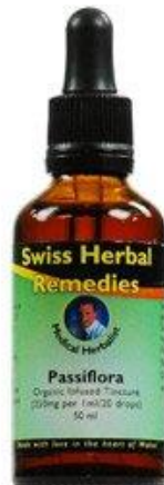
Slika 21. Tinktura od Passiflore incarnate