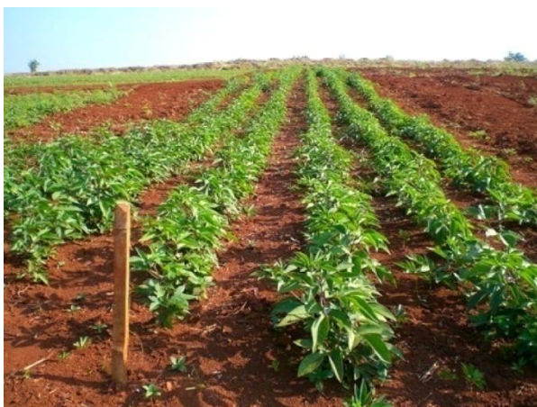
Slika 23. Uzgoj Passiflore incarnate na Tajlandu

Passiflora incarnata voli sunčana ili polu sjenovita mjesta. Tlo u koje se sadi treba biti rahlo, dobro propusno te blago kiselo s pH 5-6.5. Može rasti u različitim vrstama tala, no najviše joj odgovaraju tla bogata humusom s dodatkom ilovače i pijeska (Slika 23) (Mala eko sjemenarna- Pasiflora ukras i lijek, 2014.). Za veći rast pasiflore potreban je potporanj ili naslon (Slika 24). Prije sadnje, na razmake od 4 m postavljaju jaki stupovi visoki 3 m. Ti se stupovi povezuju žicama. Rupe za sadnju treba temeljito pripremiti, dodavanjem organske tvari i osnovnog gnojiva sa srednjim udjelom dušika. Biljke se najčešće sade na razmak od 3 do 4 m ili manje (Borovac, 2005.).