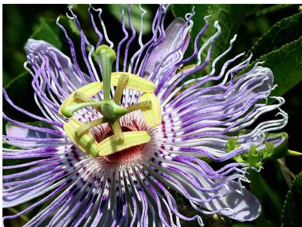
Slika 8. Pet peludnica i trodijelni tučak