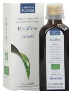
Slika 22. SIFP ekstrakt