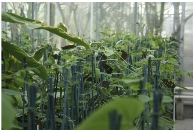
Slika 32. Passiflora incarnata uzgojena iz reznica 2