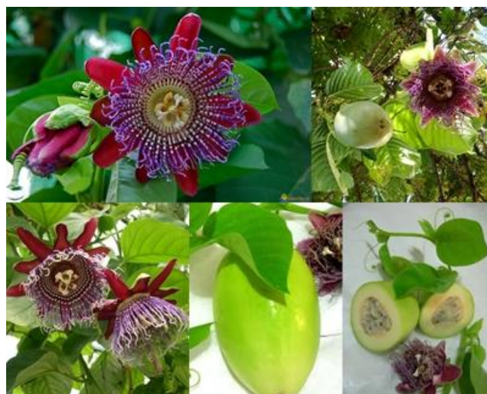
Slika 18. Passiflora quadrangularis

Passiflora quadrangularis - golema pasiflora je vazdazelena penjačica s viticama, snažnog rasta, drvenastih stabljika. Boja cvjetova varira od bijele, ružičaste, crvene do blijedoljubičaste s bijelo i intenzivno grimizno ispruganim kronicama (Slika 18). Cvjetovi se većinom javljaju samo ljeti i najčešće su okrenuti prema dolje kao da vise. Golema pasiflora može dosegnuti visinu od 5-8 m. Minimalna temperatura koju može podnijeti je 10°C (Borovac, 2008.). Glatkih je, srcolikih, jajolikih i šiljastih listova koji nisu tipični za pasifloru. Plod je duguljast i sadrži brojne sjemenke koje se nalaze u jestivoj pulpi (Wikipedija- Passiflora quadrangularis , 2013.).