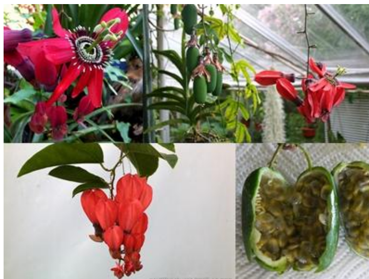
Slika 17. Passiflora racemosa