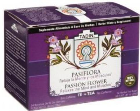
Slika 20. Čaj od Passiflore incarnate 2