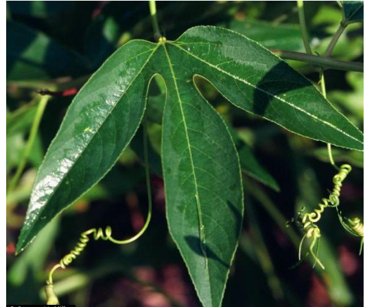
Slika 5. Nazubljeno lišće Passiflore incarnate

Cvijeta od lipnja do rujna. Cvjetovi su pojedinačni promjera 4-6 cm i lijepog mirisa. Neobični cvijet svijetlo ljubičaste boje (boja lavande), rijetko bijele sa pet latica (Slika 6). Cvijet također sadrži pet čašičnih listića (sepala) (Slika 7), pet peludnica, trodijelni tučak (Slika 8) i krunu od mnogo resastih segmenata koji se ističu iznad latica. Kruni kojoj boja varira od bijele do svijetlo ljubičaste sa žarko ljubičastim okvirom (Slika 9). Reproductivni organi su zanimljivo raspoređeni i daju cvijetu egzotičnu ljepotu.