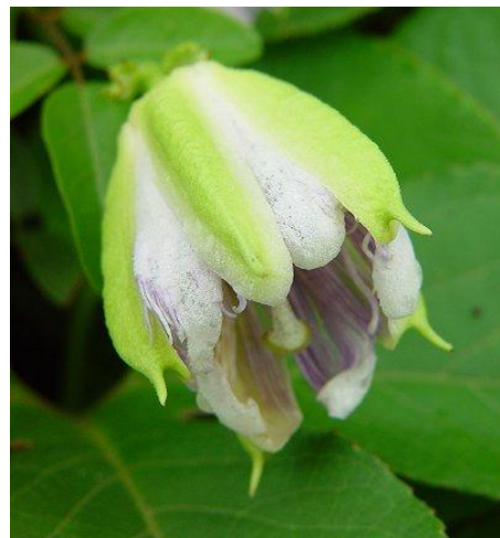
Slika 7. Čašični listići- sepale