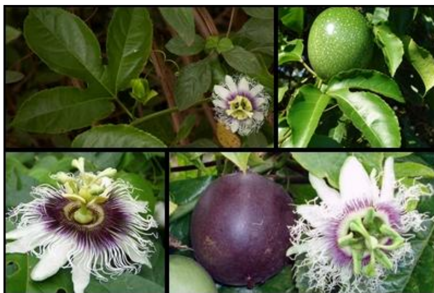
Slika 15. Passiflora edulis

Passiflora edulis je zimzelena penjačica koja u idealnim uvjetima može godišnje narasti do 9 m (Slika 15). Izdržava temperature do -2°C. Plod ove biljke naziva se Marakuja (Pijani tvor-Marakuja (Passiflora edulis), 2008.). Oblik ploda je okrugao ili ovalan. Ovisno o podvrsti boja ploda može varirati od žute do ljubičaste, kao i tvrdoća ili mekoća ploda (Wikipedija-Marakuja, 24. Ožujak 2013.).