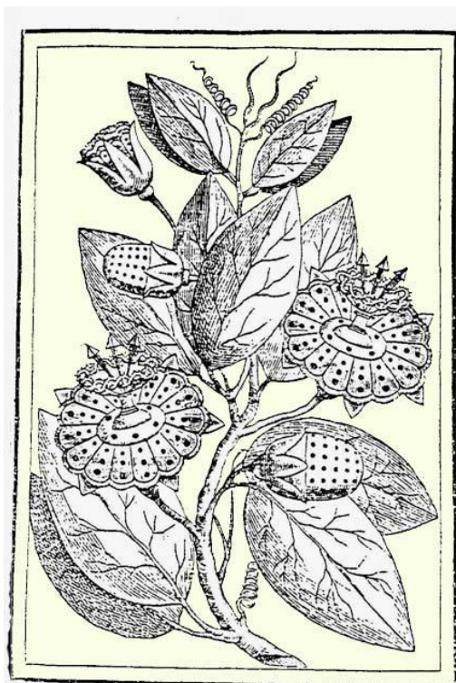
Slika 1. Skice povjesničara Giacoma Bosia

otkriva da domorodci u Virginiji sade pasifloru te ju koriste za piće, hranu i kao medicinski preparat (USDA NRCS National Plant Data Center, 2014.). Cherokee indijanci i Azteci koristili su je kao sedativ i sredstvo protiv grčeva. Sjeverno američki Indijanci smatrali su je životnim eliksirom i stavljali ju u vodu za piće. Koristila se i u tradicionalnoj medicini zapadne Indije, Meksika, Nizozemske, Južne amerike, Italije i Argentine (Radulović Saša, Pasiflora- od jutra bez stresa do večeri bez nesanice, 4.svibanj 2010.).