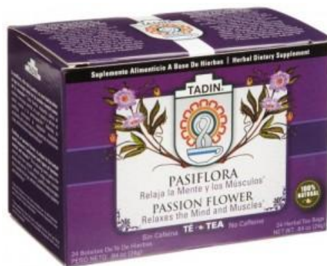
Slika 20. Čaj od Passiflore incarnate 2