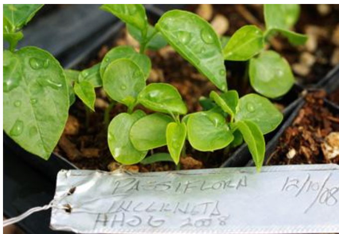
Slika 30. Presadnice Passiflore incarnate