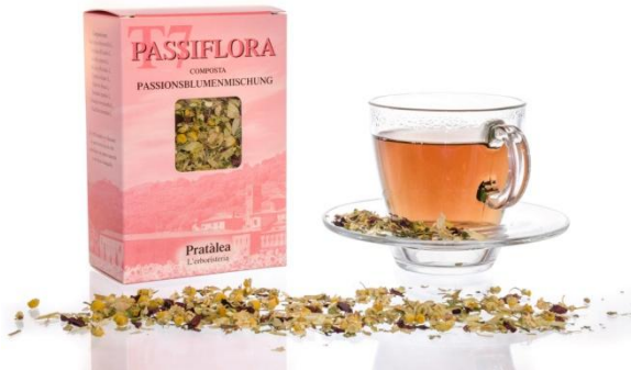
Slika 19. Čaj od Passiflore incarnate 1

Plodovi Passiflore incarnate mogu se jesti sirovi ili spravljati na razne načine (Ljekovito bilje, 2014.). Koriste se u spravljanju soka, vina ili likera i sladoleda (Beal, 2014.).