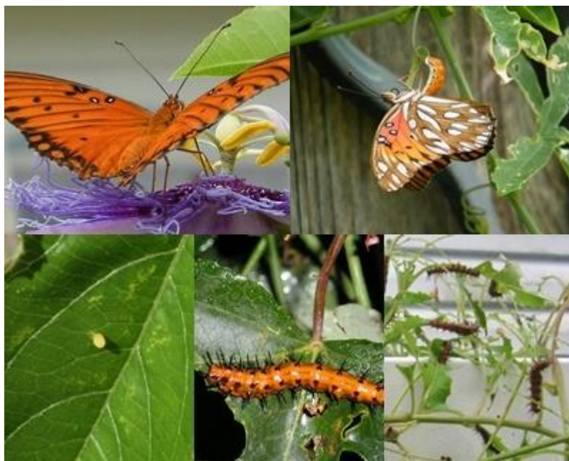
Slika 26. Agraulis vanillae