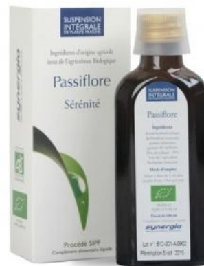
Slika 22. SIFP ekstrakt