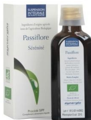
Slika 22. SIFP ekstrakt