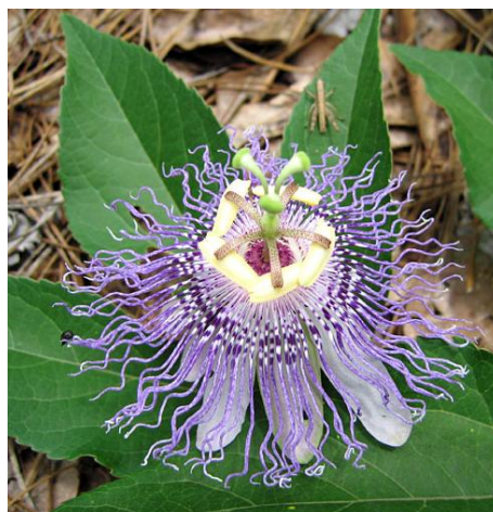
Slika 9. Kruna od resastih segmenata