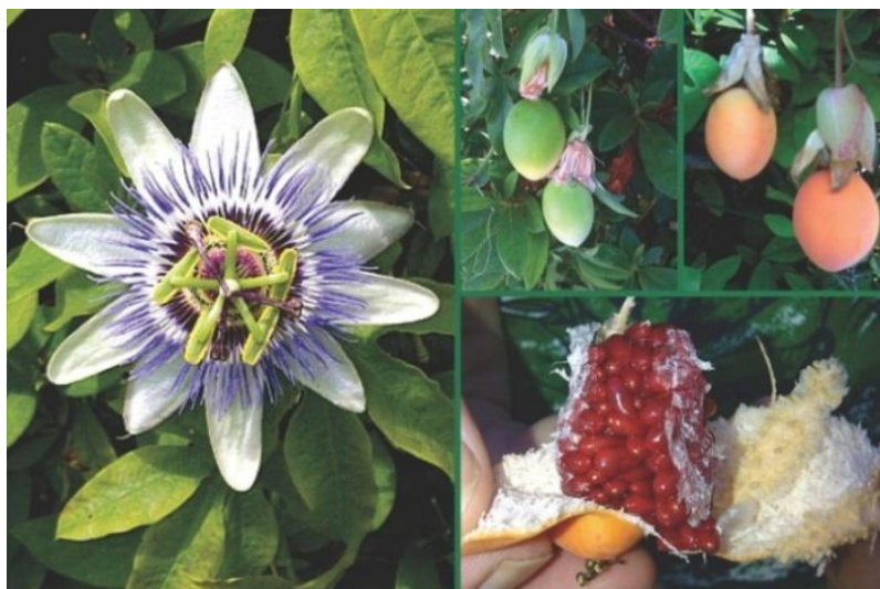
Slika 14. Passiflora caerulea