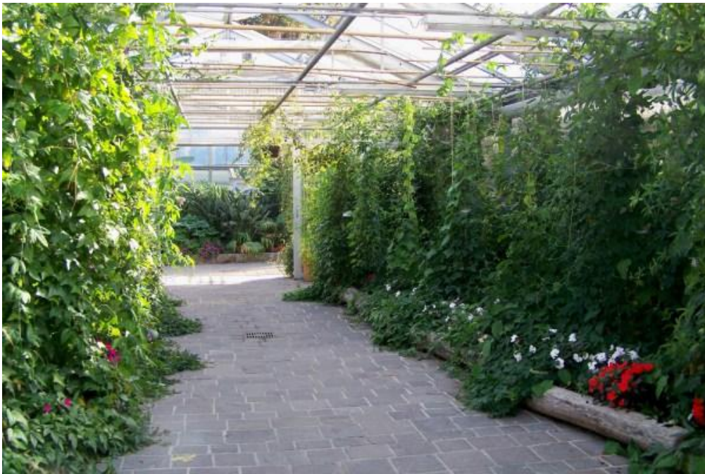
Slika 25. Uzgoj penjačica u stakleniku

Uzgoj u zaštićenom prostoru se najčešće prakticira u umjerenim klimatima, no ako joj se ne osigura optimalna temperatura, vlaga i svjetlost ni tada neće rasti, cvjetati i plodonositi. U uzgoju u zaštićenom prostoru Passiflora incarnata najčešće se oprašuje ručno. Mogu se saditi u već pripremljene gredice ili u velike posude promjera najmanje 35 cm. Za sadnju se upotrebljava ocjedit plodan kompost s mnogo organske tvari te se miješa sa osnovnim gnojivom. Temperatura u zaštićenom prostoru konstantno mora biti iznad 20°C i vlažnost od 60 do 70 %. Jednom godišnje treba prihraniti, te redovito zalijevati (Slika 25)(Borovac, 2005).