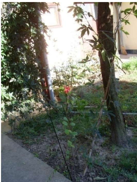
Slika 12. Širenje Passiflore caeruleae podzemno korijenom daleko od centra 1