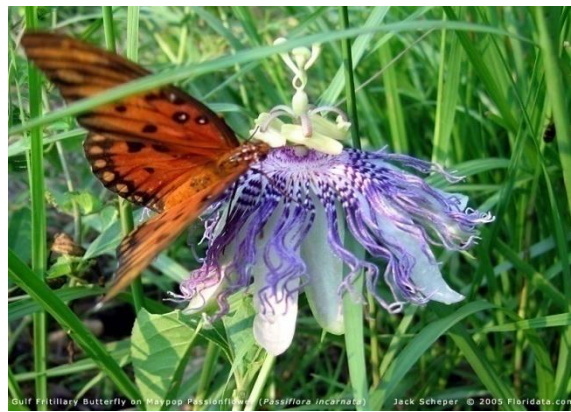
Slika 28. Leptir oprašuje Passifloru incarnatu