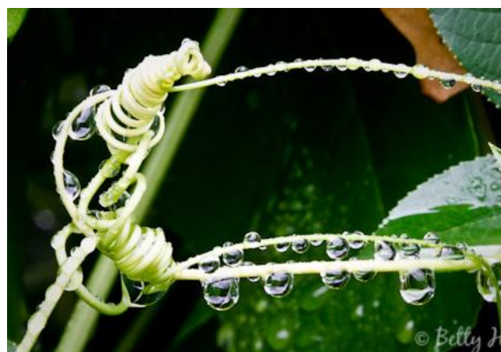
Slika 3. Vitice pomoću kojih se Passiflora incarnata penje

Lišće je veliko od 6-15 cm (Slika 4), prstastog oblika s tri duboka režnja i nazubljenim rubovima (Slika 5). Lišće je tamnozeleno boje u donjem dijelu, a svjetlije prema vrhovima.