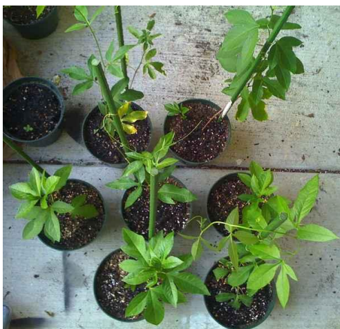
Slika 31. Passiflora incarnata uzgojena iz reznica 1