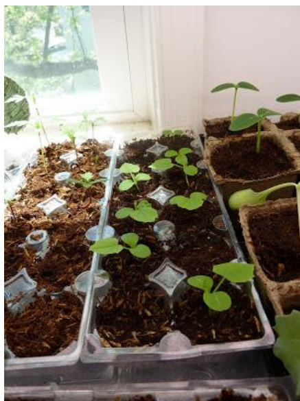
Slika 29. Posijano sjeme Passiflore incarnate