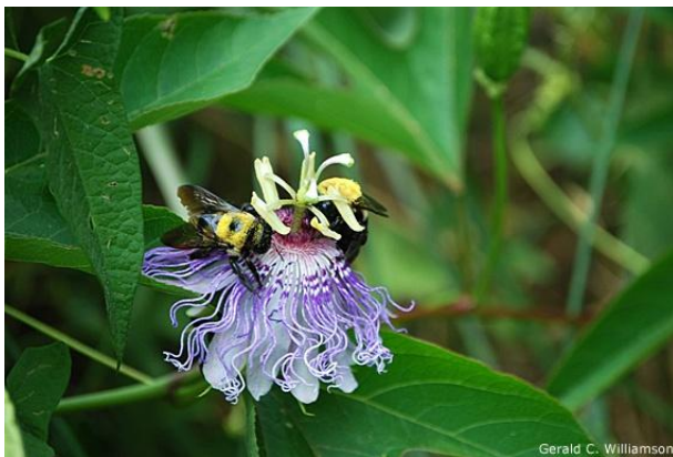
Slika 27. Pčele i bumbari oprašuju Passifloru incarnatu

Razmnožavanje reznicama vrlo je jednostavno. Pripreme se reznice duge 15-20 cm i stave se u pliticu ili lončić s kompostom za reznice (Slika 31 i Slika 32). Tako stavljene reznice treba pričekati da se ukorijene, a ukorjenjivanje se može ubrzati bazalnim grijanjem i orošavanjem (Borovac, 2005.).