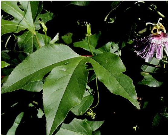
Slika 4. Veliko lišće Passiflore incarnate