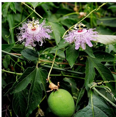
Slika 10. Plod-boba žuto zelene boje

Plod je boba zeleno-žute boje (Slika 10). Ovalnog oblika. Veličine kokošnjeg jajeta (4-10 cm dužine). Razvija se dva do tri mjeseca nakon cvatnje. Sadrži više tamnih sjemenki 4-6 mm dužine, koje su prekrivene jestivim usplođem (Slika 11).