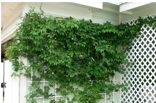
Slika 2. Passiflora incarnata snažna penjačica

Passiflora incarnata - ljubičasta pasiflora je višegodišnja snažna penjačica (Slika 2), koja je autohtona u Južnoj i Sjevernoj Americi. Ova penjačica penje se pomoću vitica (Slika 3) koje izrastaju u pazušcu lista. Može narasti od 2-6 m.