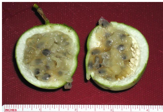
Slika 11. Plod sa sjemenkama i usplođem