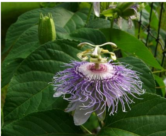
Slika 6. Pojedinačni cvjetovi

Cvijeta od lipnja do rujna. Cvjetovi su pojedinačni promjera 4-6 cm i lijepog mirisa. Neobični cvijet svijetlo ljubičaste boje (boja lavande), rijetko bijele sa pet latica (Slika 6). Cvijet također sadrži pet čašičnih listića (sepala) (Slika 7), pet peludnica, trodijelni tučak (Slika 8) i krunu od mnogo resastih segmenata koji se ističu iznad latica. Kruni kojoj boja varira od bijele do svijetlo ljubičaste sa žarko ljubičastim okvirom (Slika 9). Reproductivni organi su zanimljivo raspoređeni i daju cvijetu egzotičnu ljepotu.