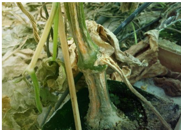
Slika 22. Fusarium oxysporum f. sp. radicis-cucumerinum na krastavcu

Krastavac (slika 22) i dinja su vrlo osjetljivi na Fusarium oxysporum f. sp. radicis-cucumerinum . Kod krastavca se početni simptomi manifestiraju šest do osam tjedana nakon sjetve kao blijedožute lezije na osnovi stabljike.