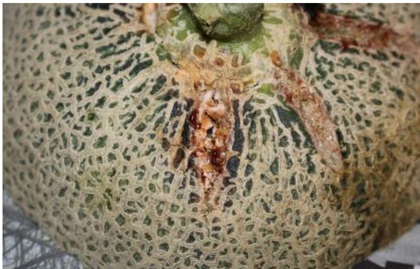
Slika 21. Fusarium oxysporum f.sp. melonis kao uzročnik bolesti na dinji