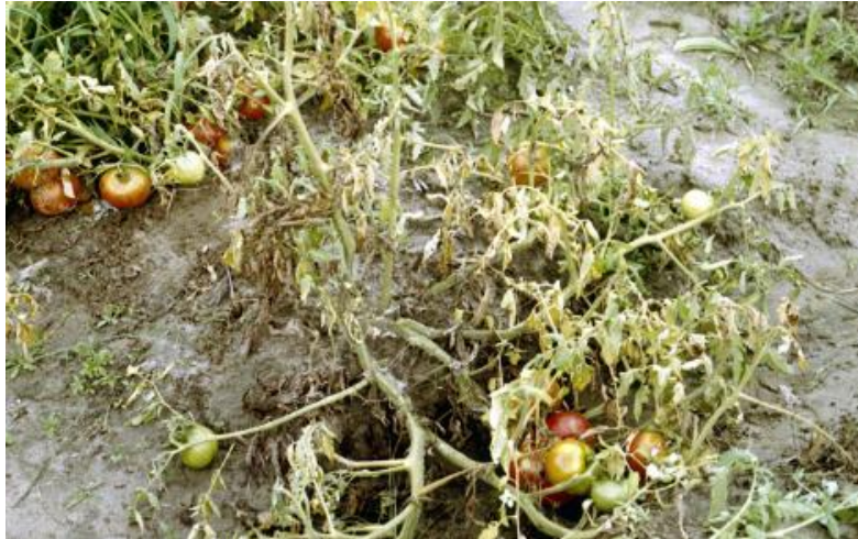
Slika 18. Fusarium oxysporum f. sp. lycopersici kao uzročnik bolesti na rajčici

dana, na jakoj sunčevoj svjetlosti. Bolest dalje napreduje sve dok cijela biljka ne uvene i potpuno se osuši. Proces propadanja biljaka je puno brži nego kod traheoveticilioze. Karakteristični simptomi nastaju na mladim biljkama. Inkubacijski period je vrlo kratak, već nakon 6 do 8 dana nakon zaraze se javljaju prvi simptomi.