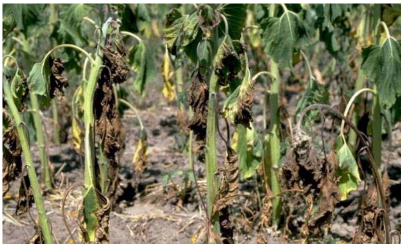
Slika 15. Biljke suncokreta zaražene Fusarium vrstama

Fusarium oxysporum je jedna od mnogobrojnih vrsta koje parazitiraju ne samo korijen i prizemni dio stabljike već prodiru u provodne žile nadzemnih organa biljke te uzrokuju naglo venuće i sušenje mladog usjeva šećerne repe kao i starijih biljaka suncokreta (slika 15 i 16) (Radman i Batinica, 1984.).