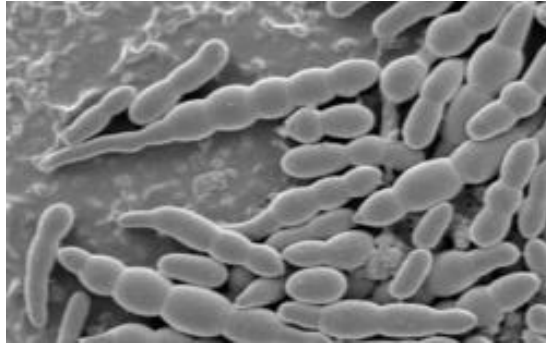
Slika 2. Klijanje makrokonidija Fusarium culmorum zabilježeno krio-elektronskom mikroskopijom

Fusarium culmorum stvara samo makrokonidije (slika 2), u početku na zračnom miceliju, a kasnije u brojnim sporodohijama. Bazalna stanica je kod pojedinih izolata slabije izražena, a vršna stanica je zašiljena. Konidije imaju 3-5 septi. Fusarium graminearum stvara samo makrokonidije. Imaju 3-7 poprečnih septi, vršna stanica im može biti značajno izdužena i jače zakrivljena dok je bazalna karakteristično oblikovana u stopicu (Jurković, 1981.).