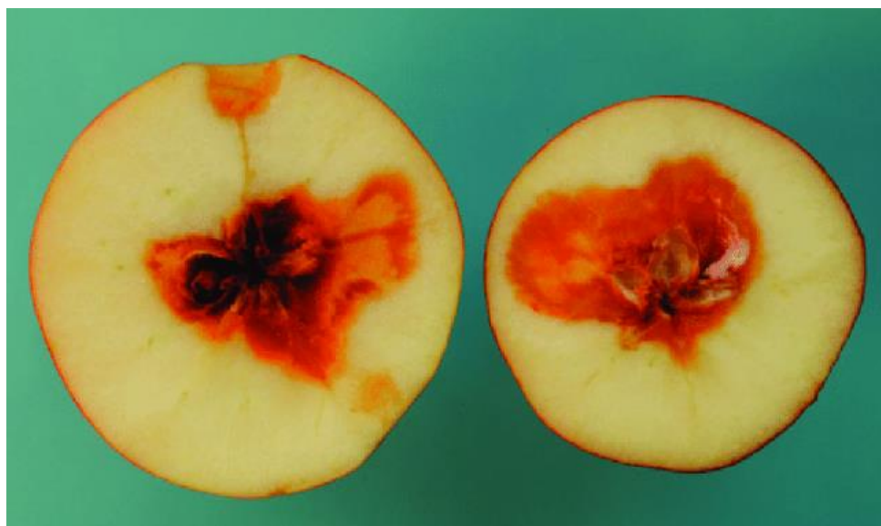
Slika 23. Vlažna trulež jabuke „Elstar“ uzrokovana Fusarium avenaceum

Jabuke se drže u hladnjači s kontroliranom atmosferom 9 do 12 mjeseci i vrlo su podložne propadanju nakon berbe. Fusarium avenaceum je patogen za koji se pokazalo da je najčešći uzročnik truleži na plodovima jabuke. F. avenaceum proizvodi i niz mikotoksina, uključujući moniliformin, akuminatopiron i krizogin, koji su od primarne važnosti za industriju prerade jabuka (Kou i sur., 2014.)