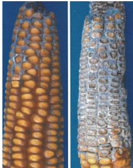
Slika 9. Simptomi truleži klipa kukuruza uzrokovane gljivom Fusarium graminearum.

periteciji, plodišta telemorfnog stadija gljive Gibberela zaeae , u kojima nastaju askusi s askosporama (Lević i sur., 2004).