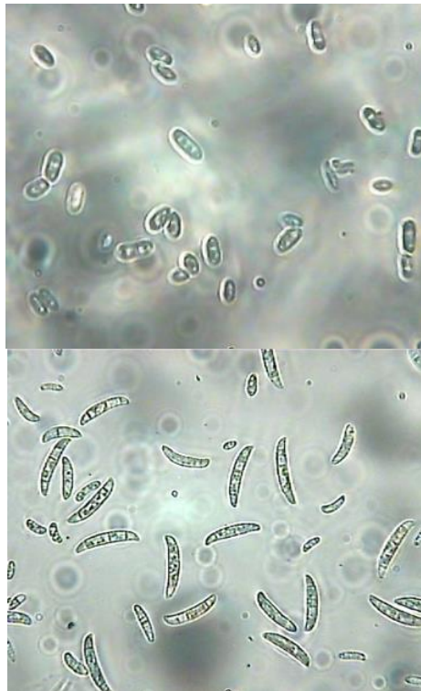
Slika 1. Razlike između mikro i makrokonidija roda Fusarium

Do prije nešto više od desetak godina glavni pristup za klasifikaciju Fusarium vrsta je bila morfologija, a primarno to je bilo formiranje nespolnih spora, prepoznatljivih makrokonidija, koje je prvi opisao Link. Fusarium vrste proizvode tri vrste spora makrokonidije, mikrokonidije (slika 1) i hlamidospore. Septirane makrokonidije se mogu formirati na monofijalidima i polifijalidima u zračnom miceliju, ali i na kratkim monofijalidima u specijaliziranim strukturama zvanim sporodohije. Makrokonidije su srpasto povijenog oblika, najčešće imaju tri do sedam septi, izdužena im je vršna stanica, a bazalna stanica je u obliku stopice (Booth, 1971.). Mikrokonidije se mogu razlikovati u obliku i veličini, a nastaju u zračnom miceliju, pojedinačno, u nakupinama (lažnim glavicama) ili nizovima, kako na monofijalidima tako i na polifijalidima. Hlamidospore su otporne strukture sa zadebljanim stjenkama i visokim udjelom lipida, mogu nastati na usred hifa ili na njihovim završetcima. Različiti oblik makrokonidija je važno obilježje, a prisutnost ili odsutnost makrokonidija i hlamidospora te karakteristike konidiogenih stanica doprinose razlikovanju vrsta (Moretti, 2009.).