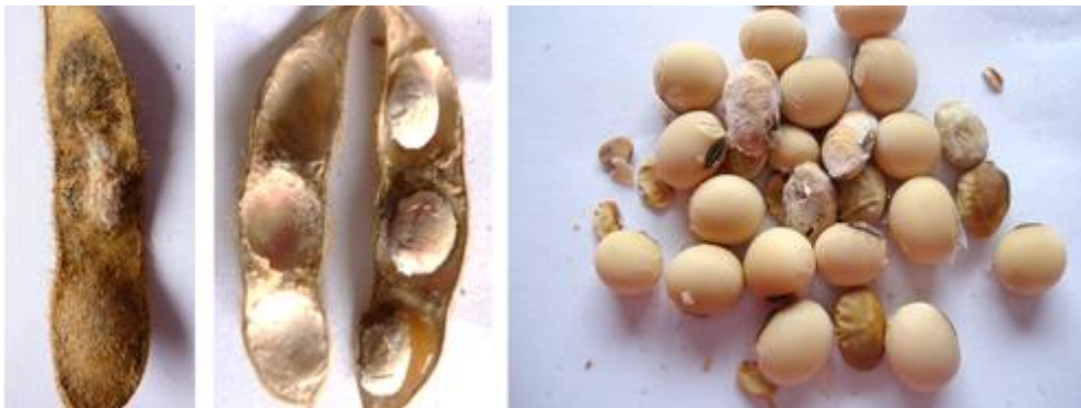
Slika 14. Simptomi na mahuni i zrnu soje uzrokovani Fusarium graminearum .

svih izolata. Fusarium acuminatum , Fusarium graminearum i Fusarium solani također su bile među najčešćim i najrasprostranjenijim vrstama. S nekoliko polja je utvrđeno jedanaest drugih vrstakoje čine manje od 10 % svih izolata. Nisu primijećeni konzistentni trendovi u zemljopisnoj distribuciji vrsta, ali je utvrđena varijabilnost učestalosti vrsta između faza razvoja soje. Fusarium oxysporum je utvrđen više tijekom vegetativnih stadija (40%) od reproduktivnih stadija (22%). Suprotno tome, vrste poput Fusarium acuminatum , Fusarium graminearum i Fusarium solani češće su utvrđeni iz biljaka u reproduktivnoj fazi.