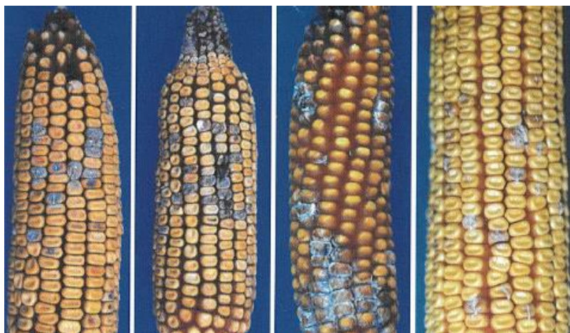
Slika 10. Simptomi truleži klipa kukuruza

Ponekad se u vrijeme berbe može uočiti pucanje perikarpa na kruni zrna ili na donjoj trećini zrna, što se kod poprečnog presjeka klipa vidi kao bijeli krug, a taj simptom uzrokuje Fusarium verticillioides . Fusarium proliferatum zahvaća mali broj zrna na kojima se stvara bijeli zračni micelij (Lević i sur., 2004).