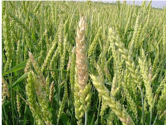
Slika 5. Simptomi zaraze Fusarium spp. (mliječna zrioba)

težine zrna, razgradnja granula škroba, uskladištenog proteina i staničnih stijenki (Ćosić i sur., 2013.).