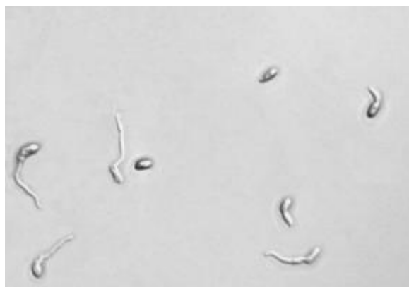
Slika 3. Klijanje mikrokonidija Fusarium oxysporum f. sp. lycopersici (izvor: Steinkellner i sur., 2005.)

Mikrokonidije mogu imati različit oblik: ovalan, elipsoidan, oblik toljage - kijačast, a mogu biti bez septi ili s 1-2 septe. Fusarium verticillioides stvara mikrokonidije u nizovima i lažnim glavicama. One su ovalne ili kijačaste, jednostanične ili rjeđe s jednom do dvije septe. Kod Fusarium subglutinans mikrokonidije su ovalne, jednostanične i skupljene u lažne glavice. Fusarium oxysporum (slika 3) mikrokonidije formira na zračnom miceliju u lažnim glavicama (Jurković, 1981.).