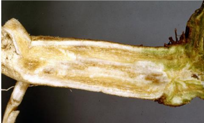
Slika 20. Fusarium oxysporum f.sp. niveum kao uzročnik bolesti na lubenici