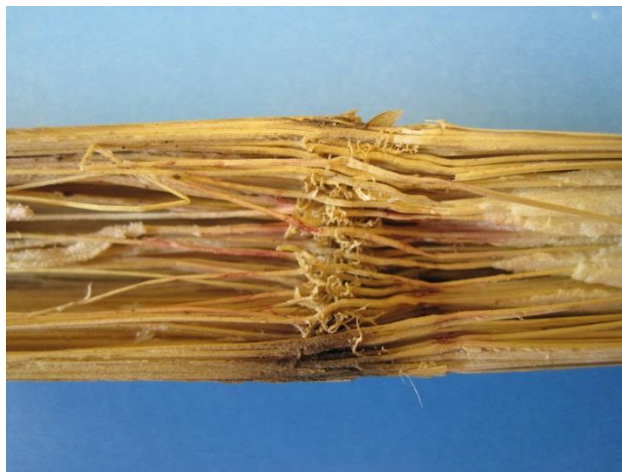
Slika 13. Trulež stabljike kukuruza uzrokovana vrstama roda Fusarium

Simptomi truleži stabljike kukuruza (slika 13) javljaju se kod osjetljivih hibrida nakon metličanja i svilanja, iako se prisutnost patogenih gljiva može dokazati i prije cvatnje, osobito kada se radi o sistemičnoj zarazi. Na najnižim internodijima, oko nodija, pojavljuju se tamne zone različitog oblika i veličine. Ukoliko bolest napreduje, stabljika poprima slamnato žutu do tamnu boju i postaje mekana. Pojava tamne, ružičaste ili crvene boje u parenhimu stabljika kao i kod korijena simptom je razvoja gljiva iz roda Fusarium (Jurković, 1981.).