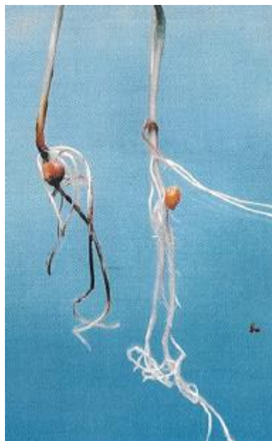
Slika 7. Trulež klijanaca kukuruza u uvjetima umjetne zaraze zrna gljivom Fusarium verticillioides (izvor: Lević i sur., 2004).

Iz zrna kukuruza je izolirano dvadesetak vrsta iz roda Fusarium od kojih su po učestalosti pojave najznačajniji Fusarium graminearum , Fusarium verticillioides (slika 7), Fusarium subglutinans te Fusarium proliferatum (slika 8) (Ćosić, 2001.). Vrste roda Fusarium uzrokuju različite simptome na bolesnim biljkama kukuruza kao što su trulež sjemena i klijanaca, trulež korijena i stabljika, trulež klipa i zrna kukuruza. Trulež sjemena ili klijanaca kukuruza ima za posljedicu prorijeđen usjev, a najčešće se javlja kod uzgoja u uskom plodoredu ili monokulturi te kao posljedica zaraženog sjemena. Tip simptoma, količina oborina i temperature nakon svilanja kukuruza, kao i tolerantnost pojedinih genotipova su osnovni parametri koji utječu na pojavu i intenzitet pojave truleži klipa. Drugi čimbenici, kao što su fiziološka i kemijska svojstva klipa, svile i zrna te trulež stabljike i oštećenja od štetnika također su važni za bolesti. Trulež klija i zrna uzrokovana Fusarium vrstama se očituju u jačem intenzitetu kod kukuruza koji se sije ranije kao i kod onih koji sporije otpuštaju vlagu iz zrna (Lević i sur., 2004).