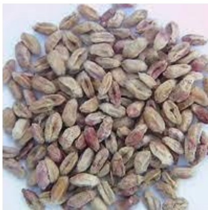
Slika 4. Zrna pšenice zaražena Fusarium graminearum u cvatnji

Do zaraze zrna dolazi od cvjetanja pa sve do kraja vegetacije, a najveće štete nastaju u godinama kada u cvjetanju i neposredno nakon njega prevladavaju visoke temperature, iznad 22 °C, uz visoku relativnu vlažnost zraka, iznad 85 %. Zrna zaražena neposredno nakon oplodnje su sitnija, smežurana i gube klijavost. Prisutstvo kolina i betaina, tvari koje proizvode prašnici, stimulira bujan razvoj micelija Fusarium graminearum na cvjetovima pšenice, a njihova se koncentracija povećava pod utjecajem parazita i stimulira razvoj gljive pa ovi procesi objašnjavaju sklonost gljive za razvoj na cvjetnim organima pšenice. Ako do zaraze dolazi kasnije u vegetaciji, zrna imaju normalniji izgled i masu, dobro su nalivena i ne gube klijavost (slika 4). Zaraženi mogu biti pojedini klasići, dio klasa ili cijeli klas (Ćosić i sur., 2013.).