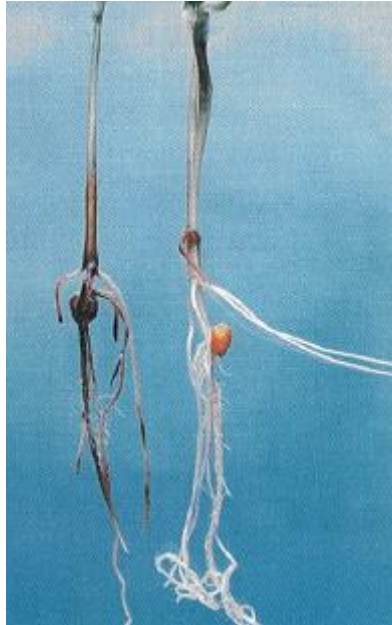
Slika 8. Trulež klijanaca kukuruza u uvjetima umjetne zaraze zrna gljivom Fusarium proliferatum (izvor: Lević i sur., 2004).

Ako se posiju zaražena zrna ona najčešće ne niču ili ako izniknu formiraju se klijanci koji se slabije razvijaju i na kraju mogu propasti. Izvor zaraze može biti gljiva prisutna u tlu pri čemu dolazi do infekcije zrna kukuruza na mjestima gdje je ono oštećeno od nematoda ili zemljišnih insekata. Tada dolazi do nekroze i propadanja klijanaca i mladih biljaka u ranoj fazi (1 - 2 lista), pri čemu korijen postaje taman i nekrotizira. Biljke koje prežive ovu fazu nastavljaju s rastom jer parazit prelazi u fazu mirovanja (Lević i sur., 2004).