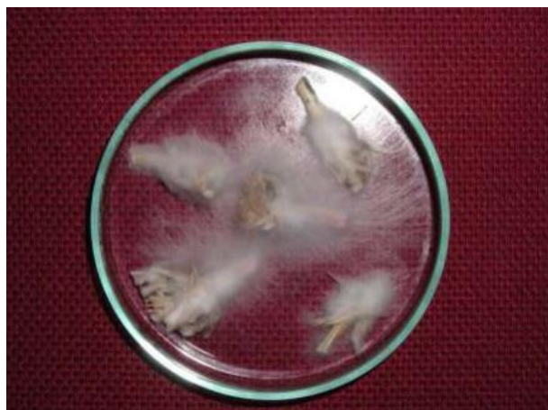
Slika 6. Fuzarijska trulež korijena i vlati ( http://www.fazos.unios.hr )