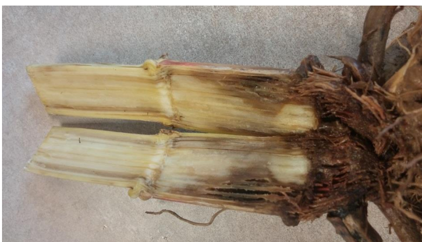
Slika 12. Trulež korijena kukuruza uzrokovana Fusarium vrstama

Infekcija korijena kukuruza (slika 12) parazitnim gljivama može nastupiti u najranijim stadijima razvoja, od klijanja sjemena pa do formiranja četiri lista. Ovaj tip bolesti poznat je kao palež klijanaca i često je posljedica unutrašnje ili dubinske zaraze zrna. Do zaraze može doći i iz tla, gdje se gljive održavaju u obliku saprofita. Na primarnom klicinom, a zatim i na bočnim-hipokotilnim korjenčićima vide se sitne, 1 - 2 mm duge svjetlo smeđe pjegice, koje se relativno brzo povećavaju. Širenjem pjega formira se prsten oko korijena u okviru kojeg tkivo nekrotizira. Kod razvijenijih biljaka i na jače razvijenom korijenju na mjestu zaraze nastaje ulegnuće. Zaraženo korijenje pred kraj vegetacije dobiva karakterističnu crvenu boju, što predstavlja jedan od simptoma fuzariozne truleži (Jurković, 1981.).