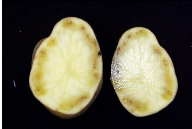
Slika 17. Suha trulež krumpira uzrokovana Fusarium vrstama

gomolja, a pokožica iznad zaraženog tkiva ulegne i nabora, često u koncentričnim krugovima. Zaraženo tkivo odumire, tamnosmeđe je boje, zbog gubitka vode se stvaraju šupljine, djelomično ispunjene micelijem gljive, a nakupine konidija u obliku sporodohija pojavljuju se na površini gomolja. Cijeli zaraženi gomolj se na kraju smežura i istrune (Sever i Miličević, 2013.).