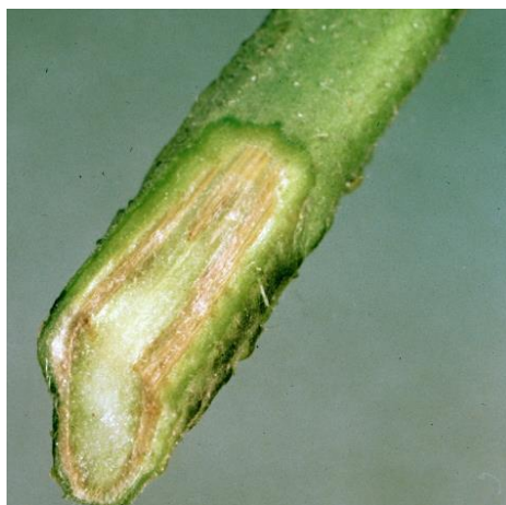
Slika 19. Fusarium oxysporum f. sp. lycopersici na stabljici rajčice

Za toplih dana napadnute biljke gube čvrstoću tkiva, a obično venu nakon zretanja prvih plodova. Ako stabljiku takve biljke presiječemo, vidjet ćemo da su provodni snopovi smeđe boje (slika 19). Parazit zatvara provodne snopove te na taj način onemogućuje normalan protok vode i hranjivih tvari (Ćosić i Vrandečić, 2015.).