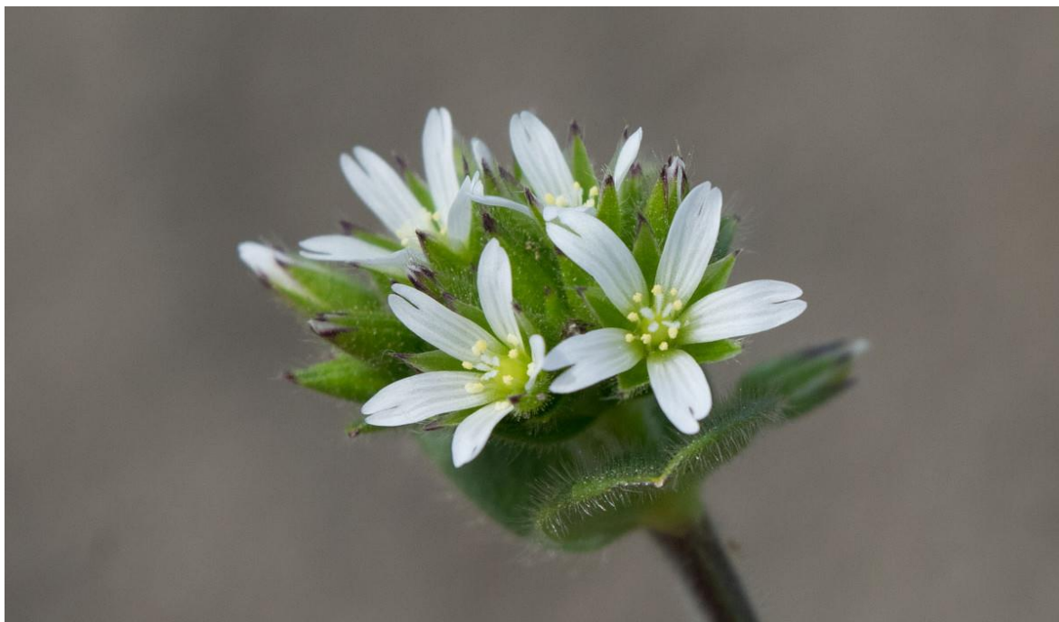
Slika 3. Paštistast cvat C. glomeratum

Može se koristiti kao ljekovita biljka, a kao krma je loša do bezvrijedna.