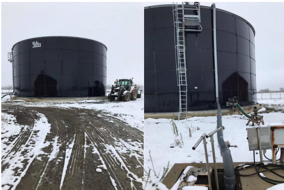
Slika 14. Bioplinsko postrojenje na poljodjelskom obrtu Srijem u Iloku

Na poljodjelskom obrtu Srijem u Iloku sustav izgnojavanja tekuće gnojnice iz tovilišta je uz pomoć pumpi, koje pogone gnojnicu putem kanala iz objekta u sabirnu lagunu koja se nalazi izvan objekta, i u kojoj se provodi biološka razgradnja.