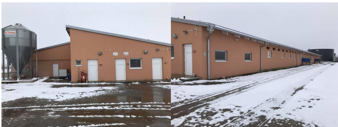
Slika 7. Objekt za tov svinja na poljodjelskom obrtu Srijem u Iloku

Kapacitet farme je 1400 tovljenika po turnusu. Na farmi se nalazi jedan veliki objekt koji služi za uslužni tov svinja, hladnjače za odlaganje uginulih životinja i lagune za odlaganje gnoja. Obitelj Zajec ima Ugovor s Belje plus d.o.o. za obavljanje uslužnog tova svinja. Belje plus d.o.o. im kao kooperantima osigurava kvalitetan genetski materijal, pruža savjetodavne usluge svojih stručnjaka, osigurava im usluge zdravstvene skrbi za životinje i opskrbljuje ih visokokvalitetnom stočnom hranom te sigurnim otkupom kod dogovorenih završnih tjelesnih masa.