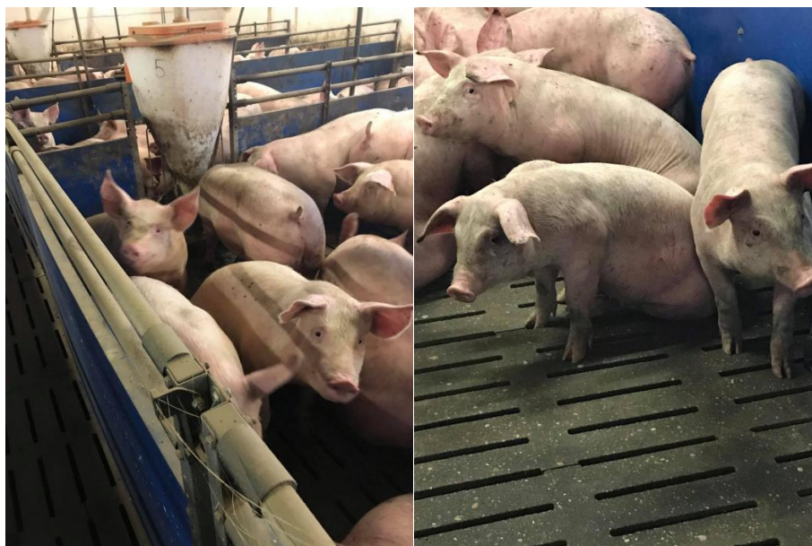
Slika 9. Trolinijski hibrid PIC na poljodjelskom obrtu Srijem u Iloku

Osnovne karakteristike ovako dobijenih hibrida (tovljenika) koji se koriste i na poljodjelskom obrtu Srijem (Slika 9.) su: robustan kostur, dobra otpornost, niska konverzija hrane (utrošak hrane po jedinici prirasta), kraći broj dana provedenih u tovu do željenih završnih tjelesnih masa, vrlo dobri tovni parametri, dobar odnos mesa i masti i to kod većih završnih tjelesnih masa, te vrlo dobra kvaliteta mesa.