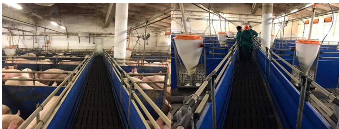
Slika 10. Unutrašnjost tovilista na poljodjelskom obrtu Srijem u Iloku

Farma je sastavljena od dvije velike i dvije manje prostorije. U velikim prostorijama nalaze se po 24 odjeljka, a u malim prostorijama po 12 odjeljaka (Slika 10.). U svakoj prostoriji nalaze se po dva grijača tijela (mastera), marke Big Dutchman, pogonjena na plin.