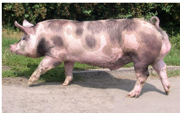
Slika 6. Pietren

Pietren je belgijska pasmina nastala križanjem domaće belgijske svinje, velikog jorkšira i berkšira. Ova pasmina stvorena je s ciljem visoke mesnatosti, te zato ima izuzetno izražene najkvalitetnije dijelove trupa (tzv. mesne partije). Tijelo mu je srednjeg okvira, crno-bijele boje, pokriveno crnim pjegama različite veličine. Ranozrela je pasmina, prasi 9 - 10 prasadi, prosječni dnevni prirasti se kreću oko 750 g, a konverzija iznosi 2,9 – 3,3 kg. Kvaliteta mesa nešto je niža, jer često dolazi do pojave tzv. BMV mesa (bljedo, mekano i vodnjikavo), te nije pogodno za preradu u suhomesnate proizvode. Do dolaska hibrida na tržište, ova pasmina glasila je za najmesnatiju svinju u svijetu (64 % mesnatost).