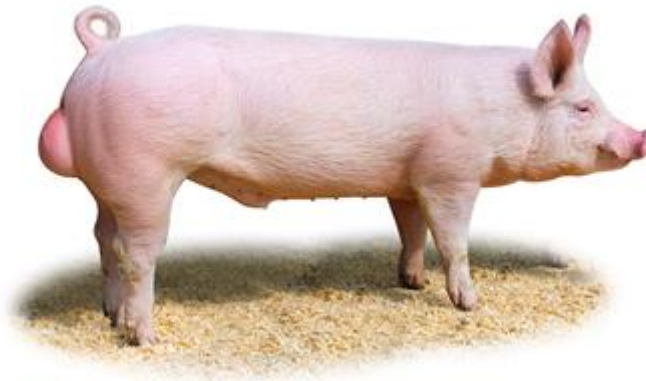
Slika 4. Veliki jorkšir

Veliki jorkšir - je jedna od najraširenijih pasmina svinja u svijetu. Nastala je u Engleskoj, križanjem malog jorkšira s domaćom engleskom svinjom. Ima dug, širok i dubok trup, srednje dugu glavu, dosta široku u čeonom dijelu s ulegnutim profilom. Uši su dosta velike i uspravne. Leđna linija je ravna, a plećke i butovi su dobro razvijeni. Koža je obrasla finom čekinjom bijele boje. Plodnost krmača je vrlo dobra i kreće se od 10 do 12 prasadi u leglu. Krmače su izrazito dobre majke i dobre su mliječnosti. Tovljenici imaju relativno visok prosječni dnevni prirast u tovu od 800 - 850 g, uz utrošak hrane ispod 3 kg za kilogram prirasta. Postotak mišićnog tkiva u polovicama kreće se od 55 do 60%. U tovu sa 6 - 7 mjeseci starosti tovljenici postižu težinu od 100 do 110 kg. Može se reći da je to univerzalna pasmina snažne konstitucije i pogodna za različite namjene u uzgojnom i proizvodnom pogledu. Kod križanja sa drugim pasminama koristi se najčešće kao majčinska linija.