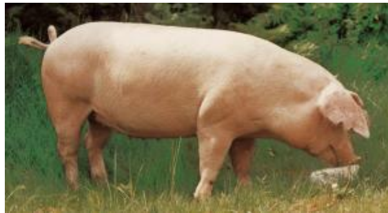
Slika 2. Švedski landras

Švedski landras je pasmina koja je svojom vanjštinom i proizvodnošću slična danskom landrasu, a pretežno je zastupljen u uzgoju na području Europe. Kod nas je bio najzastupljeniji predstavnik landrasa, zahvaljujući njegovoj izuzetnoj sposobnosti prilagodbe i klimatizacije na različite klimatske i proizvodne uvjete. Krmače maju dobru plodnost, veličina legla im je od 10 do 12 prasadi, a poznate su po dobroj mliječnosti i po dobrim majčinskim osobinama. U selekcijskim postupcima križanja, krmače švedskog landrasa koristimo kao majke zbog dobre plodnosti i to najčešće u križanjima s nerastima velikog jorkšira.