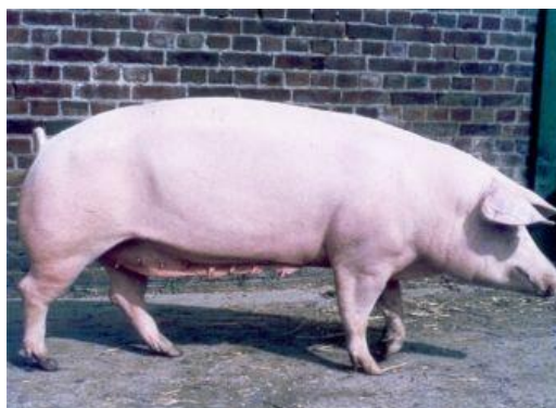
Slika 3. Njemački landras

Njemački landras je nastao oplemenjivanjem njemačke oplemenjene svinje s nerastima nizozemskog landrasa. Ima glavu s blago ulegnutim profilom i klopavim ušima. Ima dug, dubok te širok trup i izrazito mišićava leđa. Krmače prase u prosjeku oko 10 prasadi u leglu. U križanjima se koristi kao terminalna pasmina radi popravljivanja mesnatosti. Uzgojena su dva tipa njemačkog landrasa: tip A koji ima bolje izraženu plodnost i tip B koji ima izraženiju mesnatost trupova.