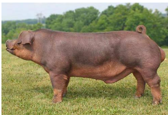
Slika 5. Durok