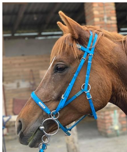
Slika 13. Profesionalna endurance oglavina