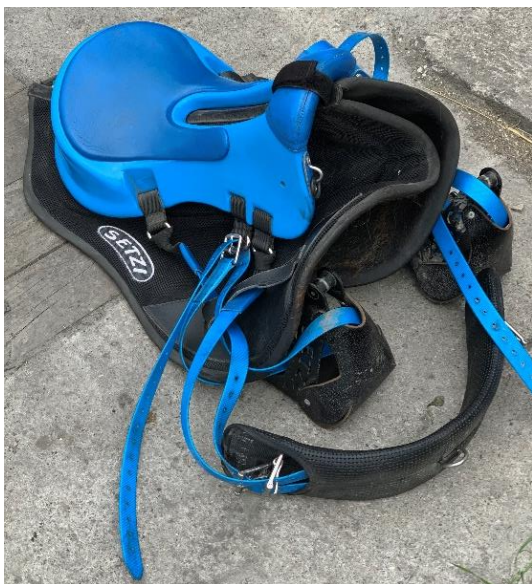
Slika 12. Profesionalno endurance sedlo marke Setzi

Pravilno pričvršćena zaštitna kaciga obavezna je za sve osobe na svim natjecanjima dok su na konju. Za sve osobe do navršanih 16 godina starosti obavezan je sigurnosni prsluk. Sigurnosna obuća s petom od najmanje 12 mm ili više, ako natjecatelj jaši u obući bez pete obavezno je da na uzengijama (stremenima), ima zaštitne košarice kako noga ne bi prošla kroz uzengiju. U disciplini endurance nema posebnih ograničenja i pravila za sedlanje i uzdanje, ali oprema mora biti u ispravnom stanju te mora biti pravilno postavljena i pričvršćena. Zabranjena je upotreba izvezica i uzda koje sputavaju slobodno kretanje glave i vrata konja. Ako se koristi martingal uzde moraju imati leptiriće. U pojedinim vrstama natjecanja ove discipline reflektirajuća oprema u propozicijama natjecanja može se navesti kao obavezna. Zabranjena je upotreba bičeva ili korbača te bilo kojih drugih predmeta iste namjene. Dozvoljena je upotreba mobitela i GPS-a. Sva ostala komunikacijska oprema mora biti odobrena od strane sudačkog vijeća prije natjecanja.