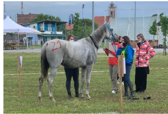
Slika 8. Veterinarski pregled