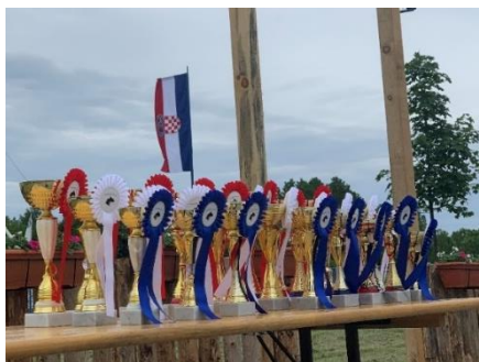
Slika 9. Pehari i rozete kao nagrade

Natjecateljski par koji je u najkraćem vremenu savladao stazu bit će proglašen pobjednikom natjecanja, ako je uspješno prošao sve završne veterinarske preglede. Za ekipni plasman pobjednička ekipa je ona koja ima najviše bodova nakon zbrajanja završnih rezultata svih plasiranih natjecatelja jednog kluba. U slučaju neriješenog rezultata dviju ekipa, pobjednička je ona koja ima manje članova. Kada dva ili više natjecatelja koji su startali zajedno imaju jednako ukupno vrijeme provedeno na stazi, njihov se poredak određuje prema redoslijedu prolaska kroz ciljnu crtu. Mrtva utrka označava situaciju kada u startu po grupama, dva ili više natjecatelja imaju jednako ukupno vrijeme provedeno na stazi. Njihov se poredak računa prema najmanjem vremenu provedenom na zadnjoj etapi utakmice.