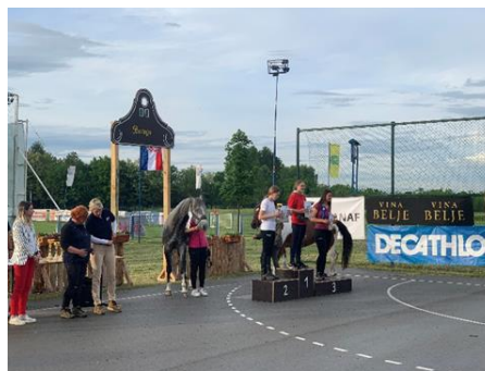
Slika 10. Proglašenje pobjednika