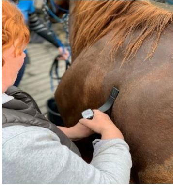
Slika 7. Elektronički način mjerenja pulsa

licencirani član Veterinarskog Vijeća. Najveći dozvoljeni puls za prolaz na veterinarskom pregledu je 64 otkucaja u minuti. Način na koji puls može biti izmjeren je stetoskopom i štopericom ili elektroničkim sustavom za mjerenje pulsa. U današnje vrijeme najčešće se koriste elektronički mjerači pulsa (pulsometar) koji se prislanja uz lijevu stranu grudnog koša u visini lakta (Pravilnik daljinskog jahanja, HKS, 2020.).