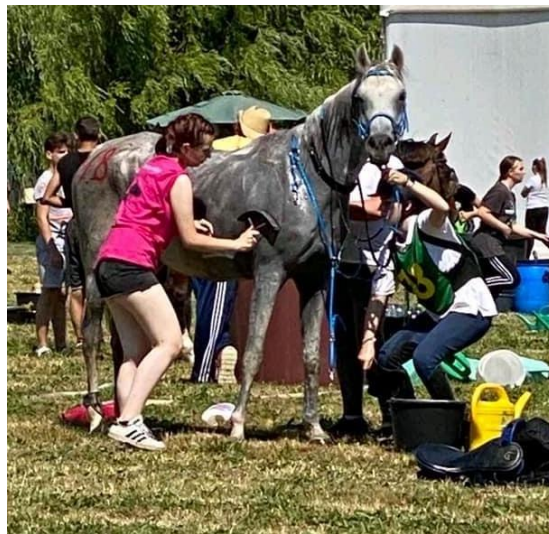
Slika 14. Logističar pomaže jahaču ohladiti konja

Osim što konj i jahač moraju dobro surađivati kako bi ostvarili što bolji rezultat, za svaki jahači par neophodna je dobro organizirana logistika. Logistiku čine članovi kluba koji se ne natječu, ali svojim klupskim kolegama pomažu tako što sedlaju konja, osiguravaju tekućinu za konja i jahača, brinu se za opremu, a ukoliko jahač dođe umoran s etape logističar mora biti na raspolaganju obaviti veterinarski pregled umjesto samog jahača. Kada jahač dođe sa staze logističari preuzimaju konja, rasedlavaju ga i hlade. Hlađenje je postupak s kojim konju spuštamo puls. Za svakoga konja postoji različita metoda hlađenja, dok jednom konju odgovara polijevanje vodom, drugom konju više odgovara lagana šetnja. Zbog toga jahač mora dobro poznavati svog konja kako bi metodom koja više odgovara njegovom konju što lakše i brže spustio puls. Za logistiku je poželjno da zna što više pravila o daljinskom jahanju, da ima iskustva s konjima i da poznaje konja kojem je logističar. Logistika mora djelovati brzo ali bez širenja nervoze. Bez dobre i organizirane logistike teško je postići uspješne rezultate na natjecanju daljinskog jahanja.