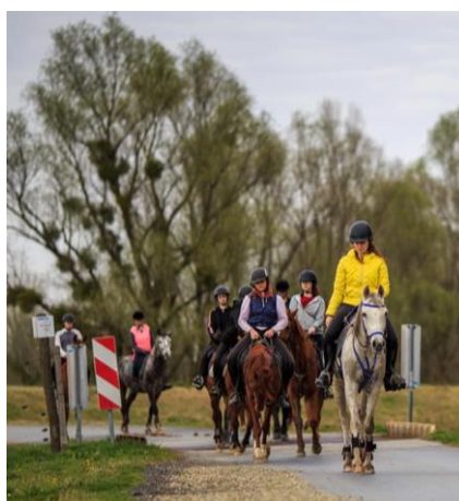
Slika 5. Trening pred natjecanje daljinskog jahanja

Veoma je bitno obratiti pozornost na kvalitetu i vrstu tla na kojem konj trenira. Izrazito tvrde podloge kao što su beton i makadam mogu dovesti do šepavosti konja i uzrokovati teže ozljede koje sprječavaju konja da prisustvuje natjecanju. Za sastavljanje plana treninga konja u obzir se mora uzeti tjelesna kondicija konja i mora mu biti pravilno prilagođena. Treba biti oprezan i razuman kada je treniranje u pitanju jer se ispred svega mora poštivati psihičko zdravlje konja. Nakon svakog treninga bitno je pravilno ohladiti konja kako bi se izbjeglo oticanje i ukočenost poslije treninga, te kako bi se tjelesna temperatura i krvni tlak vratili u normalu.