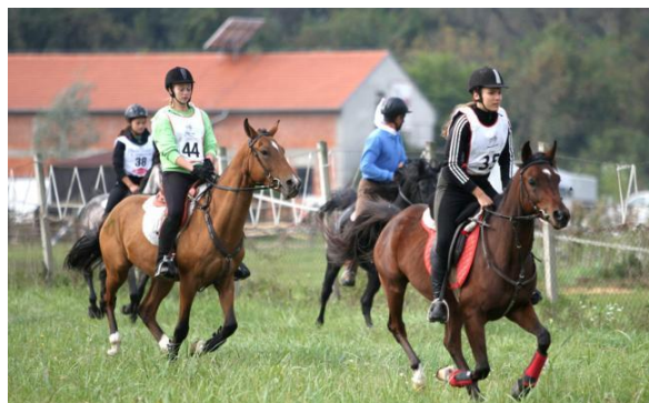
Slika 6. Prikaz masovnog starta (Croatia cup u Bilju, 2014).

Start može biti masovan ili u intervalima. Konj ne smije prijeći startnu crtu prije nego što sudac da znak za start. Ako se dogodi da natjecateljski par pogrešno starta, mora se vratiti i ponovno prijeći startnu crtu iako će se vrijeme starta računati od stvarnog znaka starta. Niti jedan natjecatelj ne smije startati 15 minuta poslije svog određenog vremena starta, u protivnom prijeti diskvalifikacija jahaćeg para. Kakav god bio način starta, svaki natjecateljski par mora istrčati etape kao da je sam i da se natječe s vremenom.