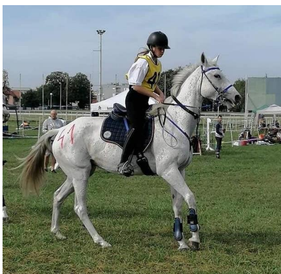
Slika 11. Endurance jahačica i konj pod punom opremom prije starta

U skladu s pravilnikom Hrvatskog konjičkog saveza natjecatelj može biti svaka osoba od najmanje 14 godina starosti. Na natjecanju može sudjelovati kao pojedinac ili kao član ekipe, jedini uvjet je da posjeduje natjecateljsku licencu za tekuću godinu izdanu od Hrvatskog konjičkog saveza. Natjecatelji od 10 do 14 godina mogu se natjecati isključivo uz pratnju mentora i uz važeću jahaću licencu. Mentor može biti osoba starija od 18 godina koja posjeduje natjecateljsku licencu daljinskog jahanja i tri uspješno završene utakmice. Jahač junior i jahač koji je mentor, startaju zajedno i cijelo vrijeme moraju jahati zajedno, isto je tako obavezno da se jahač junior i jahač mentor pojave zajedno na veterinarskim vratima. Jedan mentor može voditi najviše četiri jahača. Kada mentor vodi jednog ili više jahača za start sljedeće etape, uzima se vrijeme starta najsporiјeg jahača iz skupine. U slučaju da mentor mora odustati od utakmice dozvoljava se promjena mentora na prijedlog šefa ekipe u kojoj se jahač natječe. Mentoru nije dozvoljeno odustati od već prihvaćenog mentorstva.