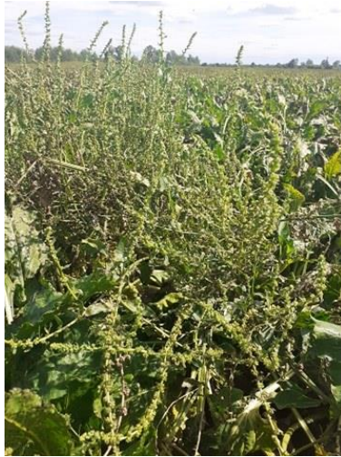
Slika 2. Šećerna repa u drugoj godini