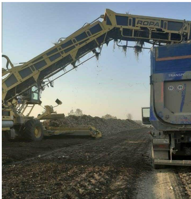
Slika 9. Pročištač za repu i kamion