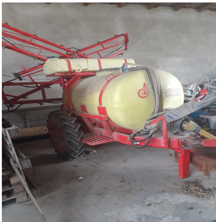
Slika 7. Prskalica