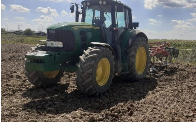
Slika 4. Srednje duboko oranje John Deere i TerraCult