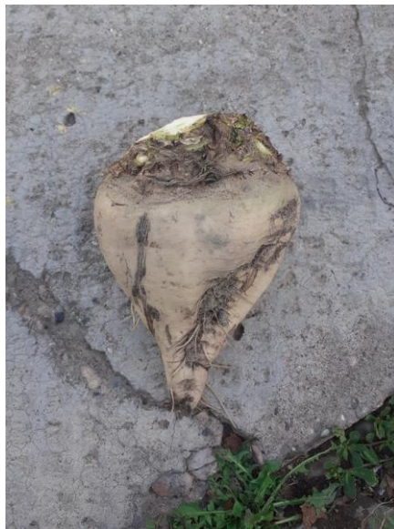
Slika 3. Korijen šećerne repe