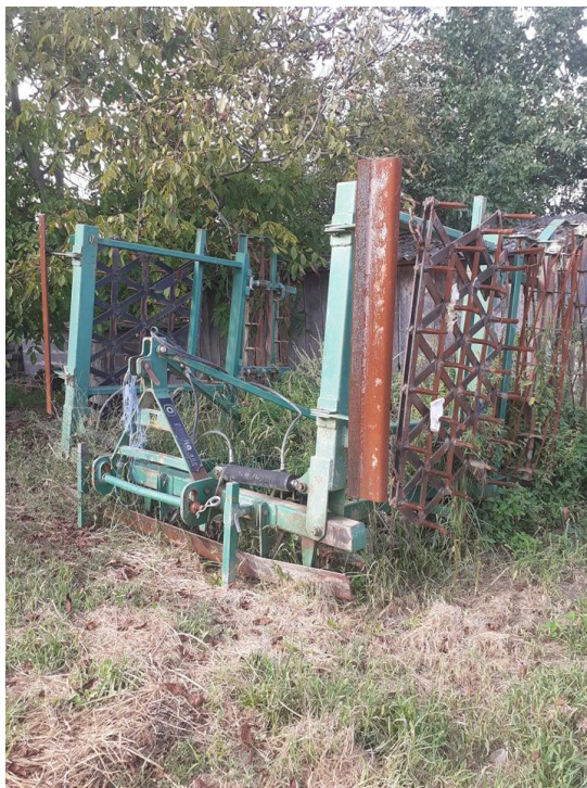
Slika 6. Sjetvospremač Pecka

strojevima da se postigne mrvičasta struktura. Tanjurača se koristi samo ako je propust kod osnovne obrade.