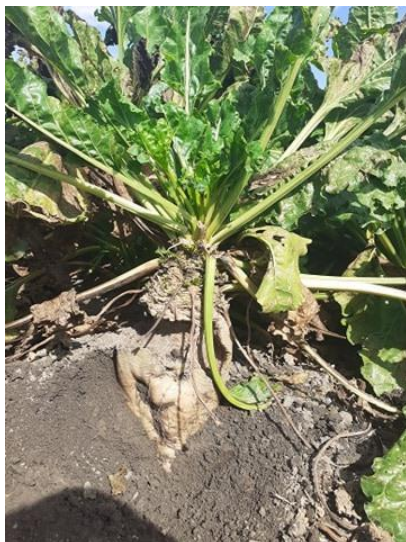
Slika 1. Šećerna repa u prvoj godini

Šećerna repa pripada porodici Chenopodiaceae , a porijeklo vuče iz Mediteranskog podneblja. Latinski naziv za klasifikaciju biljke je Betta vulgaris var. Saccharifera . Popularan je i naziv „kraljica ratarstva“ zbog karakteristične krune od lišća. Šećerna repa je dvogodišnja biljka, u prvoj godini formira svoj zadebljali korijen i lisnatu rozetu, a u drugoj godini daje stabljiku s cvjetovima, plodom i sjemenom. Na glavnom korijenu šećerne repe razlikuju se glava korijena koja je vršni dio korijena, razvija se iznad površine zemlje i nosi lisnatu rozetu i ožiljke osušenih listova, sadrži malo šećera a puno celuloze i prilikom vađenja glava korijena se odsijeca, zatim idem vrat korijena koji se nalazi ispod glave korijena i najširi je dio korijena, ne nosi listove i bočno korijenje i prilikom vađenje vrat se također ne odsijeca, tijelo korijena pojavljuje se na mjestu gdje se nalaze dublje raspoređene brazde u kojima se nalaze korijenove dlačice odnosno bočno korijenje koje upija vodu i hranjive tvari iz tla, tijelo korijena sadrži najveći dio šećera, rep korijena prelazi u kapilarno korijenje i može prodrijeti u dubinu od 2 do 2,5 metra, ako u oraničnom sloju nema dovoljno vode, uloga repe i kapilarnog korijenja je upijanje vode iz dubljih slojeva tla. (Stanačev, 1979.)