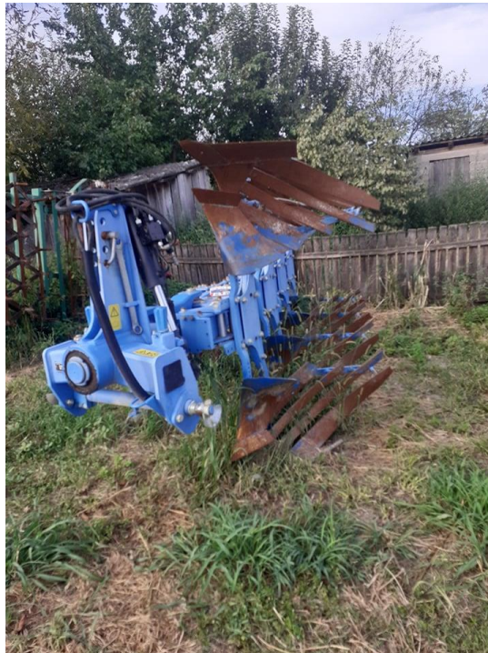
Slika 5. Duboko oranje s plugom Lemken VariOpal 8