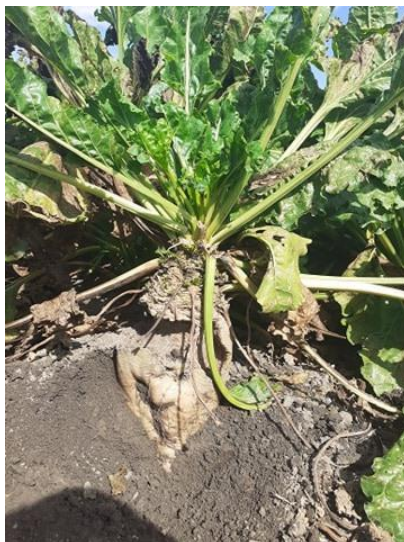
Slika 1. Šećerna repa u prvoj godini

Šećerna repa pripada porodici Chenopodiaceae , a porijeklo vuče iz Mediteranskog podneblja. Latinski naziv za klasifikaciju biljke je Betta vulgaris var. Saccharifera . Popularan je i naziv „kraljica ratarstva“ zbog karakteristične krune od lišća. Šećerna repa je dvogodišnja biljka, u prvoj godini formira svoj zadebljali korijen i lisnatu rozetu, a u drugoj godini daje stabljiku s cvjetovima, plodom i sjemenom. Na glavnom korijenu šećerne repe razlikuju se glava korijena koja je vršni dio korijena, razvija se iznad površine zemlje i nosi lisnatu rozetu i ožiljke osušenih listova, sadrži malo šećera a puno celuloze i prilikom vađenja glava korijena se odsijeca, zatim idem vrat korijena koji se nalazi ispod glave korijena i najširi je dio korijena, ne nosi listove i bočno korijenje i prilikom vađenje vrat se također ne odsijeca, tijelo korijena pojavljuje se na mjestu gdje se nalaze dublje raspoređene brazde u kojima se nalaze korijenove dlačice odnosno bočno korijenje koje upija vodu i hranjive tvari iz tla, tijelo korijena sadrži najveći dio šećera, rep korijena prelazi u kapilarno korijenje i može prodrijeti u dubinu od 2 do 2,5 metra, ako u oraničnom sloju nema dovoljno vode, uloga repe i kapilarnog korijenja je upijanje vode iz dubljih slojeva tla. (Stanačev, 1979.)