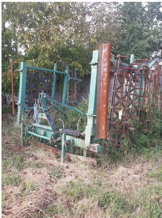
Slika 6. Sjetvospremač Pecka

strojevima da se postigne mrvičasta struktura. Tanjurača se koristi samo ako je propust kod osnovne obrade.