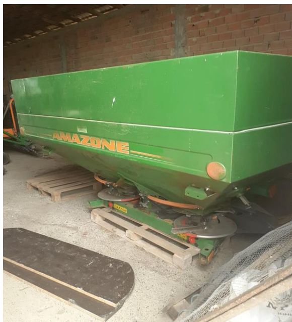
Slika 8. Rasipač Amazone za bacanje gnojiva