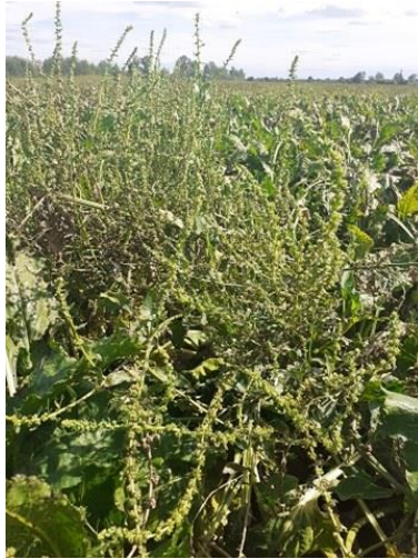
Slika 2. Šećerna repa u drugoj godini