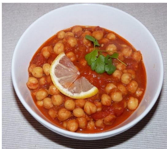
Slika 17. Kuhani slanutak

Kao i ostale vrste iz ove porodice slanutak je vrijedna namirnica, a u mnogim je zemljama u razvoju važan izvor bjelančevina u ljudskoj prehrani. Najviše se koristi kao kuhano zrelo zrno, a mlado zrno može se jesti i prijesno (Slika 17.). U Makedoniji se zrelo zrno nakon namakanja prži i koristi na isti način kao i prženi kikiriki. Sitnozrni kultivari upotrebljavaju se u smjesi s ječmom za kavovine. Brašno od slanutka dodaje se u proizvodnji kruha za poboljšanje kvalitete i hranjivosti (Lešić i sur., 2002.).