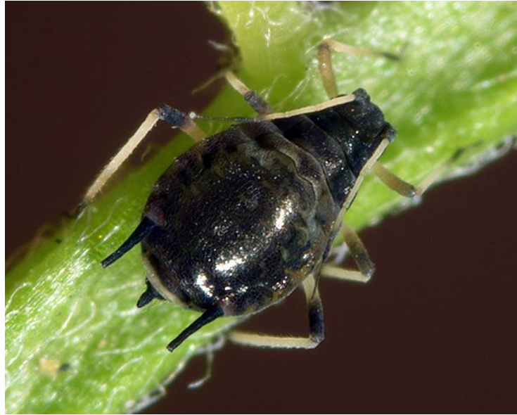
Slika 16. Crna Uš