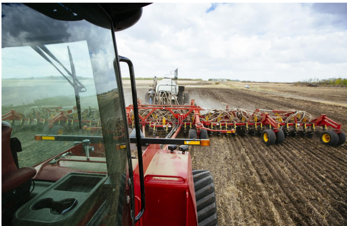
Slika 6. Sjetva slanutka

sije od kasne jeseni do ranog proljeća. Način sjetve različit je u različitim područjima, ovisno o mogućnosti mehanizirane žetve, spomenuti autori navode razmak redova 70 do 30 cm, a razmak u redu 10 do 30 cm, što pretpostavljaju potrebu sjemena od 50 do 150 kg/ha, ovisno o krupnoći. Kojnov i Radkov (1982.) spominju sjetvu u redove ili trake na bazi 40 do 50 biljaka/m 2 , a za sjetvu žitnom sijačicom 60 biljaka/m 2 . Ako se sije uz širi razmak redova, kad biljka naraste do 20 cm, provodi se međuredna obrada. Pri manjem razmaku primjenjuje se herbicidi između sjetve i nicanja, a prema potrebi i poslije nicanja (Lešić i sur., 2002.). Slanutak se dobro uklapa u sustav usjeva s izravnom sjetvom pod minimalnom obradom ili bez obrade tla. Korištenjem sijačica i sadilica dovodi do postizanja pravovremenosti u radu i pomaže u boljem klijanju i rastu usjeva. Kao i kod drugih mahunarki, slanutak je osjetljiv na oštećenja sjemena koja mogu nastati sijanjem žitnim sijačicama koje nisu pravilno podešene (Slika 6.). Međutim, žitne sijačice mogu se učinkovito koristiti pri sjetvi slanutka ako se brzina rada održava niskom, a brzina zraka bude dovoljno velika da se izbjegne začepljenje cijevi na sijačicama ( https://albertapulse.com/chickpea-planting/ ).