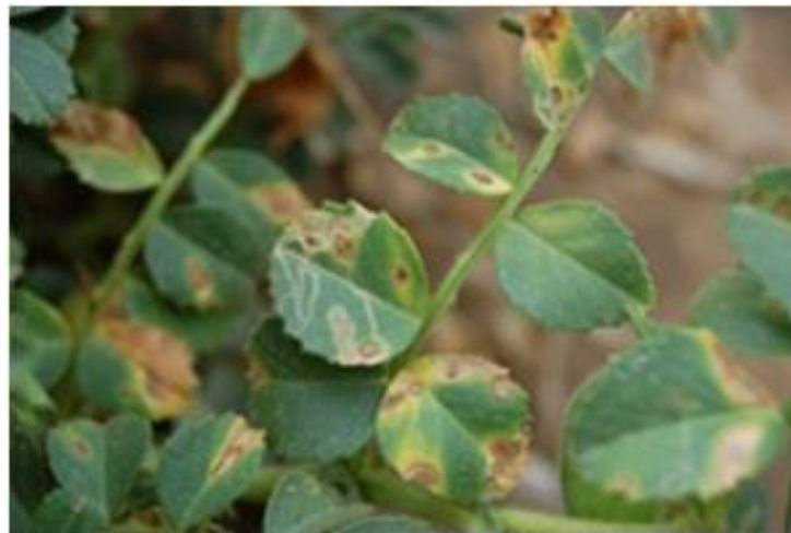
Slika 11. Zaraženo lišće slanutka