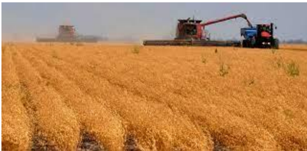
Slika 8. Žetva slanutka

Slanutak bez ljuske čuvat će se u hladnjaku do tjedan dana. Osušeni, oljušteni slanutak čuvat će se na hladnom i suhom mjestu i do godinu dana ( https://harvesttable.com ).