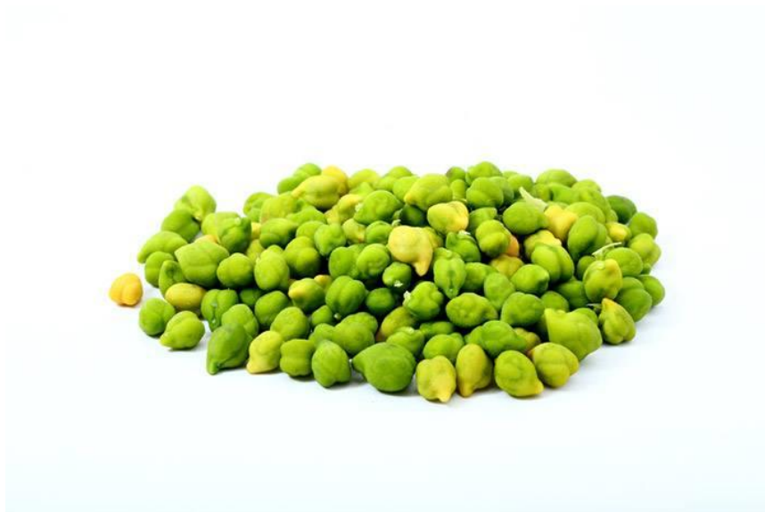
Slika 4. Zeleni slanutak

Zeleni slanutak jedna je od čestih sorti slanutka na tržištu. Također je vrlo sličan zelenom grašku po veličini, obliku i boji. Što se tiče okusa, može imati slađi okus od graška, osobito svježeg (Slika 4.).