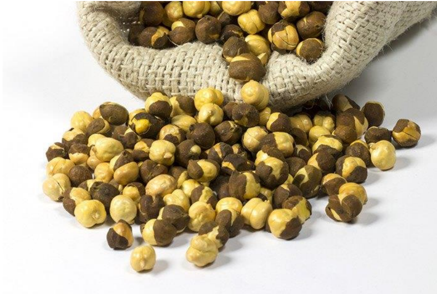
Slika 2. Slanutak Desi

Slanutak se može podijeliti na dvije priznate vrste, a to su Desi i Kabuli. Na prvi pogled možete razlikovati desi od kabuli-a. Desi (Slika 2.) slanutak obično je mali i izvana ima ljusku crne boje (Miles, 2017.).