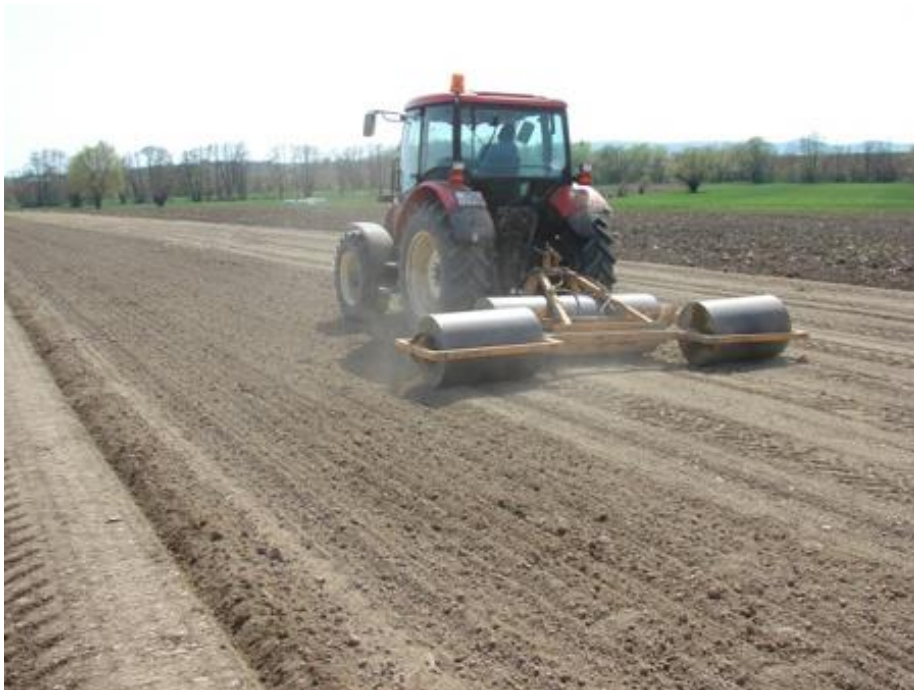
Slika 7. Valjanje poslije sjetve

Valjci (Slika 7.) su korisni u proizvodnji slanutka kao i u proizvodnji graška i leće. Ako je cilj valjanja potisnuti kamenje u tlo i poravnati tlo kako bi se olakšao rad noževa u žetvi, to treba učiniti prije nicanja. Također, valjanje nakon sjetve osigurava bolji kontakt sjemena sa tlom. Valjanjem nakon nicanja oštećuju biljke slanutka mehaničkim ozljedama zbog njihovih krutih stabljika. Treba izbjegavati valjanje ako je površina tla vlažna ( https://www.haifa-group.com/Chickpea ).