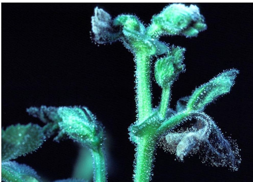
Slika 14. Siva plijesan na slanutku

Siva plijesan (Slika 14.) najvjerojatnije će se najprije pojaviti kao meka trulež u podnožju stabljike. Oštećena tkiva u početku se prekrivaju pahuljastom sivom plijesni. Kako bolest napreduje, zahvaćene biljke uvenu i odumiru. Ponekad je u starijih biljaka zahvaćeno samo nekoliko grana na biljci, a ostatak biljke izgleda sasvim normalno ( https://extensionaus.com.au/ ).