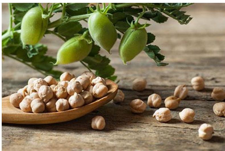
Slika 1. Sjeme slanutka

Sjeme (Slika 1.) u nas raširenih ekotipova nepravilno okruglog oblika, s ispupčenim hilumom, krem bijele ili žute boje, apsolutne težine 200 do 600g (Lešić i sur., 2002.).