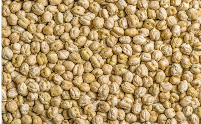
Slika 3. Slanutak Kabuli