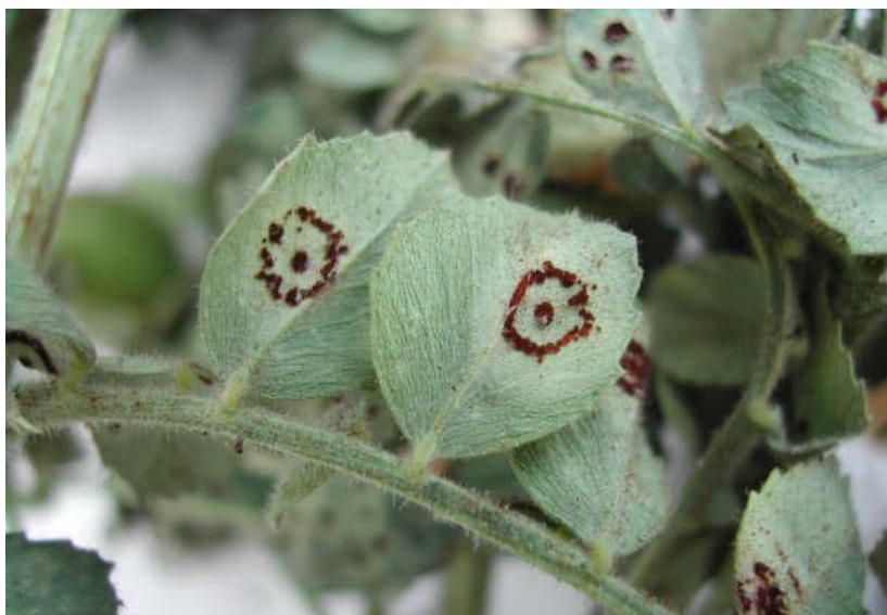
Slika 13. Hrđa na listu slanutka

Isprva se pojavljuju male, okrugle, smeđe mrlje. Mrlje su ponekad okružene klorotičnim pjegama. Često se pojavljuju u obliku prstena. Ako je infekcija jaka lišće može otpasti. Ostaci usjeva i zagađeno sjeme mogu potaknuti ponovnu infekciju. Visoke temperature u kasnoj sezoni, visoka vlaga i kasno navodnjavanje optimalni su čimbenici za infekciju (Slika 13.) (Chen i sur., 2011.).