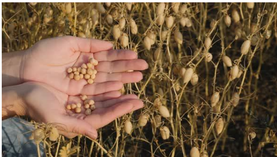
Slika 9. Zreli slanutak

zrele (žute do smeđe boje). Odgovornost korištenja desikanata kao što je glifosat pripada uzgajivaču. Glavna prednost korištenja glifosata prije berbe je višegodišnje suzbijanje korova. Također, može se zaustaviti ponovni rast slanutka u kasnoj sezoni ( https://www.haifa-group.com/ ).