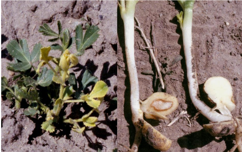
Slika 12. Fusarium uvenuće na sadnicama