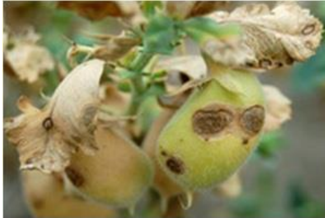
Slika 10. Zaraženo sjeme slanutka