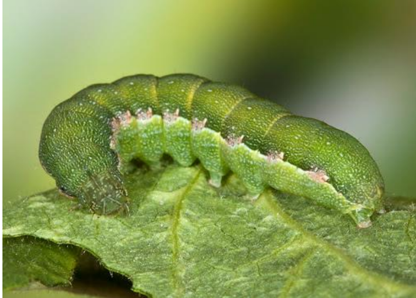
Slika 15. Karadrina

lišća. Ličinke su tamnozeleno do smeđe boje. Ozbiljna je štetočina slanutka u Indiji i Meksiku; Insekti mogu proći kroz 3 do 5 generacije godišnje (Slika 15.) ( https://plantvillage.psu.edu/topics/chickpea ).