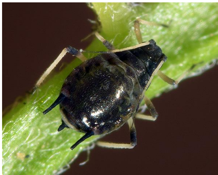
Slika 16. Crna Uš