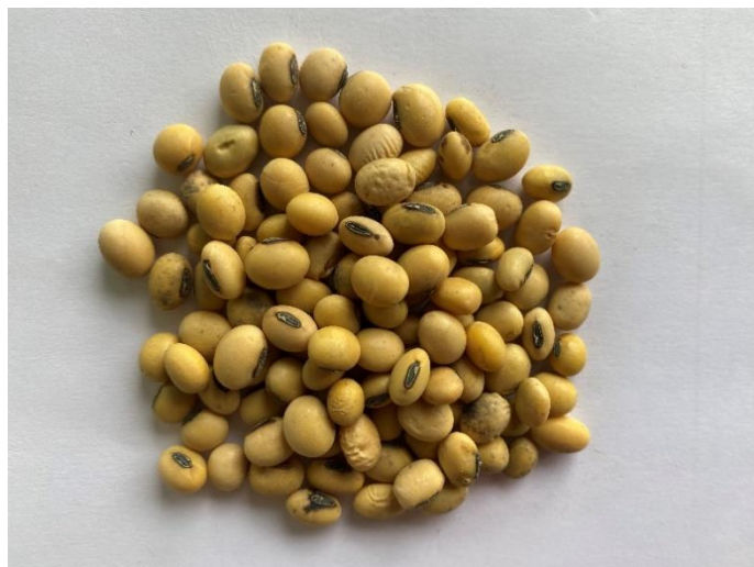
Slika 5. Kultivar Pedro

Kultivar Pedro je srednje rana sorta koja spada u 0-I grupu zrenja, potencijala rodosti iznad 5,5 t/ha, boja cvijeta je ljubičasta, boja dlačica smeđa, stabljika je srednje visoka do niska odlične otpornosti na polijeganje te odlične otpornosti na bolesti. Masa 1000 zrna iznosi 165-175 grama. Udio proteina iznosi do 40%, a ulja do 24%. Sadrži smanjeni udio antinutritivnih tvari TIAMg/g u odnosu na ostale kultivare soje. Količina sjemena u sjetvi iznosi 450000-550000 biljaka/ha (Izvor: https://bc-institut.hr/ ).