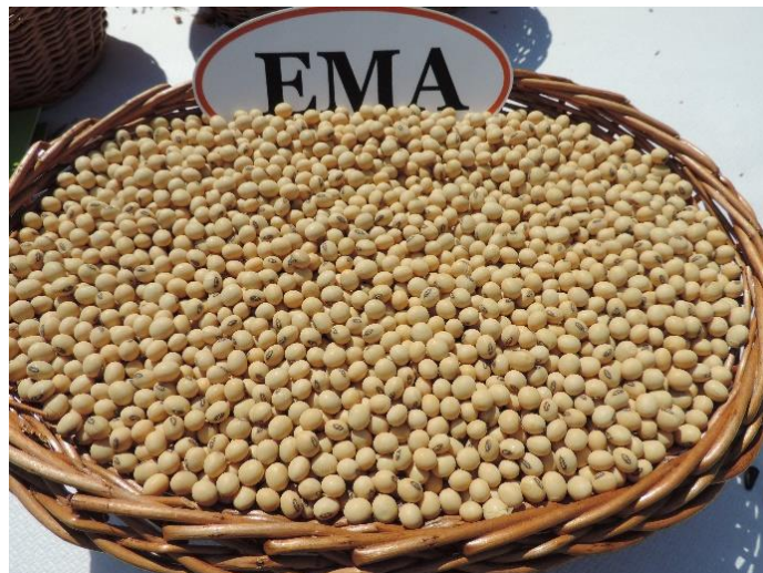
Slika 3. Kultivar Ema, (izvor: https://www.poljinos.hr )

Kultivar Apolo (slika 4) je srednje kasna sorta koja spada u I. grupu zrenja. Odlikuje ga visok potencijal rodosti koji iznosi više od 7 t/ha te stabilni prinosi. Ovojnica je žute boje kao i hilum. Stabljika je srednje visine obrasla sivim dlačicama. Kultivar je otporan na bolesti te je visoko prilagodljiv na različite uvjete proizvodnje ( www.poljinos.hr ).