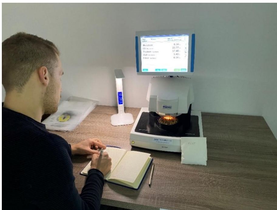
Slika 6. Analiza uzoraka na uređaju Perten DA 7250 AT-line NIR.

Bliska infracrvena spektroskopija (NIR) koristi se sve češće u poljoprivrednoj i prehrambenoj proizvodnji zbog svoje točnosti te brzine određivanja parametara koji se mjere. NIR tehnologija temelji se na spektroskopima infracrvenog svjetla u rasponu valnih duljina 730 – 2500nm. U istraživanju je korišten uređaj Perten DA 7250 At-line NIR (slika 5) američkog proizvođača mjernih analizatora Perkin Elmer (slika 6).