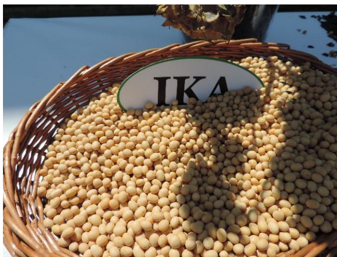
Slika 1. Kultivar Ika

Grupe zriobe predstavljaju dužinu vegetacije. Prema dužini vegetacije, soju je moguće podijeliti u 13 grupa zriobe pri čemu grupa 000 predstavlja najraniju zriobu, a X najkasniju. U istraživanju su korištene sorte grupe zriobe 00 (vrlo rane), 0 (rane), 0-I (srednje rane), I (srednje kasne). Za naše agroekološke uvjete, pri redovnoj sjetvi, najpogodnije su sorte iz grupe zriobe 00 (vrlo rane), 0 (rane), 0-I (srednje rane) i I (srednje kasne). Hrvatski kultivari su najzastupljeniji u istraživanju. U Hrvatskoj se sije više od 60% domaćeg sortimenta. Kultivar Ika (slika 1) nosi 25% zasijanih površina u Hrvatskoj.