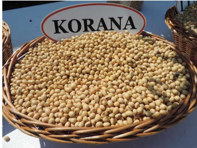
Slika 2. Kultivar Korana, (izvor: https://www.poljinos.hr )