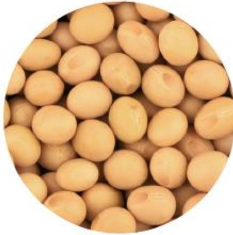
Slika 4. Kultivar Apolo, (Izvor: https://nsseme.com )

Optimalan sklop u sjetvi iznosi 450000 biljaka po hektaru zbog izrazito visokog potencijala grananja. Izrazito je tolerantna sorta na osipanje što doprinosi lakšom žetvom (Đukić i sur., 2015.).