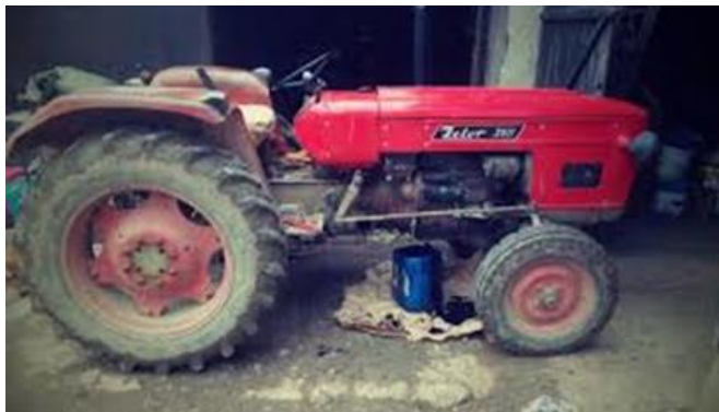
Slika 2. Ispuštanje motornog ulja u posudu

Otpadno motorno ulje najčešće kao otpad nastaje kod izmjene ulja u motorima traktora, kombajna i drugih radnih strojeva. Tijekom zamjene, ulje se pažljivo ispušta u posudu (slika 2.) koja se zatim isprazni u plastičnu cisternu.