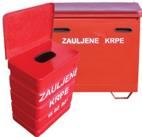
Slika 8. Spremnici za zauljene krpe