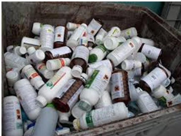
Slika 10. Kontejner s ambalažom sredstava za zaštitu bilja