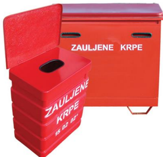
Slika 8. Spremnici za zauljene krpe