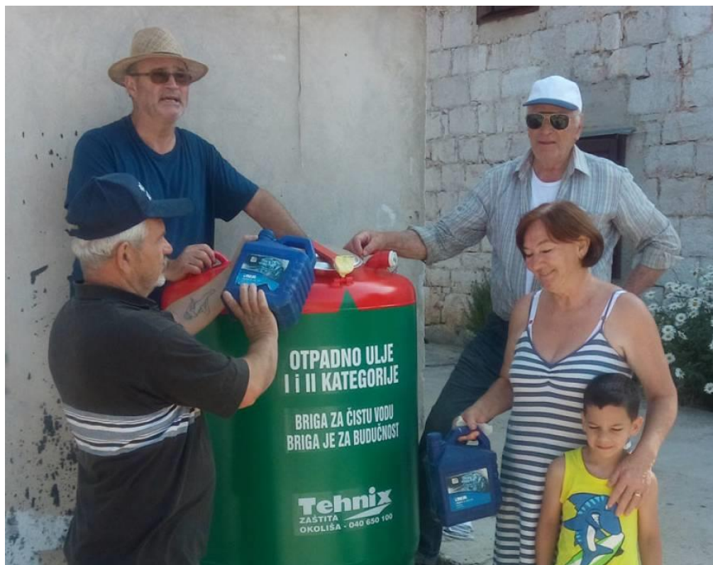
Slika 3. Odlaganje otpadnog ulja

Otpadna maziva ulja vrijedan su energent u energetskim i proizvodnim postrojenjima instalirane snage uređaja veće ili jednake 3 MW, jer se takvom uporabom sprječava onečišćenje okoliša. Gospodarenje otpadnim uljima obuhvaća postupke sakupljanja, pred obrade/kondicioniranja i njihovu regeneraciju ili materijalnu uporabu odnosno korištenje u energetske svrhe. Otpadna ulja kao jedna od vrsta posebnih kategorija otpada moraju se odvojeno sakupljati i skladištiti u odgovarajuće spremnike (slika 3.) odvojeno od ostalih vrsta otpada. Oporaba otpada je svaki postupak čiji je glavni rezultat uporaba otpada u korisne svrhe kada otpad zamjenjuje druge materijale koje bi inače trebalo uporabiti za tu svrhu ili otpad koji se priprema kako bi ispunio tu svrhu, u tvornici ili širem gospodarskom smislu. Oporaba otpadnih ulja označava postupke regeneracije i materijalne uporabe kojima se dobivaju novi proizvodi ili omogućuje ponovna uporaba otpadnih ulja ili postupak termičke obrade odnosno uporaba otpadnih ulja u energetske svrhe. (Izvor: http://www.fzoeu.hr/hr/gospodarenjeotpadom/posebnekategorijeotpada/otpadnaulja/ )