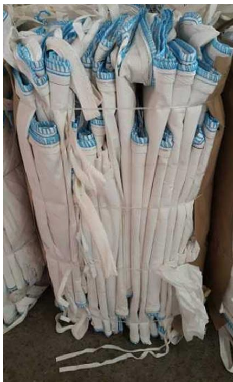
Slika 12. Skladištenje Big Bags vreća mineralnih gnojiva

Gnojivo treba odložiti ili skladištiti na udaljenosti od najmanje 10 metara od vodotokova ili drenaža zemljišta, te na dovoljnoj udaljenosti, najmanje 50 metara od bušotina, bunara i sličnih izvora vode. Ispravnim korištenjem rasipača gnojiva i pravilnim odlaganjem rasutog materijala i vreća spriječit će se otjecanje. Vreće štite od vlage i mehaničkih stresova. Napravljene su od polietilena (PE), polipropilena (PP), papira ili kombinacije tih materijala. Vreće treba protresti kako bi ih se što temeljitije ispraznilo. Ispitivanja su pokazala da se u tako ispražnjenim vrećama ostaci gnojiva nalaze samo u tragovima te se smatraju neopasnim za okoliš. Prazne vreće mogu se zbrinuti kao neopasna otpadna ambalaža ili se mogu vratiti dobavljaču radi recikliranja (slika 12). U recikliranju ambalaže treba se pridržavati smjernica državnih institucija. Neispravno gnojivo također treba odgovorno zbrinuti. Unatoč tome što se ne može iskoristiti za kvalitetnu primjenu, sadrži vrijedna hranjiva pa se stoga potrudite da ga skupite i koristite na preporučeni način. Ako se ne može koristiti, treba ga tretirati kao opasan otpad. (Izvor: https://www.yara.hr/ishrana-biljaka/sigurno-rukovanje-gnojivima/okoli-i-recikliranje/ )