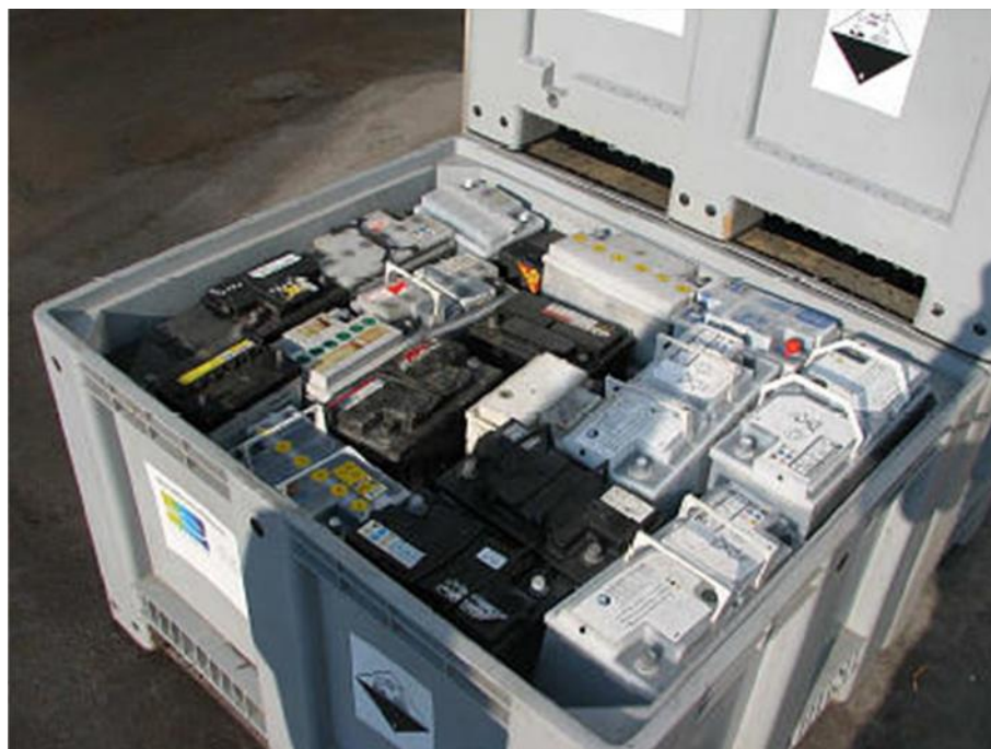
Slika 5. Spremnik za akumulatore