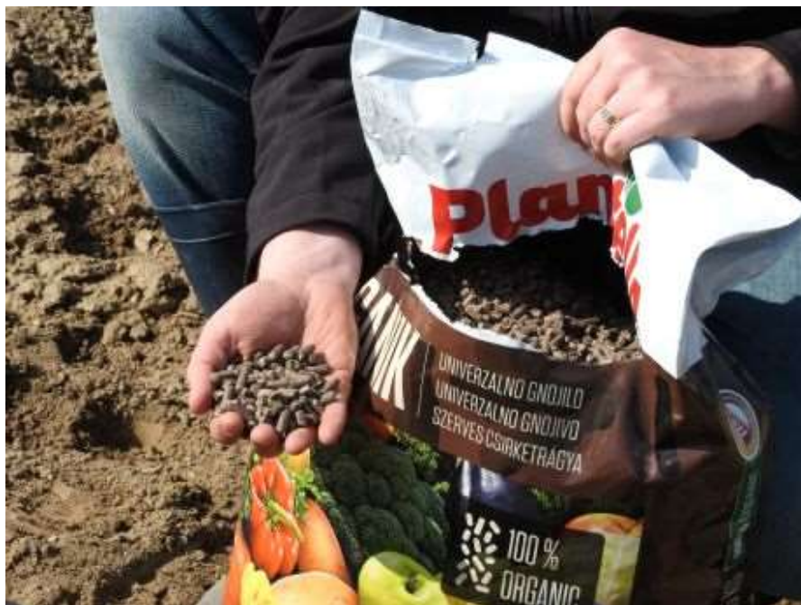
Slika 4. Organski peletirani stajnjak Plantella

Slika 3 prikazuje zemlju za orhideje koja se koristi u supstratu kako bi bio propusniji. Čestice u zemlji za orhideje su velike i pomažu u uspostavljanju idealnog vodozračnog omjera u supstratu. Udio u supstratu je 15 %.