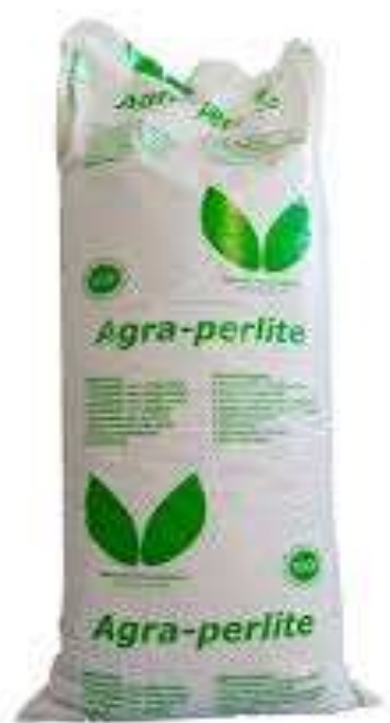
Slika 2. Perlit

Slika 1 prikazuje Hawita zemlju potrebnu za mješavinu supstrata čiji udio u supstratu iznosi 50 %.