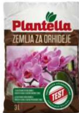
Slika 3. Zemlja za orhideje Plantella

Slika 3 prikazuje zemlju za orhideje koja se koristi u supstratu kako bi bio propusniji. Čestice u zemlji za orhideje su velike i pomažu u uspostavljanju idealnog vodozračnog omjera u supstratu. Udio u supstratu je 15 %.