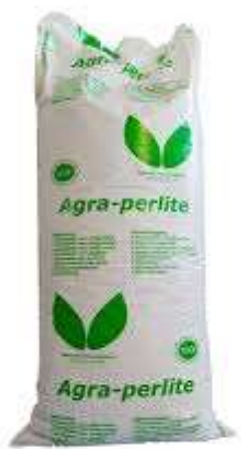
Slika 2. Perlit

Slika 1 prikazuje Hawita zemlju potrebnu za mješavinu supstrata čiji udio u supstratu iznosi 50 %.