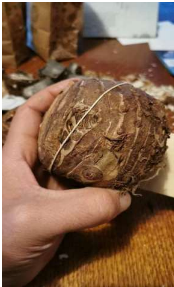
Slika 5. Gomolj kolokazije spreman za sadnju (izvor: autor)

Sadnja gomolja u vanjskim uvjetima započinje nakon stabilizacije temperatura, najčešće početkom ili sredinom lipnja kada dnevne temperature iznose između 24 i 26 stupnjeva celzijusa. Zbog relativno kratkog toplog vremenskog intervala na području Europe ove tropske biljke se rijetko sade u vanjskim uvjetima. Njihov uzgoj češće započinje u kontroliranim uvjetima: u zatvorenim, grijanim prostorima s dovoljnim osvjetljenjem i visokom vlagom u zraku. Takav način uzgoja započinje početkom ožujka kako bi do početka lipnja biljke bile dovoljno odrasle i snažne za nastavak uzgoja na otvorenom.