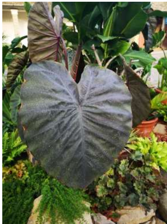
Slika 7. Kolokazija Diamond head