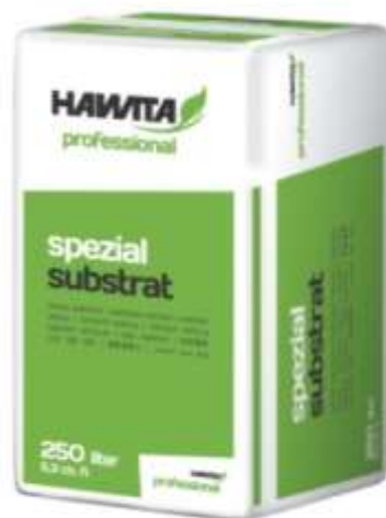
Slika 1. Hawita Potgrond zemlja

Slika 1 prikazuje Hawita zemlju potrebnu za mješavinu supstrata čiji udio u supstratu iznosi 50 %.