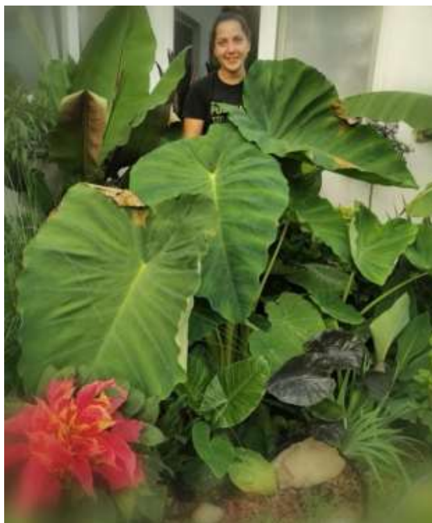
Slika 9. Uzgoj kolokazije na otvorenom

Zimi je moguće potpuno zasušivanje gomolja određenih sorti, sve do ponovnog stvaranja povoljnih uvjeta za vegetaciju.