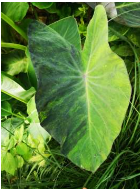
Slika 8. Kolokazija Black marable