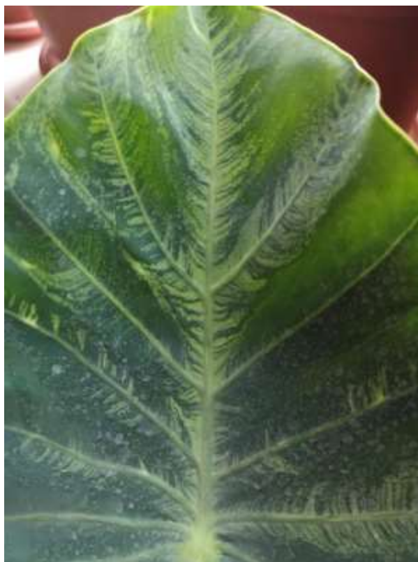
Slika 10. Mozaični virus kolokazije

Biljke kolokazije su najosjetljivije na napad štetnika crvenog pauka. Golim okom je nevidljiv. Moguće je na listovima vidjeti tragove paukove mreže. Štetu nanosi sisanjem sokova iz listova koji ostavljaju svijetle tragove na plojki lista. Ovaj štetnik je grinja kojoj pogoduje niska vlažnost zraka. Prevencija je često orošavanje listova biljke, a kada ni to nije dovoljno koristi se akaricid Demitan .