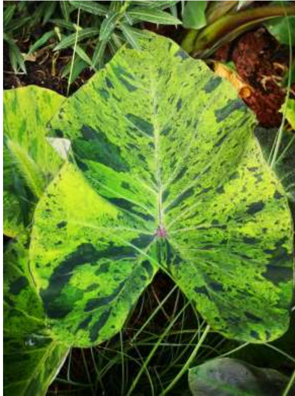
Slika 6. Kolokazija Mojito