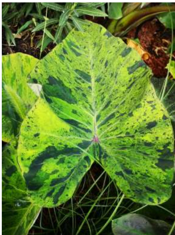
Slika 6. Kolokazija Mojito