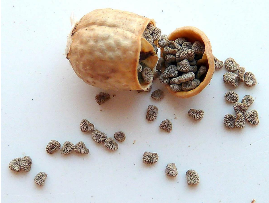
Slika 5. Plod i sjemenke bijele bunike ( H. albus )

Plod je smeđi tobolac i sadrži mnogo sjemenki sivosmeđe boje (slika 5.) (Swamy i sur., 2015.).