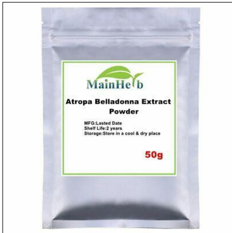
Slika 15. Prašak velebilja ( A. belladonna )

U liječenju, pučkoj narodnoj i zapadnoj medicini, velebilje se koristi u obliku tinktura i praška (slika 15.) za liječenje bolesti želuca i crijeva, neuralgija, bolesti mokraćnog sustava, srca, jetre i žuči te bolesti respiratornog sustava. Cigarete se sa suhim listovima velebilja ili praškom koriste se za liječenje astme (Lesinger, 2006.b).