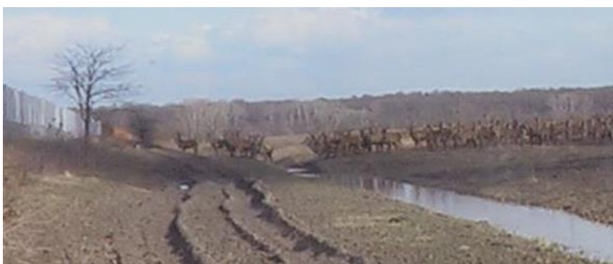
Slika 14. Nemogućnost migracije jelenske divljači u veljači 2016. godine u u zajedničkom otvorenom lovištu broj XIV/167 Duboševica

Postavljena žica na granici s Mađarskom uzrokovala je značajne posljedice na životinjski svijet. Nepovoljni i štetni utjecaji bodljikave “žilet” žice koja je smještena ispred ograde predstavlja opasnost za sve vrste divljači, također visoka ograda od 3 metra u potpunosti sprječava migraciju divljači. Prvobitna zamisao je bila ukloniti žilet žicu nakon postavljanja visoke ograde, ali to nije učinjeno. I dalje se bilježe slučajevi stradavanja divljači u manjem broju, ali glavni problem je ostao. Onemogućene su dnevne i sezonske migracije jelenske divljači, te je postavljanjem žice populacija razdvojena pri čemu se ne zna koliko ih je ostalo s jedne, a koliko s druge strane. Stoga postavljanjem visoke ograde dolazi do narušavanja prirodne ravnoteže u staništu, te dovodi do poremećaja u ponašanju i migracijskim navikama divljači. Ovaj problem je još veći u sezoni rike jelenske divljači, koja se događa krajem kolovoza i početkom rujna, jer nemogućnošću migracije dolazi i do nemogućnosti miješanja genetskog materijala, što dugoročnim ostavljanjem ograde može imati neželjene posljedice po populaciji jelenske divljači s obje strane.