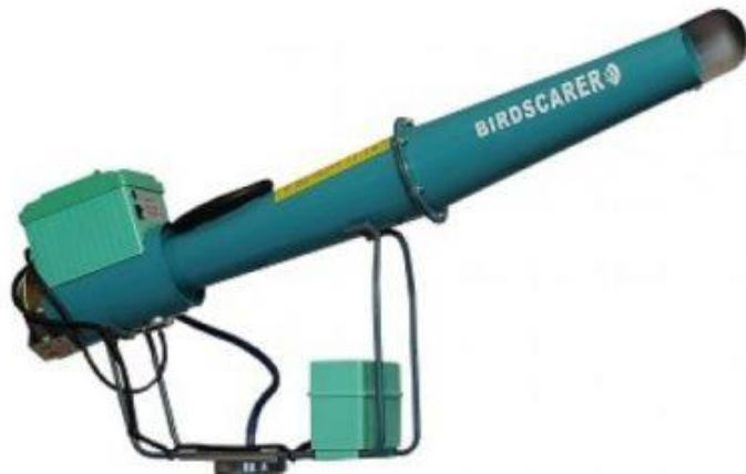
Slika 17. Plinski top

Za plašenje divljači koriste se plinski topovi koji su smješteni na odgovarajućoj udaljenosti i uključuju se u pravilnim vremenskim razmacima. Korištenje plinskih ili zvučnih topova trebalo bi se s vremenom povećavati jer se divljač jako brzo navikne na učestale zvukove, te bih se svakih nekoliko dana trebala micati tj. mijenjati učestalost uključivanja.