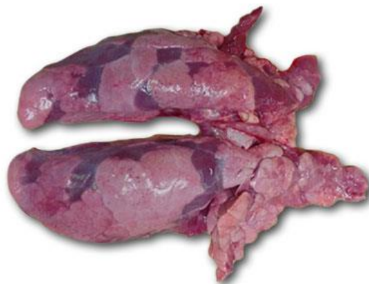
Slika 5. Izgled pluća zaražene svinje

Virus RRSS-a utvrđen je već 2. dana infekcije u alveolarnim makrofagima, bronhijalnom epitelu i u slezeni. Istraživači su izolirali virus iz alveolarnih makrofaga, pluća, srca, jetre, bubrega, mozga, slezene, peribronhijalnih limfnih čvorova, timusa, krajnika, koštane srž, leukocita periferne krvi, plazme i seruma (Collins i sur., 1991.). Viremija se može otkriti već prvog dana ulaska virusa u organizam, a zabilježeno je da traje čak 56 dana, iako je 28 dana češće. Nije utvrđeno pokazuje li se sposobnost izoliranja virusa u organima u mjesta za replikaciju ili je to samo rezultat protoka krvi kroz tkiva. Hesse i sur. (1992.) izvijestili su o većoj koncentraciji virusa u plućima, timusu, bronhijalnim limfnim čvorovima i srcu u usporedbi s koncentracijama u serumu.