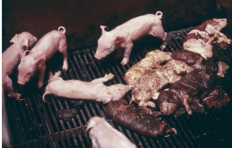
Slika 3. Mrtvorodena, mumificirana i slaba prasad