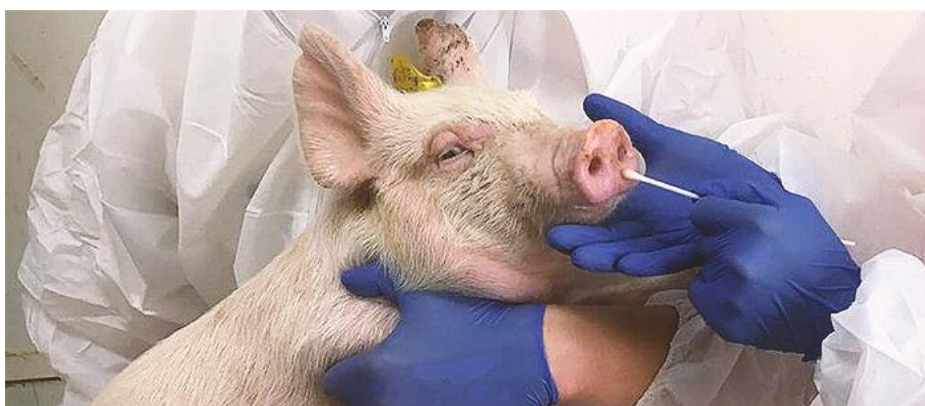
Slika 6. Uzimanje uzorka

Najrasprostranjenija dijagnostička metoda je serološka pretraga, dostupne su brojne metode. Izvorno, jednoslojni test imunoperoksidaze ispitan je i razvijen u Lelystadu (Wensvoort i sur., 1991.) te se opsežno koristi u Europi. Baziran je na imunološkom detektiranju protutijela vezanih na stanice pluća zaraženih RRSS virusom. Varijanta testiranja rasprostranjena u Sjevernoj Americi, koristi imunofluorescentno bojanje (Yoon i sur., 1992.; Frey i sur., 1992., Fichtner i sur., 1994.). Serumska protutijela mogu se naći 6 dana nakon infekcije, ali obično unutar 14 dana. Titri obično dosežu vrhunac (čak do 1: 40 000) unutar 5 – 6 tjedana nakon infekcije, nakon 4 – 6 mjeseci neke svinje postaju seronegativne. Uzorak plućnih stanica nužno je testirati i analizirati pomoću mikroskopa. Uzorak se može testirati samo jednom i rezultat se dobiva opsežnim laboratorijskim radom uz visoke troškove.