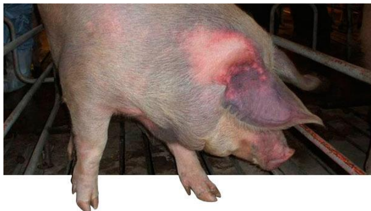
Slika 2. Promjena boje ušiju