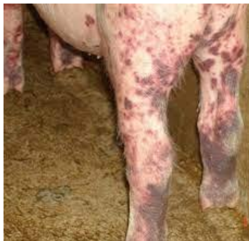
Slika 4. Krvarenja u koži na stražnjim nogama

Akutna faza može trajati nekoliko mjeseci, ali često je popraćena dugim razdobljem respiratorne bolesti koja se naziva "respiratorni sindrom nakon odbića" a za koju se izvještava da u SAD-u traje čak 2 godine (Loula, 1991.). Glavna karakteristika bolesti prije i nakon odbića je razvoj sekundarnih infekcija (Blaha, 1992.; White, 1992.; Pijoan i sur., 1994.). Brojne virusne bolesti često se povezuju s RRSS-om, uključujući svinjsku gripu i svinjski respiratorni koronavirus u Britaniji, virusni encefalomiokarditis u SAD-u (Carlson, 1992.) i paramiksovirus u SAD-u (Halbur i sur., 1993.) i Francuskoj (Brun i sur., 1992.). Još uvijek nije utvrđeno u kojoj mjeri navedeni virusi mogu djelovati sinergijski.