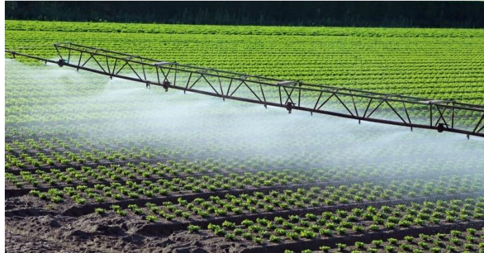
Slika 14. Kišno krilo