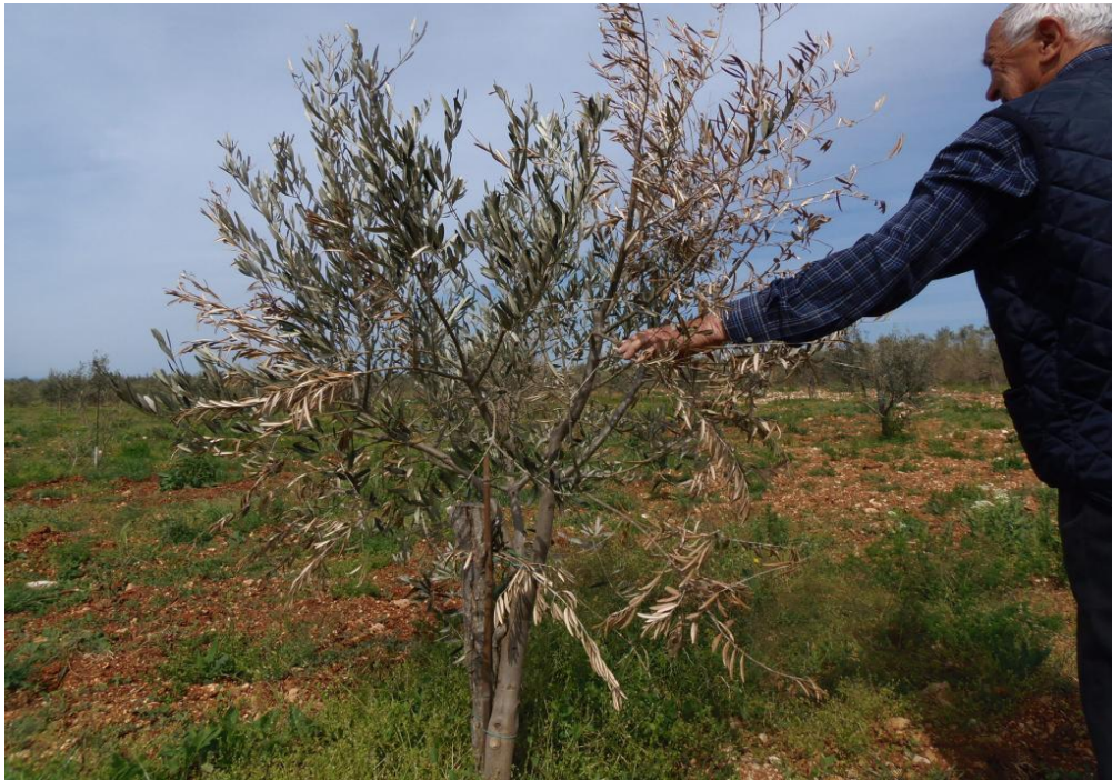
Slika 13. Djelomično ili potpuno sušenje stabala masline

novih bolesti od kojih su neke još uvijek nepoznate iskusnim maslinarima. Jedna od njih je i sušenje masline ili verticilijsko venuće ( Verticillium dahliae ), antraknoza ( Colletotrichum spp.) ili gljivični rak koji je uzrokovan vrstama iz porodice Botryosphaeriaceae u RH su to nove vrste i predmet su znanstvenih istraživanja.