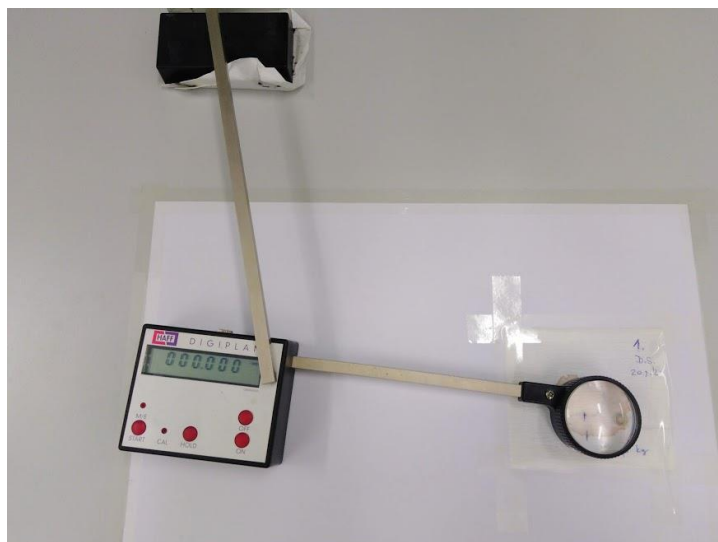
Slika 7. Mjerenje površine istisnutog mesnog soka planimetrom