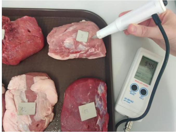
Slika 3. Mjerenje pH vrijednosti digitalnim prijenosnim pH metrom „Mettler“ MP120-B