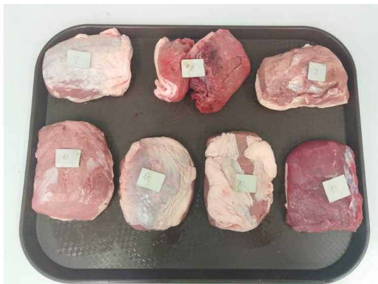
Slika 9. Prikaz odsječka longissimus thoracis i prikaz vizualne razlike u boji mesa