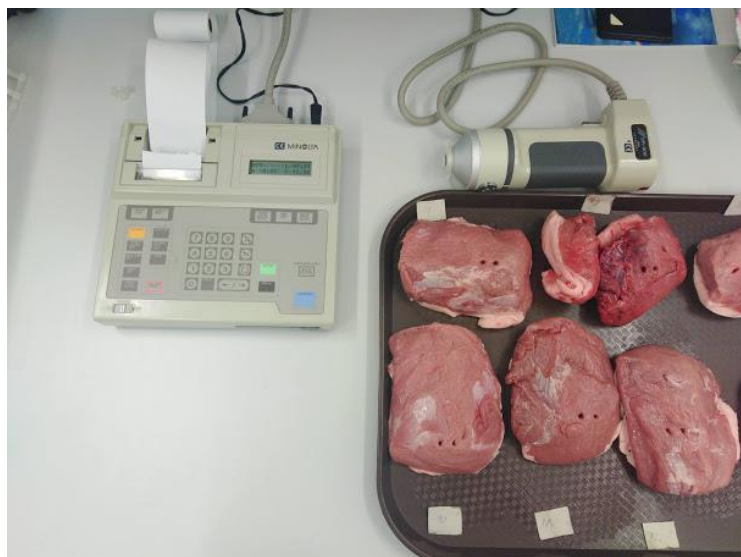
Slika 6. Uređaj za mjerenje komponenti boje (Minolta CR-300)