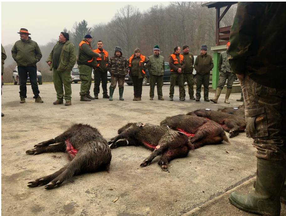
Slika 1. „Štreka“ ispred lovačkog doma „Vepar“ Slatina

U istraživanje su bile uključene odrasle jedinke divlje svinje usmrćene lovom prigonom ili lovom s čeke. Za vrijeme trajanja prigonskog lova u lovačkoj udruzi „Vepar“ Slatina odstrijeljen je dovoljan broj jedinki te je u istraživanje uključeno 11 odabranih jedinki odstrijeljenih tim načinom lova. Uzorci mesa divljih svinja usmrćenih prigonskim lovom prikupljeni su u siječnju 2020., dok su uzorci mesa divljih svinja ulovljenih lovom s čeke prikupljeni u razdoblju od ožujka do prosinca iste godine. Uzorke su osigurali lovci lovačke udruge Slatina i Gornji Miholjac.