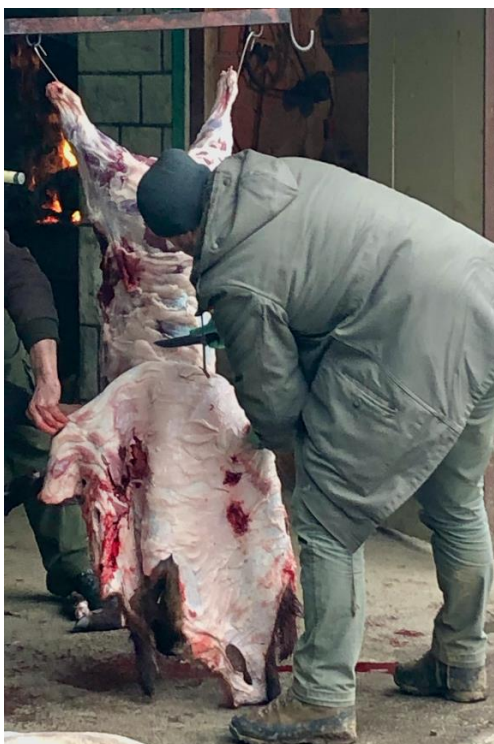
Slika 2. Postupak guljenja kože divljih svinja ispred lovačkog doma „Vepar“ Slatina