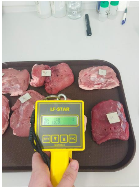
Slika 5. Mjerenje električne provodljivosti LF Star uređajem