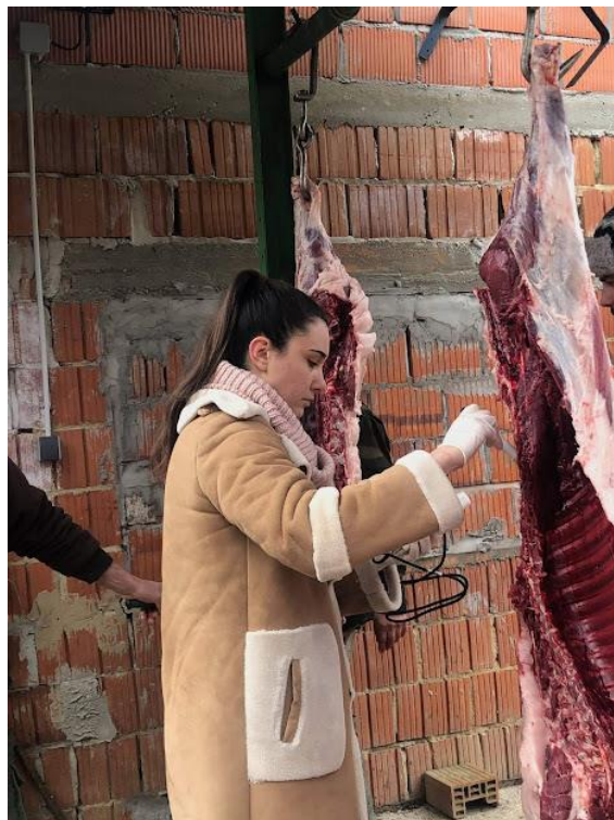
Slika 4. Mjerenje pH vrijednosti digitalnim prijenosnim pH metrom „Mettler“ MP120-B