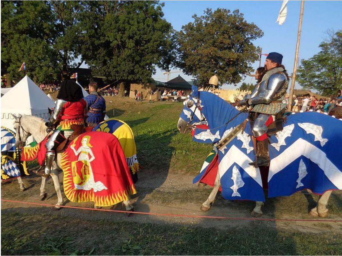
Slika 7. Renesansni festival