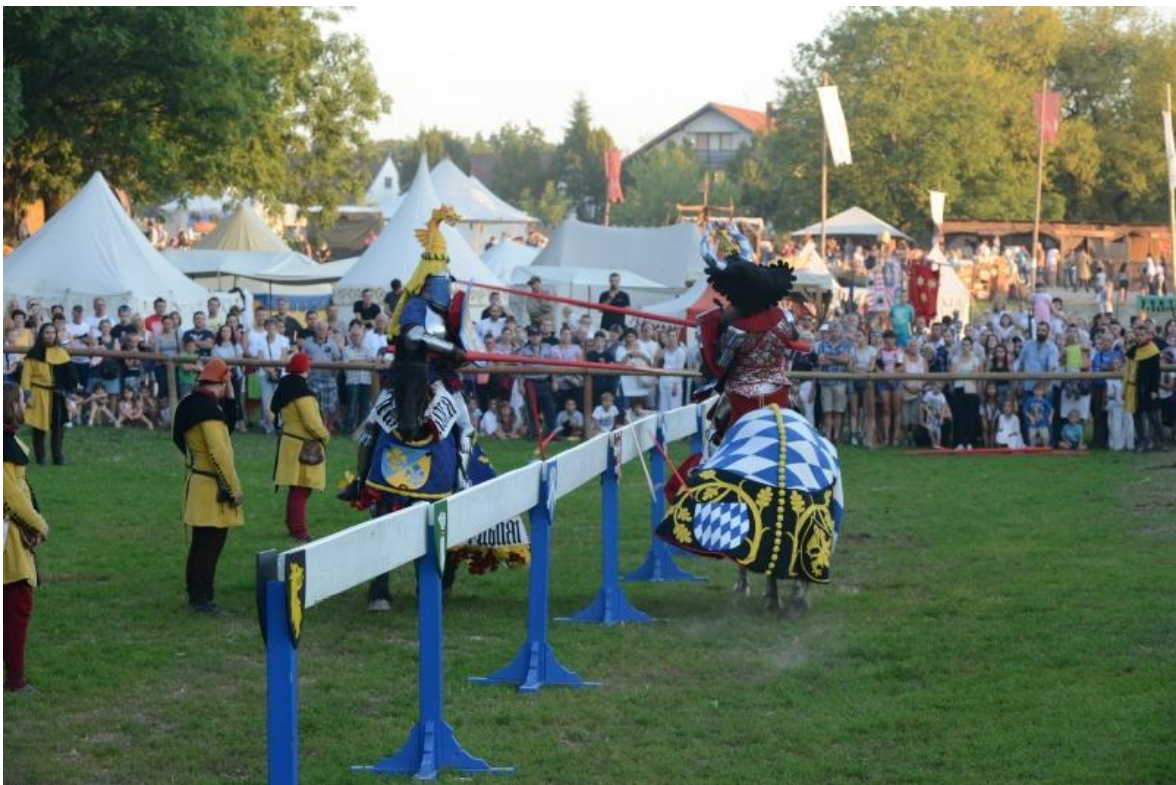
Slika 3. Viteška borba na renesansnom festivalu

U mjestu Peteranec nalazi se Konjički klub Galop Team čiji je cilj natjecanje u disciplinama preponskog i dresurnog jahanja. Osim sporta, Galop Team pruža usluge škole jahanja te redovito održavaju kondiciju konja svakodnevnim treninzima. Raspoložu s dva pješčana terena, a u planu je izgradnja zatvorene jahaonice i šetalice za konje. U klubu je trenutačno smješteno 25 konja, a u budućnosti planiraju izgraditi još jednu štalu za konje jer zanimanje za ovaj sport i konjički turizam u njihovoj županiji sve više raste.