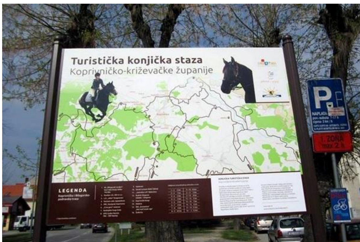
Slika 5. Turistička konjička staza Koprivničko-križevačke županije

županije stranim turistima. Oko 280 km staze podijeljeno je u tri regije: koprivničku, križevačku i đurđevačku. Otvorenje konjičkih staza bio je prvi korak prema konjičkom turizmu kojeg bi se još dodatno moglo unaprijediti (kckzz.hr). Bliska suradnja s Bjelovarsko – bilogorskom županijom gdje je ovaj tip turizma razvijeniji može pomoći u dijeljenju iskustava kako bi se izbjegli potencijalni problemi. Koprivničko–križevačka županija je u suradnji s Bjelovarsko–bilogorskom županijom radila na uređenju dodatnih 300 km staza za jahanje koje su danas i certificirane. U sklopu projekta se planira dodatna izgradnja novih kilometara, a plan je proširiti konjičku turističku stazu od Koprivnice, kalničkog gorja, sjevernih obronaka Bilogore, grada Križevaca i na kraju, povezivanje sa Zagrebačkom županijom. Ispplanirana je i razvijena konjička turistička staza koja se proteže od mjesta Jabučeta, Virja, Đurđevca, Molva pa sve do Malog Bukovca kako bi se povećala ponuda u aktivnom turizmu, a razvijena je i podloga za porast dolazaka gostiju. Naravno, potrebno je unaprijediti razvoj konjičkih turističkih staza, pridruženih centara i povezivanje usluga (TZ KKŽ, Elaborat certifikacije, 2019.).