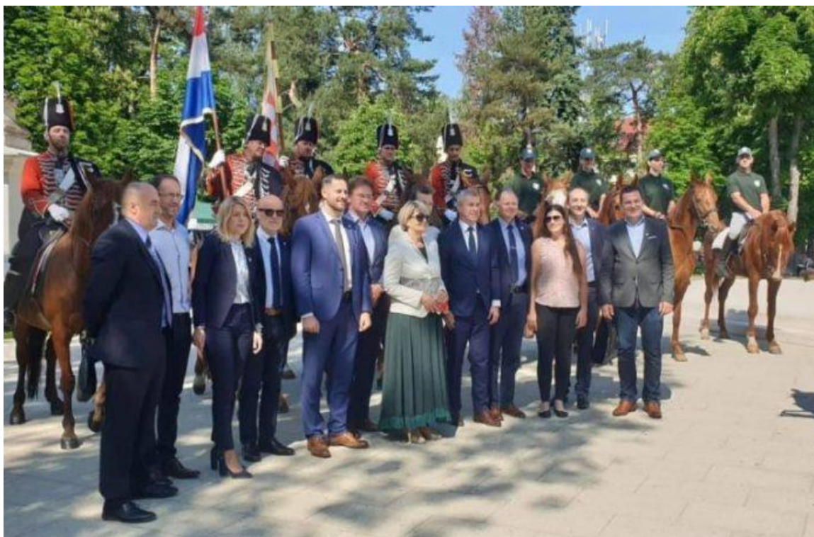
Slika 6. Međunarodni sajam za konjički turizam u Bjelovaru