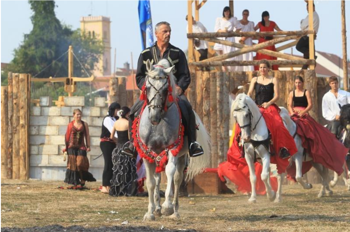
Slika 4. Jahači na renesansnom festivalu