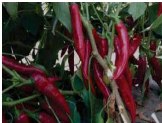
Slika 23. Bolero F1

Bolero F1 je slatka paprika koja je također pogodna uzgoju na otvorenom polju. Kontinuirano raste i sadržaj boje prilikom berbe iznosi 180 – 200 ASTA (American Spice Trade Association), dok nakon sazrijevanja bude nešto veći od 300 – 360. Nakon berbe i sušenja se tek uočava nešto tamno crvenija boja ploda. Preporuka sjemenske kuće je uzgoj 6 – 7,5 biljaka po m 2 tj. 60 000 – 75 000 biljaka/ha.