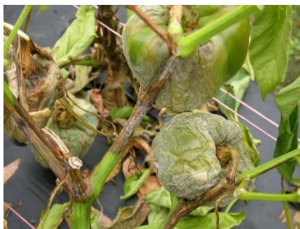
Slika 14. Phytophthora capsici

Phytophthora capsici je uzročnik polijeganja presadnica, truleži korijena, vrata korijena i plodova paprike. Ukoliko do zaraze dođe iz tla nakon presađivanja tada se simptomi javljaju u zoni korijenova vrata (pojava smeđe boje, nekroze i vlažne truleži kore) i biljke venu i suše se. Ako se bolest pojavi u pazušcima lista ili grane tada odumiru dijelovi biljaka koji se nalaze iznad. Zaraza na paprici se može izvršiti direktno ili preko peteljke lista ili ploda. Simptomi na listu su vidljivi u obliku nekrotičnih pjega gdje se pojavljuje micelij za vrijeme vlažnog vremena. Ukoliko nakon zaraze nastupi vlažno vrijeme tada nastaje vodenasta pjega koja se vrlo brzo širi i zahvaća veći dio ploda a na njoj se nalazi bijela masa micelija i spora. Gljiva prezimi u zaraženim biljnim ostatcima ili slobodno u tlu bez biljke domaćina i razmnožava se na temperaturama od 10 do 35 °C uz prisutnost vode.