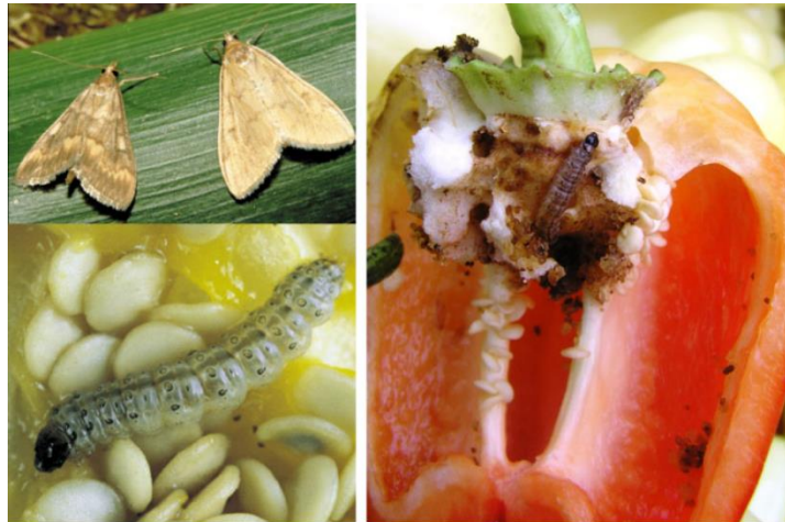
Slika 19. Štete od kukuruznog molja na paprici

Kukuruzni moljac (Slika 19) zbog čestog uzgoja kukuruza kao monokulture može napraviti značajne štete na paprici jer vrlo često napada papriku i rajčicu. Gusjenice se nakon izlaska iz jaja ubušuju u plodove paprike i najčešće se hrane i ubušuju u sjemenu ložu. Ponekad je teško primjetiti napad štetnika jer rupe koji buši ponekad znaju biti uz peteljku ploda. Suzbijanje je potrebno provesti prvo na izvorima pojave štetnike kao što su stara kukuružišta i bljni ostaci te biljke domaćina na kojim se nalazi. Dozvoljene aktivne tvari za suzbijanje moljca su lufenuron i metaflumizon.