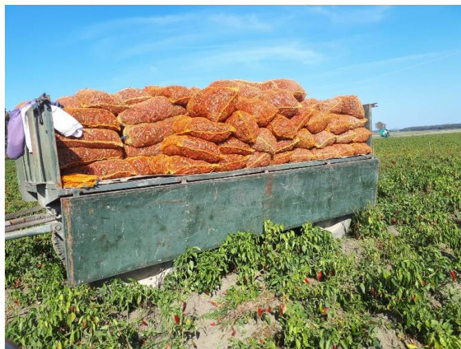
Slika 32. Punjenje vreća za transport paprike do sušara

sunčanom vremenu poslije rose i nikada poslije kiše jer se vlažni plodovi zagrijavaju i mogu uzrokovati jaču pojavu plijesni ili truleži. Berba se obavlja početkom mjeseca rujna i traje mjesec dana. Prilikom berbe, plodovi paprike se pažljivo otkidaju sa grana zajedno sa peteljkom i pazi se da se biljka ne iščupa ili ne ošteti grana. Radnici na licu mjesta otkidaju peteljku sa ploda i te ih polažu u plastične kante. Kasnije se odnose na uvratine te se pretresaju u mrežaste vreće (Slika 32). Berba u jednom navratu traje 7-8 dana odnosno dok se sušare potpuno ne napune.