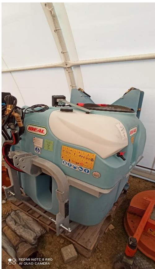
Slika 4. Spremnik za tekućinu sa spremnikom za pranje ruku i posuda