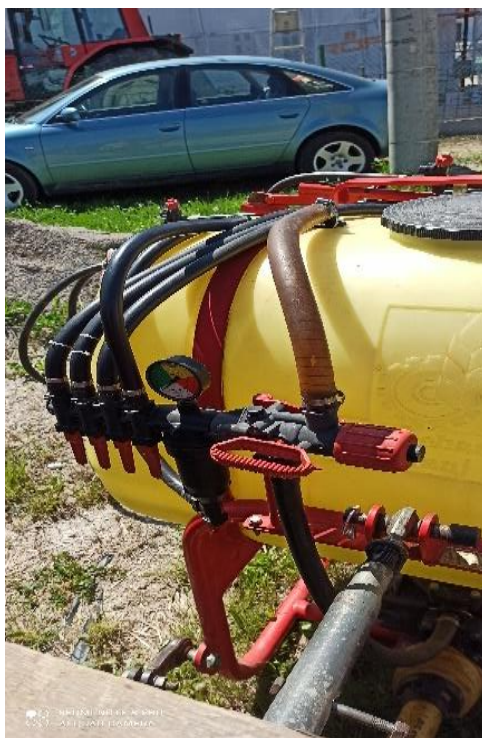
Slika 5. Regulator tlaka sa manometrom