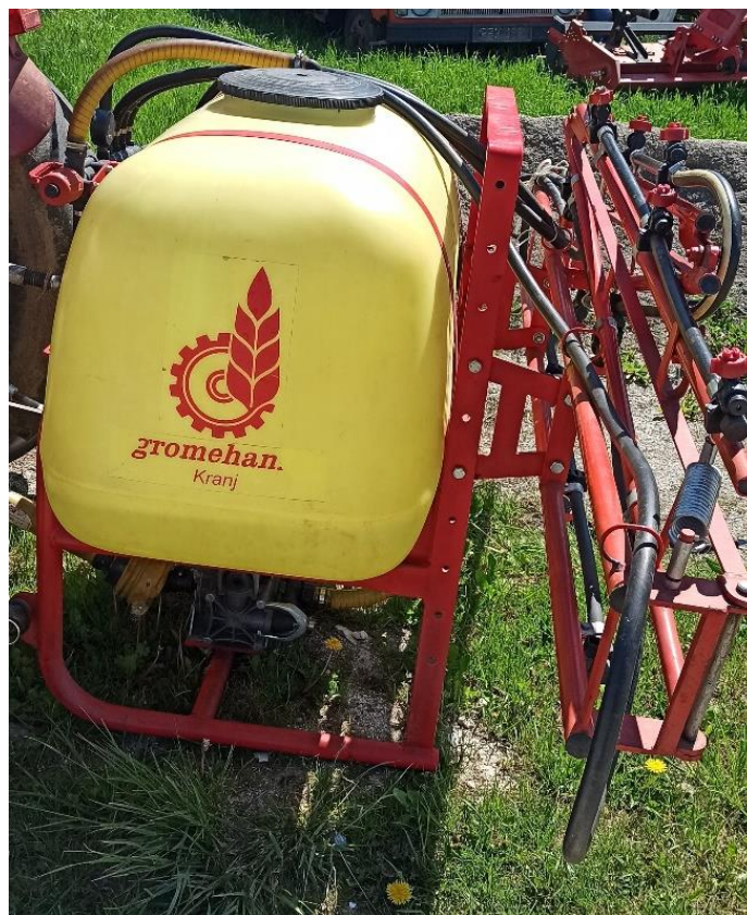
Slika 14. Prskalica Agromehanika AGS 330