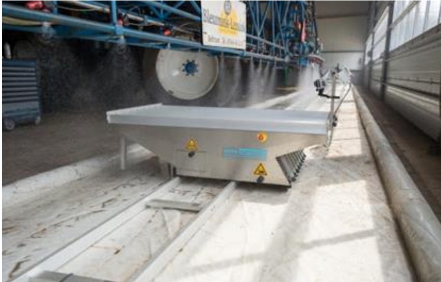
Slika 11: Spray scanner AAMS – Salvarani