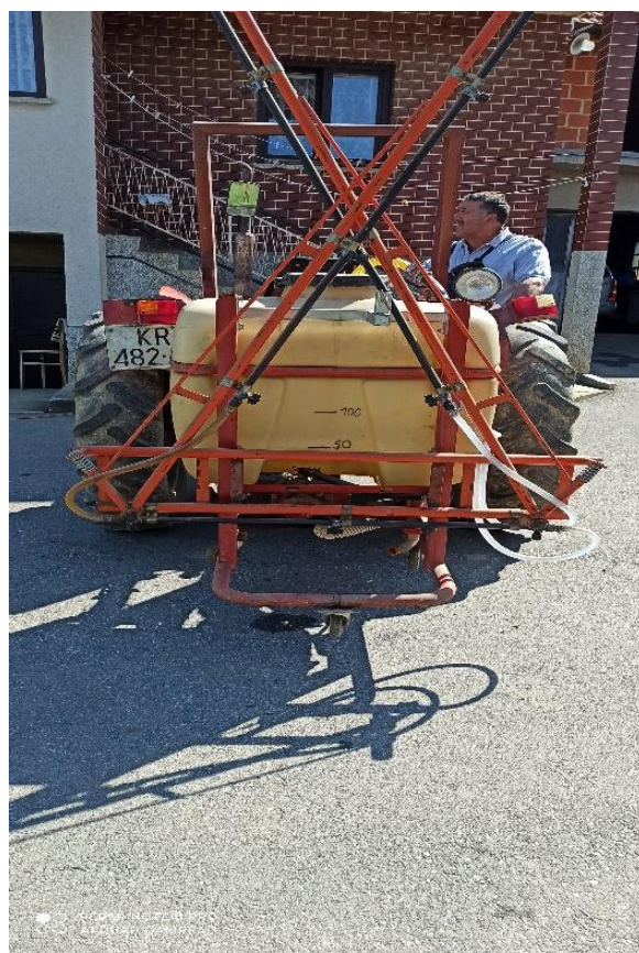
Slika 13. Prskalica RHEIN CONTI