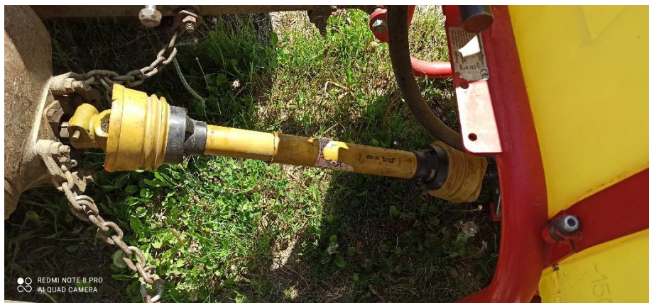
Slika 1. Priključno vratilo sa zaštitom

Metoda ispitivanja: vizualni pregled i provjera funkcionalnosti u radu