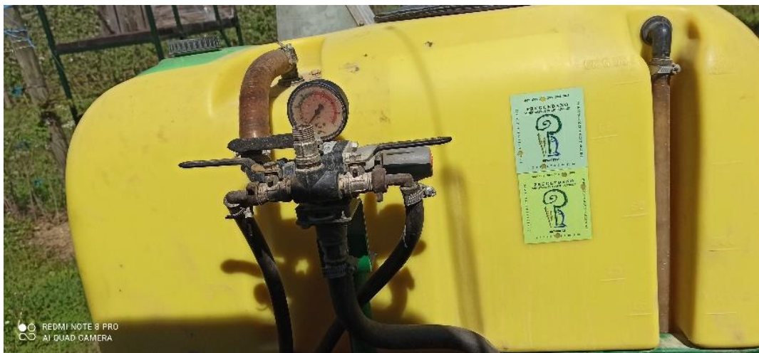
Slika 19. Potvrda o uspješnom pregledu

Za vrijeme izvođenja pregleda prskalica i raspršivača prema normi EN 13790 – I i EN 13790 – II utvrđena su određena odstupanja. Utvrđena odstupanja rezultat su zahtjeva proizvodnje različitih kultura. Nakon što su se svi neispravni dijelovi zamijenili ili očistili, ispitivani strojevi su zadovoljili osnovne kriterije ispravnosti strojeva u zaštiti bilja i dobili su potvrdu o uspješnom pregledu (slika 19).