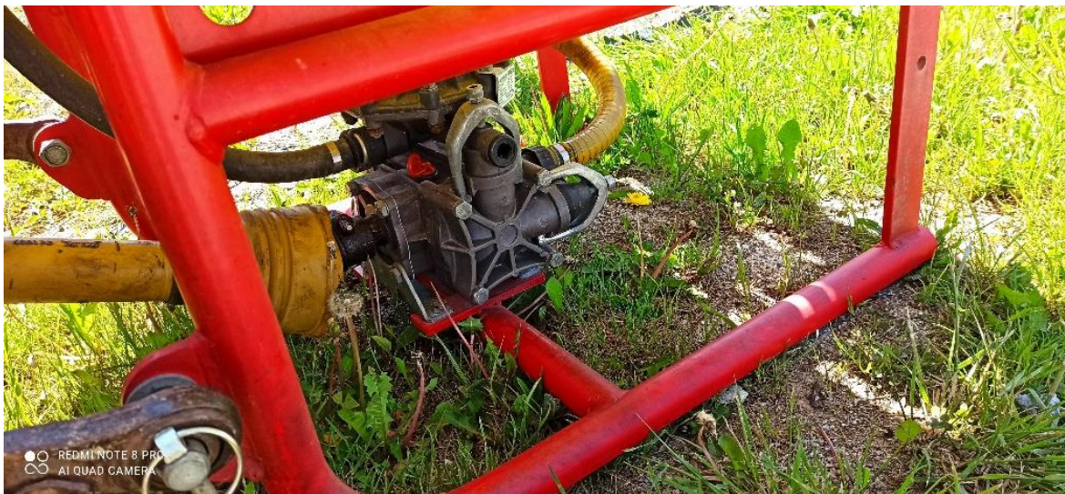
Slika 2. Klipno membranska crpka Agromehanika BM 65/30

Crpka je dio prskalice koji ima zadatak proizvoditi dovoljnu količinu tlaka tekućine koji omogućava razbijanje tekućine u sitne kapljice prilikom njenog prolaska kroz mlaznice i osigurava distribuciju kapljica na tretiranu površinu (slika 2). Tlak koji proizvodi crpka ovisi o tipu crpke i o namjeni prskalice. Kapacitet crpke mora biti takav da u datom trenutku može osigurati potrebnu količinu protoka prema svim mlaznicama. Najčešće se na ratarske prskalice ugrađuju klipno membranske crpke.