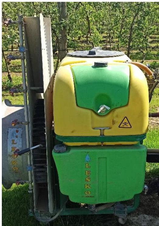
Slika 18. Raspršivač LEŠKO 330L 3R