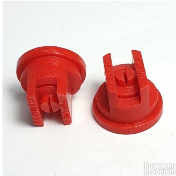
Slika 8. Standardna mlaznica Lechler 110 – 04

ujednačenije pokrivanje tretirane površine. Sitne kapljice vrlo su osjetljive na vjetar, isparavaju brže, stoga su gubici uslijed zanošenja veliki.