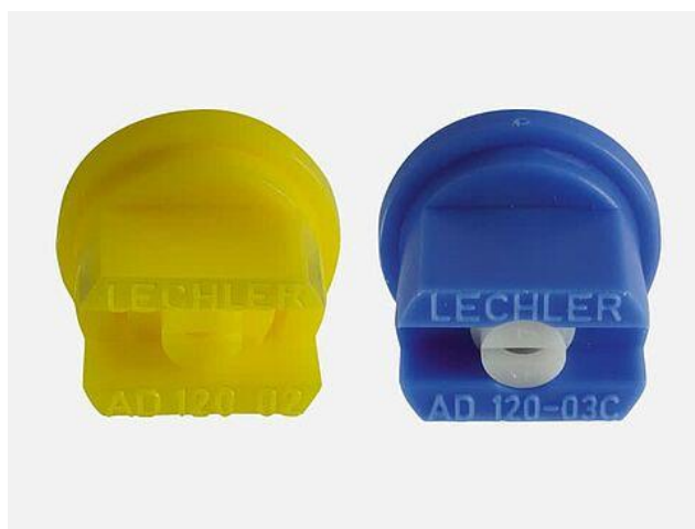
Slika 9. Anti – drift mlaznice Lechler AD 120 – 02 i AD 120 – 03

Anti – drift mlaznice, za razliku od standardnih u sebi imaju integriranu pretkomoru prizmatskog oblika (slika 9). Opadanjem tlaka tekućine u pretkomori, prije no što se otvori izlazni otvor, smanji se udio nepoželjnih sitnih kapljica koje se razviju u procesu raspršivanja. Ovim mlaznicama se postiže uži spektar kapljica u mlazu, zadovoljavajuća distribucija i manje zanošenja. Moguća je i primjena do 4 m/s.