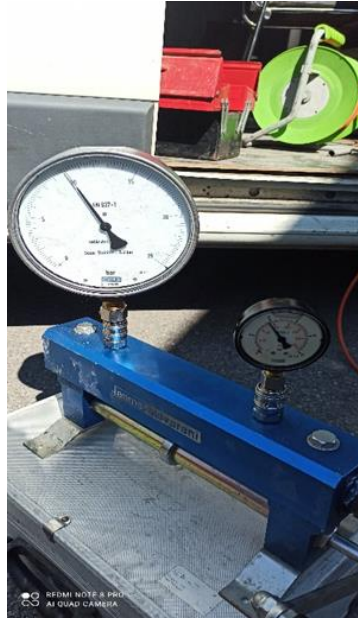
Slika 6. Uređaj za ispitivanje manometara AAMA – Salmarani