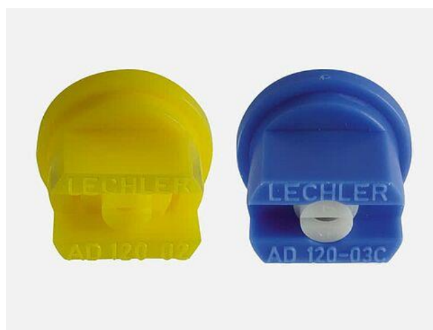
Slika 9. Anti – drift mlaznice Lechler AD 120 – 02 i AD 120 – 03

Anti – drift mlaznice, za razliku od standardnih u sebi imaju integriranu pretkomoru prizmatskog oblika (slika 9). Opadanjem tlaka tekućine u pretkomori, prije no što se otvori izlazni otvor, smanji se udio nepoželjnih sitnih kapljica koje se razviju u procesu raspršivanja. Ovim mlaznicama se postiže uži spektar kapljica u mlazu, zadovoljavajuća distribucija i manje zanošenja. Moguća je i primjena do 4 m/s.