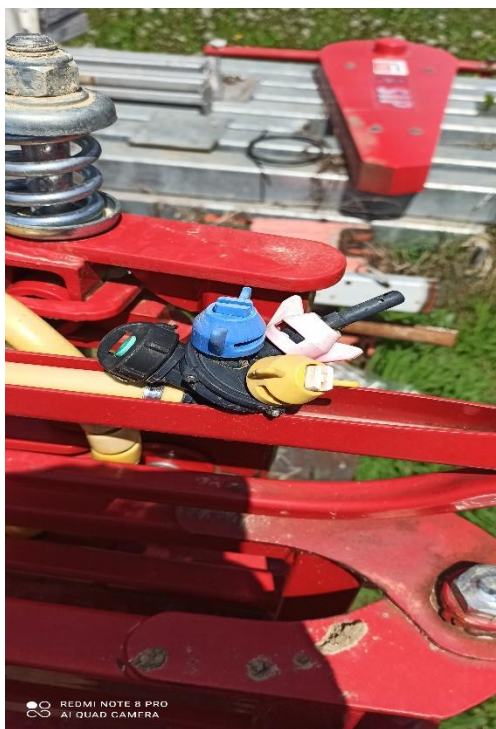
Slika 7. Mlaznice na grani prskalice