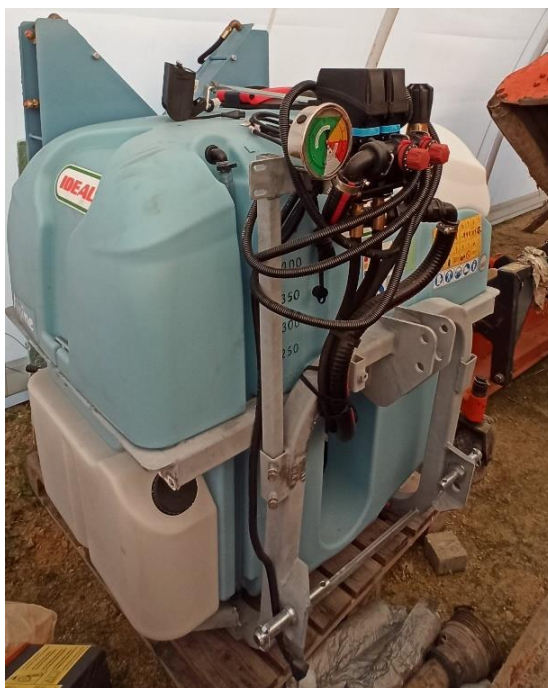
Slika 17. Raspršivač IDEAL ALPINE 500