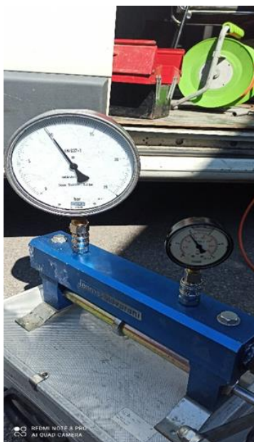
Slika 6. Uređaj za ispitivanje manometara AAMA – Salmarani