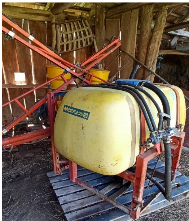
Slika 15. Prskalica TOZD METALNA – RAU 14V35S