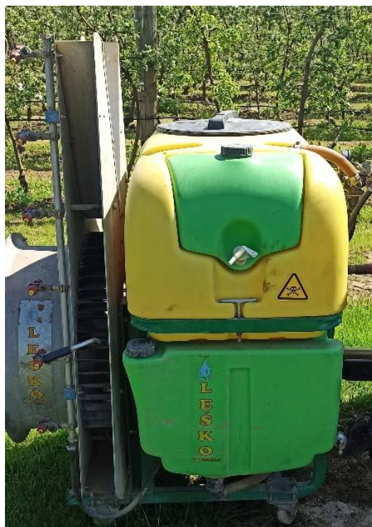
Slika 18. Raspršivač LEŠKO 330L 3R