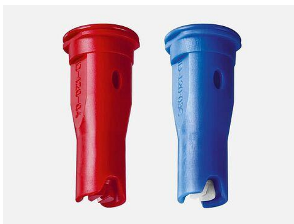
Slika 10. Injektorske mlaznice Lechler ID 120 – 03C i ID 120 – 04

Injektorske ili zračne mlaznice jedna je od najvažnijih inovacija u području tehnologije mlaznica. Dizajn im je takav da pomoću injektorskog uložka unutar tijela mlaznice, na venturijevom principu usisava zrak unutar mlaznice, koji se miješa sa tekućinom, stvarajući krupnije kapljice tekućine koje u sebi sadrže mjehuriće zraka (slika 10). Količina zraka u mlaznici ovisi o više uvjeta, a najvažniji je formulacija sredstva za zaštitu bilja za primjenu škropiva za prskanje. Obadva medija koja se miješaju, tj. tekućina i zrak, u škropivu je približno 1:1 i miješanje se obavlja u komori mlaznice. Do raspršivanja dolazi izlaskom tekućine kroz otvor mlaznice. Glavni cilj razvoja ovog tipa mlaznice je sprječavanje zanošenja, uz zadržavanje dobrih svojstava koje imaju mlaznice sa lepezastim mlazom.