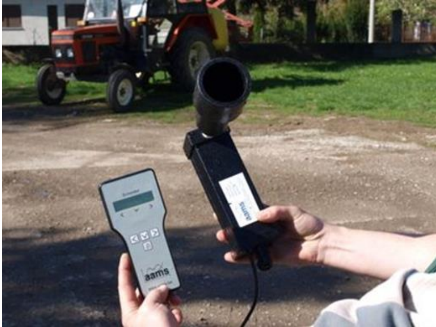
Slika 12. AAMS uređaj za mjerenje protoka mlaznice

numerirati, kako bi se nakon toga postavile u pomični nosač. Provjera se radi sa čistom vodom. Ispitni stol ima elektronsku jedinicu za mjerenje protoka koja prati trenutni protok 22 mlaznice te rezultat sprema u svoju memoriju. Rezultati se naknadno obrađuju u posebnom softveru – spray monitor.