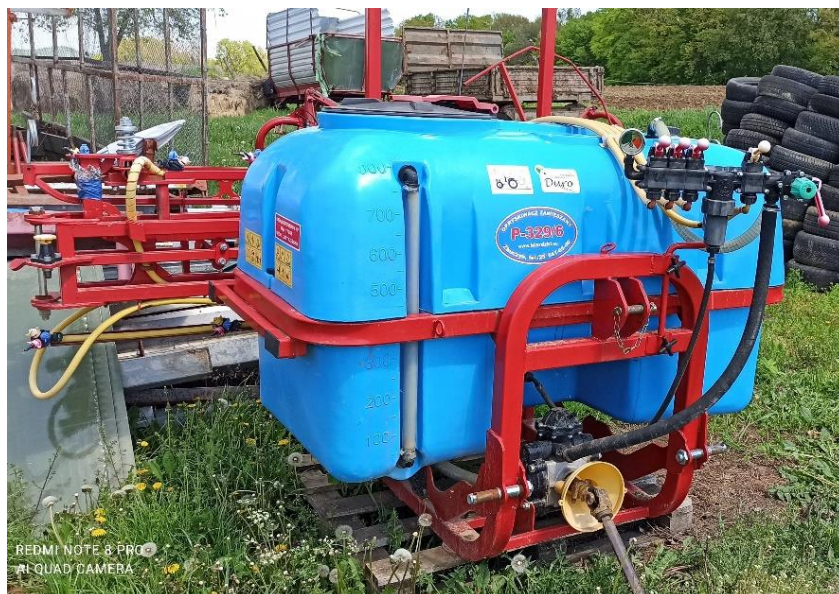
Slika 16. Prskalica BIARDSKI P 329/6 (800/12)