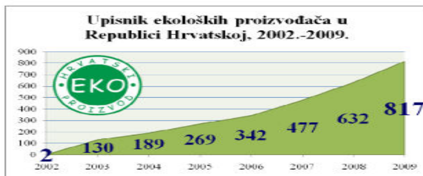
Slika 3. Ekološki proizvođači RH 2002.-2009.

Ekološka proizvodnja definira se kao poseban sustav održivoga gospodarenja u poljoprivredi i šumarstvu koji obuhvaća uzgoj bilja i životinja, proizvodnju hrane, sirovina i prirodnih vlakana te preradu primarnih proizvoda, a uključuje sve ekološki, gospodarski i društveno opravdane proizvodno-tehnološke metode, zahvate i sustave. 10 Najpovoljnije koristi plodnost tla i raspoložive vode, prirodna svojstva biljaka, životinja i krajobraza, povećanje prinosa i otpornosti biljaka s pomoću prirodnih sila i zakona, uz propisanu uporabu gnojiva, sredstava za zaštitu bilja i životinja, sukladno međunarodno usvojenim normama i načelima. Svrha je ekološke proizvodnje zaštita zdravlja i života ljudi, zaštita prirode i okoliša te zaštita potrošača.