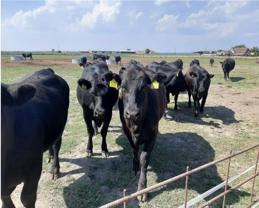
Slika 3. Prikaz junica pasmine crni angus

Konverzija hrane je vrhunska, daju navise prihoda za ono uloženo i zato je jako popularna u križanju sa drugim pasminama. Meso je jako mramorirano, ukusno i nježno, što je izvrsno jer potrošači traže veliku mramoriranost mesa. Mramoriranost je također povezana sa nježnosti mesa, što je više mramorirano to je i nježnije te to čini govedinu ukusnijom i više potraživanom. (Uremović, 2014.)