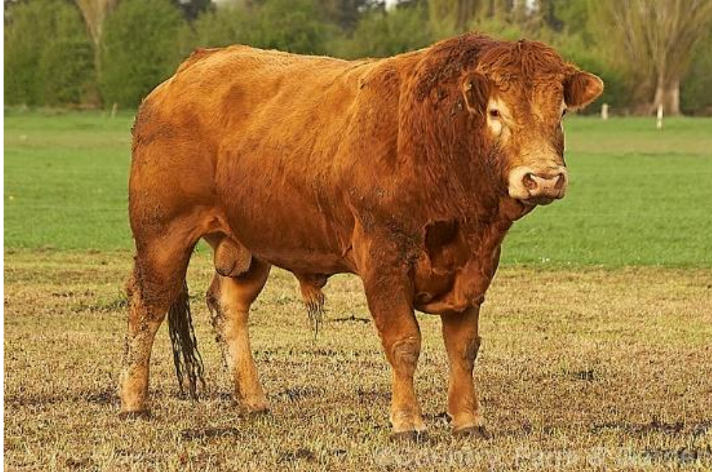
Slika 2. Prikaz bika pasmine limuzen