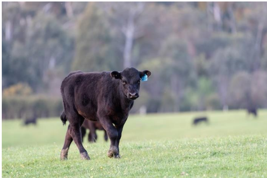
Slika 6. Prikaz teleta angus goveda

prvo teljenje imale su evidentirano u programskoj godini, mlađa su od 36 mjeseci, te su prisutna na gospodarstvu na dan podnošenja zahtjeva za potporu.