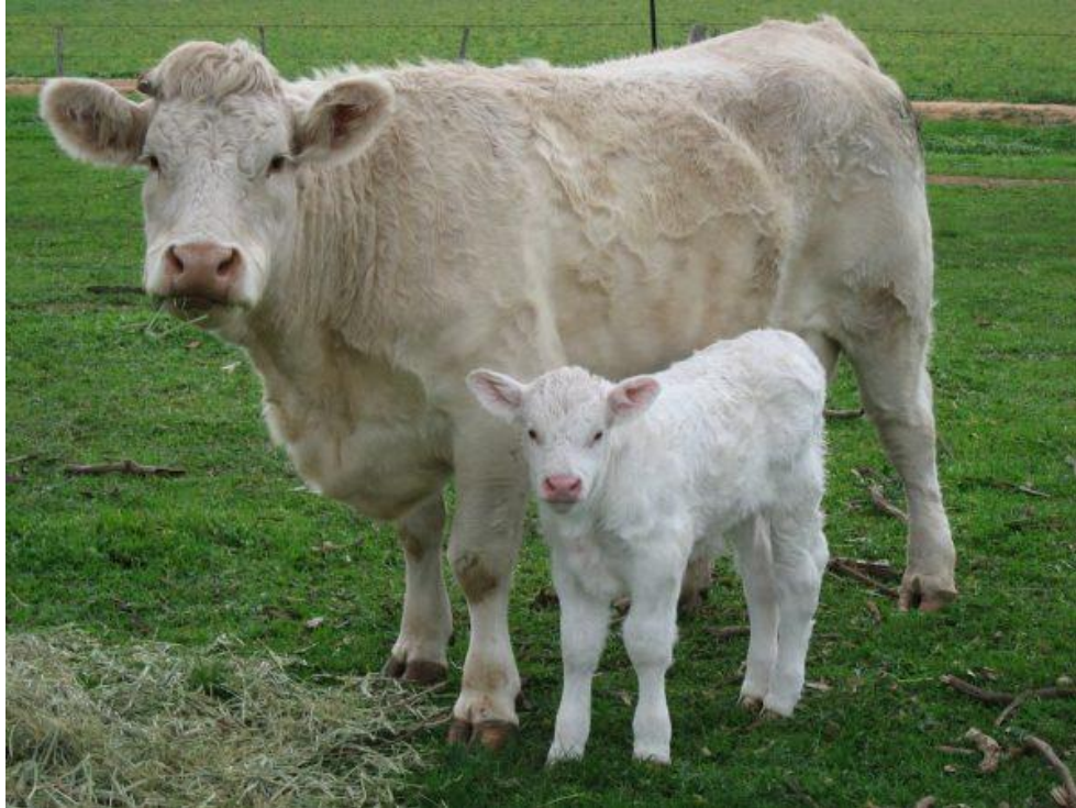
Slika 1. Prikaz krave i teleta pasmine šarole