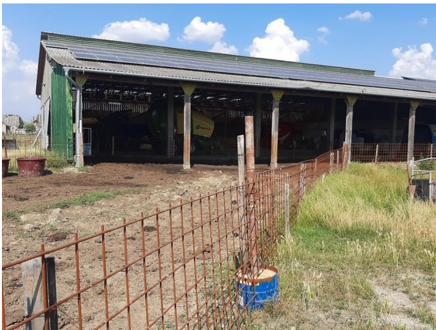
Slika 6. Prikaz staje na Opg-u Durus

Gospodarstvo je osnovano 2005. godine i primarna djelatnost je bila uzgoj muznih krava, ali od 2015. godine se više ne bavi tom proizvodnjom, zbog pojave bolesti sa gospodarstva je jako puno grla poslano na prisilno klanje, a slaba cijena mlijeka također je utjecala na isplativost daljnje proizvodnje. Sustav krava-tele je na farmu uveden tek 2019. godine s 22 junice i jednim bikom pasmine crni angus. Životinje su pripuštene na ograđenu pašu veličine oko 1 ha. Uz pašnjak nalazi se objekt u kojem su prije bile muzne krave, a sada služi kao sklonište mladim junicama, ondje također uvijek imaju svježe vode.