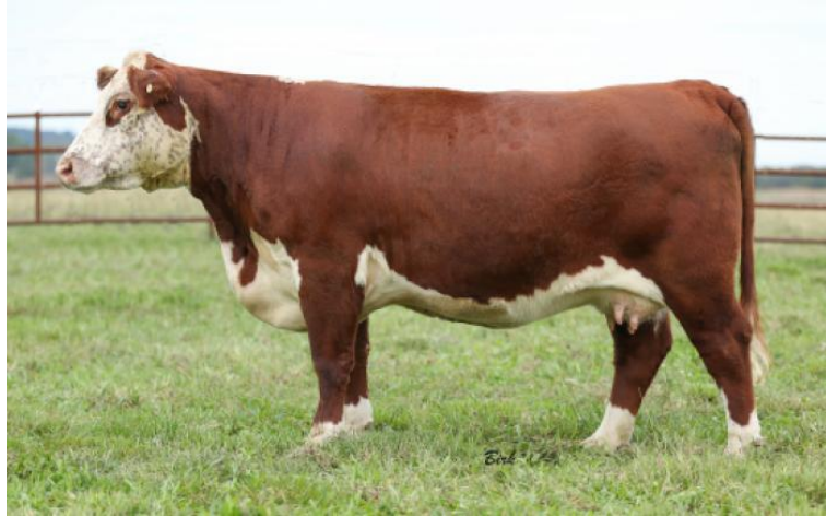
Slika 4. Prikaz krave pasmine hereford