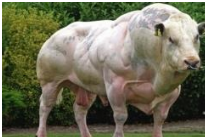
Slika 5. Prikaz bika pasmine belgijsko bijelo – plavo govedo

Belgijska bijelo-plava pasmina goveda najbolja je tovna pasmina goveda na svijetu. Pasmina je poznata po velikoj obraslosti mišićima i zbog visokog randmana mesa (65 – 70%). Prvo teljenje u krava ove pasmine bude teško najčešće uz primjenu carskog reza. (Uremović, 2014.)