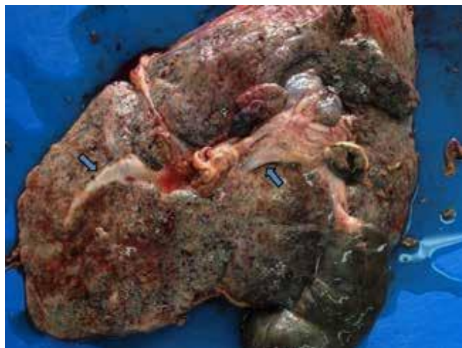
Slika 9. Jetra u koju je invadirao metilj, prošireni žučovodi

Metilji su dvospolci tako je dovoljno da samo jedan invadira u životinjski sustav, a može živjeti unutar žučovoda desetak godina i cijelo to vrijeme proizvoditi oko 20000 jajašaca dnevno.