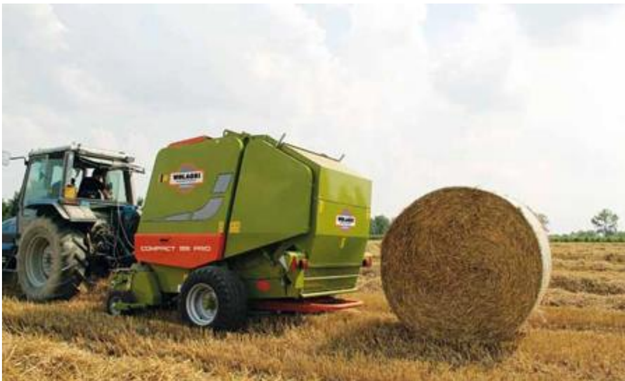
Slika 7. Prikaz stroja za izradu rolo bala slame i sjena