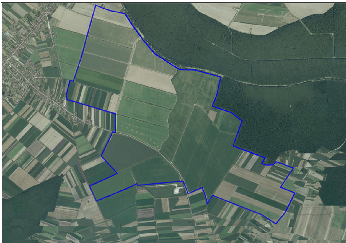
Slika 1. Područje istraživanja

navodnjavanja i najveći poljoprivredni subjekt je PIK Vinkovci na oko 436 ha, a ostatak čine površine obiteljskih poljoprivrednih gospodarstava (Dadić, 2008.).