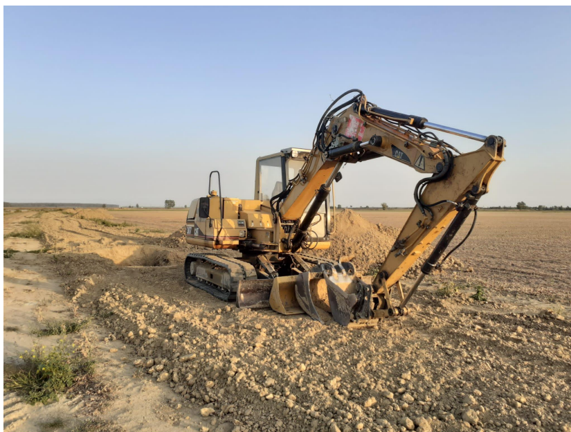
Slika 5. Radovi na razvođenju vode za potrebe navodnjavanja (, 15.09.2021.)