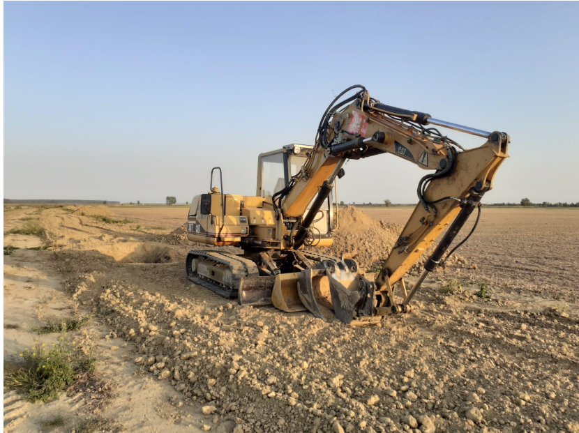
Slika 5. Radovi na razvođenju vode za potrebe navodnjavanja