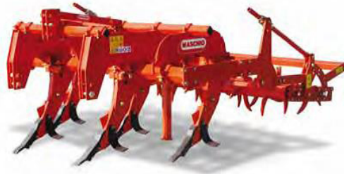
Slika 6. Različita izvedba uređaja za dubinsko rahljenje tla

uvjetima navodnjavanja. Ovisno o tipu tla, zoni nepropusnog sloja, ovisiti će i dubina samog podrivanja te učestalost ponavljanja. U svakom slučaju ljetni period je idealno vrijeme za ovu agrotehničku mjeru, jer je jedino u ovo godišnje doba dubina rada glede vlažnosti najpogodnija, a u suprotnom može doći i do negativnog učinka (Slika 6).