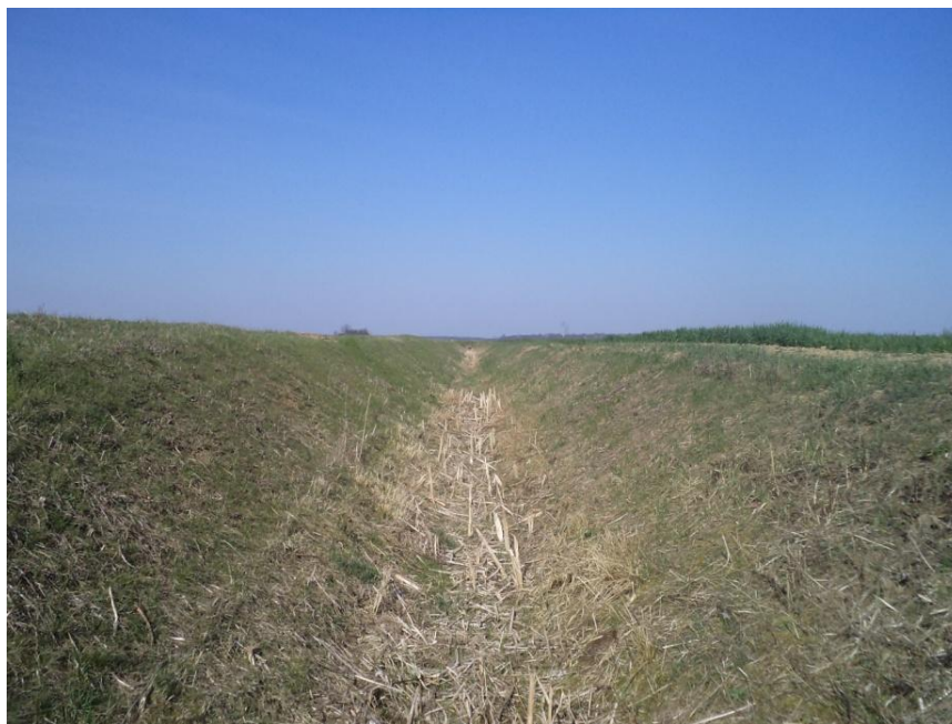
Slika 3. Dobro održavan kanal IV. reda

U okviru istraživanog područja kanalska mreža odvodni suvišnu vodu u tolerantnom vremenu. Tijekom hidropedoloških istraživačkih radova, sustav izvedenih kanala je u pravilu bio bez vode. Proizvodne površine imaju dosta pravilan oblik, izvedivo optimalnu veličinu i nesmetani pristup u obavljanju agrotehničkih zahvata svim vrstama poljoprivrednih strojeva. Uređenost otvorene kanalske mreže uglavnom zadovoljava (Slika 3).