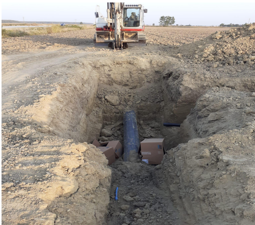
Slika 4. Ugradnja podzemnih dovodnih cijevi

Na istraživanom području nema proizvodnih površina na kojima se provodi navodnjavanje. No, 2015.godine počele su aktivnosti u sklopu projekta građenje sustava javnog navodnjavanja Ervenica kojeg financira europska unija. Temeljem zadnjeg obilaska istraživanog područja se mogu vidjeti trenutne aktivnosti na budućem sustavu navodnjavanja (Slika 4 i Slika 5).