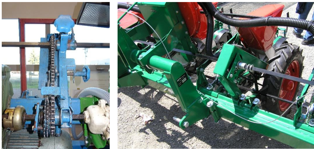
Slika 9. Mjenjačka kutija (lijevo) i pogon od voznog kotača ( z=32 ) prema gornjem vratilu ( z=24 ) lančanim prijenosom (desno)