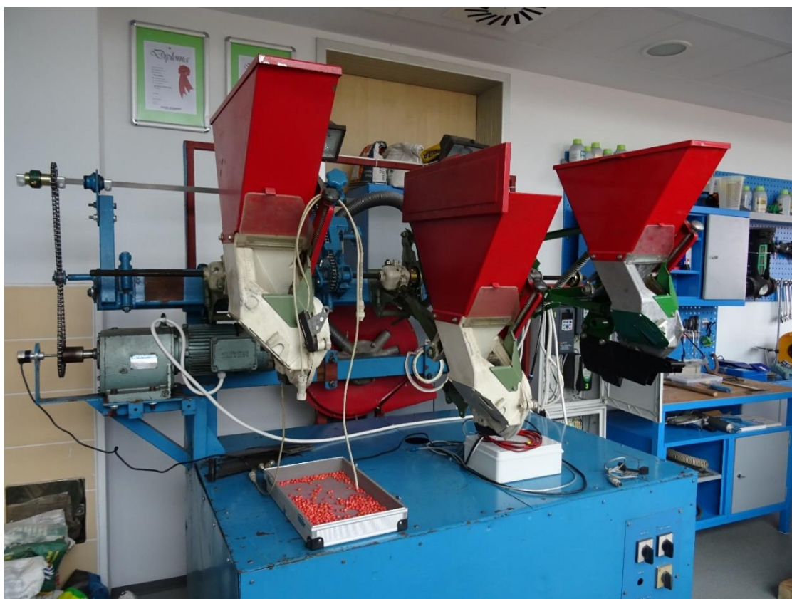
Slika 6. Sijačica PSK OLT

Sijačice podtlačnog tipa imaju sjetveni sustav koji omogućava korištenje sjemena velikog broja ratarskih kultura. U osnovnoj izvedbi namijenjena je za sjetvu kukuruza, a dodatnom opremom i izmjenom sjetvenih ploča omogućena je primjena u sjetvi šećerne repe, soje, suncokreta te povrtnih kultura. Prema želji kupca, kao posebna oprema može se naručiti uređaj za deponiranje mineralnog gnojiva, uređaj za deponiranje mikrogranuliranih pesticida i uređaj za elektronsku kontrolu sjetve OLT-Tronic . Precizna, pouzdana i ekonomična pneumatska sijačica omogućava brzu sjetvu s točno određenim sklopovima prema određenim zahtjevima pojedinih FAO grupa ( www.olt.hr ). Ispitivana sijačica (Slika 6.) je postavljena na ispitni stol, a pogon je dobivala od dva trofazna elektromotora. Na sjetvenu sekciju sijačice, ispod sjetvene komore postavljen je transmisijski senzor čija je uloga praćenje glavnih svojstava isijavanja dok je položaj sijačice s obzirom na prijedeni put u trenutku prolaska sjemenke kroz transmisijski senzor utvrđen Enkoderom postavljenim na centralno pogonsko vratilo.