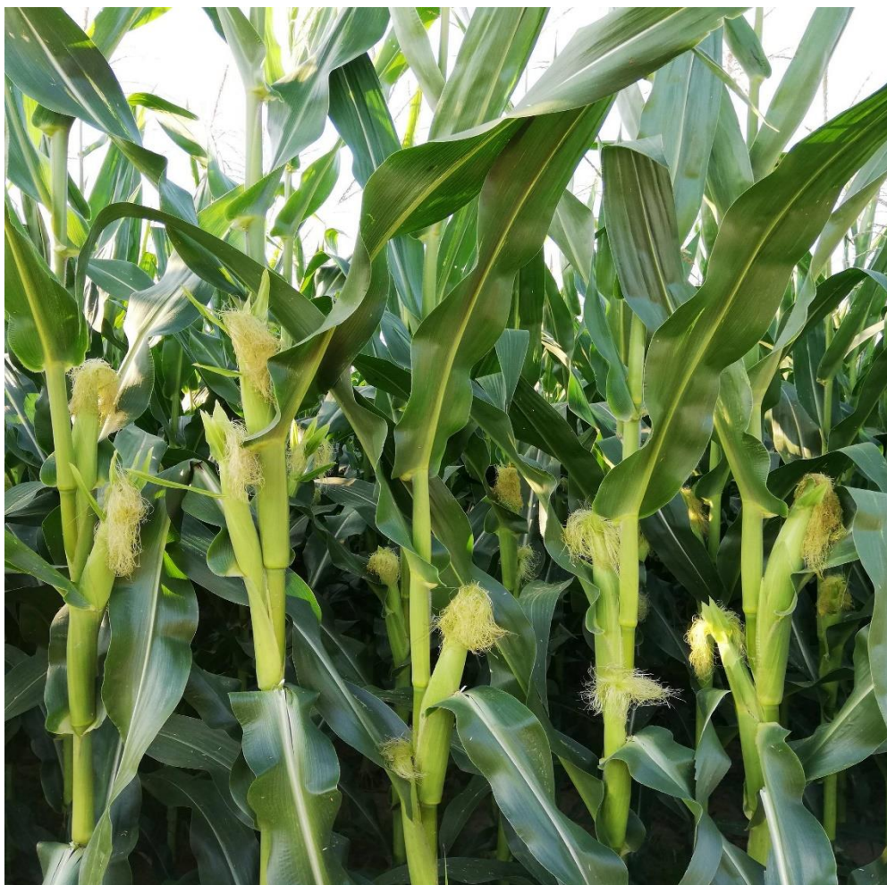
Slika 2. Stabljika i plod kukuruza