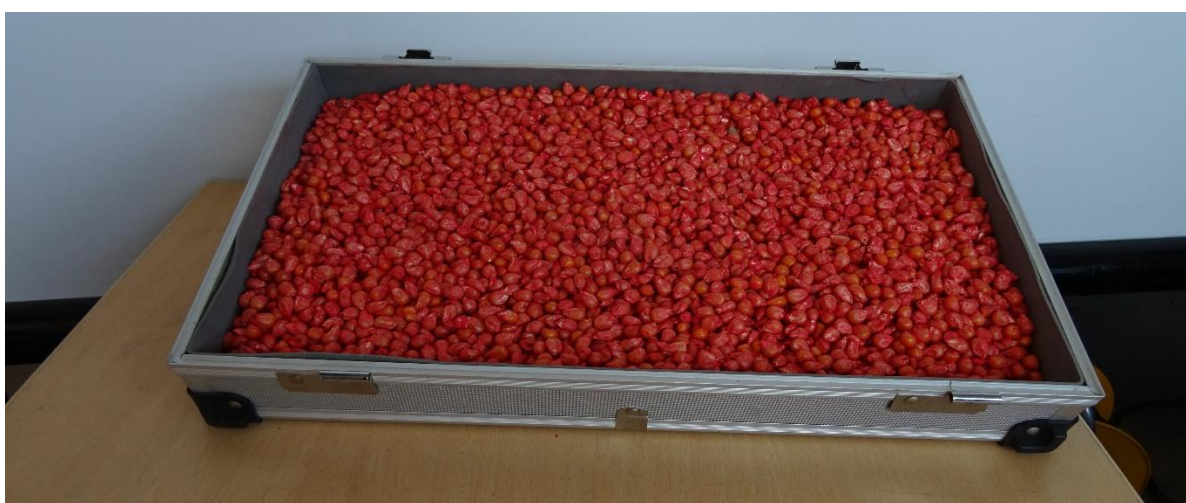
Slika 5. Sjeme KWS hibrida Konfites