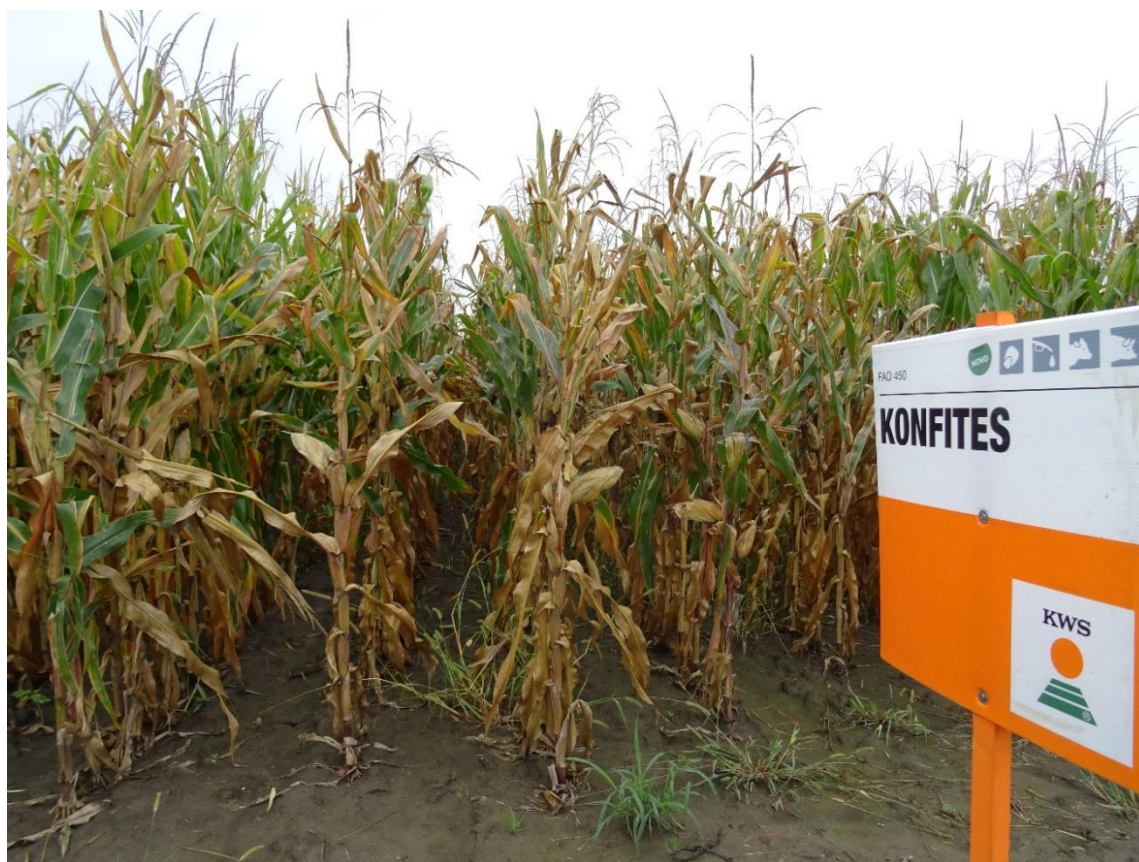
Slika 4. KWS hibrid Konfites

polijeganje usjeva. Gustoća sklopa ovog hibrida je 71 000 do 79 000 biljaka/m 2 , a najoptimalnija temperatura sjetvenog sloja je 8 do 12 °C .