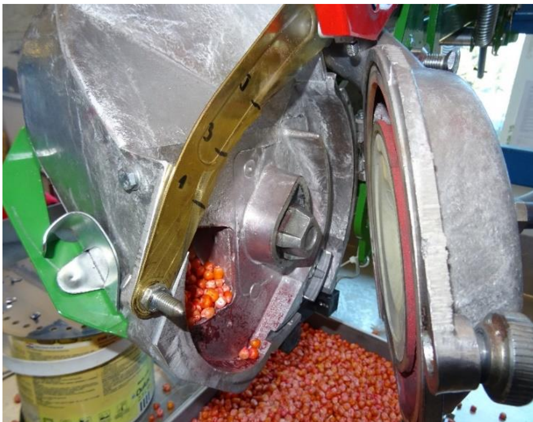
Slika 7. Komora za sjeme sijačice PSK OLT

Sjetveni aparat PSK OLT sijačice sastavljen je od spremnika za sjeme, komore sa sjetvenom pločom (Slika 7.), skidača viška sjemena, mehanizma za pogon sjetvene ploče, plastične cijevi za podtlak te ulagača sjemena.