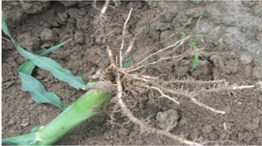
Slika 1. Korižen kukuruza