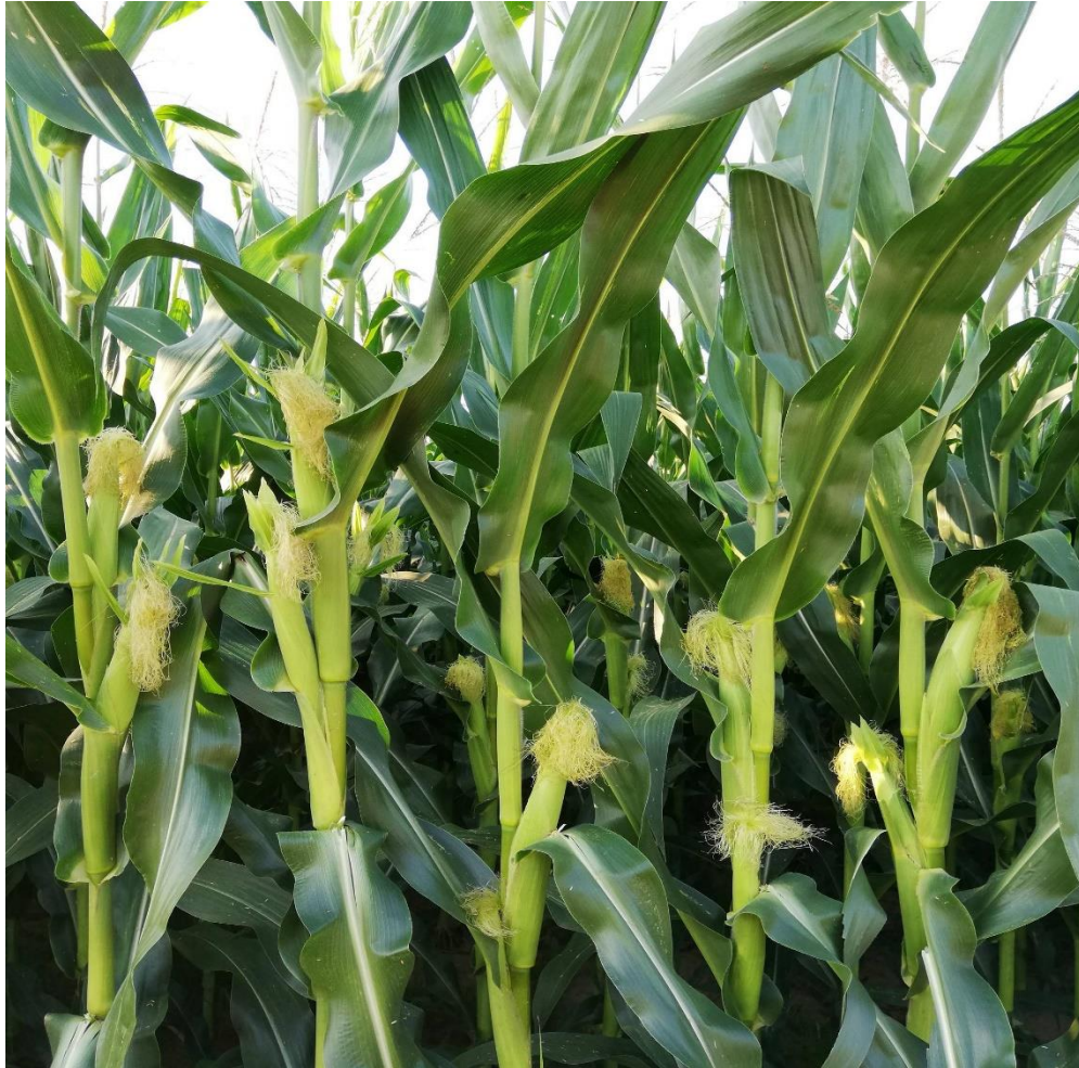
Slika 2. Stabljika i plod kukuruza