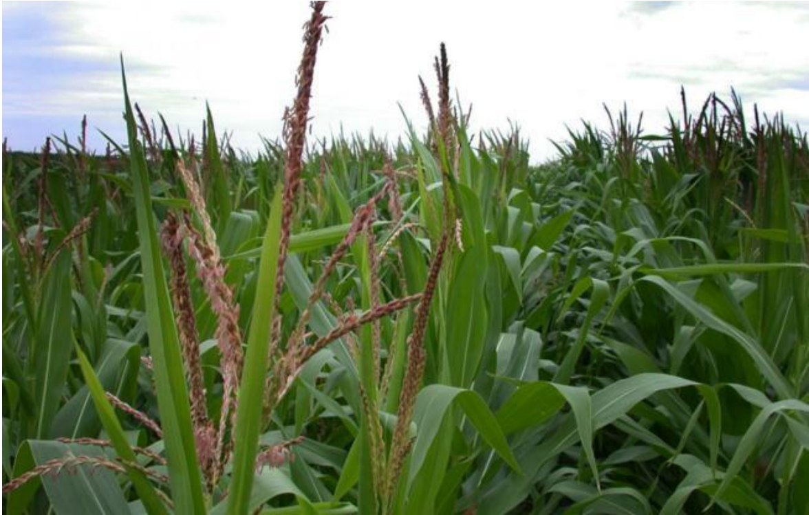
Slika 3. Metlica kukuruza