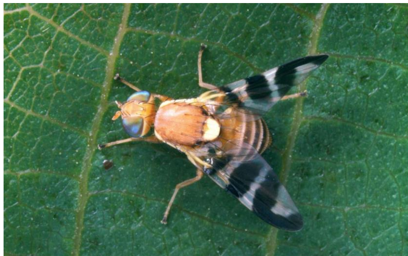
Slika 1. Orahova muha

ostalih štetnika su: lisne uši, orahova grinja, a pojavio se štetnik koji može biti koban za 100% prinosa, orahova muha (Slika 1).