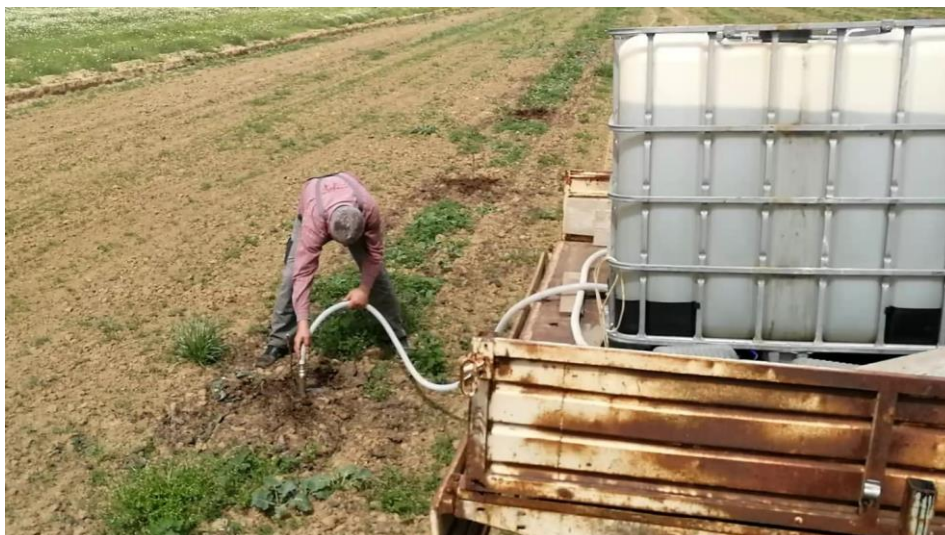
Slika 2. Navodnjavanje iz spremnika za vodu

Voda tijekom navodnjavanja nikako ne smije dolaziti u kontakt sa stablom, jer može doći do truljenja korijena i pojave gljivičnih infekcija. Navodnjavanje krajem ljeta i početkom jeseni treba izbjegavati, jer umanjuje kvalitetu i rodnost plodova, a produžuje trajanje vegetacije i samim time smanjuje otpornost na jesenski mraz ( http://pinova.hr/hr ).