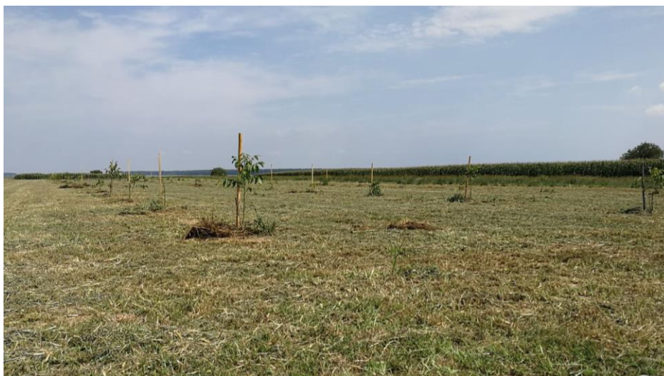
Slika 11. Mladi nasad u vegetaciji

Pomoću vrpce, kolčića i mjernog uređaja duljine, obilježena su mjesta sadnje (Slika 10). Sadnja se obavljala u jesenskom periodu. Sadna mjesta dimenzija 50 cm x 50 cm x 50 cm kopana su ručno, dva tjedna prije same sadnje, a korijen sadnica je prije sadnje natopljen u smjesu kravlje balege ilovače i vode. Ukoliko prije sadnje nije odrađena melioracijska gnojidba, potrebno je na dno rupe za sadnju ubaciti smjesu mineralnih gnojiva npr. MAP 2:53:0 i NPK 0:20:30 , a zatim preko toga sloj zemlje. Sadnicu se stavlja u sadno mjesto tako da mjesto kalema bude iznad površine tla (Slika 11). Oko posađene sadnice treba dobro ugaziti tlo kako bi korijen imao dobar kontakt sa zemljom, jer se tako smanjuje mogućnost smrzavanja korijena. Sadnice se odmah nakon sadnje zalijevaju s 20 l vode te se postavlja impregnirani drveni kolac natopljen u 3% otopine modre galice uz svaku sadnicu sa sjeverne strane, a oko sadnice mrežica koja je štiti od divljači.