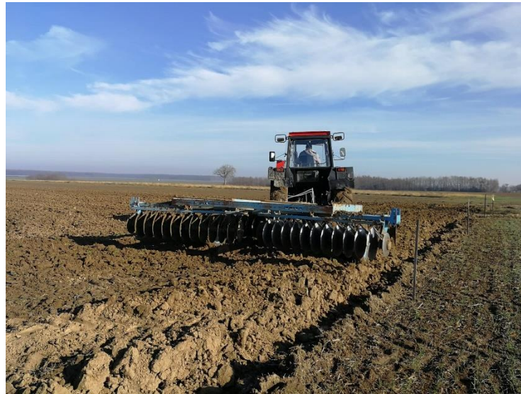
Slika 5. Tanjuranje teškom tanjuračom

Nakon podrivanja slijedi melioracijska gnojidba koju izvodimo na temelju analize tla. Nakon rasipanja i razbacivanja gnojiva, potrebno je obaviti oranje na dubinu od 50 cm kako bi se gnojivo ubacilo u srednje slojeve tla, a zatim tanjuranje teškom tanjuračom kako bi izravnali i usitnili površinski sloj tla (Slika 5).