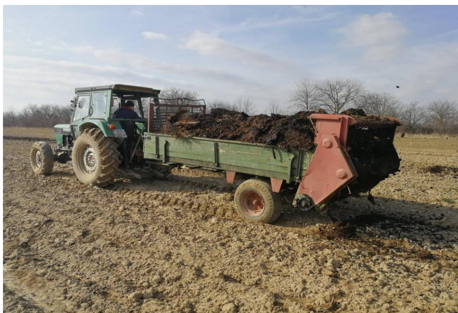
Slika 7. Gnojidba stajskim gnojivom

Organska gnojidba (stajska i/ili zelena gnojidba) nadoknađuje manjak organske tvari u tlu, intenzivira mineralizaciju i smanjuje ispiranje vodotopivih hraniva. Prema Žunić i Matijašević (2009.) za popravak od 1% humusa u tlu na 30 cm dubine, potrebno je unijeti oko 40-60 t stajskog gnoja po hektaru. Za popravak stanja humusa i u podoraničnom dijelu (30-60 cm) potrebno je izvršiti rigolanje, a organsku gnojidbu obaviti i prije i nakon operacije rigolanja. Ukupna količina stajskog gnojiva prema preporuci iz analize treba iznositi 80 t/ha. Razbacivanje stajskog gnojiva treba obaviti na čitavoj površini budućeg nasada (Slika 7).