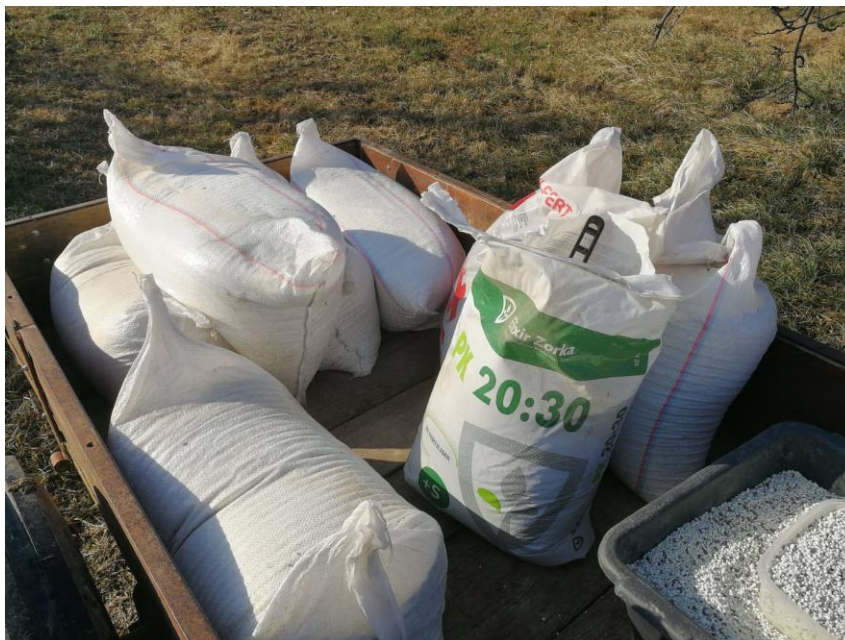
Slika 8. Mineralna gnojidba

Uz organsku gnojidbu, mineralnom gnojdbom (Slika 8) postiže se dodatni unos P_2O_5 i K_2O . Organska gnojidba sigurno će povećati koncentraciju fosfora i kalija u tlu i smanjiti potrebu za mineralnim gnojivom.