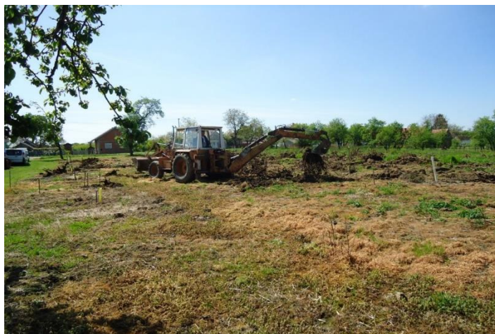
Slika 4. Krčenje starog nasada

Nagib terena vrlo je bitan faktor kod podizanja nasada, jer utječe na eroziju, otjecanje vode u tlu, osvjetljenost i prohodnost mehanizacije. Erozija tla predstavlja najveći problem na terenima s većim padom. Blago nagnuti tereni pogodniji su od potpuno ravnih terena zbog boljeg protoka zraka, odnosno boljeg oprašivanja, ali i manjom opasnosti od mraza. Na strmim terenima neophodna je izgradnja terasa i potpornih zidova (Lukač i sur., 2017.). Izrada terasa danas se obavlja odgovarajućom mehanizacijom pa je i cijena izrada niža nego prije. Kako bi se vršilo odvođenje viška vode, potrebno je izgraditi kanale koji prekidaju terase.