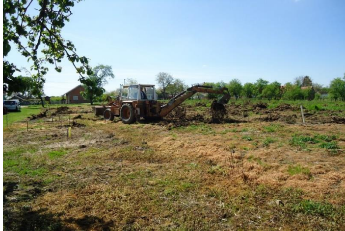
Slika 4. Krčenje starog nasada

Nagib terena vrlo je bitan faktor kod podizanja nasada, jer utječe na eroziju, otjecanje vode u tlu, osvjetljenost i prohodnost mehanizacije. Erozija tla predstavlja najveći problem na terenima s većim padom. Blago nagnuti tereni pogodniji su od potpuno ravnih terena zbog boljeg protoka zraka, odnosno boljeg oprašivanja, ali i manjom opasnosti od mraza. Na strmim terenima neophodna je izgradnja terasa i potpornih zidova (Lukač i sur., 2017.). Izrada terasa danas se obavlja odgovarajućom mehanizacijom pa je i cijena izrada niža nego prije. Kako bi se vršilo odvođenje viška vode, potrebno je izgraditi kanale koji prekidaju terase.