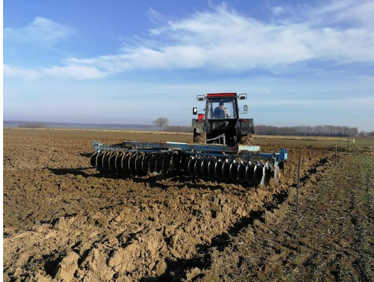
Slika 5. Tanjuranje teškom tanjuračom

Nakon podrivanja slijedi melioracijska gnojidba koju izvodimo na temelju analize tla. Nakon rasipanja i razbacivanja gnojiva, potrebno je obaviti oranje na dubinu od 50 cm kako bi se gnojivo ubacilo u srednje slojeve tla, a zatim tanjuranje teškom tanjuračom kako bi izravnali i usitnili površinski sloj tla (Slika 5).