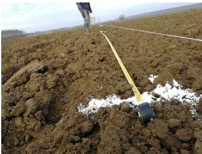
Slika 10. Označavanje kota

Raspored sadnje može biti u više oblika, neki od njih su : oblik pravokutnika, oblik kvadrata, oblik trokuta te po izohipsama. Koko obrt izabrao je raspored sadnje u obliku pravokutnika, s razmak između redova od 8 m, a razmak unutar reda 5 m. Smjer redova je u pravcu sjever-jug zbog najpovoljnijeg osvjetljenja i smjera vjetra.