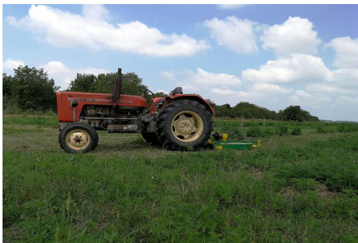
Slika 3. Mehanizacija

Koko obrt posjeduje skromnu mehanizaciju: traktor Ursus C-355, tanjurače, plugove, prskalicu, prikolicu, rasipač i malčer (Slika 3).