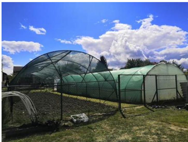
Slika 2. Plastenici za proizvodnju krizantema