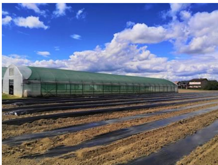
Slika 3. Plastenik za proizvodnju krizantema

Prethodna slika prikazuje plastenik površine 400 m 2 , u plastenik se sadi 5.000 veliko cvjetnih krizantema poznate vrste Luna. Krizanteme se sade u 5 redi između kojih je razmak za prolaz.