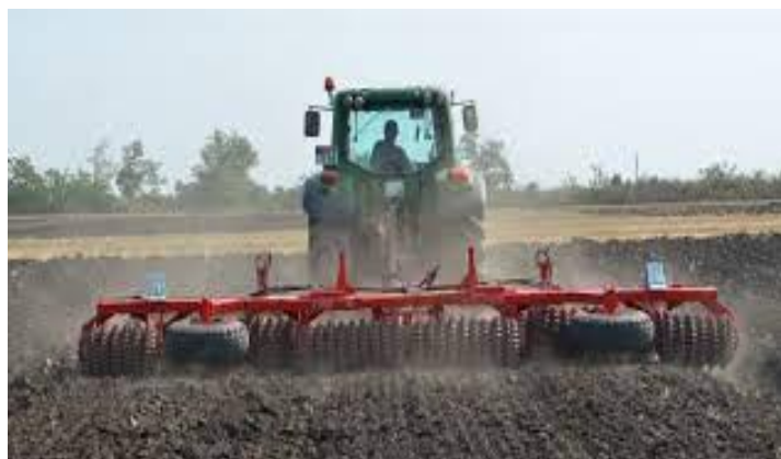
Slika 16. Valjanje usjeva