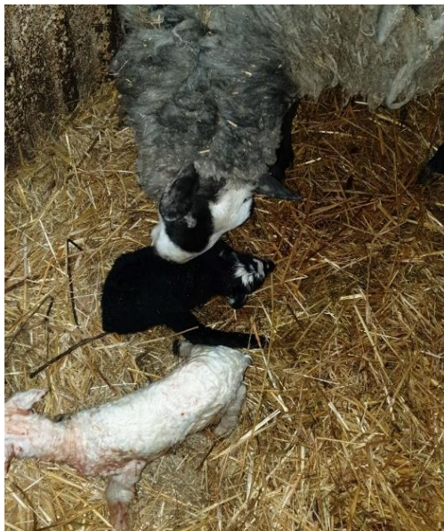
Slika 7. Prikaz ovce s janjadi nakon janjenja

Staja bi trebala sadržavati dio u kojem bi se ovce držale zajedno s ovnom radi mogućnosti prirodnog parenja. Objekt bi trebao biti organiziran tako da postoje i pojedinačni boksovi u kojima se drže ovce pred janjenje, te ovce zajedno s janjadi par dana nakon janjenja. U okviru glavnog objekta ili odvojeno od njega bilo bi poželjno imati i prostor za karantenu, odnosno prostor u kojem bi se mogle smjestiti bolesne ili ozlijeđene životinje, a on čini 5% ovčarnika (Senčić i sur., 2021.). Ovce se u pojedinačnim boksovima drže neposredno prije janjenja, te oko 5-10 dana nakon janjenja.