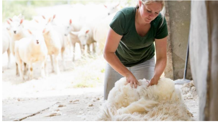
Slika 3. Prikaz rukovanja s vunom nakon striže ovaca

Kada se govori o brojnosti ovaca na našim područjima, velike posljedice na pad broja ovaca u Republici Hrvatskoj imao je Domovinski rat prije kojega se uzgajalo oko 750 000 ovaca, a nakon kojega je broj ovaca pao na svega 420 000 grla. Od 1997. godine do 2011. godine, broj ovaca se povećao gotovo za 200 000 grla. Tek nešto više od 200 proizvođača ima stada veća od 300 grla, a najveći broj uzgajivača ima stada prosječne veličine od 20 do 50 grla. Prema podacima iz 2011. godine, čak više od 60% uzgojno valjanih ovaca su izvorne pasmine ovaca. U kontinentalnom dijelu Hrvatske od izvornih pasmina ovaca najviše se uzgaja cigaja, a uz njih se dosta velikim brojem uzgajaju i inozemne pasmine merinolandšaf (Antunović i sur., 2012.).