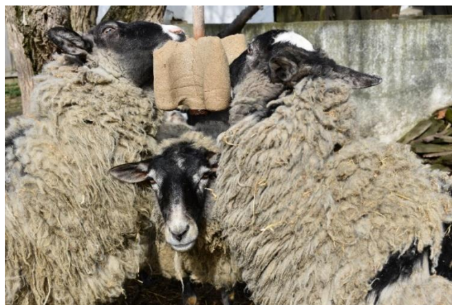
Slika 11. Prikaz soli u bloku kao izvora mineralnog dodatka u hranidbi ovaca