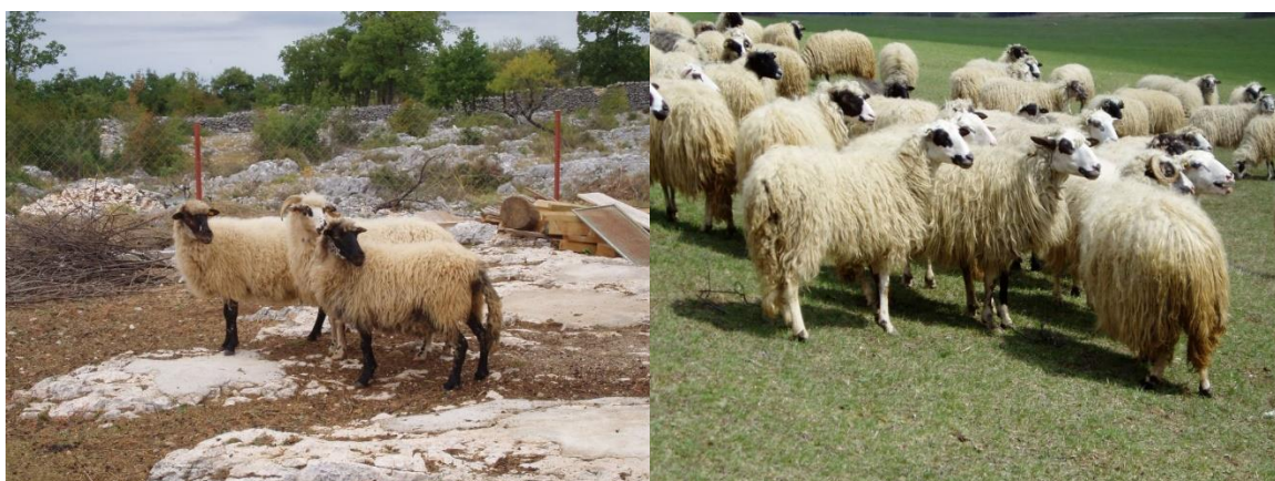
Slika 1. Prikaz dalmatinske pramenke lijevo i ličke pramenke desno

U uzgoju dominiraju hrvatske izvorne pasmine među kojima je najbrojnija dalmatinska pramenka s oko 280 000 rasplodnih ovaca u uzgoju (oko 44%). Lička pramenka s oko 30 000 rasplodnih ovaca čini oko 5% ukupne populacije ovaca u Hrvatskoj ( www.ovce-koze.hr ).