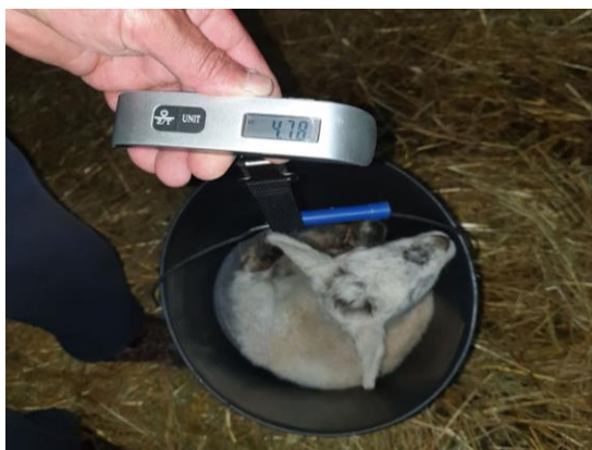
Slika 13. Prikaz vaganja janjadi nakon janjenja

Označavanje janjadi provodilo se zbog lakšeg raspoznavanja i praćenja janjadi u istraživanju. Janjad se označavala privremenim markicama nekoliko sati nakon janjenja. Vaganje je provedeno pomoću digitalne vage koja mjeri masu do 50 kg. Prvo vaganje janjadi obavljeno je odmah nakon janjenja (porodna masa). Vaganja su se obavljala kontinuirano svakih mjesec dana od dana kada se janjad vagala prvi put, odnosno od dana janjenja. Utvrđena je porodna tjelesna masa janjadi, kao i tjelesne mase u dobi od 30, 60, 90 i 120 dana. Utvrđena je i klaonička masa janjadi, odnosno masa prije klanja te masa zaklanog trupa. Izračunati su i prosječni dnevni prirasti janjadi od 1. dana do dobi janjadi od 120 dana, prema formuli: (završna tjelesna masa - početna tjelesna masa) / trajanje istraživanja. Od ukupno 15 životinja, samo 2 janjadi je bilo zaklano u dobi od 90 dana kad je postigla završne tjelesne mase. Omjer spolova u istraživanju tijekom 2021. i 2022. iznosio je ukupno 60% muške janjadi, te 40% ženske janjadi, odnosno 6 ženskih janjadi te 9 muških (Tablica 2).