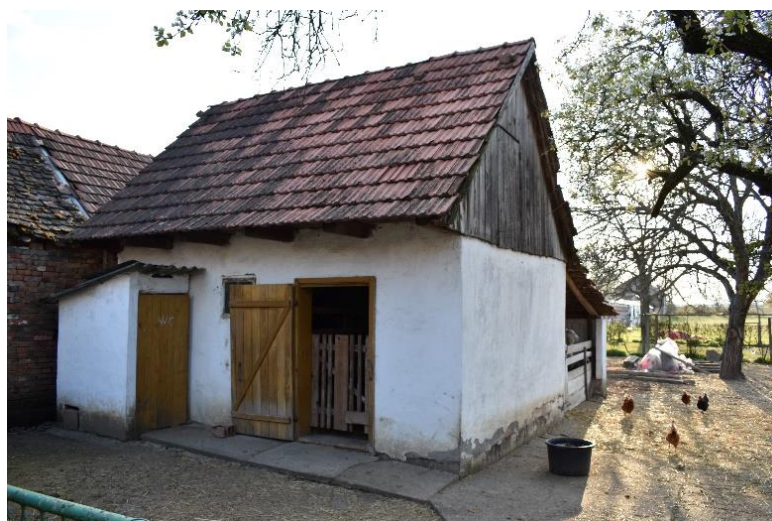
Slika 6. Staja za uzgoj ovaca na malom poljoprivrednom gospodarstvu

Pri izgradnji objekta treba voditi računa o tome da objekt bude napravljen tako da bude što manje nedostataka koji bi kasnije mogli utjecati na pojavu bolesti kod životinja. Trebalo bi voditi računa o lokaciji objekta, mikroklimatskim uvjetima te o kapacitetu objekta (Matejaš i Koturić, 2004.). Objekt u ovčarstvu najviše ovisi o sustavu uzgoja. Postoje 3 sustava uzgoja, a to su ekstezivni, poluintezivni i intezivni sustav uzgoja. Pod ekstezivnim sustavom držanja ovaca podrazumijevaju se uzgoji ovaca s malim proizvodnim mogućnostima u čiju se proizvodnju ne ulažu velika novčana sredstva ( www.agroklub.com ). Poluintezivan sustav je držanje ovaca na paši tijekom ljeta (5 do 8 ovaca na 1 ha površine pašnjaka), a tijekom zime kada su nepovoljni vremenski uvjeti i kada je vegetacija u prirodi siromašna, ovce se drže u zatvorenom i hrane se s voluminoznim krmivima uz dodatak koncentriranih krmiva ( www.agroklub.com ). Intenzivan sustav je držanje ovaca u uvjetima specijalizirane proizvodnje gdje su velika ulaganja u objekte, nabavu kvalitetnog stada, mehanizaciju, opremu i krmiva. Ovce se mogu smjestiti u montirane objekte ili u posebno izgrađene nastambe. Na manjim obiteljskim imanjima ili poljoprivrednim gospodarstvima to su uglavnom manje staje. Na velikim gospodarstvima te nastambe moraju biti puno veće što svakako ovisi o broju ovaca koji će se u njemu držati.