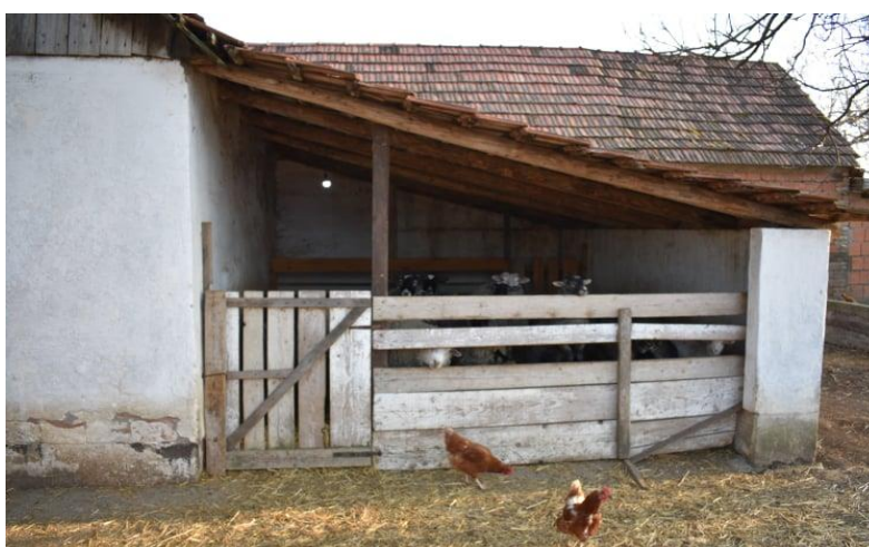
Slika 9. Prikaz poluotvorene staje u kojem su ovce smještene tijekom godine

Kada bi se gledale same ovce i njihove potrebe za smještajem, one bi se cijelu godinu mogle držati na otvorenom uz improviziranu nadstrešnicu koja bi im služila za zaklon od kiše i jakog sunca. Smještaj ovaca može biti vrlo jednostavan i ne mora biti skup kao što to bude kod gradnje objekta za druge vrste domaćih životinja. Važno je da u tom prostoru bude suho