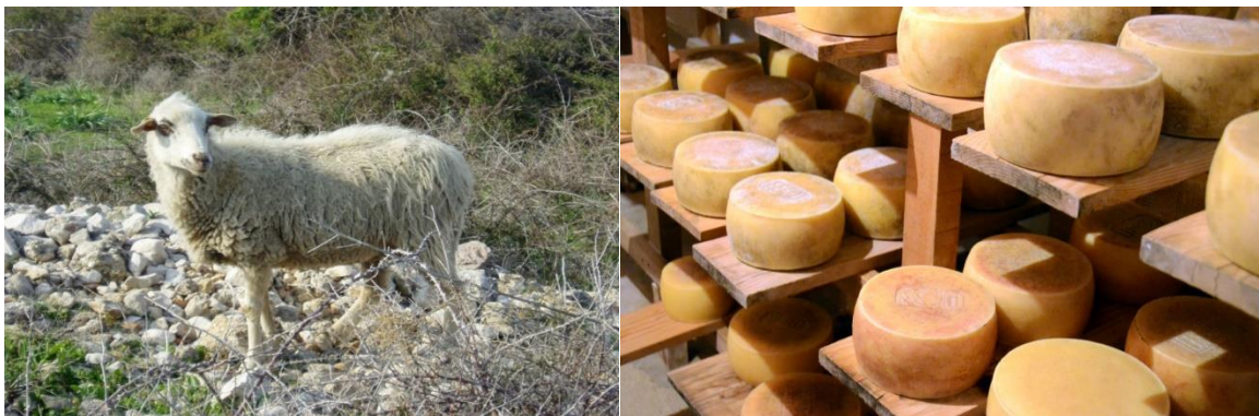
Slika 2. Prikaz paške ovce i svjetski poznatog paškog sira

Postoje površine u Republici Hrvatskoj koje druge životinje ne mogu koristiti, a koje nisu pogodne niti za jednu ratarsku proizvodnju, no pogodne su za napasivanje ovaca. Postoje dakle uvjeti povoljni za nastavak daljnje proizvodnje ovaca u Republici Hrvatskoj, ali isto tako i za širenje obujma proizvodnje te povećanje broja ovaca držanih u uzgoju. U Hrvatskoj se od ukupnog broja ovaca čak 93% ovaca koristi za proizvodnju mesa, odnosno janjetine, a samo mali dio ovaca se koristi za proizvodnju ovčjeg mlijeka. Proizvodnja ovčjeg mlijeka je tradicionalna proizvodnja temeljena na uzgoju naših izvornih hrvatskih pasmina ovaca uglavnom na otocima te u Istri i u Lici. Od mlijeka koje se dobije, vodeću ulogu u preradi mlijeka u sir imaju Paška sirana i Vindija d.d. (Antunović i sur., 2012.).