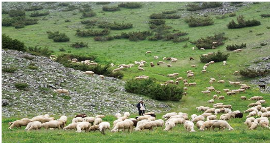
Slika 4. Prikaz uzgoja ovaca u Republici Hrvatskoj

Kada se govori o brojnosti ovaca na našim područjima, velike posljedice na pad broja ovaca u Republici Hrvatskoj imao je Domovinski rat prije kojega se uzgajalo oko 750 000 ovaca, a nakon kojega je broj ovaca pao na svega 420 000 grla. Od 1997. godine do 2011. godine, broj ovaca se povećao gotovo za 200 000 grla. Tek nešto više od 200 proizvođača ima stada veća od 300 grla, a najveći broj uzgajivača ima stada prosječne veličine od 20 do 50 grla. Prema podacima iz 2011. godine, čak više od 60% uzgojno valjanih ovaca su izvorne pasmine ovaca. U kontinentalnom dijelu Hrvatske od izvornih pasmina ovaca najviše se uzgaja cigaja, a uz njih se dosta velikim brojem uzgajaju i inozemne pasmine merinolandšaf (Antunović i sur., 2012.).