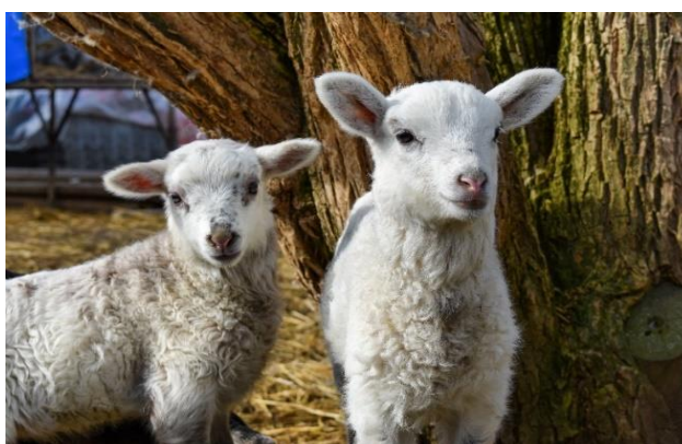
Slika 5. Prikaz janjadi

Ovce osim svojih kulinarskih, kulturoloških pa i turističkih atrakcija bez kojih se više ne mogu zamisliti određeni događaji i aktivnosti, a osobito različite svečanosti imaju i vrlo bitnu ekološku važnost jer pridonose razvoju i održivosti različitih biljnih i životinjskih vrsta ( www.ovce-koze.hr ).