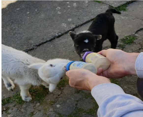
Slika 10. Prikaz hranidbe janjadi sa zamjenskim mlijekom

krava (Antunović i Novoselec, 2021.). Mlijeko u prahu miješa se s prokuhanom vodom, a nakon hlađenja spremno je za hranidbu janjadi. Kako bi se janje brže priviknulo na čvrstu hranu, odnosno kako bi se stimulirao brži razvoj predželudaca, s prihranjivanjem bi trebalo početi u dobi od 8 do 10 dana (Antunović, 2015.).