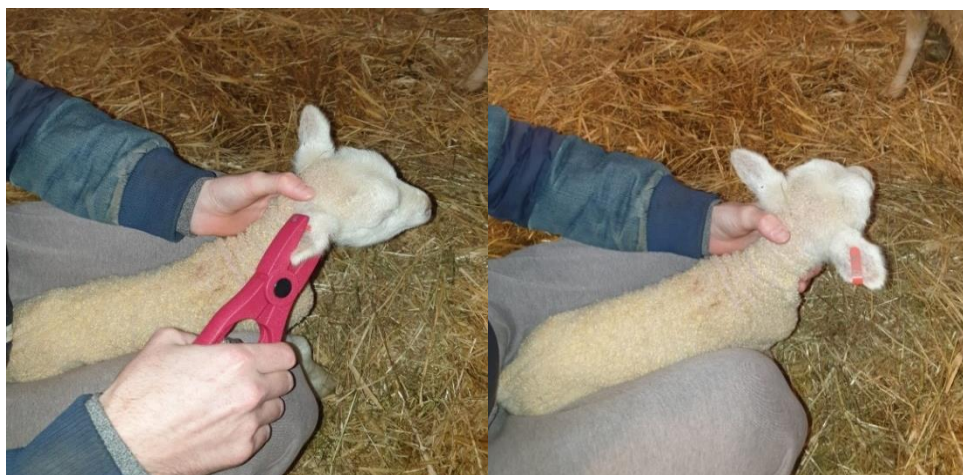
Slika 12. Prikaz označavanja janjadi privremenim markicama

Označavanje janjadi provodilo se zbog lakšeg raspoznavanja i praćenja janjadi u istraživanju. Janjad se označavala privremenim markicama nekoliko sati nakon janjenja. Vaganje je provedeno pomoću digitalne vage koja mjeri masu do 50 kg. Prvo vaganje janjadi obavljeno je odmah nakon janjenja (porodna masa). Vaganja su se obavljala kontinuirano svakih mjesec dana od dana kada se janjad vagala prvi put, odnosno od dana janjenja. Utvrđena je porodna tjelesna masa janjadi, kao i tjelesne mase u dobi od 30, 60, 90 i 120 dana. Utvrđena je i klaonička masa janjadi, odnosno masa prije klanja te masa zaklanog trupa. Izračunati su i prosječni dnevni prirasti janjadi od 1. dana do dobi janjadi od 120 dana, prema formuli: (završna tjelesna masa - početna tjelesna masa) / trajanje istraživanja. Od ukupno 15 životinja, samo 2 janjadi je bilo zaklano u dobi od 90 dana kad je postigla završne tjelesne mase. Omjer spolova u istraživanju tijekom 2021. i 2022. iznosio je ukupno 60% muške janjadi, te 40% ženske janjadi, odnosno 6 ženskih janjadi te 9 muških (Tablica 2).