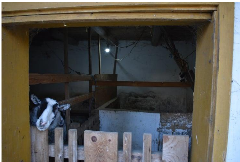
Slika 8. Prikaz glavnog dijela ovčarnika

janjadi. Bilo bi poželjno kada bi pregrade bile od jednostavnog i lakog materijala kako bi se sami objekti i njihova funkcija mogli prenamijeniti po potrebi (Matejaš i Koturić, 2004.).