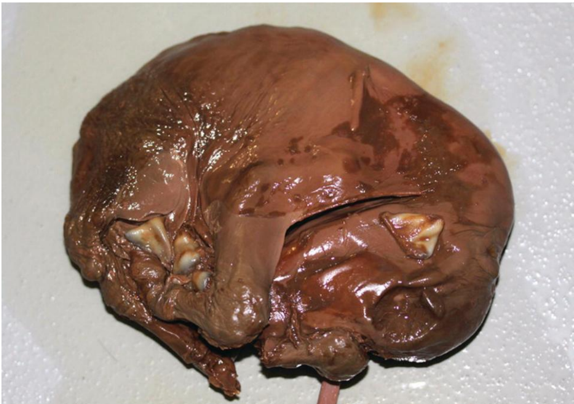
Slika 3. Hematična mumifikacija ploda

Hematična mumifikacija ploda javlja se češće nego papirusna. Plodne vode i tjelesne te tkivne vode se resorbiraju, ali su plod i podne ovojnice okružene viskoznim, tamno obojenim tvarima. Hematična mumifikacija može se javiti između 3. i 8. mjeseca gravidnosti, a najčešće se javlja između 4. i 6. mjeseca.