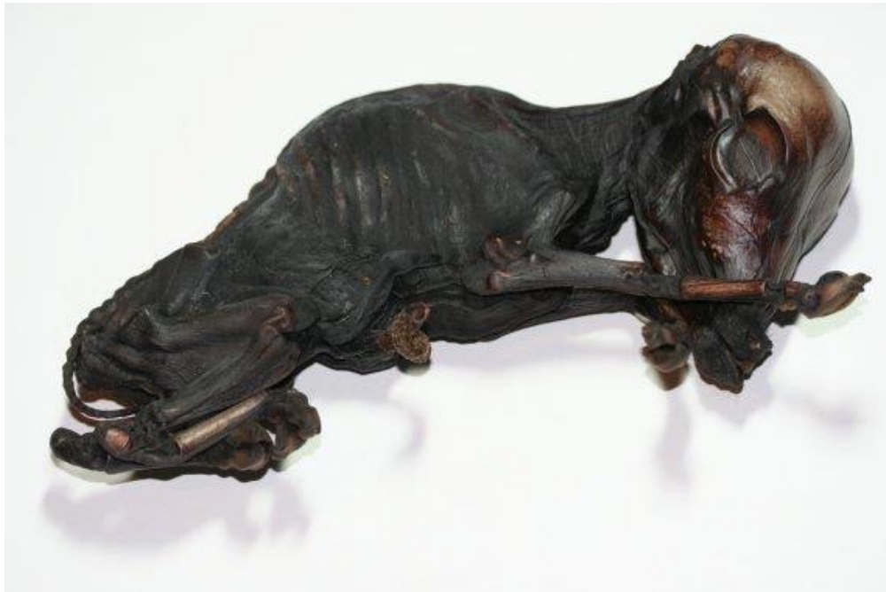
Slika 2. Mumificirani plod

Ukoliko plod uquine u kasnijem stadiju gravidnosti, nakon što je počela osifikacija kostiju, i ako ostane u maternici, dolazi do mumifikacije zbog resorpcije plodnih voda, te tjelesnih i tkivnih tekućina. Pretpostavlja se da uzroci mumifikacije mogu biti genski uzroci, torzija ili kompresija pupkovine i hormonalne nepravilnosti tijekom graviditeta. Plotkinje mogu nositi mumificirani plod od 3 mjeseca, pa čak do 2 godine, s obzirom da nema nikakvih vanjskih simptoma koji upućuju na postojanje mumificiranog ploda. Mumificiran plod se najčešće dijagnosticira prilikom rektalnog pregleda zbog produljenog graviditeta. Najbolji način liječenja je izazivanje pobačaja pomoću PGF_{2\alpha} ili sintetičkih analoga PGF_{2\alpha} . Prostaglandini će uzrokovati razgradnju žutog tijela i izazvati pobačaj kroz 2 do 4 dana.