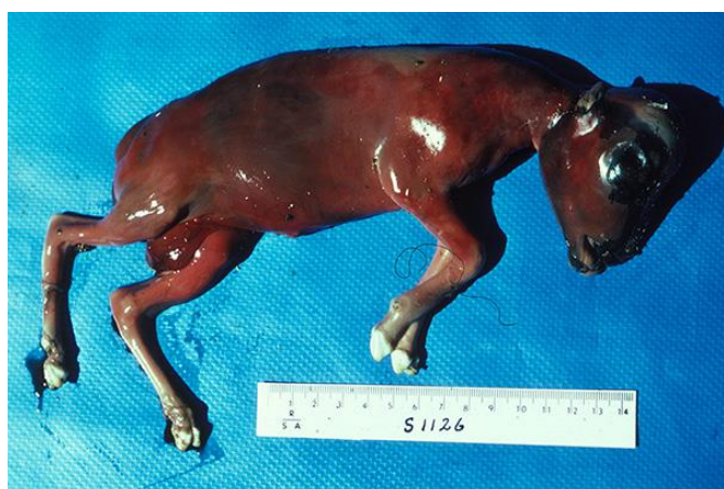
Slika 1. Pobačeni fetus uzrokovan bakterijom Brucella abortus