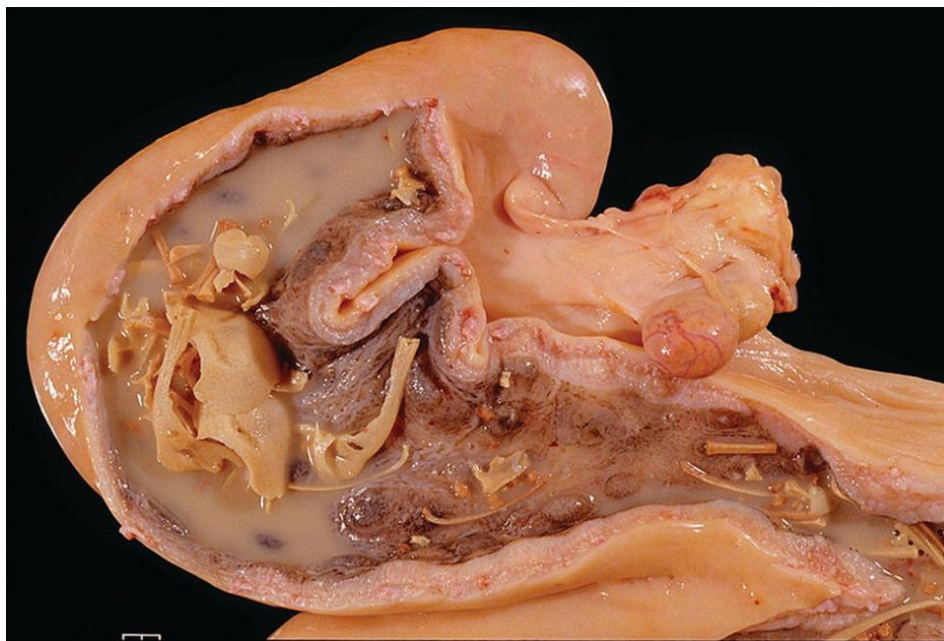
Slika 4. Macerirani plod u materničnom rogu

Maceracija je proces pri kojem se mekani dijelovi uginulog ploda raspadnu u sluzavo-gnojnu masu, a koštani sustav ploda se olabavi ili sasvim raspadne. Prilikom maceracije ploda najčešće u sluzavoj gnojnoj masi ostanu samo kosti, što može biti od osobite važnosti prilikom razlikovanja ovog stanja od mumifikacije ploda. Da bi došlo do maceracije, preduvjet je kataralno-gnojni endometritis. Nekada je čest uzrok bila trihomonasna invazija, no ona je danas kod nas gotovo iskorijenjena. Uz maceraciju ploda, najčešće se razvije i kronični gnojni metritis. Upalni proces može se proširiti, pa se razviju parametritis i perimetritis. Maceracija ploda je karakterizirana konstantnim ili povremenim gnojnim iscjetkom iz maternice u kojem se često nađu i manje kosti. Najbolje ju je liječiti pokušajem izazivanja pobačaja, isto kao i kod mumifikacije ploda. Teške slučajeve maceracije ploda s komplikacijama ne treba niti pokušati liječiti.