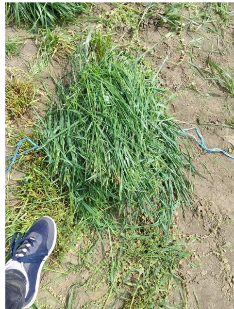
Slika 6. i 7. Prinos zelene mase tijekom prvog otkosa