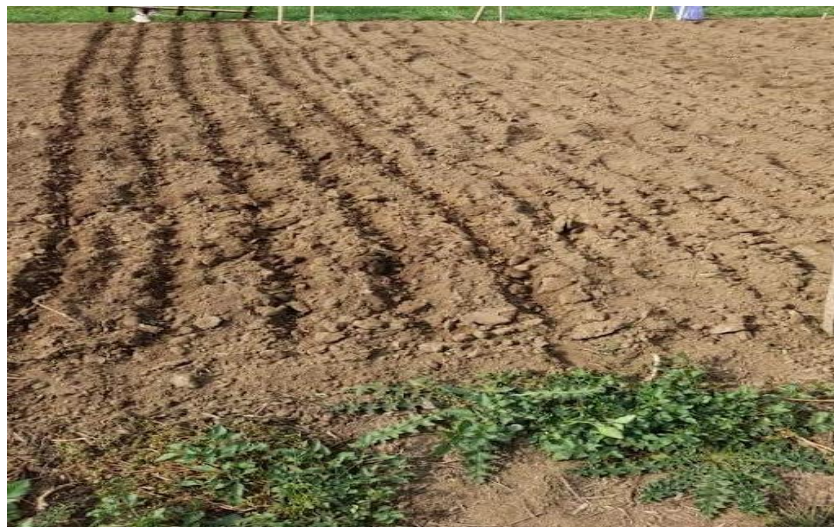
Slika 5. Sjetva vlasulje trstikaste

Vlasulju trstikastu sorte B-18 karakterizira dobra razvijenost korijenovog sustava te visoka otpornost na niske temperature, mraz i sušu. B-18 je po karakteristikama ozima kultura sa malim zahtjevima za tlo, može se uzgajati na tlima pH raspona od 4.9 - 9.5. Također karakterizira ju i visok prinos zelene mase vrhunske kvalitete koji je u prosjeku oko 100 t/ha i prinosa sijena s 15% vlage 25 t/ha. Cvat kod sorte B-18 je rastresita metlica, biljka formira busem od 120 do 150 cm visine sa uspravnim stabljikama koje su otporne na polijeganje i listovima dužine 60 -150 cm svijetlo zelene do tamno zelene boje. Rok sjetve vlasulje trstikaste sorte B-18 je rano proljeće ili kasno ljeto. Norma sjetve iznosi 40 kg/ha sjemena, a masa 1000 zrna iznosi 4.2 g. Vlasulja trstikasta koristi se za košnju, ispašu, silažu, sjenažu, sijeno, zelenu masu, te se koristi kao dodatna komponenta u DTS-u za napasivanje. Košnja vlasulje trstikaste za zelenu masu i sijeno se treba obaviti prije metličanja kod prvog porasta. Nutritivna vrijednost sorte B-18 kod sirovi probavljivi proteini u zelenoj masi iznosi 1,9%, a škrobni ekvivalent u zelenoj masi iznose 11,8%. ( https://bc-institut.hr/krmno-bilje/trave/vlasulja-trstikasta-b-18/ ).