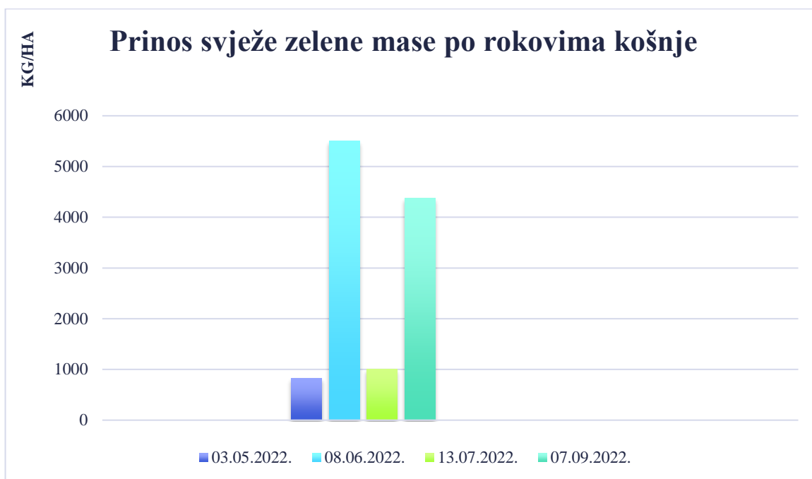
Grafikon 1. Prinos svježe zelene mase

Najveći prinos svježe zelene mase i suhe tvari dobili smo u drugom otkosu 08.06.2022. kada je vlasulja trstikasta bili u vegetativnoj fazi. Prinos vlasulje trstikaste u drugom otkosu iznosio je 5.500 kg/ha odnosno 1.320 kg ST /ha.