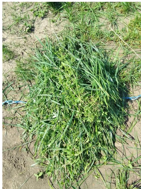
Slika 10. i 11. Prinos zelene mase tijekom trećeg otkosa