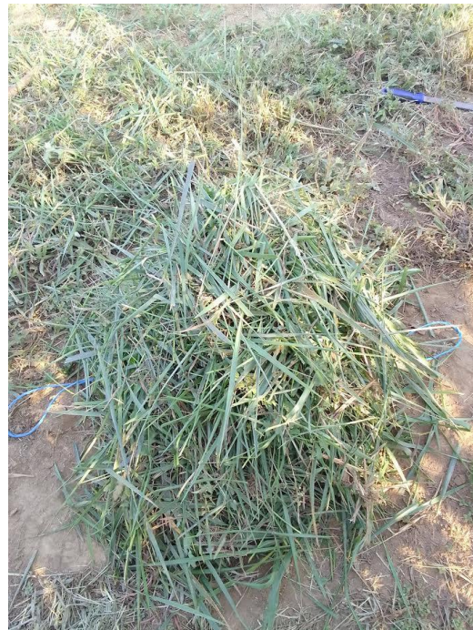
Slika 12. i 13. Prinos zelene mase tijekom četvrtog otkosa