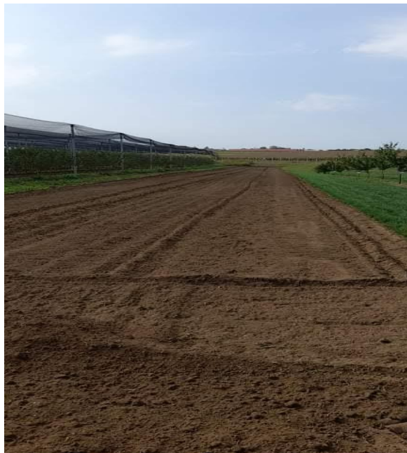
Slika 4. Priprema parcele za sjetvu

Istraživanje je izvedeno putem poljskog pokusa (Slika 4.). Parcela na kojoj je izvršen pokus nalazi se na pokušalištu Fakulteta agrobiotehničkih znanosti u blizini Tenje. Poljski pokus započeo je 27.9.2021. godine sjetvom (Slika 5.) vlasulje trstikaste ( Festuca arundinacea L. ) sa 20 grama sjemena sorte B-18 (Bc instituta) na parcelama površine 6 m 2 , što je odgovaralo normi sjetve od 33,3 kg/ha. Sjetva se provela u 4 ponavljanja (tj. osnovne parcelice) kako bi što bolje i preciznije odredili godišnji prinos i distribuciju vlasulje trstikaste. Sjetva sjemena obavljena je preciznim razbacivanjem sjemena iz ruke te je sjeme plitko uneseno u tlo pomoću ručnih greblji. Sjetvi je prethodila plitka obrada tla traktorskom frezom sa maksimalnom dubinom obrade od 5 cm.