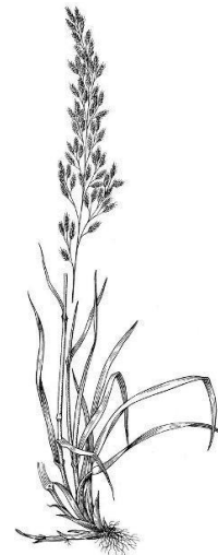
Slika 2. vlasulja trstikasta

CARSTVO Plantae RED Poales PORODICA Poaceae ROD Lolium VRSTA Festuca arundinacea L.