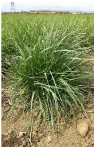
Slika 1. Vlasulja trstikasta

Vlasulja trstikasta je višegodišnja trava, vrlo cijenjena u proizvodnji voluminozne krme. Prema Jovanoviću (1985.), vlasulja trstikasta ( Festuca arundinacea L.) je ozima trava visoke otpornosti na niske temperature i mraz, i nema velike zahtjeve za vodom te dobro podnosi sušu. Vlasulja trstikasta (slike 1 i 2) lako se prilagođava različitim uvjetima uzgoja, može se uzgajati u suhim, vlažnim i svježim staništima te je dobro otporna na stajanje vode (poplave) na poljoprivrednom zemljištu, može preživjeti i do mjesec dana pod vodom. Vlasulja trstikasta je rasprostranjena diljem svijeta ali se najviše uzgaja u Sjevernoj Americi i Europi dok se nešto manje uzgaja u Sjevernoj Africi i Australiji.