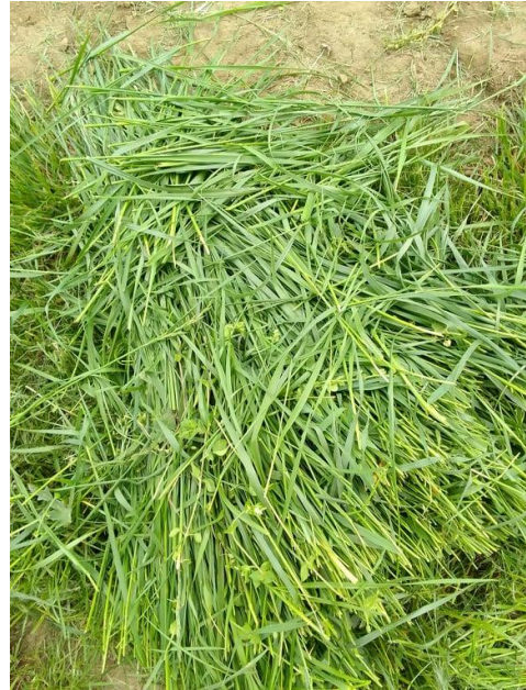
Slika 8. i 9. Prinos zelene mase tijekom drugog otkosa