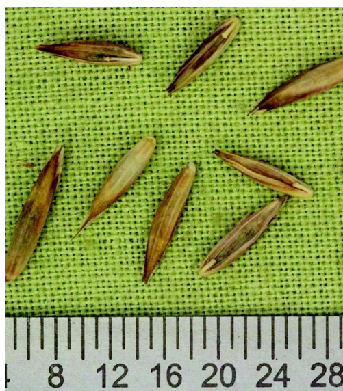
Slika 3. Sjeme vlasulje trstikaste