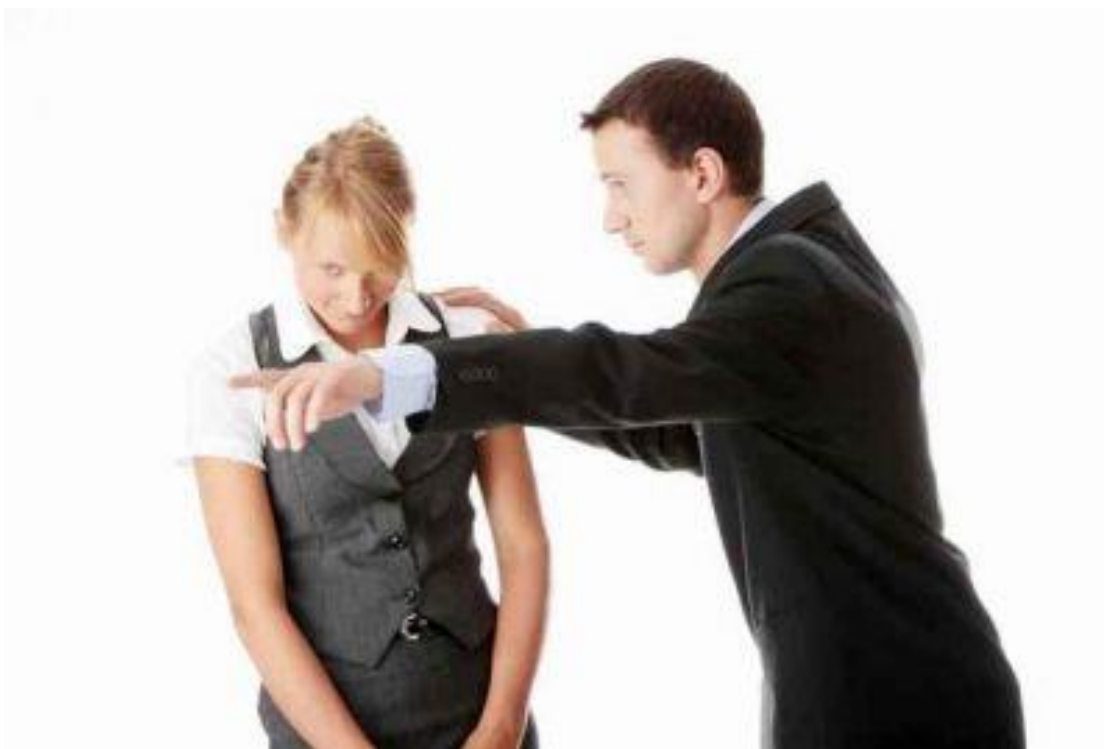
Slika 1. Diskriminacija po spolu