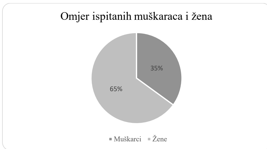
Grafikon 1. Omjer ispitanih žena u odnosu na muškarce

Tablicom je prikazan omjer ispitanika na temelju podjele po spolu i broju nezaposlenih, odnosno broju zaposlenih. Gdje je veći dio žena u omjeru od 90% zaposlenih, dok je muškaraca 70% zaposlenih. Ispitano je 40 osoba. Od kojih 24 zaposlene žene, 2 nezaposlene, 9 zaposlenih muškaraca i 5 nezaposlenih muškaraca.