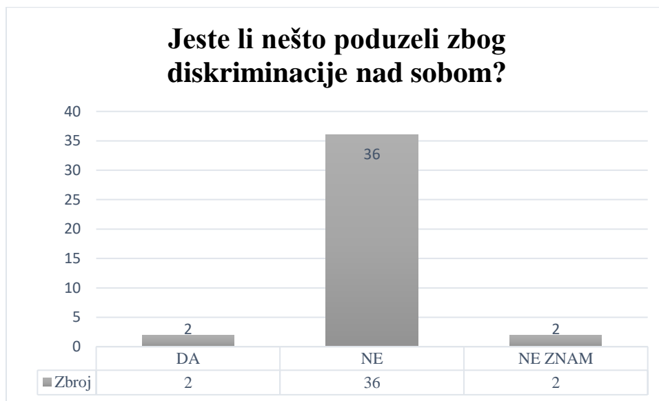
Grafikon 6: Pomoć kod suzbijanja diskriminacije

Iz grafikona 6. možemo vidjeti odgovore na iduće pitanje na anketi. Uviđamo da nažalost, pojedinci ili skupine ljudi nad kojima je provedena diskriminacija ne poduzimaju ništa kako bi riješili problem i osjećaj isključenosti. Samo dva ispitanika je poduzelo nešto kako bi izborilo za sebe boljitak. Kako možemo uvidjeti, po stručnom terminu, vjeruju da do ovoga dolazi zbog manjka obrazovanja o temeljnim ljudskim pravima, te da bi se u škole i sveučilišta moglo uključiti obrazovanje o toj temi kako bi se stekla bolja opća znanja.