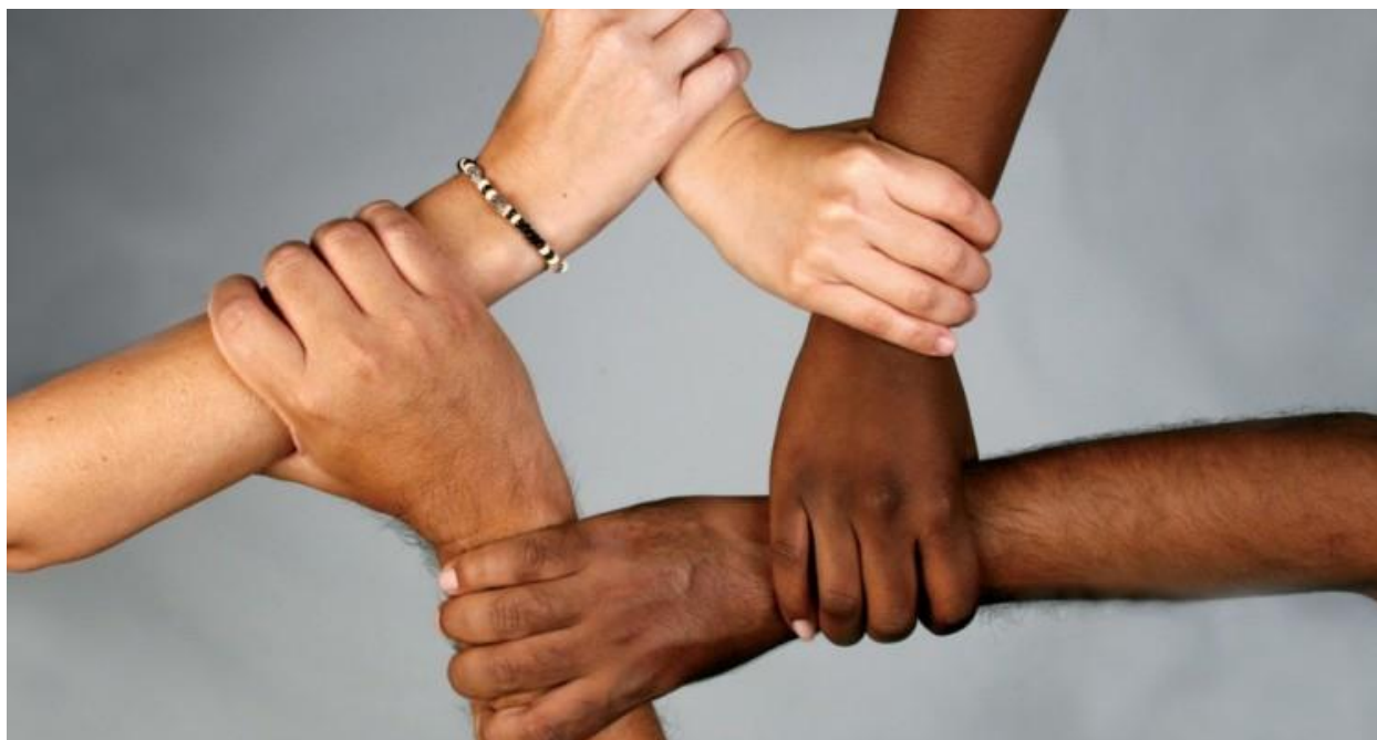
Slika 2. Rasna različitost

Hrvatskoj. Kao takav, on jamči pravo na slobodu, pravo na rad, na zapošljavanje pod jednakim uvjetima, pravo na godišnji odmor, pravo na zaradu i ostala radna prava. Svu tu uređenost ima na uvid svaki građanin, preko Ustava ili na stranicama Narodnih Novina, gdje svakodnevno izlaze sve promjene koje su vezane za zakonsku regulativu u Republici Hrvatskoj. U ustavu stoji; Svatko u Republici Hrvatskoj ima prava i slobode, neovisno o njegovoj rasi, boji kože, spolu, jeziku, vjeri, političkom ili drugom uvjerenju, nacionalnom ili socijalnom podrijetlu, imovini, rođenju, naobrazbi, društvenom položaju ili drugim osobinama (Ustav Republike Hrvatske, članak 14., 1992., www.zakon.hr ) .