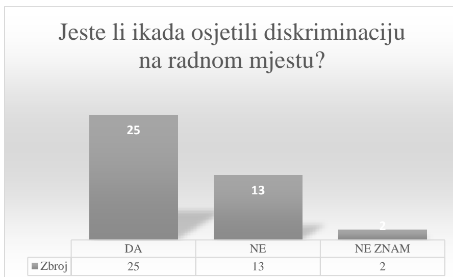
Grafikon 5. Osjećaj diskriminacije kod ispitanika

Postavljeno je i pitanje jesu li se ispitanici osjećali diskriminirano na tržištu rada, bilo spola, vjere, invaliditeta.