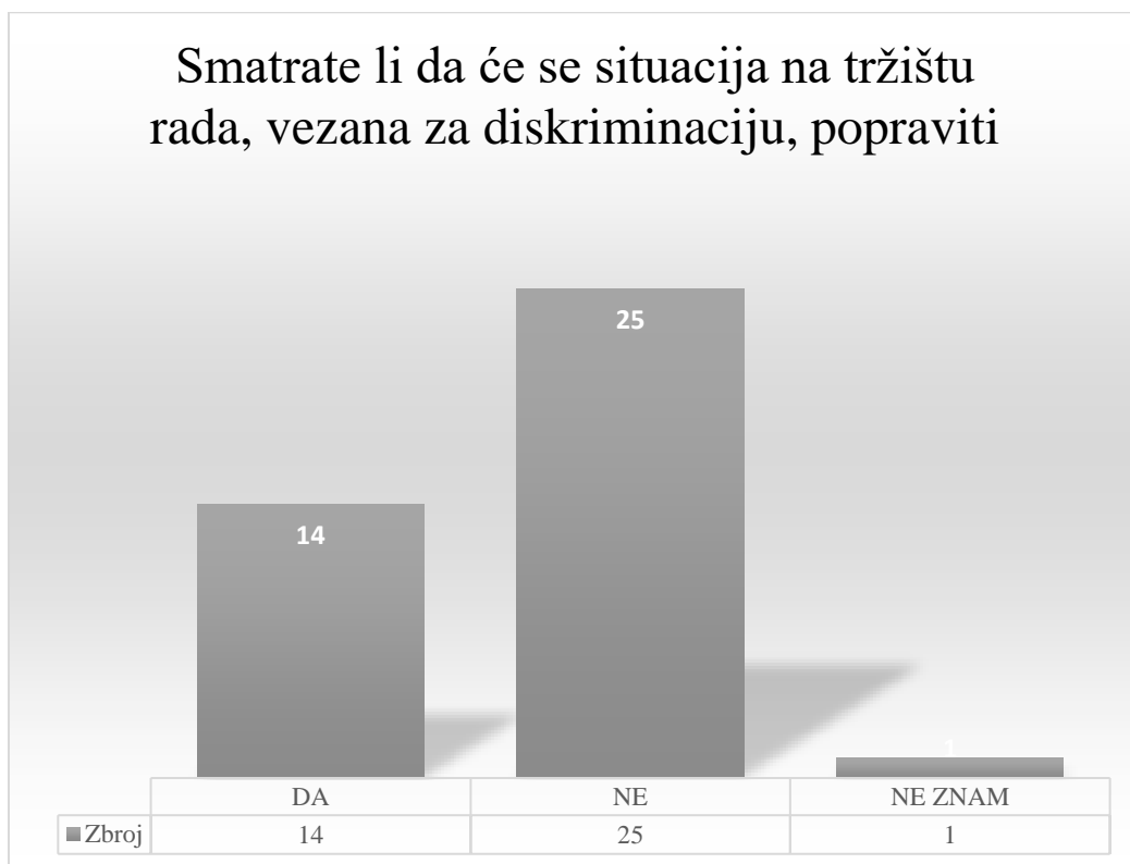
Grafikon 7. Promjena diskriminacije u budućnosti

Na samom kraju ankete, postavljeno je pitanje vjeruju li ispitanici da će se situacija na tržištu rada promijeniti na bolje što se tiče diskriminacije.