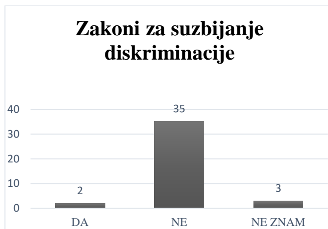
Grafikon 4. Suzbijanje diskriminacije