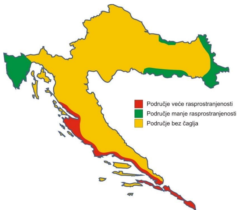
Slika 2. Rasprostranjenost čaglja u Hrvatskoj 2000. Godine