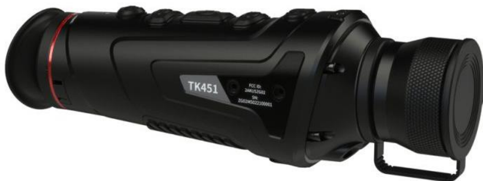
Slika 9. Termovizijski monokular (osmatrač)

Postoje termalni uređaji koje koristimo kao ciljnike. Većina njih je samostalna ali i postoje nastavci koje se mogu nadograditi na klasični dnevni ciljnik. Naravno da njihovu slabu primjenu diktira i visoka cijena većine od njih, pa su tako osmatrači daleko pristupačnija a i ne manje učinkovita opcija za većinu lovaca.