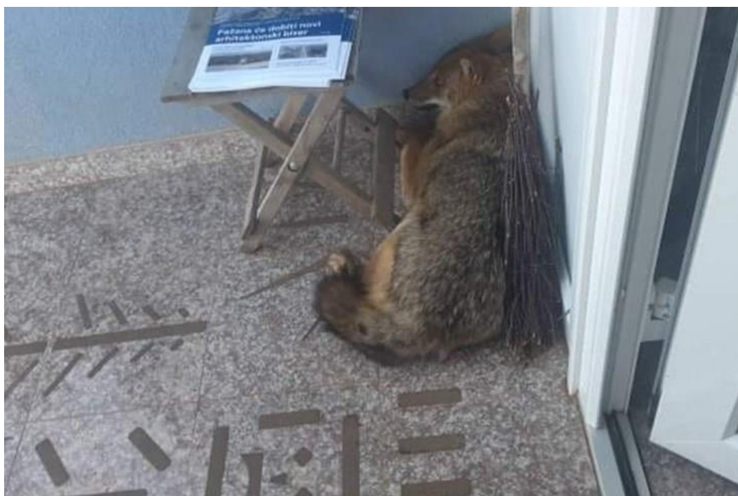
Slika 4. Čagalj na kućnom pragu

U novije vrijeme svjedoci smo sve češće pojave divljači u blizini, pa i unutar naseljenih mjesta. U ruralnim područjima to je što više postalo i normalno, ali divljač pa tako i čagalja sve češće može vidjeti na rubovima velikih gradova, pa čak i unutar kvartova koji su na rubnim dijelovima gradova. U medijima sve su češći natpisi o takvoj vrsti događaja, pa tako možemo pročitati da ga se može sresti i u samome glavnom gradu Zagrebu . Prije svega valja napomenuti da čagalj za ljude u pravilu nije opasan, ali treba pripaziti na domaće životinje i kućne ljubimce. U naseljena mjesta prvenstveno ga privlači obilje lako dostupne hrane, raznog otpada prvenstveno animalnog porijekla, ali i domaće životinje, sitna perad, kunići i podmlatka od ovce, svinje i ostalih domaćih životinja.