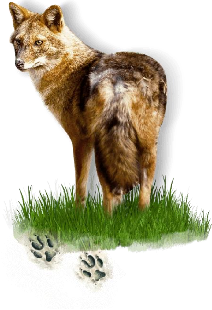
Slika 1. Čagalj ili Canis aureus