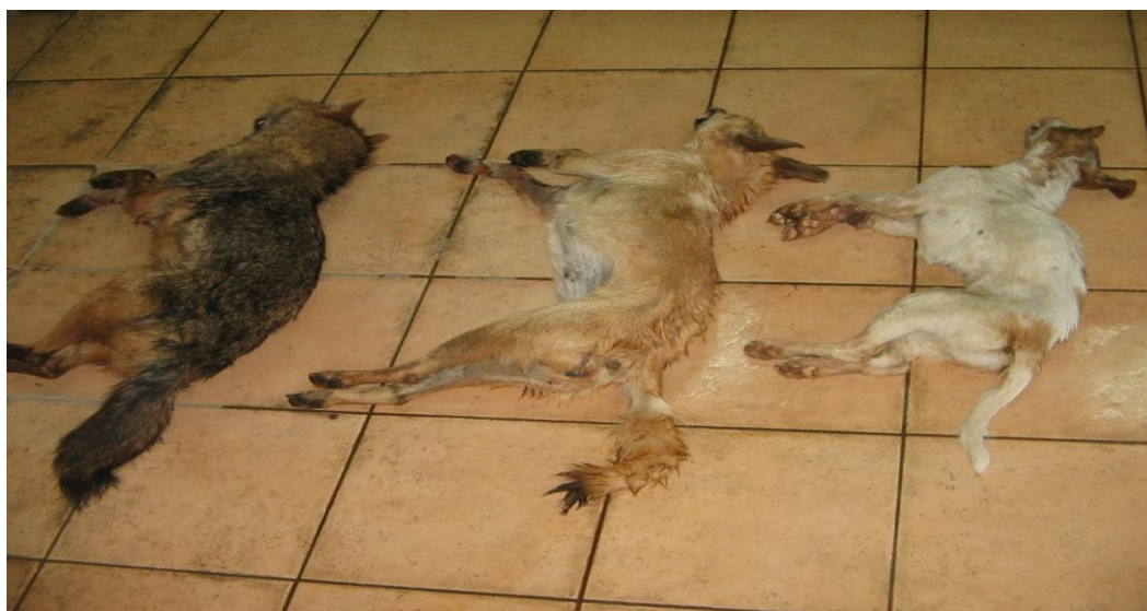
Slika 5. Lijevo tipičan čagalj, u sredini ženka križanac između domaćeg psa i ženke čaglja, desno sin ženke u sredini i kratkodlakog istarskog goniča.

Čagalj kao relativno nova vrsta u našim lovištima, u svom staništu susreće se sa drugim vrstama životinja. Većinu njih pogotovo druge predatore nastoji izbjegavati ili otjerati od sebe, pa prema tome možemo reći da suživot živi samo sa pripadnicima iste vrste. Sam po sebi čagalj kao predator je sličniji vuku nego lisici. Čagalj potiskuje lisicu pa prema tome gdje je populacija čaglja veća u pravilu populacija lisice se smanjuje. Ali na teritoriju vuka, vrlo rijetko možemo naći čaglja, tek poneke zalutale primjerke. Boravak na prostoru gdje borave psi nije rijedak slučaj i često ga se može zabilježiti, pa prema tome dolazi i do parenja čaglja sa psom. Više slučajeva je zabilježeno i na području Hrvatske pa tako i na području Slavonije. Pojedine primjerke ovakvih vrsta križanja ćemo prepoznati samim izgledom, ali da bi podatci bili točni potrebno ih je potvrditi genetskom analizom. Populacije čaglja koje se križaju s psima treba držati pod nadzorom. Jedan od razloga je mogući prijenos zaraznih bolesti kao što su parvoviroza i štenećak sa domaćih pasa na divlje kanide. Za pretpostaviti je da bi križanci ovih dviju vrsta u slučaju pojave bjesnoće značajno doprinijeli njezinom širenju. Samo pravilnim gospodarenjem, odnosno odstrelom možemo spriječiti ovakve slučajeve.