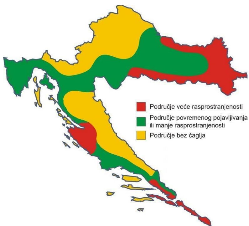
Slika 3. Rasprostranjenost čaglja u Hrvatskoj 2010. godine