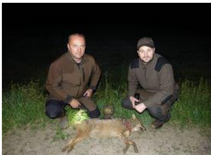
Slika 4 Uspješni odstrel LD Jastreb Babina Greda