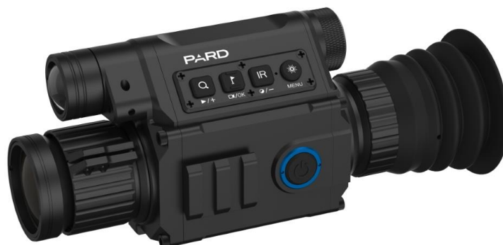
Slika 10. Digitalne dnevno noćne optike korištene u osmatranju

Može se reći da je sama tehnologija različita od termovizijskih uređaja, ali svrha im je jednaka. Za razliku od termovizije, svaki noćni uređaj, pri lošijem ili nikakvom osvjetljenju treba dodatan izvor svjetlosti. Tako da svaki noćni osmatrač sadrži iluminator odnosno laser, koji služi kao dodatni izvor svjetlosti. Mana im je što ga divljač lako uočava i bježi, pa nam ostavlja malo vremena za detekciju. Također kod većine noćnih uređaja postoji problem i pri velikoj količini svjetlosti. Ako se uređaj upali pri jačoj svjetlosti leća se može oštetiti. Uređaji su digitalni pa većina koristi punjive baterije. Svakako je savjet pri osmatranju ponijeti više rezervnih baterija. Postoji više varijanti i izvedbi ovakvih uređaja. Također kao i kod termovizije postoje osmatrači i ciljnici.. Zavisno od proizvođača postoji mogućnost i da jedan digitalni ciljnik sadrži opciju da može biti i dnevni i noćni osmatrač. Ova opcija uređaja je sve češća i primjenjivija u lovu. Jedna od varijanti je i nadogradnja dnevnog ciljnika sa nastavkom za noć. Pošto je većina njih cjenovno prihvatljivija od termalnih ciljnika pa možemo reći da su našli širu primjenu u lovaca.