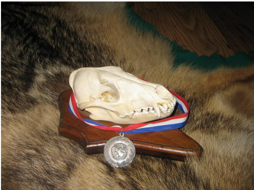
Slika 6. Lubanja odstreljenog čaglja

Čagalj pripada skupini sitne dlakave divljači čiji se trofej lovi. Njegov trofej može biti dat na ocjenu, ali kako stoji da ocjena trofeja čaglja nije obavezna, vrlo mali broj lubanja dolazi na ocjenjivanje. Pod trofej čaglja kao što je vidljivo na slici 6 možemo smatrati lubanju i krzno čaglja, ali češće koristimo lubanju. Potrebno je izmjeriti duljinu i širinu lubanje, a kod krzna uz duljinu i širinu postoje i dodatci na izgled krzna koji mogu donijeti dodatne bodove odnosno točke. Trofejna vrijednost čaglja nam je i pokazatelj samih uvjeta za život pa prema tome na području Slavonije i Baranje možemo očekivati veliki udio čagljeva u medalji.