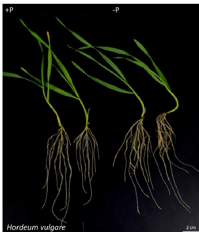
Slika 4. Korijenov sustav ječma ( Hordeum vulgare L.)

Ječmov korijen (Slika 4)., kao i korijenje ostalih žitarica, žiličast je te se sastoji od primarnog korijena i sekundarnog korijena. Primarni korijen se sastoji od 4 do 8 korjenčića. Sekundarni korijenov sustav male je upojne snage te je slabo razvijen. Ječmov korijen je najslabije razvijen od korijena svih žitarica i ima najmanju upojnu moć, zbog toga je za proizvodnju ječma potrebno osigurati bolje površine za proizvodnju, odnosno dostatnu hranidbu (Gagro, 1997.).