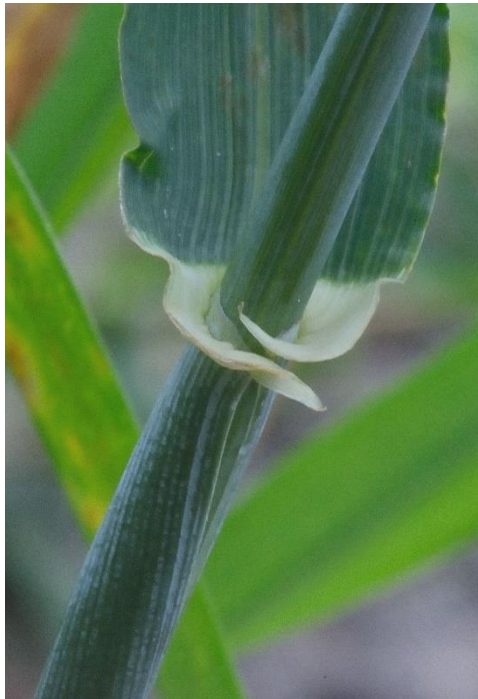
Slika 5. Stabljika i rukavac lista ječma ( Hordeum vulgare L.)

na polijeganje. Ječam busa znatno jače od ostalih žitarica te može stvoriti do 5 sekundarih vlata, pa je s time smanjena potreba za većom količinom sjemena pri sjetvi (450-500 klijavih sjemeni za ozimi ječam, a 550-650 za jari ječam). Snaga busanja ječma ovisi o sortimentu, vegetacijskom prostoru, agrotehnici te klimatskim uvjetima. U punoj zrelosti stabljika poprima slamnasto žutu boju, iako kod nekih sortimenata antocijan prelazi u ružičastu boju (Pospišil, 2010.).