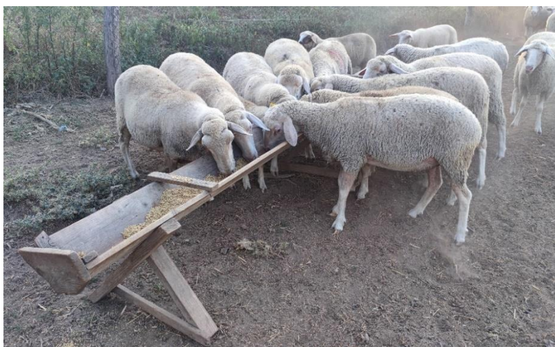
Slika 1. Krmni ječam u ishrani stoke na OPG-u David Martinov 2022. godine

Prema zastupljenim površinama, ječam je rangiran na četvrto mjesto među žitaricama, nakon pšenice, kukuruza i riže. Ječam ima kraće trajanje vegetacije u odnosu na pšenicu pa je kod ozimih tipova dužina vegetacije 240-260 dana, a kod jarih 60-130 dana. Prema upotrebi razlikujemo krmni i pivarski ječam. U krmne spadaju višeredni ozimi ječmovi koji se koriste za hranidbu stoke u obliku zrna (Slika 1.) te u oblicima silaže, zelene mase i slame. U pivarske ječmove spadaju dvoredni, većinom jari ječmovi. Krmni ječam u pravilu je rodniiji od pivarskog ječma. U ljudskoj ishrani ječam se malo koristi, najčešće u obliku ječmene kaše, griza ili pahuljica te kao surogat za kavu (Mihajlović, 1996.; Reiner i sur., 1980.; Paunović i Madić, 2011.).