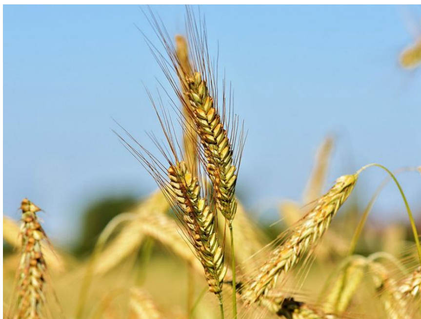
Slika 6. Klas ječma ( Hordeum vulgare L.)

Klasić ima građu kao i klasić ostalih žitarica, iako ječmov klasić oblikuje samo jedan plodan cvijet dok je drugi zakržljao (bazalna četkica). Donja pljevica ječma nosi osje, a pljevice su najčešće srasle sa zrnom. Ječam je samooplodna biljka i oplodnja se uglavnom odvije prije punog klasanja i prije nego se iz pljevice pojave prašnici (Pospišil, 2010.).