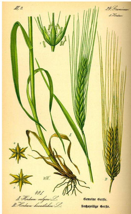
Slika 2. Hordeum vulgare L. i Hordeum hexastichon