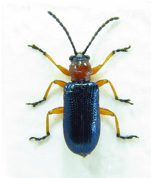
Slika 8. Žitni balac ( Oulema melanopus )

Štetnici ječma su voluharice, poljski miševi, lema, lisne uši i stjenice, dok lemu treba izdvojiti kao najznačajnijeg štetnika ječma koji jedini nanosi velike štete. Lema ( Oulema melanopus ) (Slika 8.) je svake godine zastupljena na ječmu, odrasli oblici su tamnoplave do crne boje metalnog sjaja. Veličine su 4-6 mm, razlikuju se po boji nogu i nadvratnog štitića. Najveće štete nanosi ličinka, najčešće u drugoj polovici svibnja te početkom lipnja.