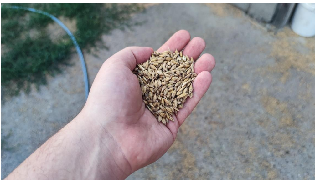
Slika 7. Zrno ječma ( Hordeum vulgare L.)

Zrno ječma sadrži 10-15 % bjelančevina, 70-75 % ugljikohidrata, 4-5 % celuloze, oko 3 % mineralnih tvari i oko 2,5 % ulja. Pivarski ječam trebao bi sadržavati manje od 12 % bjelančevina. Ako za proizvodnju piva koristimo višeredne ječmove s većim postotkom bjelančevina, umjesto dvorednih, bjelančevine moraju biti visokomolekularne s većim sadržajem sumpora (Lalić i sur., 2008.).