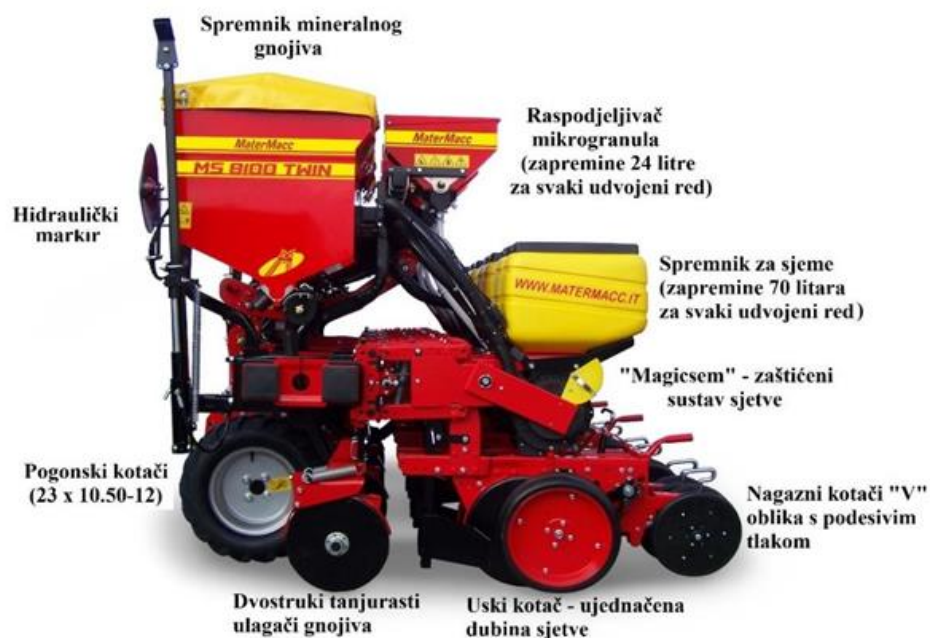
Slika 4. Glavni sustavi sijačice Maternacc Twin Row 2