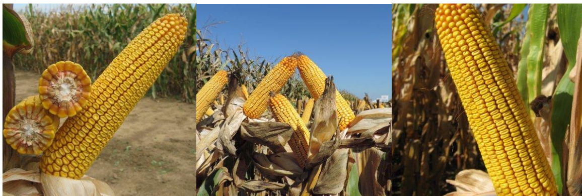
Slika 10.: Plod hibrida OS 378