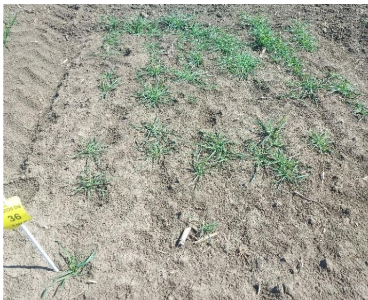
Slika 13. Prostratum tip busanja T. dicoccoides