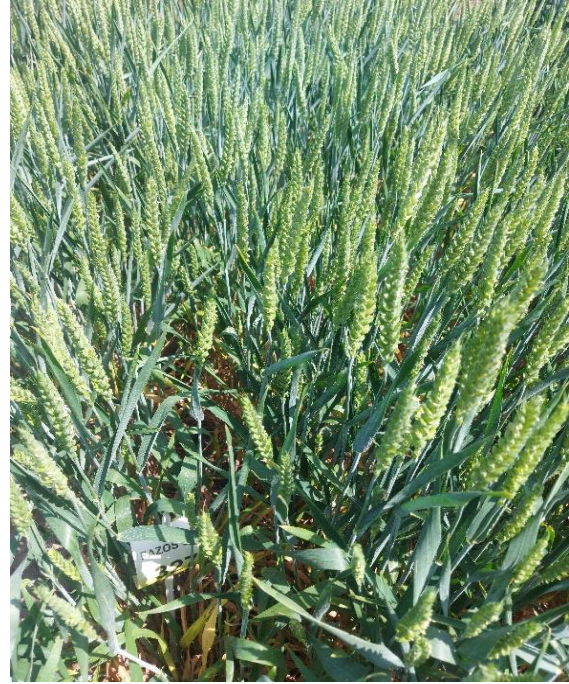
Slika 11. Kultivar Gemini