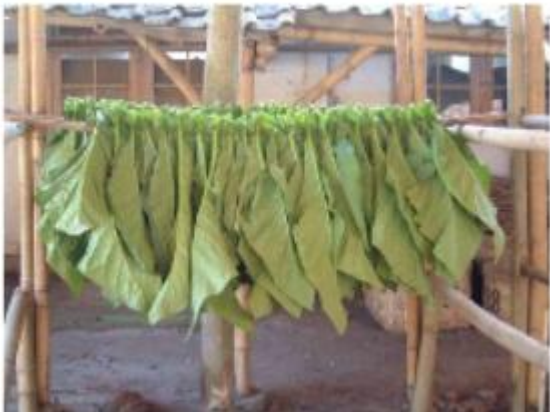
Slika 6. Air-cured duhan

Listovi ovog tipa duhana suše se vanjskim zrakom i ne smiju biti izloženi izravnim sunčevim zrakama (slika 6.). Da bi se skratilo razdoblje sušenja, ponekad se sušenje stimulira i umjetnim sušenjem (ventilatorima) kako bi se uvjeti sušenja ujednačili. Listovi sušeni na taj način dobivaju tamnu čokoladnu boju.