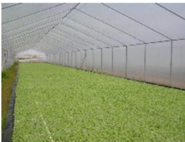
Slika 9. Hidroponi duhana

Za proizvodnju presadnica služe plastenici (slika 9.) u obliku tunela dužine 15 do 48,2 m i širine 4,7 m. Visoki su 2,35 m. Prekriveni su polietilenskom folijom debljine 0,20 mm. Plastenici trebaju biti izgrađeni na mjestima gdje se što bolje mogu iskoristiti sunčeva svjetlost i toplina. Mogu se prozračivati otvaranjem čeonih strana ili ugradnjom ventilatora pri vrhu konstrukcije. Prije nego dođe do razine rasada, svježi zrak se u plasteniku mora izmiješati s toplim. Cirkulacijom zraka (oko 2 km/h), ujednačava se temperatura i tijekom noći odstranjuje se CO 2 iz zone presadnica. Temperatura zraka u plasteniku danju bi trebala biti između 22 i 24 °C, a noću ne bi smjela biti ispod 15°C. 20