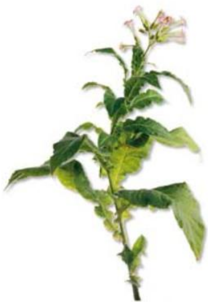
Slika 3. Stabljika duhana

Stabljika je zeljasta i podijeljena na nodije i internodije. Dužina internodija razlikuje se od sorte do sorte, ali se selekcijom duhana nastoje razviti niži kultivari sa što kraćim internodijima i većim brojem listova. Stabljika naraste između 0.5 i 3 m, na što veliki utjecaj ima tip duhana i intenzitet agrotehnike. Visina stabljike mjeri se od baze do vrha procvjetale biljke (slika 3.). 13