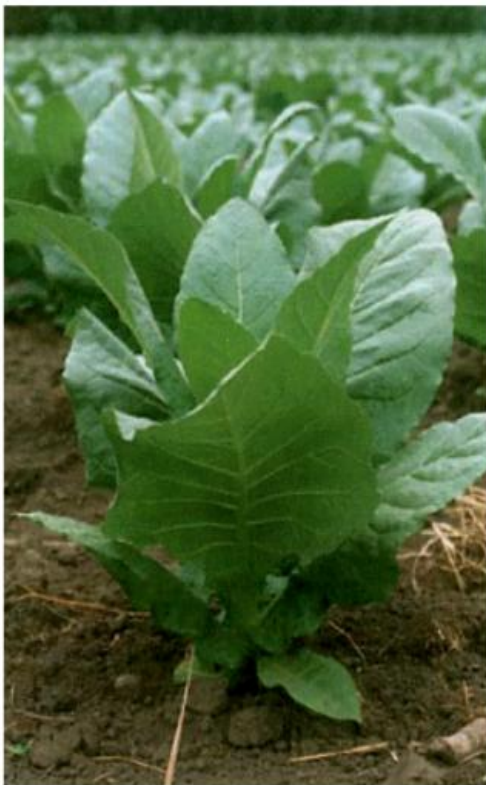
Slika 1. Duhan

U svijetu je danas poznato oko 70-ak vrsta toga roda. Duhan ( Nicotiana tabacum L.), amfidiploid nastao križanjem vrsta Nicotiana silvestris L. i Nicotiana tomentosiformis L. i mahorka ( Nicotiana rustica L.) nastala križanjem vrsta Nicotiana paniculata L. i Nicotiana undulata L. čovjek danas održava uzgajanjem. 4