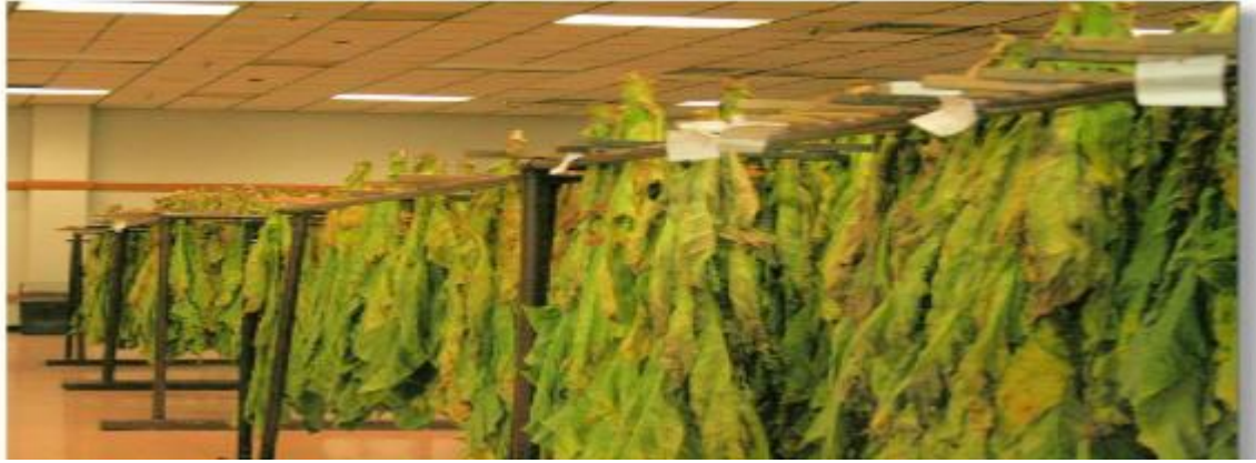
Slika 11. Sušenje burleya na stabljici

Duhan tipa burley suši se u zasjenjenim prostorima uz pomoć vanjskog zraka. Pri takvom sušenju temperature zraka ne smiju biti visoke, a relativna vlaga se regulira unutar sušnog prostora. Listovi duhana uvenu, požute, posmeđe i isušuju se. Sušenje na ovaj način traje 30 do 60 dana, ovisno o vanjskim uvjetima i osobinama lista.