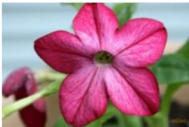
Slika 4. Cvijet duhana

Cvjetovi duhana (slika 4.) se mogu pojavljivati pojedinačno ili skupljeni u cvat (štitac). Cvijet je građen od pet međusobno sraslih lapova, pet sraslih latica, pet prašnika i tučka. Dužina cvijeta se kreće od vrlo kratkog (<20 cm) pa do izrazito dugog (>90 cm). Latice mogu biti raznolikih boja: bijele, zelenkastožute, ružičaste, tamnoružičaste, crvene, purpurno crvene i ljubičaste. Duhan je samooplodna biljka. Plod duhana je tobolac, pregrađen u dva dijela, koji kad sazrije pukne. Sjeme je sitno, okruglo i smeđe. U jednom gramu ima od 10.000 do 15.000 sjemenki, a s jedne biljke se može dobiti i do 50 grama sjemena. Masa 1.000 sjemenki iznosi od 0,07 do 0,1 gram. Sjemenke u sebi sadrže od 36 do 40 % ulja. 15