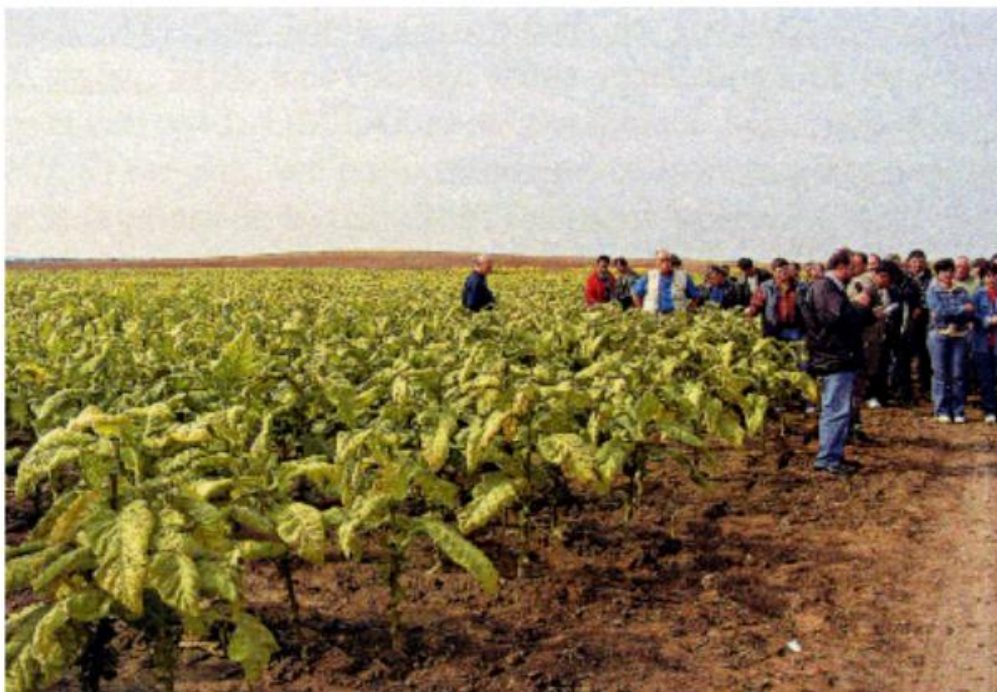
Slika 2. Polje duhana