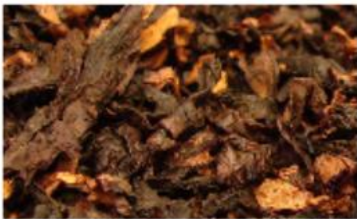
Slika 8. Fire-cured duhan

Ovakav način sušenja je dugotrajan, ali se smatra da se list bolje čuva te da poprima miris drva iznad kojeg se suši (slika 8.). Tako sušeni listovi su tamne boje, teški su, uljasti, dobre teksture i jakog mirisa. Moraju se proizvoditi na težim tlima i pri visokoj temperaturi. 18