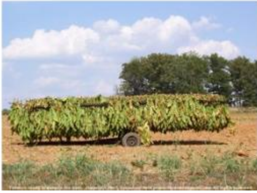
Slika 7. Sun-cured duhan

Ovaj tip duhana dijeli se na orijentalni, poluorijentalni i virginia sun-cured tip. Orijentalni duhani se proizvode na tlima bogatim kalcijem, te zahvaljujući suhoj i sunčanoj klimi i eteričnim uljima (smolama) u listu imaju jaku aromu lista. Reakcija dima je kisela do neutralna.