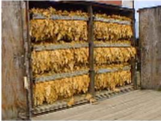
Slika 5. Flue-cured duhan

Oko 60% ukupne svjetske proizvodnje duhana otpada upravo na ovaj tip duhana, što znači da je to najrasprostranjeniji tip duhana na svijetu. Duhani tipa svijetla virginia i amarelo suše se strujanjem toplog zraka (brzo sušenje) u posebno konstruiranim sušnicama (slika 5.).