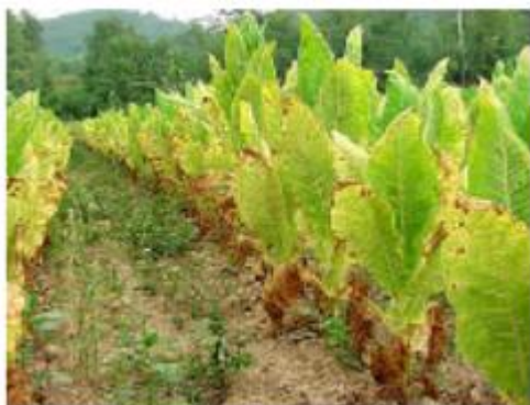
Slika 10. Burley

Danas su na Državnoj sortnoj listi Republike Hrvatske ove sorte burley duhana: Podravac, Slavonac, (Duhanski institut Zagreb) i BH 2, BH 4, i BH 9 (Hrvatski duhani).