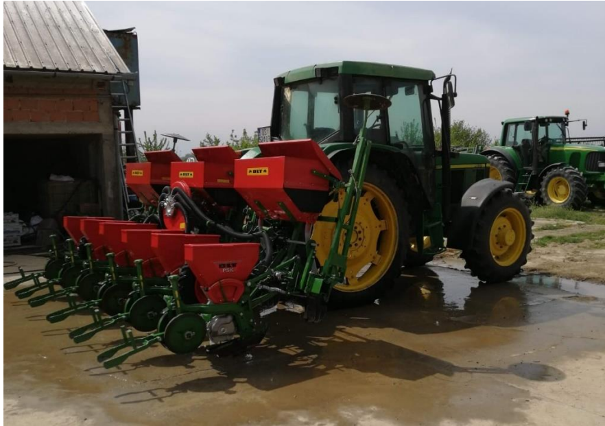
Slika 12. Pneumatska sijačica OLT PSK 6