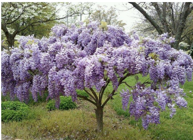
Slika 13. Stablo glicinije ( Wisteria L. )

Mahune i sjemenke se smatraju najotrovnijim dijelom biljke, ali i svi ostali dijelovi sadrže otrovne kemijske tvari kao što su lektin i wisterin. Trovanjem biljke sa samo dvije sjemenke može uzrokovati posljedice, kao što su oralno pečenje, bol u želucu, proljev i povraćanje. Gastrointestinalni simptomi mogu se pojaviti za 1,5-3,5 h. Javljaju se simptomi kao što su zbunjenost, sinkopa, vrtoglavica i slabost (Slattery, 2005.). Konzumacijom dijelova biljke dodatno je zabilježen porast broja bijelih krvnih stanica. Navedeni simptomi se općenito povuku unutar 1-2 dana. Također, prilikom paljenja iste biljke preporučuje se ne udisati dim jer su istraživanja pokazala da izlaganje dimu izgaranjem ove biljke uzrokuje glavobolje.