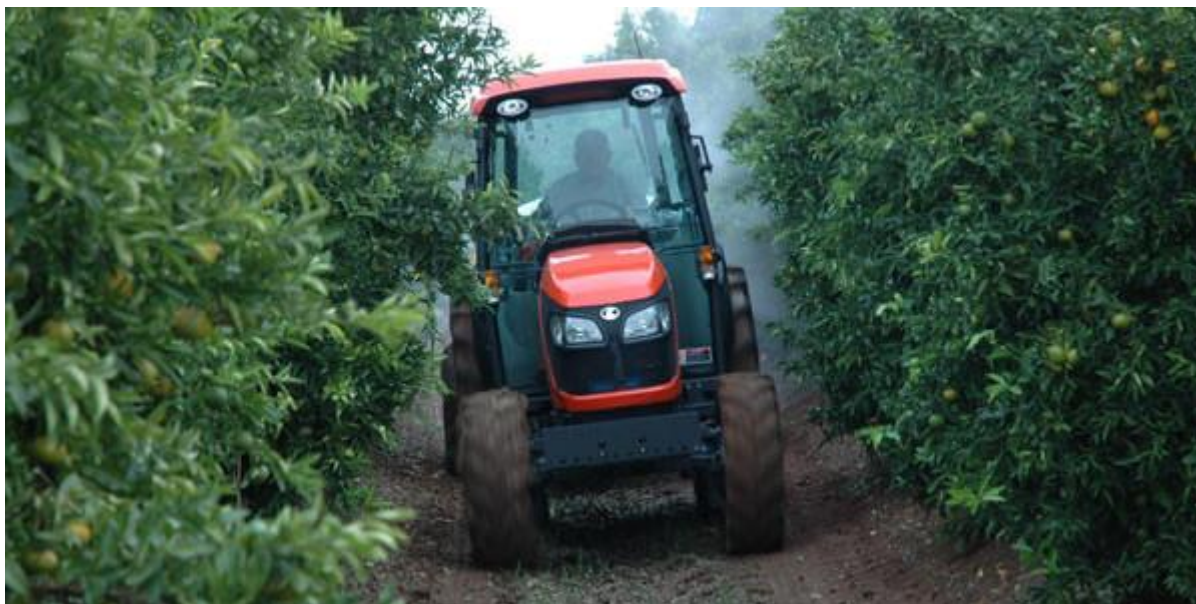
Slika 2. Primjer traktora namijenjen voćarstvu I vinogradarstvu – Kubota M serija, model Narrow