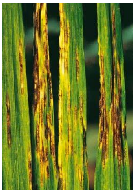
Slika 13. Mrežasta pjegavost ječma