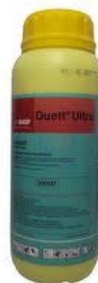
Slika 27. Duett Ultra