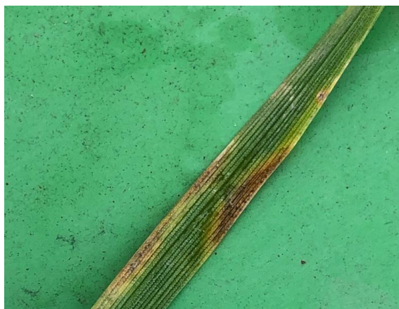
Slika 7. Smeđa pjegavost lista pšenice

Smeđa pjegavost lista ( Septoria tritici ) (Slika 7.) je bolest koja napada uglavnom plojku i rukavac lista pšenice. Ponekad se javlja i na stabljici, klasu i perikarpu zrna. Pri jakim zarazama gubitak prinosa može iznositi i do 60%. Simptomi su vidljivi u obliku malih ovalnih ili okruglih pjega na plojci lista. Zaraženi dijelovi odumiru, a ukoliko bolest zahvati vrat korijena ugiba cijela biljka. Razvoju bolesti pogoduju visoka vlažnost zraka i kiša kroz duži period. Optimalne temperature za razvoj su 20-25°C (Radan i sur., 2014.).