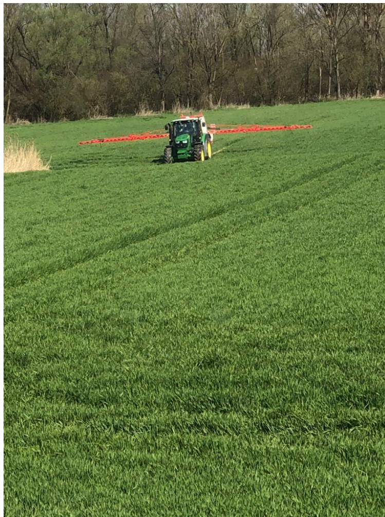
Slika 25. Tretiranje usjeva

Navedena doza primijenjena je uz utrošak okvašivača Tensiofill 0,5 l/ha. Preporučeni utrošak vode je od 200-400 l/ha, a u usjevu je primijenjeno 200 l/ha. Tretiranje je bilo učinkovito te su korovi uspješno suzbijeni i u usjevu pšenice i u usjevu ječma.