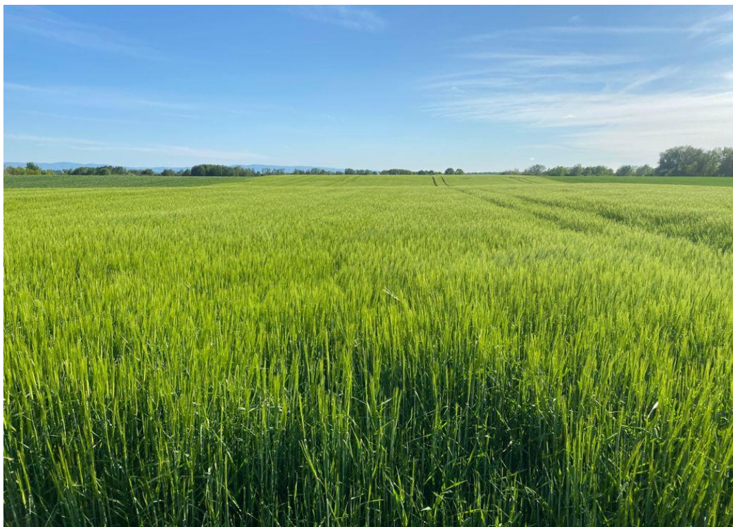
Slika 4. Ječam

Pred kraj devetog mjeseca 2019. godine nakon berbe kukuruza kao pretkulture rasipačem marke Rauch obavljena je osnovna gnojidba tla na površini 4,17 hektara namijenjenih za sjetvu ječma. Tom radnjom po tlu je primijenjeno 150 kg/ha NPK 0-20-30, zatim 150 kg/ha UREA mineralnog dušičnog gnojiva. Nakon toga obavljena je osnovna obrada tla plugovima premetnjacima marki Kuhn i Maschio. Ječam je zasijan sjetvenom kombinacijom rotosem Maschio Alitalia+Drago koja u jednom proходу obavlja predsjetvenu pripremu tla i sjetvu, te na taj način umanjuje troškove proizvodnje i sprječava nepotrebno zbijanje tla. Sorta koja je zasijana bila je Barun s Poljoprivrednog instituta u Osijeku koja ima visok potencijal rodnosti 11 t/ha (slika 4.). Nakon zime pred fazu busanja obavljena je prva prihrana usjeva ozimog ječma sa 100 kg/ha KAN-a, dušičnog mineralnog gnojiva. Drugu prihrana obavljena je s istom količinom gnojiva, 100 kg/ha, u fazi vlatanja, a pred samo klasanje. Žetva usjeva se obavila pred kraj šestog mjeseca 2020. godine vlastitim kombajnom Claas Tucano 340, a postignut je dobar i zadovoljavajući prinos.