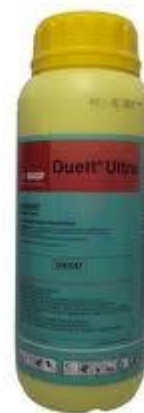
Slika 27. Duett Ultra