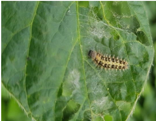
Slika 23. Stričkov šarenjak