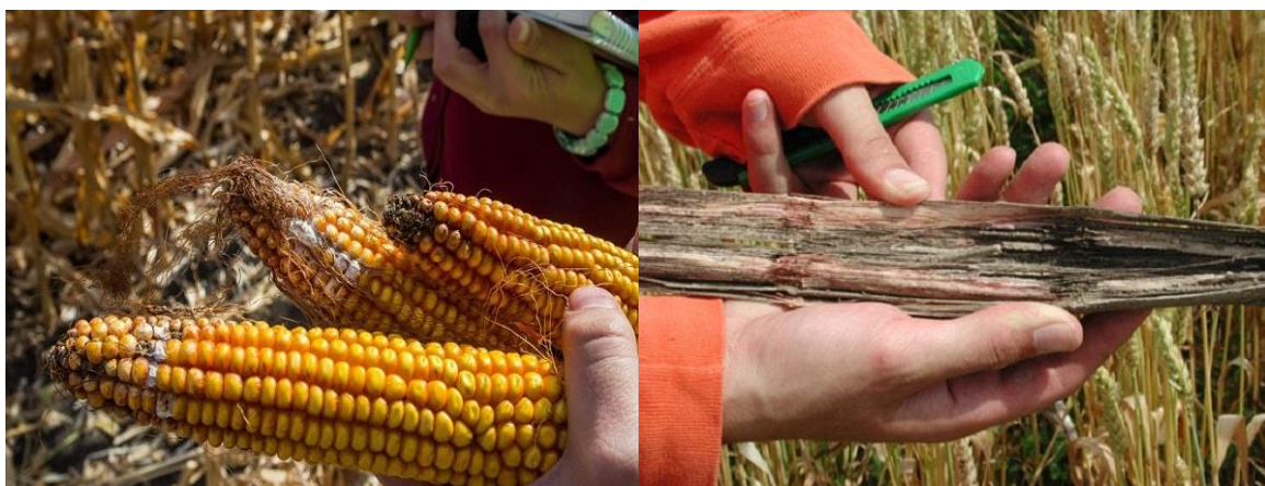
Slika 17. i 18. Štete na klipu i stabljici uzrokovane vrstama Fusarium

Glavne mjere kojima se borimo protiv ovih bolesti su odabir otpornih hibrida i plodored. Najznačajnije bolesti kukuruza su fuzarioze jer od jače zaraze dolazi do smanjenja prinosa i kvalitete zrna. Postoji više tipova bolesti: trulež korijena, stabljike i klipa, palež klijanaca. Obavezna mjera za suzbijanje fuzarioza i većine ostalih bolesti je dezinfekcija sjemena (Kovačević i Rastija, 2014.).