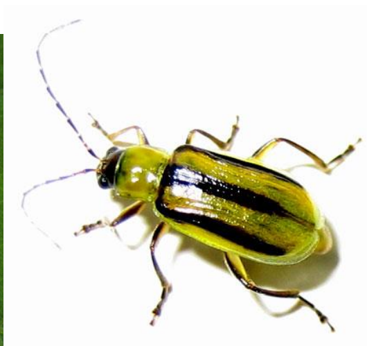
Slika 20. Kukuruzna zlatica