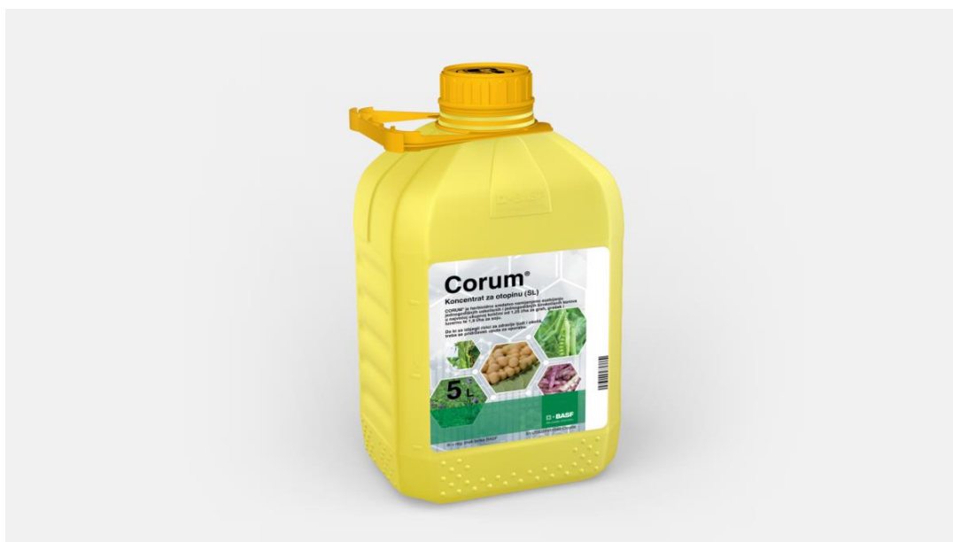
Slika 30. Corum

Uz primjenu herbicida, izvršena je jedna međuredna kultivacija usjeva soje. Korovi su stoga u usjevu soje kombinacijom herbicida i mehaničkog uklanjanja učinkovito suzbijeni.