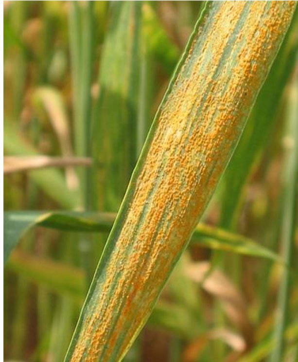
Slika 9. Žuta hrđa pšenice

Žuta ili crtičava hrđa ( Puccinia striiformis ) (Slika 9.) može se razviti na svim nadzemnim zelenim dijelovima biljke, međutim napad je najjači na plojkama lišća i pljevama klasa, a zabilježena je i zaraza perikarpa sjemena. Simptomi bolesti se primjećuju u obliku malih izduženih nakupina narančasto-žute boje koje se na odraslim biljkama spajaju u linije ili crtice po plojci u nekoliko usporednih linija. Žuta hrđa najbrže se razvija pri temperaturama zraka između 10 °C i 15 °C, a pogoduju joj česte kiše (Šubić i Pajić, 2014.).