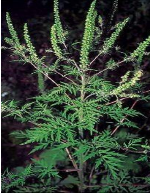
Slika 14. Ambrozija