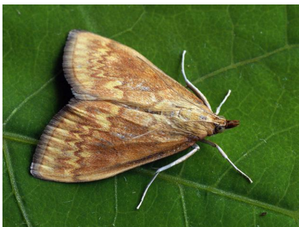
Slika 19. Kukuruzni moljac

Kukuruzna zlatica ( Diabrotica virgifera virgifera ) – vrlo je značajan štetnik čije se ličinke javljaju u svibnju i lipnju, a odrasli kukac javlja se od lipnja do rujna. Prezimljuje u tlu u stadiju jajašca. Simptom napada je stabljika u obliku „guščjeg vrata“ nakon što kukci naprave štetu izgrizanjem korijena. Za suzbijanje važan je višegodišnji plodored, odabir tolerantnih hibrida i agrotehničke mjere (Ćosić i sur., 2008.).