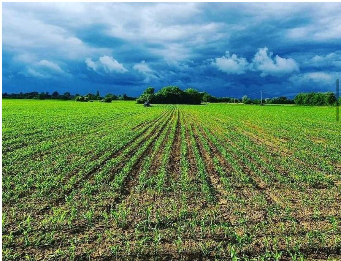
Slika 6. Kukuruz

Na površinama je posijano najviše hibrida FAO grupe 400 (slika 6.), zbog sušenja u vlastitoj sušari za žitarice kombiniraju se ove FAO grupe kako bi kukuruz bio što pravovremenije pokombajniran s odgovarajućom vlažnosti zrna što smanjuje troškove sušenja. Za žetvu se koristi vlastiti kombajn Claas Tucano 340 s kukuruznim adapterom marke Capello. Osim ovih operacija također se obavlja kultivacija u usjevu kukuruza radi mehaničkog uklanjanja korova, prorađivanja tla, razbijanja pokorice te sprječavanja evaporacije vlage iz tla, uz prihranu kroz kultivator u količini od 300 kg/ha KAN-a. Koristi se kultivator marke Monosem (6 redi).