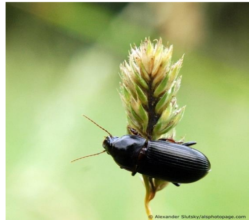
Slika 10. Žitni balac (www.wikimedia.com) Slika 11. Žitarac crni (www.ukrbn.com)