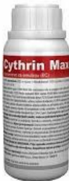
Slika 29. Cythrin Max

U usjevu pšenice i ječma primijenjena je količina od 1 l/ha uz utrošak vode 200 l/ha, a uz to je primijenjen i okvašivač Tensiofill u količini 0,5 l/ha. Tretiranje je bilo učinkovito, a usjevi zaštićeni od biljnih bolesti.