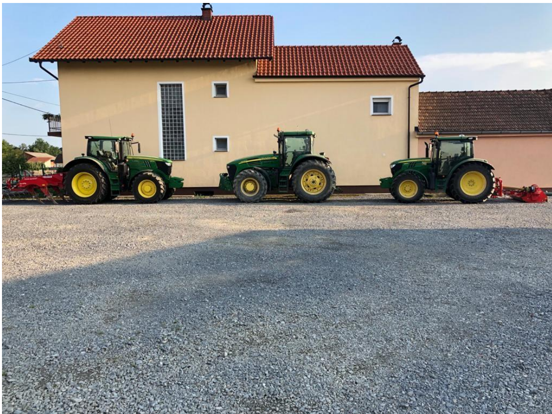
Slika 1. Traktori

Obiteljsko poljoprivredno gospodarstvo posjeduje vlastitu sušaru za sušenje žitarica, a također gospodarstvo ima vlastito podno skladište koje omogućuje skladištenje vlastitih žitarica te njihov plasman na tržište u trenutku povoljnijih tržišnih cijena.