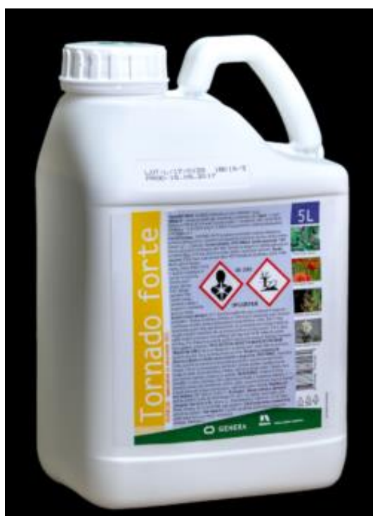
Slika 26. Tornado Forte

Drugi tretman protiv biljnih bolesti izvršen je fungicidom Elatus Era (Slika 28.) u vlatanju pred fazu klasanja u svrhu zaštite lista i klasa. Elatus Era sistemski je fungicid koji se koristi u usjevima pšenice, ječma, zobi, raži i pšenoraži za suzbijanje brojnih biljnih bolesti. Aktivne tvari kod ovog sredstva su protiokonazol i benzovindiflupir. Primjenjuje se u količini od 0,5 – 1 l/ha uz utrošak vode od 100 – 400 l/ha ( https://www.syngenta.hr/product/crop-protection/elatus-era ).