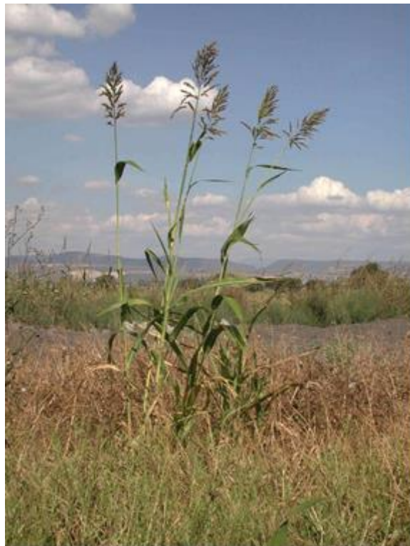
Slika 16. Divlji sirak ( Sorghum halepense )