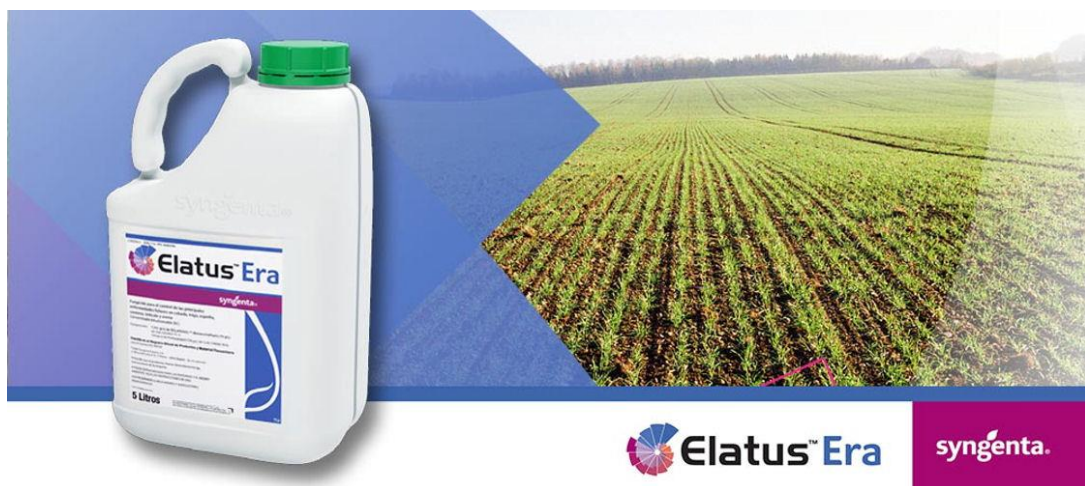
Slika 28. Elatus Era

U usjevu pšenice i ječma primijenjena je količina od 1 l/ha uz utrošak vode 200 l/ha, a uz to je primijenjen i okvašivač Tensiofill u količini 0,5 l/ha. Tretiranje je bilo učinkovito, a usjevi zaštićeni od biljnih bolesti.