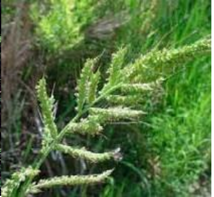
Slika 15. Koštan