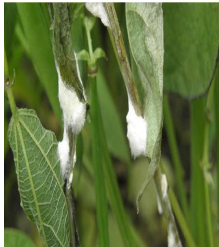
Slika 22. Bijela trulež