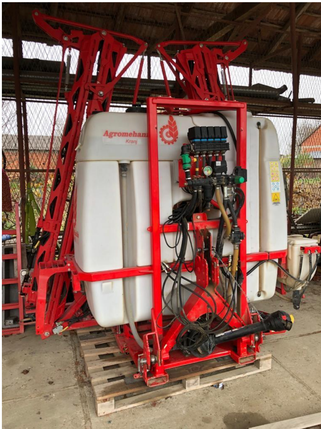
Slika 3. Traktorska prskalica Agromehanika 1200 l