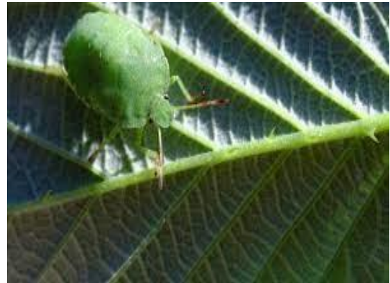
Slika 24. Stjenica