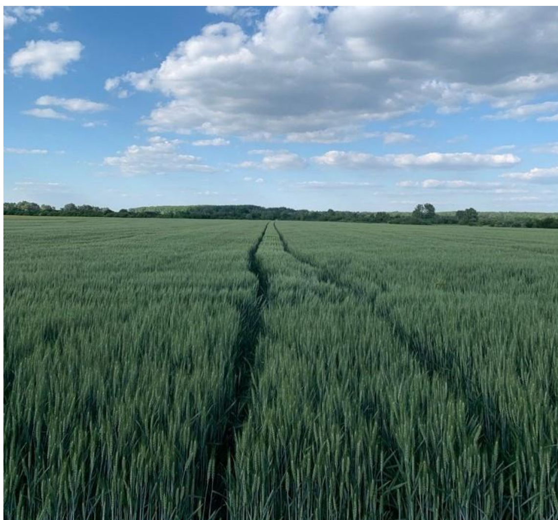
Slika 5. Pšenica

Agrotehnika proizvodnje kod ozime pšenice ne razlikuje se bitno od iste kod ozimog ječma. Nakon berbe kukuruza kao pretkulture na površini od 53 hektara započeto je s pripremom tla za sjetvu ozime pšenice. Prva operacija koja je izvršena bila je osnovna gnojidba tla. U osnovnoj gnojidbi primijenjeno je po tlu 150 kg/ha NPK 0-20-30, zatim 150 kg/ha UREA-e, mineralnog dušičnog gnojiva. Zatim je obavljena osnovna obrada tla plugovima premetnjacima, te je u jednom proходу obavljena predsjetvena priprema tla i sjetva pomoću rotosem sjetvene kombinacije. Na ukupnoj površini od 53 hektara zemlje zasijana je ozima pšenica i to više različitih sorti (slika 5.).