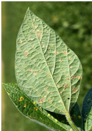
Slika 21. Plamenjača soje

Od bakterijskih oboljenja biljaka kod nas je najviše prisutna bakterijska plamenjača ( Pseudomonas syringae pv. glycinea Coerper), a od virusnih oboljenja soje prisutan je virus mozaika (SMV) (Vratarić i Sudarić, 2009.).