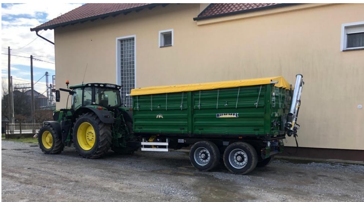
Slika 2. John Deere 6175R i Prikolica Hummel 14t

te kombajn Claas Tucano 340 s adapterom za kukuruz (Capello), te žitnim adapterom.