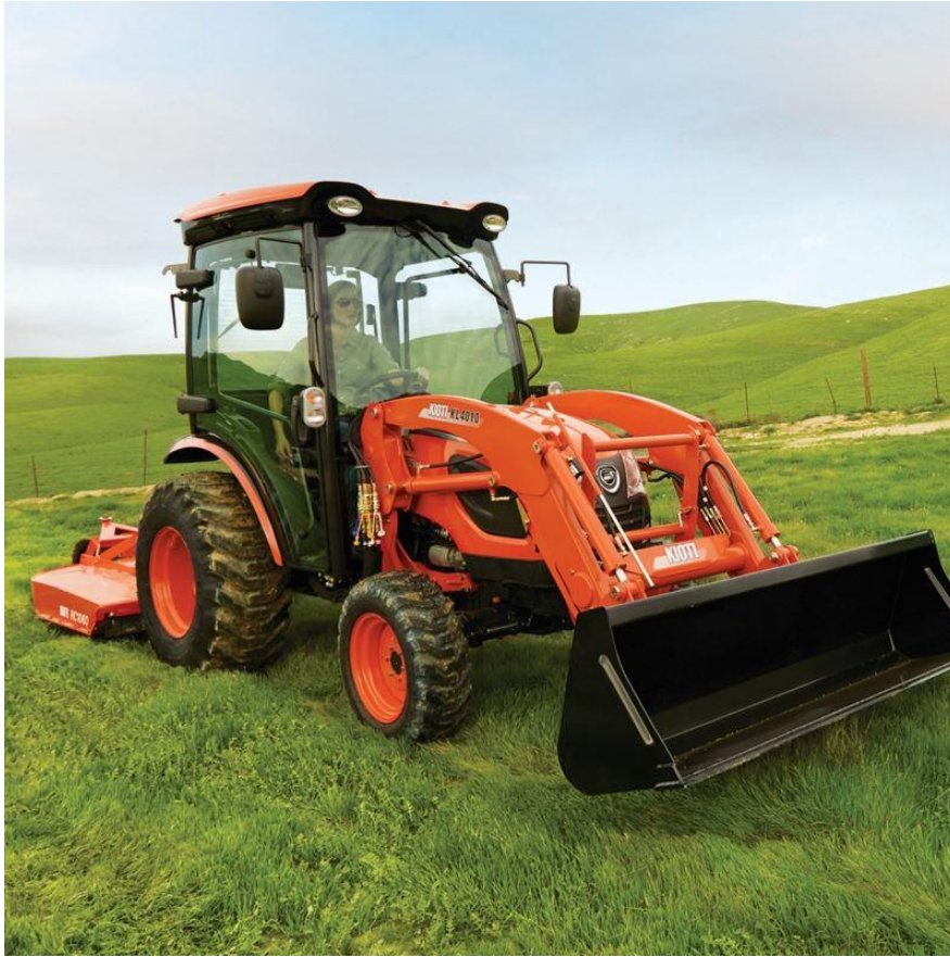
Slika 1. Traktor Kioti CK4020C-EU