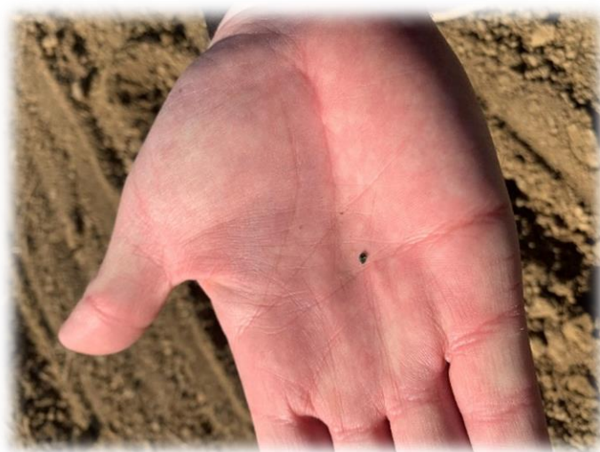
Slika 14. Prikaz veličine sjemena

Slika 14. prikazuje koliko je sjeme sitno i malo u odnosu na ljudski dlan. Po jedinici površine za sjetvu potrebno je 250.000 zrna. Cijena sjemena za 1 ha uz popust od 10% iznosi 12.000 kn. Sjetva se obavlja brzinom od 3,5–4 km/h. Sa sjetvom se odmah dodavao zemljišni insekticid FORCE 1.5 G (Slika 15.) u količini od 10 kg/ha.