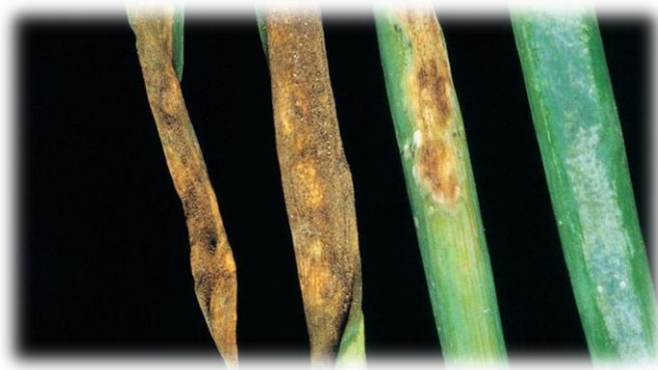
Slika 1. Simptomi plamenjače na listovima crvenog luka

Pojavi bolesti pogoduje hladno i vlažno vrijeme. Optimalna temperatura za klijanje konidija je 11 °C. Tijekom travnja i početkom svibnja uočavaju se prvi simptomi zaraze. Iz zaraženih lukovica razvijaju se sistemično zaražene biljke koje su patuljastog rasta. Listovi su zavnuti i svjetlije boje. Nakon nekog vremena na listovima se može uočiti sivo ljubičasta prevlaka (Slika 1.) koja potječe od sporonosnih organa. U zadnjoj fazi patogeneze listovi klonu, smežuraju se i osuše.