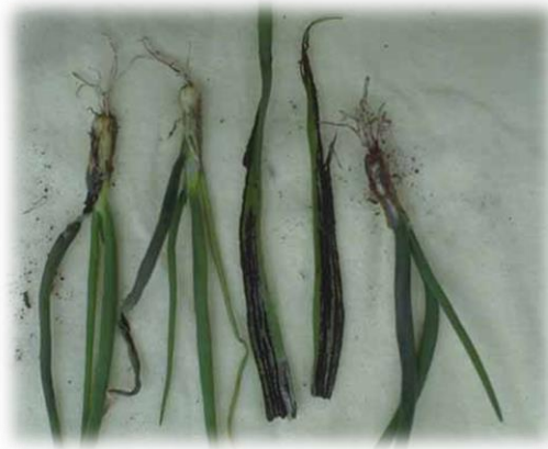
Slika 6. Simptomi snijeti na listovima i lukovicama luka

Snijet se javlja na mladim biljkama u prvoj godini njihova razvitka iz sjemena. Zarazom može biti zahvaćen cijeli list, a zaraza može prijeći unutar ljusaka lukovica (Slika 6.). Ako je zaraza jaka dolazi do lomljena listova i njihovog savijanja prema tlu. Na zaraženim dijelovima su uočljivi srebrnkasti, a kasnije crni mjehurići koji pucaju, te iz njih izlaze tamnosmeđe spore. Zaražene lučice su smežurane, sitne i tamnosive.