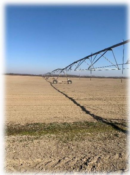
Slika 16. Linear sustav navodnjavanja na Čeretincima

Njega usjeva tijekom vegetacije sastoji se od suzbijanja korova, navodnjavanja, prihrane i zaštite od bolesti i štetnika. S obzirom na to da luk u početnoj fazi sporije raste izložen je konkurenciji brzorastućih korova, stoga smo odmah krenuli s primjenom herbicida Stomp Aqua u količini 3 l/ha. Nakon same sjetve potrebno je navodnjavanje zbog velikih potreba luka prema vodi. Potrebne biljke za vodom ovise o fazi u kojoj se biljka nalazi, ali i o temperaturi zraka. Na PIK Vinkovci koriste se dvije vrste navodnjavanja, a to su linear (Slika 16.) i mikrorasprskivač (Slika 17.).