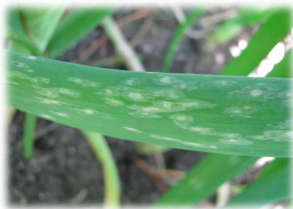
Slika 3. Simptomi Botrytis squamosa na listovima luka

Botrytis squamosa prezimljuje kao sklerocij. Kasnije će se iz sklerocija razviti konidije koje se prenose zrakom. Razvoju zaraze pogoduje visoka vlažnost. Povoljni uvjeti dopuštaju pojavu sekundarne zaraze u kojoj se stvaraju velike količine konidija i tako se nastavlja zaraza.