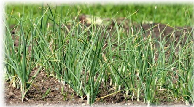
Slika 4. Pojava prvih simptoma žućenja listova luka

mladih biljaka, one vrlo brzo propadaju. Vanjski mesnati listovi lukovica postaju voštani, vodenasti, prekriveni snježnobijelim pahuljastim micelijima u kojem se stvaraju crni sklerociji.