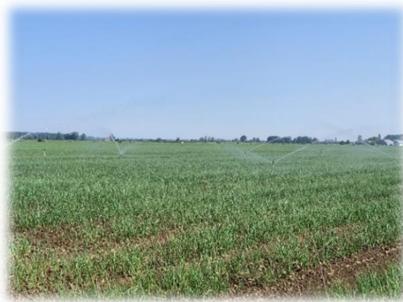
Slika 17. Mikrorasprskivači na Sopotu

U početnoj fazi daju se manje količine vode kako bi navodnjavanje bilo jednako na svim dijelovima površine. Ovim načinom navodnjavanja postiže se ravnomjerno nicanje usjeva. Mali obroci navodnjavanja u nicanju važni su kako ne bi došlo do stvaranja pokorice. Nakon nicanja kada se uspostavi konačan sklop navodnjavanje se prorijedilo, ali se povećala količina obroka. Luk najveću potrebu za navodnjavanjem ima u fazi razvoja lisne mase, u početku formiranja lukovice, te u fazi nalijevanja glavica. U tim periodima obroci se maksimalno povećavaju te se kontinuirano prati vlažnost tla. S navodnjavanjem luka prestat će se desetak dana prije vađenja luka kako bi došlo do njegovog pravilnog dozrijevanja.