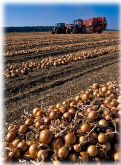
Slika 9. Prikaz utovara s kombajnima (foto: Tomislav Matančević, 2021.)