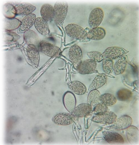
Slika 2. Mikroskopski prikaz konidija P. destructor

Nakon propadanja zaraženih organa, u njima dolazi do formiranja oospora. Poslije razdoblja mirovanja iz oospora se razvija micelij koji je odgovaran za infekcije. Plamenjača se najčešće prenosi zaraženim lučicama. Micelij se iz lučica proširi na mlade cjevaste listove na kojim nastaju sponosni organi. Konidiofori izlaze iz puči u skupinama, a na njima se nalaze konidije (Slika 2.). Konidije klijaju u kličnu cijev, te tako ulaze u biljno tkivo i šire se među stanicama. Do zaraze dolazi pri temperaturama od 3,5 °C do 25 °C, uz uvjet da je relativna vlaga zraka između 80% i 95%.