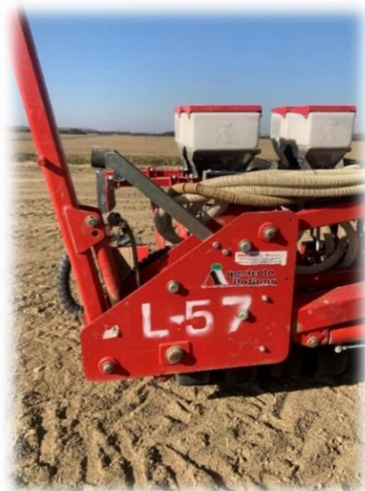
Slika 11. Sijačica AGRICOLA korištena u sjetvi luka

Sije se plitko na dubini od 2 cm u gredice širine 1,75 m. Na svakoj gredici se nalazi pet puta po dva reda (Slika 12.). Razmak unutar reda iznosi 6,2 cm.