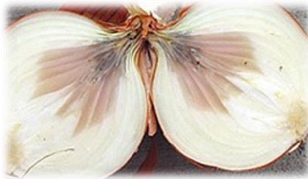
Slika 7. Prikaz truleži glavnice luka (slika Tomislav Matančević, 2021.)

Kako bi se postigao željeni prinos i kakvoća potrebna je i zaštita protiv bolesti. Za zaštitu su se koristili fungicidi sa širokim spektrom djelovanja. Zbog kontinuiranog provođenja navodnjavanja pojava bolesti je neizbježna. Najčešće se pojavljuje plamenjača, stoga se sa zaštitom kretalo preventivno, odnosno prije same pojave simptoma. Prvo tretiranje se obavilo kad je luk došao u fazu 2-4 lista. Nakon obavljenog prvog tretiranja, tretman se ponavljao svakih sedam dana. Tretiranje se provodilo jednom tjedno s obzirom na to da je navodnjavanje bilo konstantno. Tretmani zaštite vršili su se i protiv sive plijesni i hrđe. Osim što se bolesti javljaju tijekom proizvodnje njihova pojava je učestala i u skladištu. Posljednjih godina tijekom skladištenja pojavljuje se čađavost pokožice i trulež luka (Slika 7.).