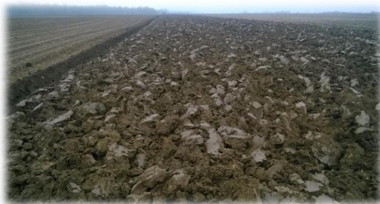
Slika 10. Jesensko oranje

Prije nego što nastupe nepovoljni uvjeti vrši se zatvaranje zimske brazde s tanjuračom. Predsjetvena priprema tla obavlja se tijekom trećeg mjeseca kada su uvjeti dozvoljavali. Prvi prohod pripreme obavlja se težim oblikom Germinator sjetvospremača s ciljem poravnanja mikrodepresija i usitnjavanjem strukture tla. Drugi prohod se obavlja s lakšim oblikom Germinator sjetvospremača za postizanje fine strukture. U proljeće se prije same sjetve vrši gnojidba sa 150 kg/ha MAP-a.