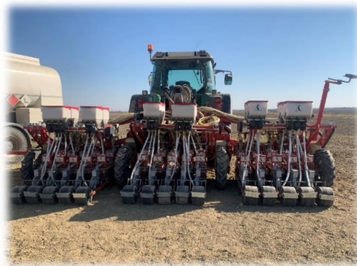
Slika 12. Prikaz gredica na sijačici

Sije se plitko na dubini od 2 cm u gredice širine 1,75 m. Na svakoj gredici se nalazi pet puta po dva reda (Slika 12.). Razmak unutar reda iznosi 6,2 cm.