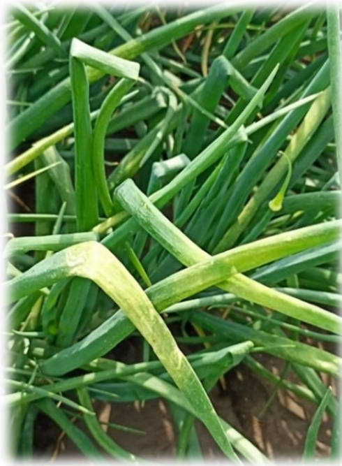
Slika 18. Pojava prvih simptoma plamenjače na listu

uočena je pojava plamenjače (Slika 18.) te se odradila druga fungicidna zaštita s preparatom Infinito, kojemu su dodana folijarna gnojiva i aminokiseline. Također su obavljene i dvije dušične prihrane s 200 kg/ha KAN-a, odnosno dodano je 108 kg čistog dušika po hektaru.