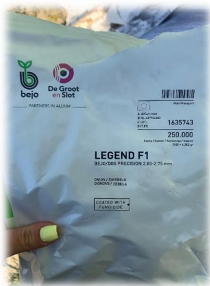
Slika 13. Pakiranje sjemena korištenog u sjetvi