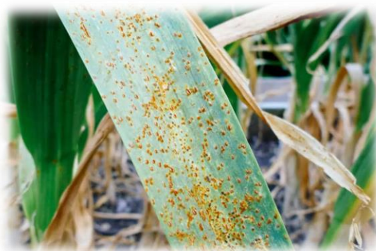
Slika 5. Simptomi hrđe na listovima luka

Simptomi bolesti javljaju se i manifestiraju na listovima (Slika 5.) i cvjetnoj stapci. Na listovima se mogu uočiti žutosmeđi, okruglasti ili izduženi uredosorusi, koji dugo ostaju prekriveni epidermom. Kod jakih zaraza lišće se suši, ali lukovice su manje.