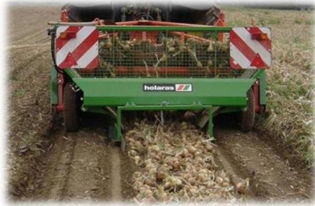
Slika 8. Vadicica Holaras (foto: Tomislav Matančević, 2021.)

Kada istekne karenca regulatora rasta, a lisna masa još uvijek zelena, kreće se s vađenjem luka. Prvo se radi tarupiranje lisne mase tarupima Holaras na visinu od oko 10 cm od glavice luka. Nakon tarupiranja uslijedilo je vađenje luka vadicom Holaras (Slika 8.) u trake na površine gredice.