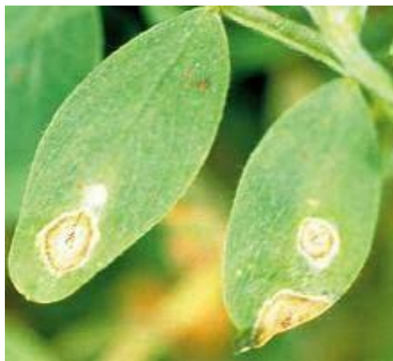
Slika 11. Plamenjača

Plamenjaču (Slika 11.) leće uzrokuje gljivica Ascochyta lentis . Prenosi se zaraženim sjemenom ili ostacima zaraženih usjeva, a napada lišće, stabljiku, mahune i sjeme. Na zaraženim mjestima nalaze se lezije s piknidijima koja su u početku svijetlo sive boje, a s vremenom postaju tamnije. Bolest se kemijski suzbija pomoću fungicida (Etherton i sur., 2017.).