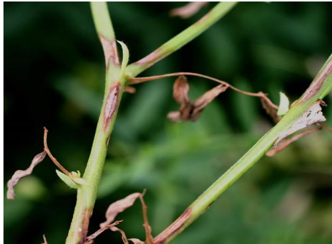
Slika 10. Antraknoza

smeđih nekrotičnih pjega, a mahune imaju smeđa udubljenja. Nakon što se uoči zaraza, bolest treba suzbiti pomoću fungicida (Etherton i sur., 2017.).