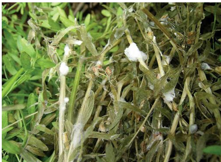
Slika 13. Bijela trulež