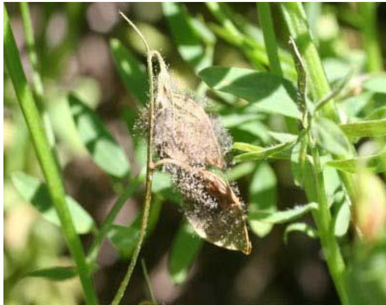
Slika 12. Siva plijesan

Sivu plijesan (Slika 12.) uzrokuje gljivica Botrytis cinerea , a zaraženi dijelovi biljke prekriveni su pahuljastom sivom plijesni. Povećana vlaga tijekom napada gljivice pospješuje njezino širenje, što može dovesti do gubitka cijelog usjeva (Etherton i sur. 2017.).