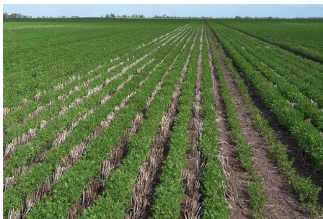
Slika 8. Uzgoj leće na strništu od žitarica

bilo smanjeno i to posebno prije cvatnje, što je rezultiralo znatnim porastom prinosa. Osim toga, kako se povećavala visina strništa, tako se povećavala i visina najnižih mahuna, što je olakšavalo žetvu i smanjilo gubitke prinosa ( https://lokвина.hr/ekoloska-poljoprivreda/hrvatska/plodored ).