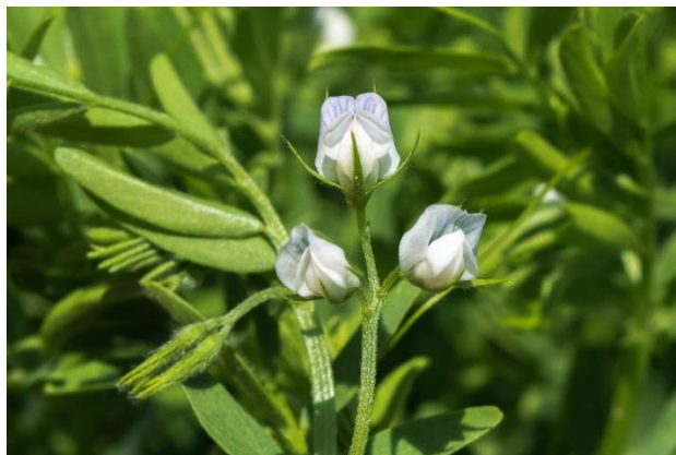
Slika 1. Cvijet leće

Leća je jednogodišnja biljka koja pripada iz porodice Fabaceae – mahunarki. Korijen leće je tanak, slabo razgranat i prodire plitko u tlo, ali unatoč tome dobro usvaja hraniva iz tla. Na korijenu se nalaze kvržične bakterije pomoću kojih fiksira dušik iz zraka, odnosno zadovoljava svoju potrebu za dušikom koji je potreban za rast i razvoj. Stabljika je zeljasta, obrasla dlačicama, često može biti polegnuta, a završava vegetativnim vrhom i može narasti 15 do 70 cm. Listovi leće su naizmjenično parno perasti, sadrže 4 do 7 pari liski koje su ovalne i na kratkim peteljka. Zelene su boje i završavaju s jednostavnim ili razgranatim viticama. U pazušcima listova s gornje strane, pojedinačno ili 2 do 4 na pojedinom koljencu, na dugim stapkama rastu cvjetovi (Slika 1.) koji su lijepog izgleda, ali su mali i jedva uočljivi. Sastoje se od 5 sraslih lapova, 5 latica, 10 prašnika od kojih je 9 sraslo u jednu cijev, a jedan prašnik je slobodan, te jednog tučka koji ima nadraslu plodnicu. Kao i kod drugih mahunarki, cvijet leće ima leptirast oblik. Jedna latica je najveća i naziva se zastavica, bočno od zastavice s boje strane nalaze se dvije manje latice odnosno krila, a dolje se nalaze dvije srasle latice koje su u obliku lađice. Latice su bijele, ružičaste ili ljubičaste boje (Lešić i sur., 2002.).