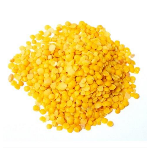
Slika 6. Žuta leća