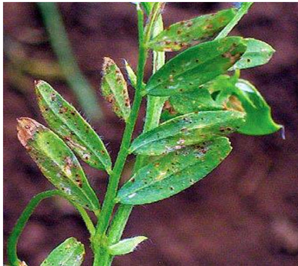
Slika 9. Hrđa

Hrđa (Slika 9.) je bolest koju uzrokuje gljivica Uromycesviciae . Simptomi se očituju na stabljici, mahunama i listovima posebice s donje strane gdje nastaju nakupine spora koje su tamne boje. Kako bi se bolest suzbila, sa zaražene biljke se trebaju ukloniti svi bolesni listovi te se biljka tretira s fungicidom (Eherton i sur., 2017.).