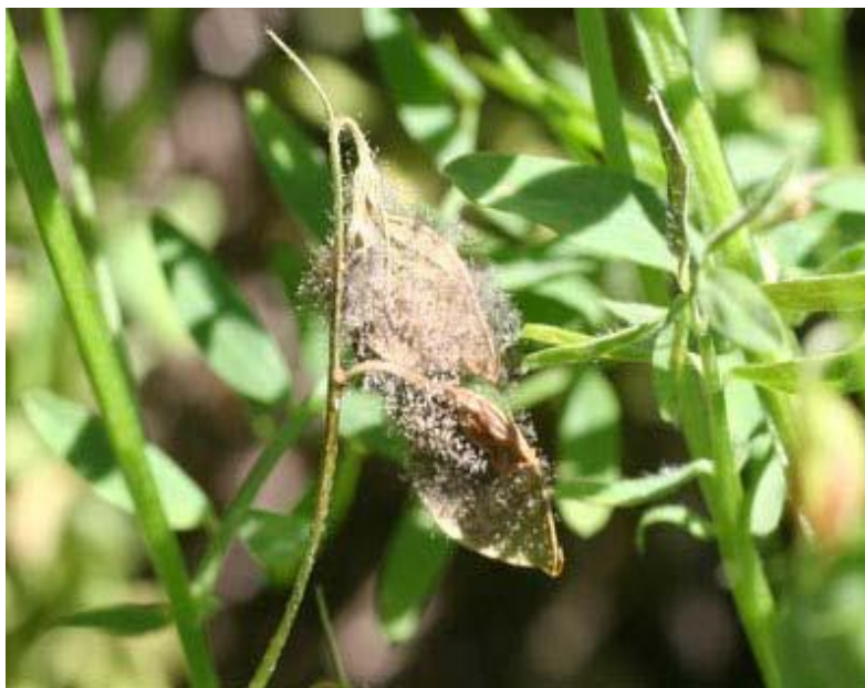
Slika 12. Siva plijesan

Sivu plijesan (Slika 12.) uzrokuje gljivica Botrytis cinerea , a zaraženi dijelovi biljke prekriveni su pahuljastom sivom plijesni. Povećana vlaga tijekom napada gljivice pospješuje njezino širenje, što može dovesti do gubitka cijelog usjeva (Etherton i sur. 2017.).