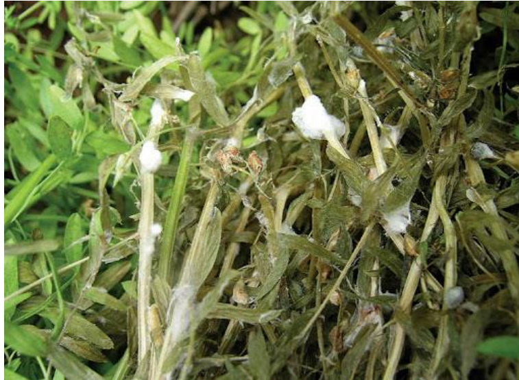
Slika 13. Bijela trulež