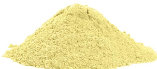
Slika 15. Brašno od leće

Leća je zbog svojih nutritivnih vrijednosti odličan dodatak prehrani. Vrlo je zdrava namirnica i može se koristiti u pripremi različitih jela, te je odlična zamjena za meso. Od leće mogu se napraviti ukusne salate, variva, tjestenine, namazi i nadjevi. Prije same pripreme, leću je potrebno namakati u vodi kako bi se smanjilo vrijeme kuhanja, a namakanje ovisi o vrsti leće, to jest imali li tvrdu ili mekanu opnu. Smeđa, zelena i crna leća imaju tvrdu opnu te se trebaju namakati 5 do 7 sati u hladnoj vodi, dok se crvena i žuta ne trebaju jer imaju mekanu opnu. Također, vrijeme kuhanja ovisi o vrsti leće, pa se tako sitnija leća kuha oko 10 minuta, a krupnija najmanje 45 minuta. Za razliku od drugih mahunarki, kuhana leća zadržava svu svoju hranjivu vrijednost jer nema gubitaka hranjivih tvari tokom kuhanja. Osim toga, od leće se proizvodi brašno (Slika 15.) koje je bogato hranjivim tvarima, a koristi se za pripremu kruha, tortilja i peciva ( https://www.krenizdravo.hr/prehrana/ ).