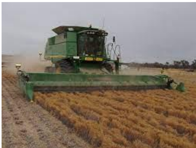
Slika 14. Žetva leće