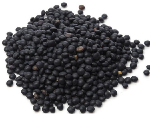
Slika 3. Crna leća

Crna leća (Slika 3.) - bogata je proteinima i željezom, mineralima i vlaknima te vitaminom B. Ima blag okus i debelu opnu. Zbog debele opne, prije pripreme potrebno ju je namakati u vodi ( https://www.krenizdravo.hr/ ).