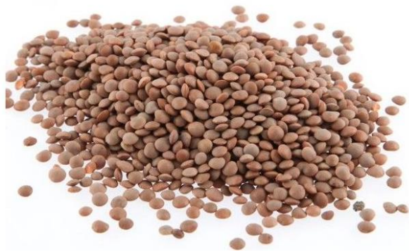
Slika 4. Smeđa leća

Smeđa leća (Slika 4.) - najpoznatija je vrsta i ima blag zemljani okus. Može biti u nijansama od svijetlo smeđe do tamno smeđe boje. Također ima debelu opnu, pa ju je potrebno prije pripreme namakati u vodi ( https://www.krenizdravo.hr/ ).