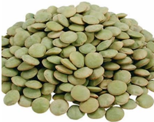
Slika 7. Zelena leća

Zelena leća (Slika 7.) – sadrži bjelančevine, može biti zelenkasto-smeđe boje, ljutkastog je okusa i ima tvrdi sjajnu opnu ( https://www.krenizdravo.hr/ ).