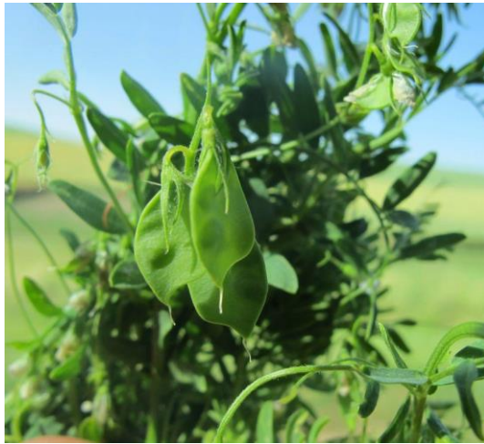
Slika 2. Mahune leće

mahune nalaze se 1 do 2 sjemenke. Sjeme leće je plosnato, okruglog oblika, a može biti crvene, žute, zelene, smeđe ili crne boje (Gagro, 1997; Lešić i sur., 2002.).