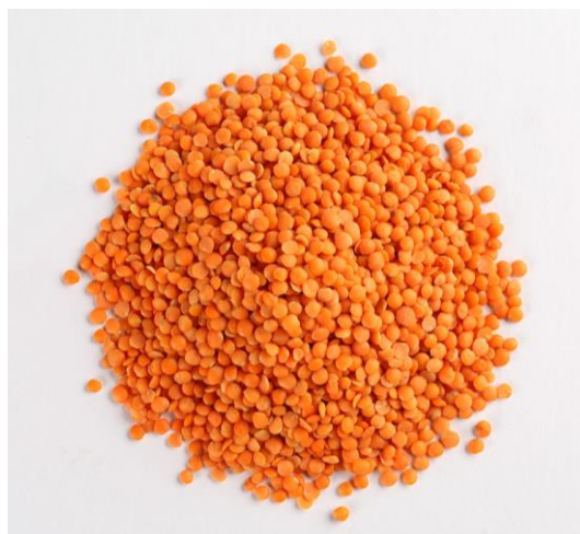
Slika 5. Crvena leća

Crvena leća (Slika 5.) – može biti u nijansama od narančaste do crvene boje. Bogata je vlaknima i proteinima, te ima sladak okus i mekanu opnu za razliku od ostalih vrsta leće ( https://www.krenizdravo.hr/ ).