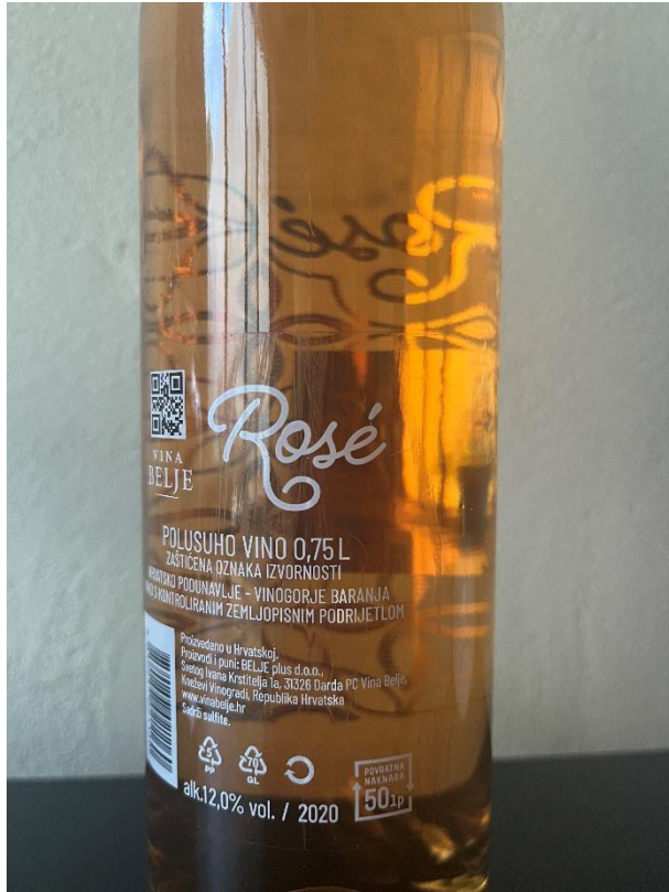
Slika 1. Vino sa ZOI Belje Rose