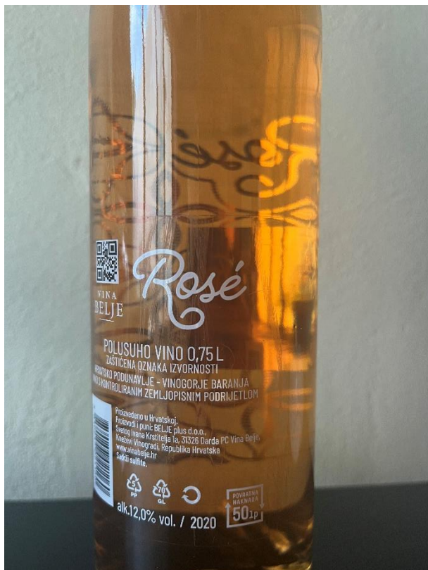
Slika 1. Vino sa ZOI Belje Rose