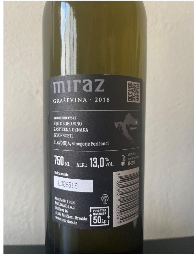
Slika 2. Vino sa ZOI Feravino Graševina