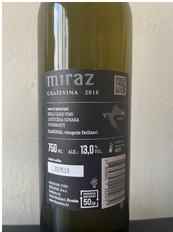
Slika 2. Vino sa ZOI Feravino Graševina